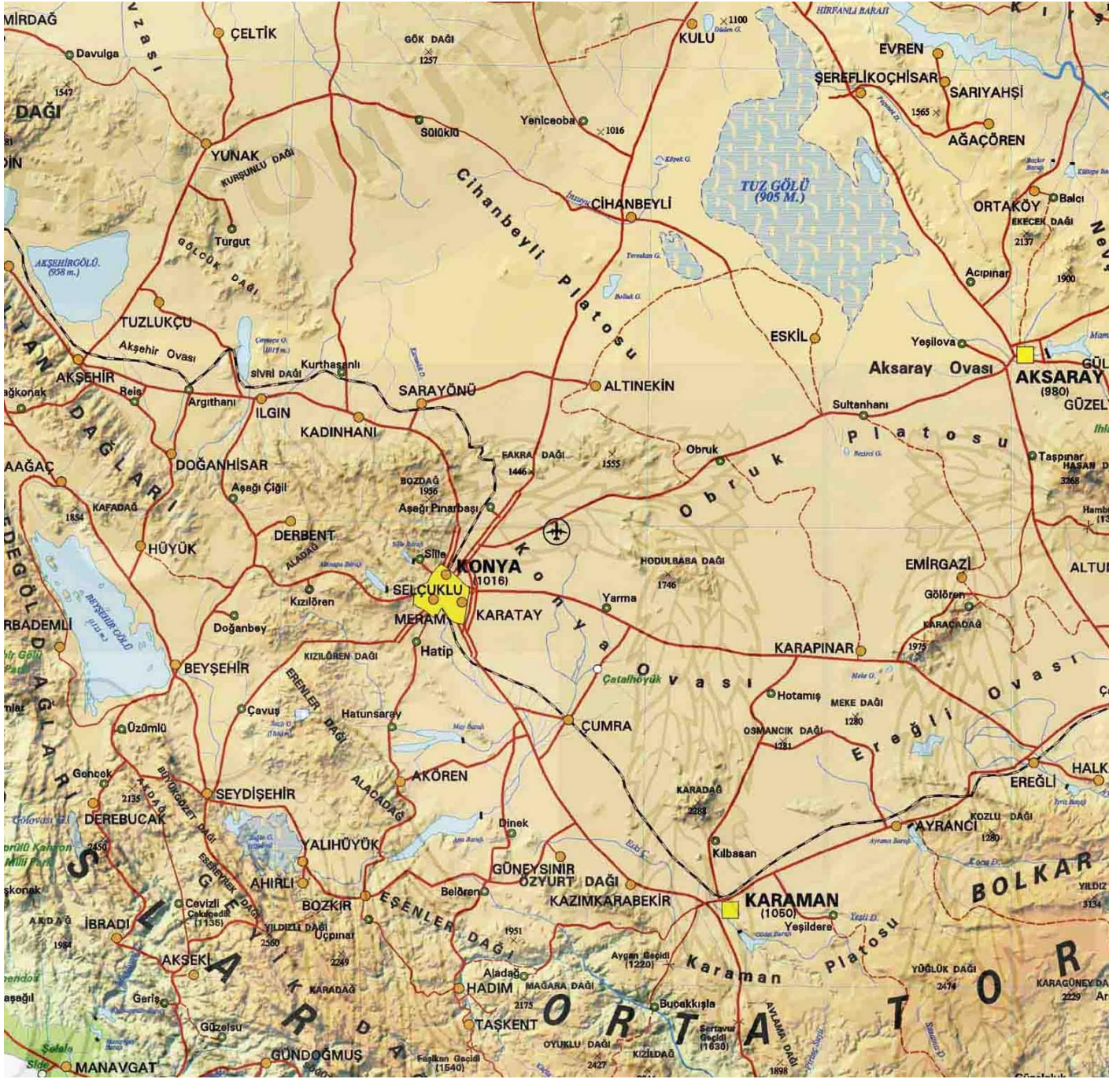
Figür 1: Lykaonia Bölgesinin Coğrafi Haritası.