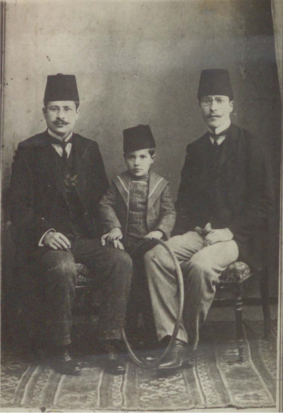
No: 11561750.