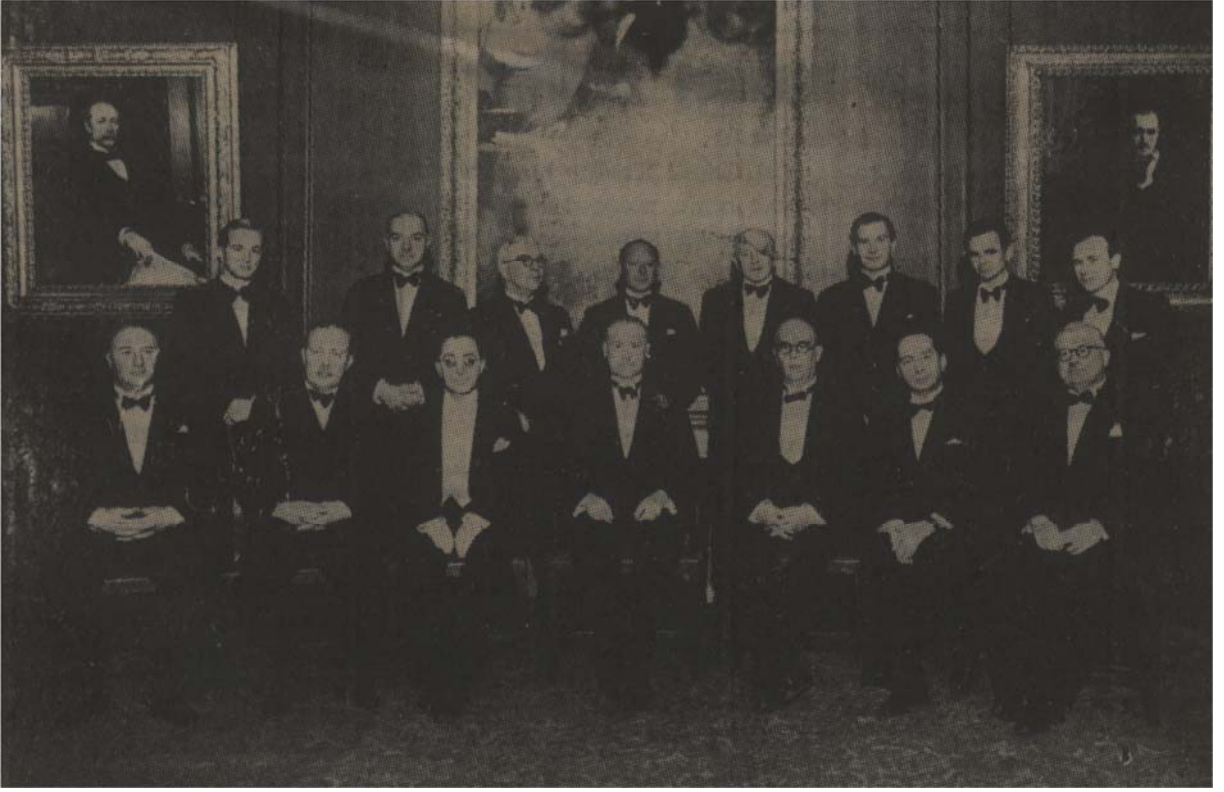
Vakit, 14 Haziran 1939, s.1.