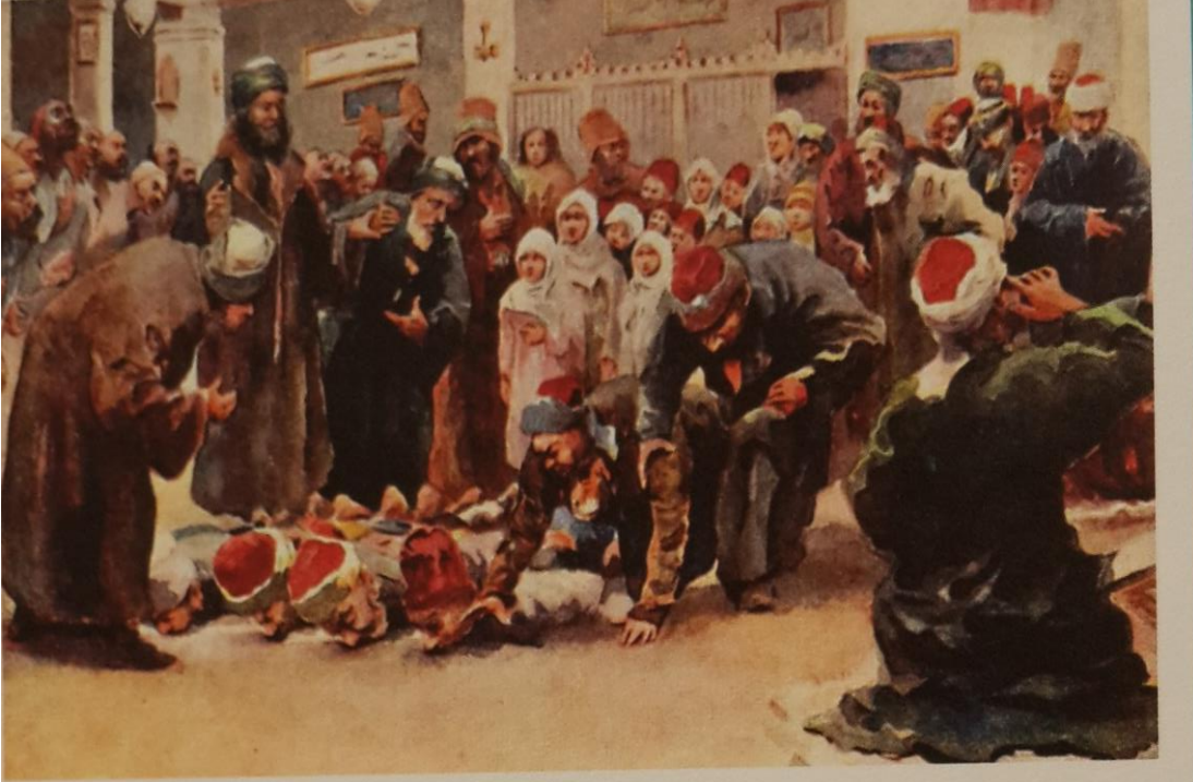
7- Devsiye Âyini

Sa'dî dervişleri, tarikatın merkezi olan Şam'da, Emeviye Camii'nde Cuma namazından sonra ayin yaparlardı. İstanbul'da Ayasofya Camii'nde ise özellikle Kadir geceleri Sa'dî ayini yapılırdı. Ayasofya Camii'ndeki büyük levhalardan Hz. Ali'nin adının yazılı olduğu levhanın altındaki yer Sa'dî tekkesi mensuplarına aitti.