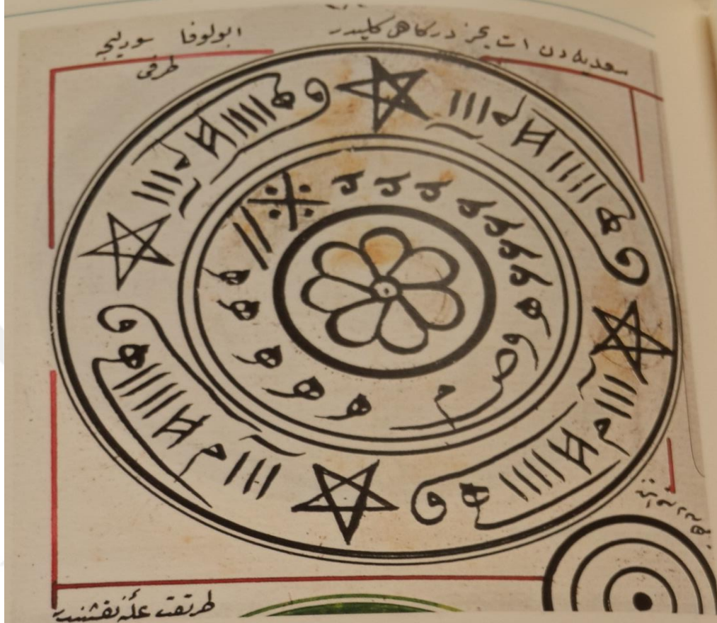
57- Sadiye Etyemez Dergâhı gülü (Mecmûa)