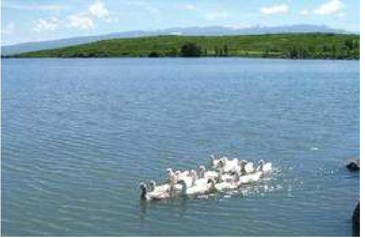
115 km2 alanı olan ıldır Gölü EK:9