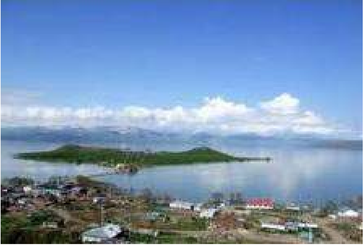
Çıldır İlçesinin Genel Görünümü EK:7