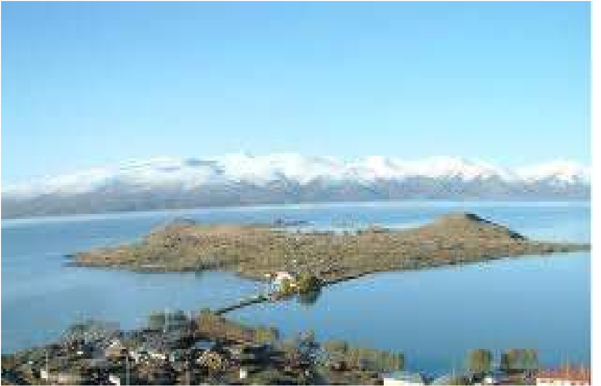
ıldır ile merkezinin yaklaşık 27 km. gÜneydoğusunda yer alan Akçakale EK:10