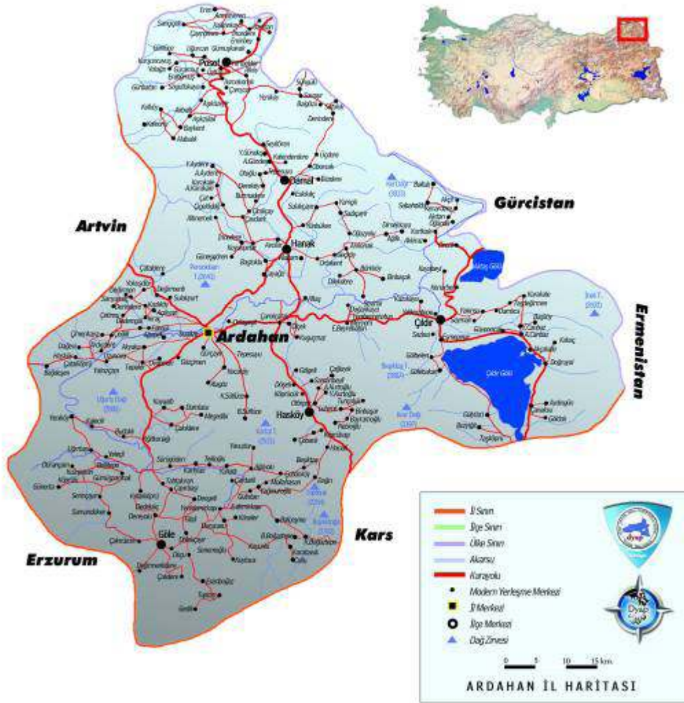
Harita-1 Ardahan İl Haritası EK:5