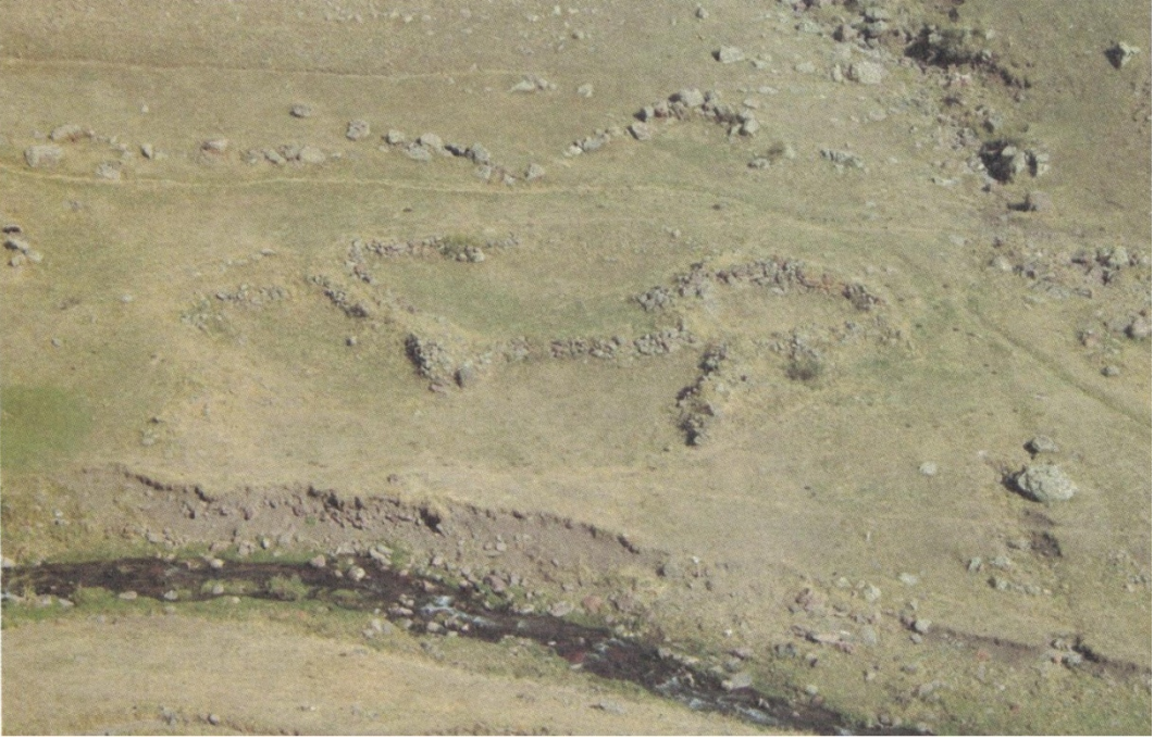
Resim10: Carcı 2 Yerleşmesi