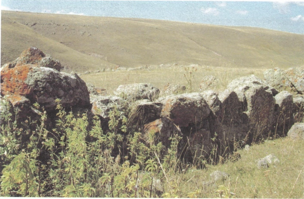
Resim8: Zöhrap Yerleşmesi