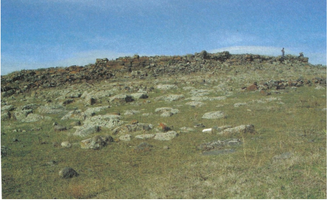
Resim1: Polat Kalesi