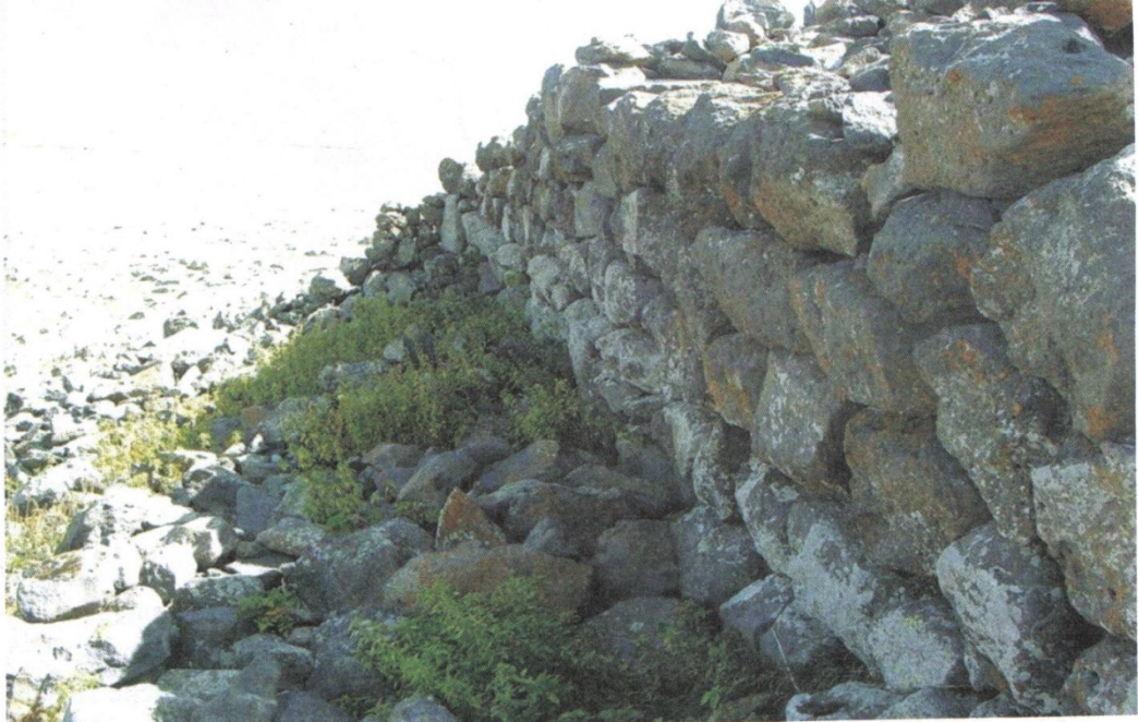
Resim2: Polat Kalesi