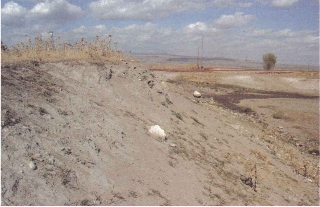
Resim15: Yalınçayır Höyük