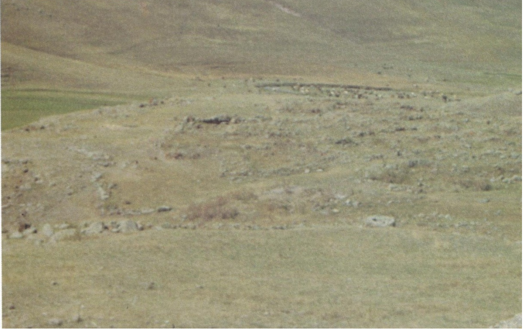
Resim9: Carcı Yerleşmesi