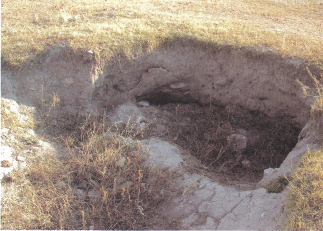
Resim16: Tepecik Yerleşmesi