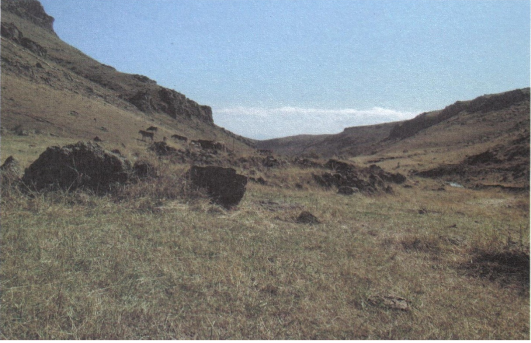
Resim11: Carcı 2 Yerleşmesi