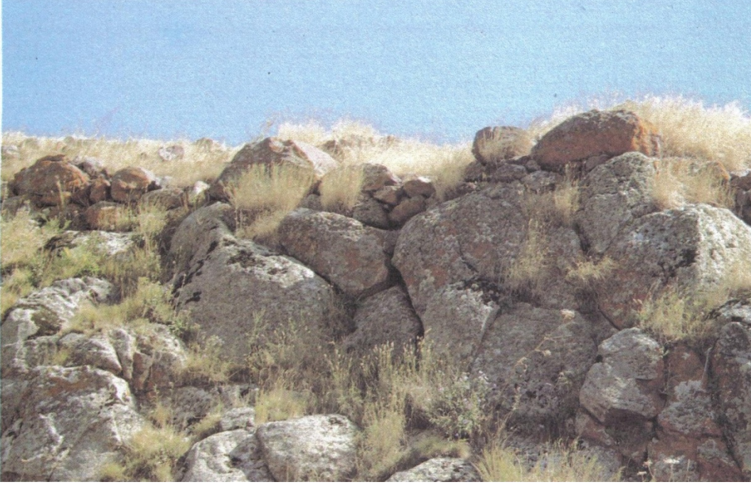
Resim13: Carcı Kalesi