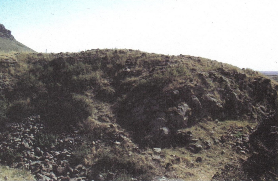
Resim12: Carcı Kalesi