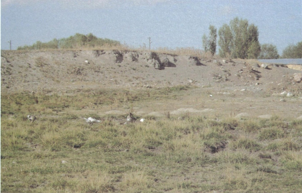
Resim14: Yalınçayır Höyük