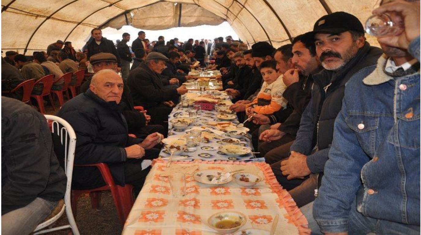
11.Düğün sofralarının vazgeçilmez yemeklerinden üzümlü pilav ve et Kars/Merkez