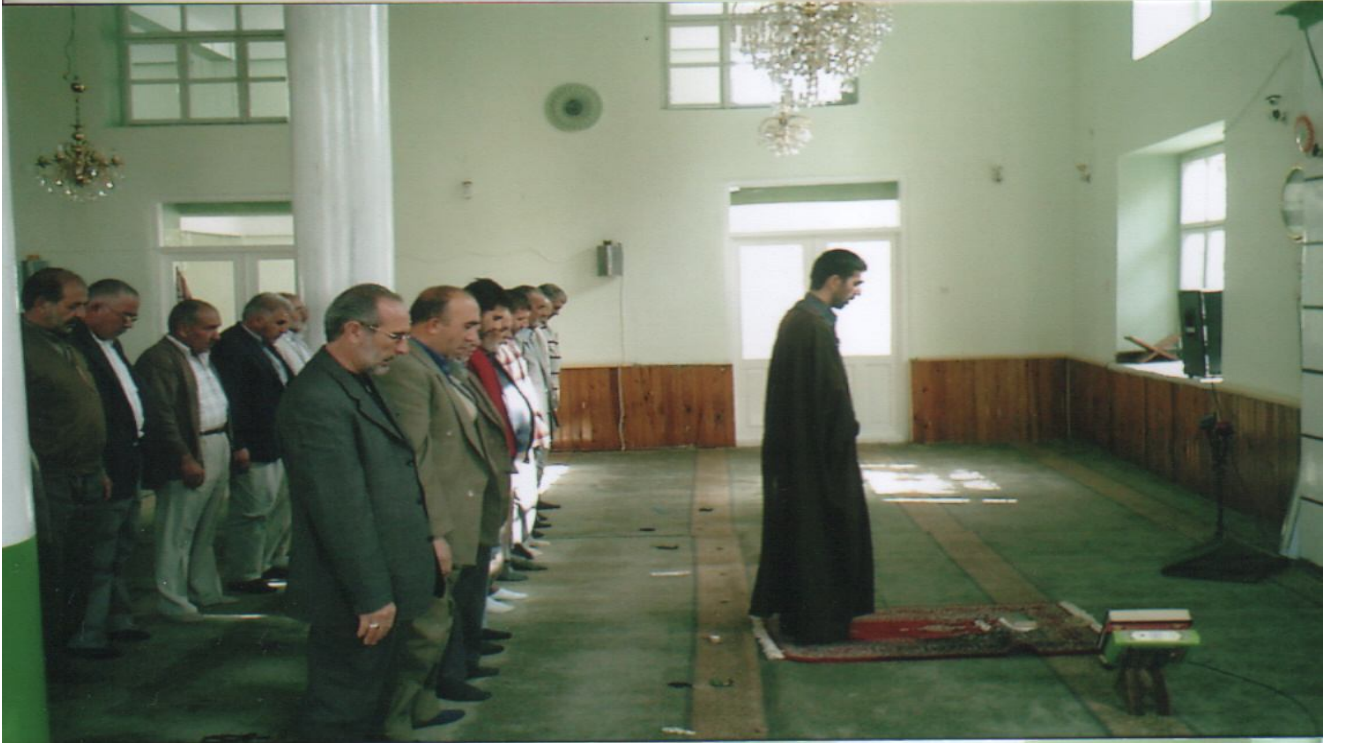
7: Şiilerin namaz kılış şekli