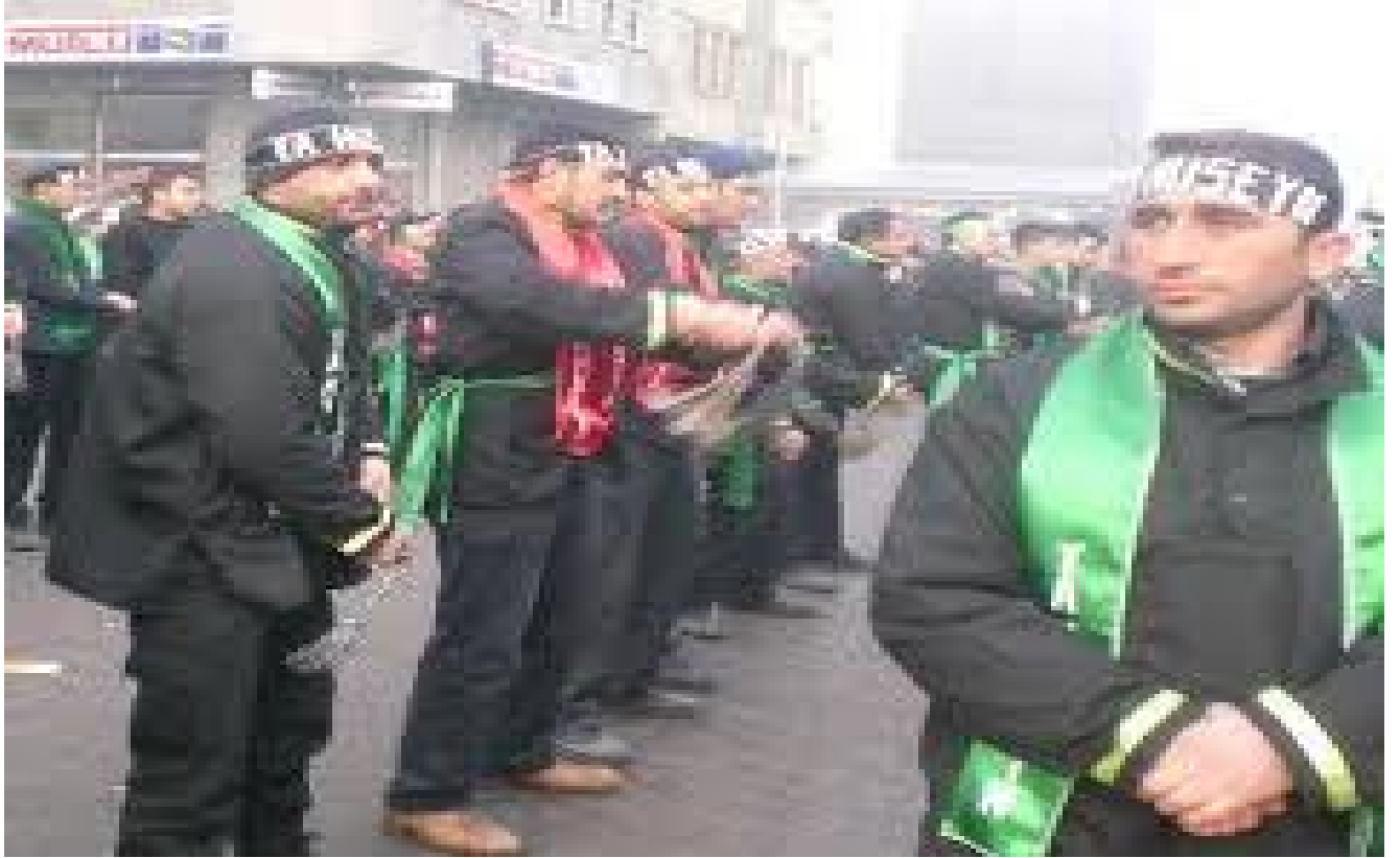
8: Kərbela töreni/Kars