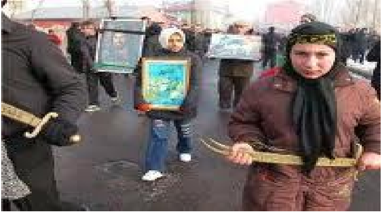
9: Hz. Ali'nin kılıcının sembolünü taşıyan gençler