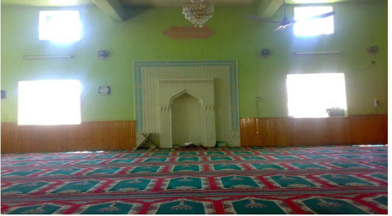
1. Iğdır Caferi Sâdık Camisi