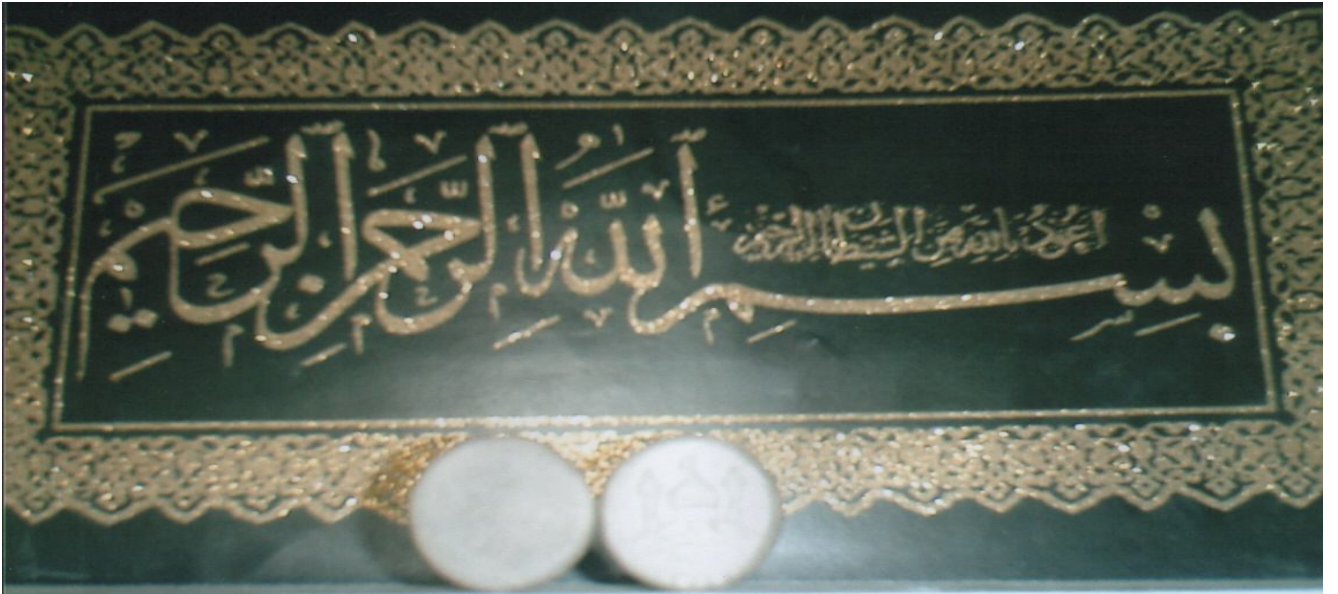
6: Kerbela toprağından yapılmış mühür