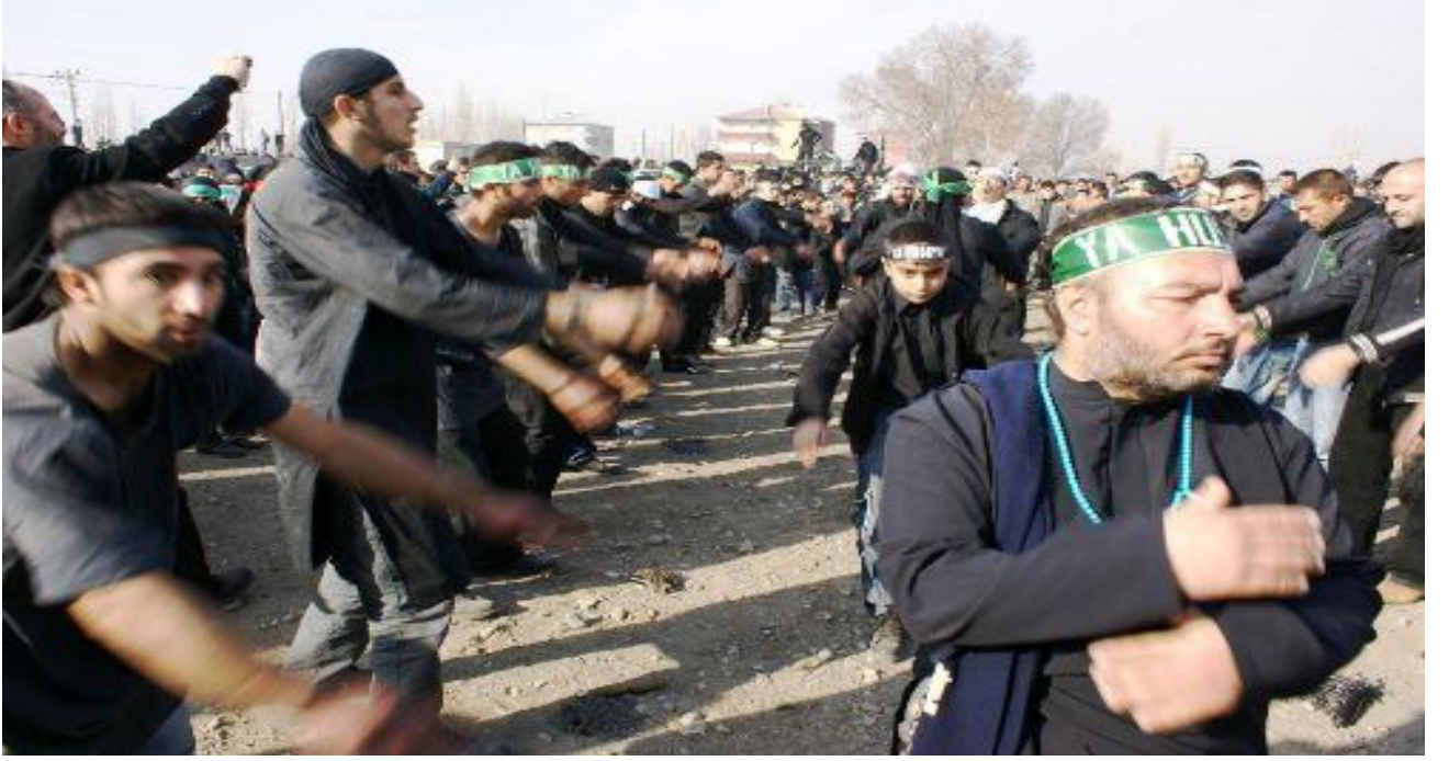
3 Kerbela töreninde sine döven gençler Iğdır/Merkez