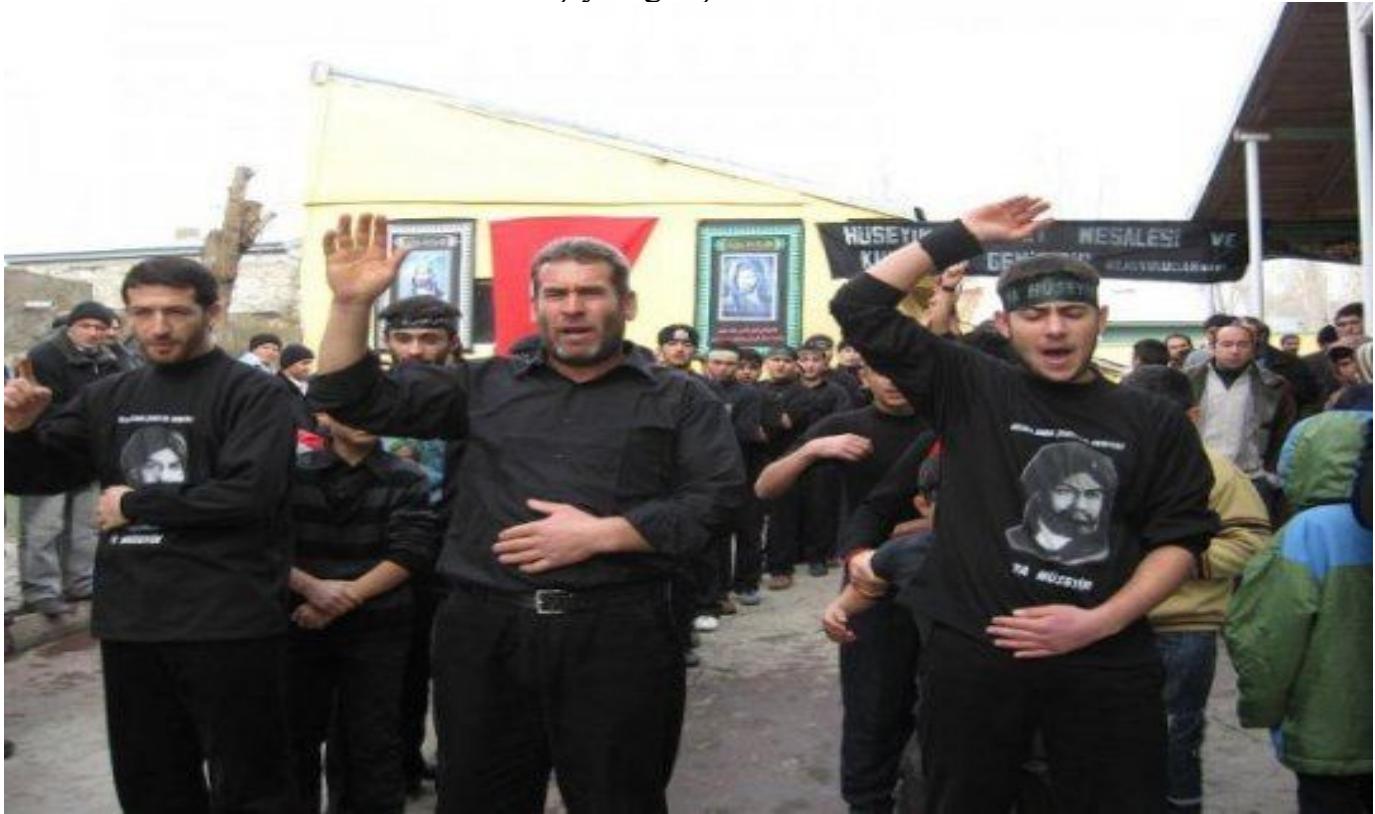
9. Kerbela törenindeki yürüyüş, Iğdır/Merkez