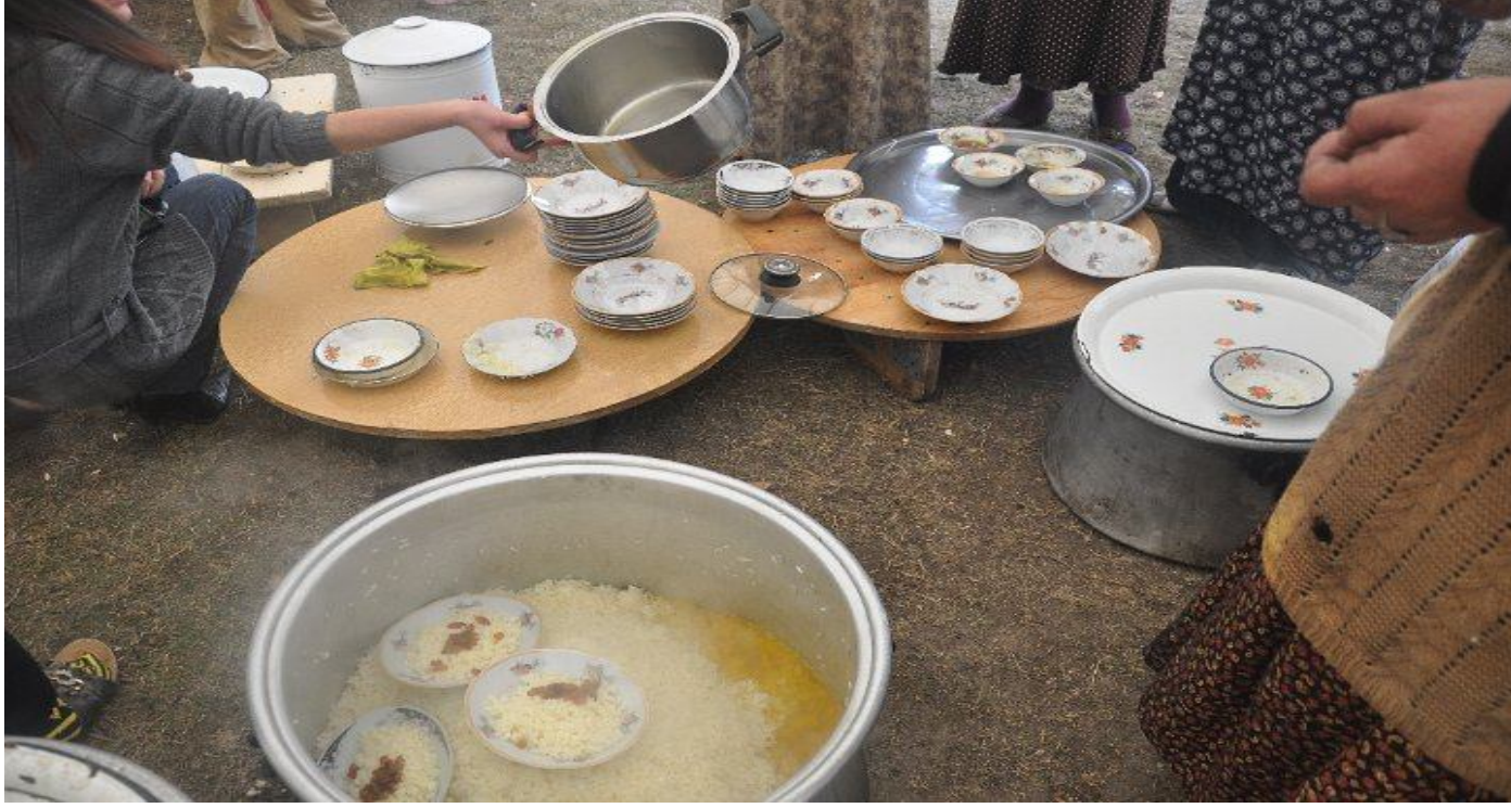
10.Düğün yemeği için yapılan hazırlıklar,Kars/Merkez