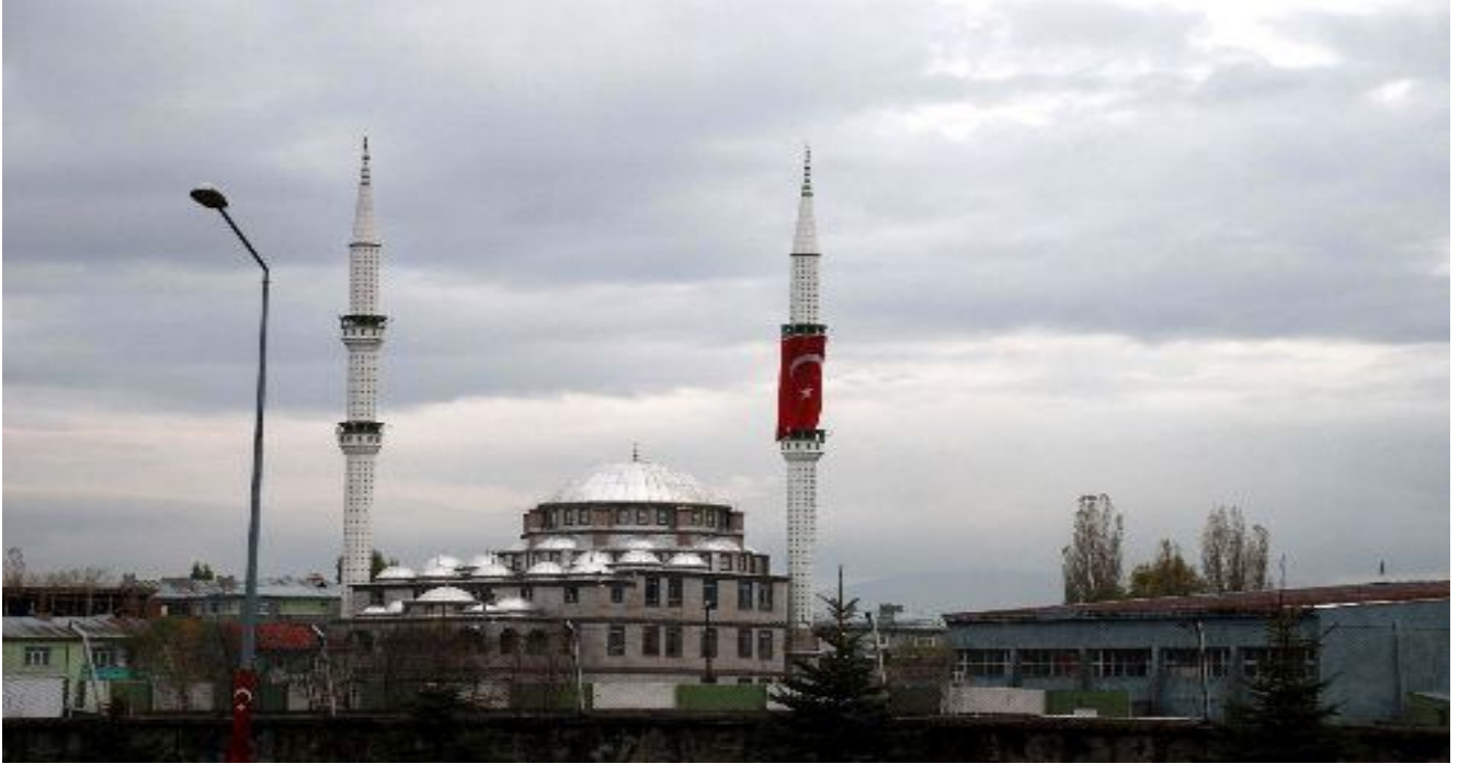
4. Kars'daki Şifli Camii