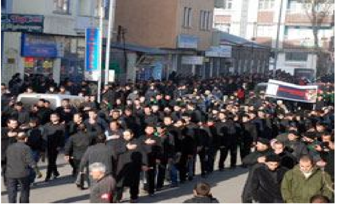
2. Kerbela töreninde sine döven gençler/Kars/Merkez