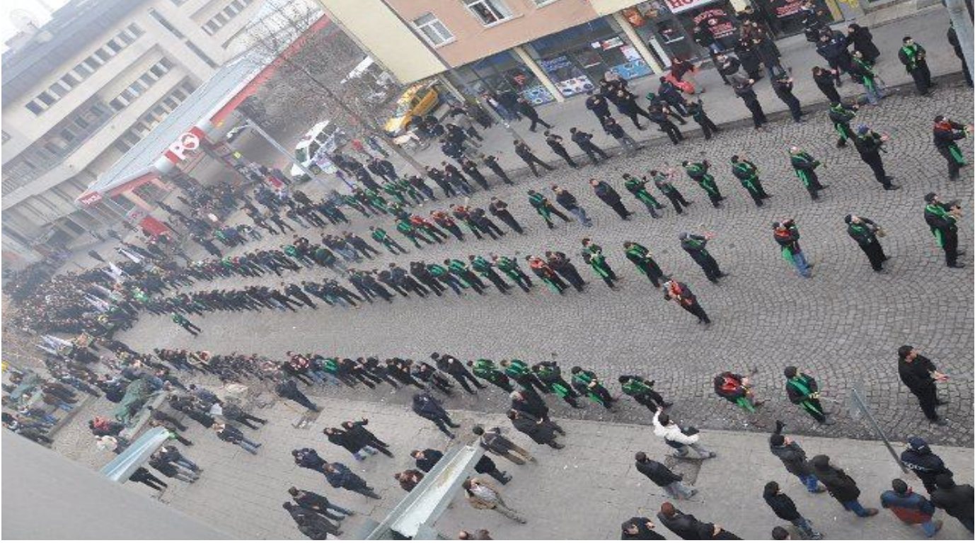
5: Kerbela töreni yürüyüşü Kars/Merkez