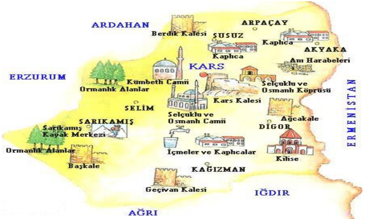
Çizim 1. Kars ili turizm varlıkları haritası

Kars, 40°36' kuzey enlemleri ve 43°5' Doğu boylamlarında Doğu Anadolu Bölgesi'nin, Erzurum bölümünde yer alır. Kuzeyinde; Susuz, Arpaçay ve Akyaka'yla, doğusunda; Ermenistan'la, güneyinde; Digor ve Kağızman'la, batısında ise Selim ve Erzurum sınırlarıyla çevrilidir. Rakımı ortalama 1768 metreyi bulan Kars arazisinin büyük bölümü yaylalardan oluşur. Akarsu vadileriyle yer yer parçalanmış yörede yaylalar dalgalı düzlüklerden oluşur. Aynı zamanda karasal iklim dolayısıyla da en soğuk illerinden birisidir. Ancak mekânın bu olumsuzluğu ilin sanayi gelişmesinde nispeten olumsuz olmuş olsa da il turizm potansiyeli açısından bölgenin başlıca illerinden birisidir. Bunun yanı sıra kültür turizmi açısından da tarihin çok eski devirlerine uzanan antik kalıntıları ve ören yerleri ile önde gelen kültür turizmi açısından da Yontma Taş Çağından beri bir yerleşim yeridir ( http://www.karskulturturizm.gov.tr/belge/1-33833/cografya.html ).