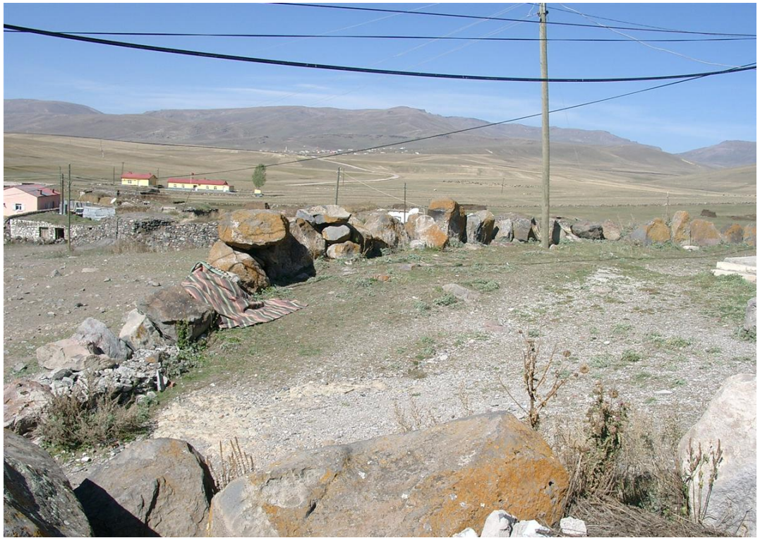
Fig. 6 Baykara Kalıntısı