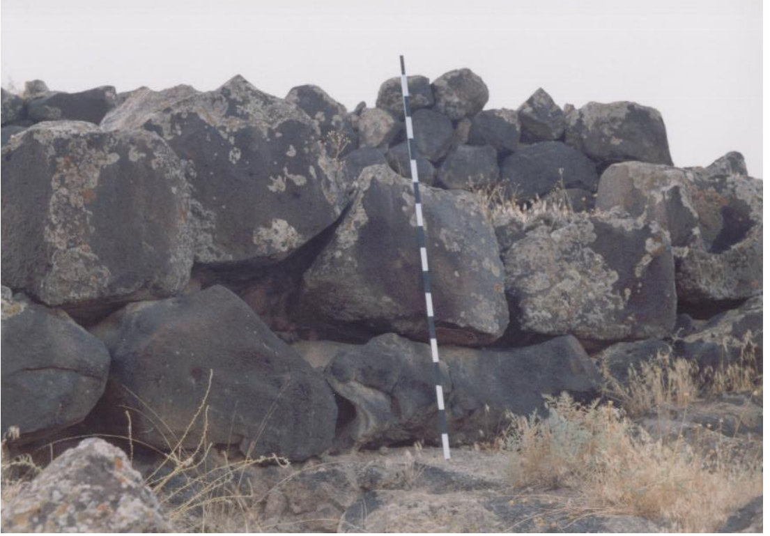
Fig. 21 Karakoyunlu Kalesi