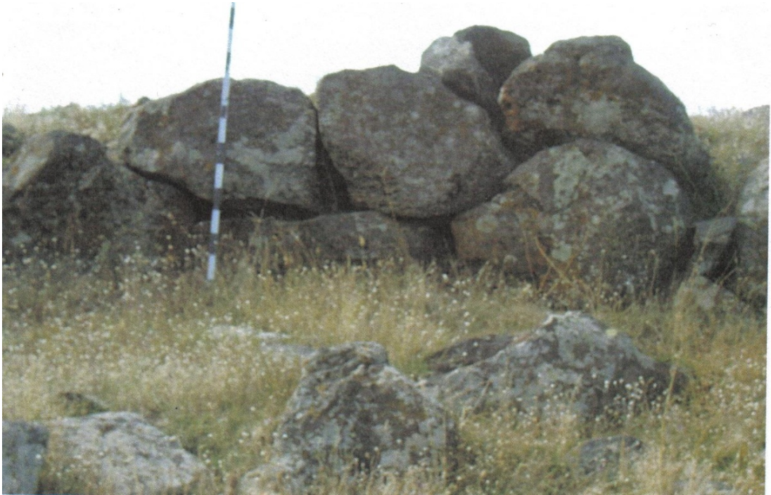
Fig. 8 Yarbaşı Yerleşmesi