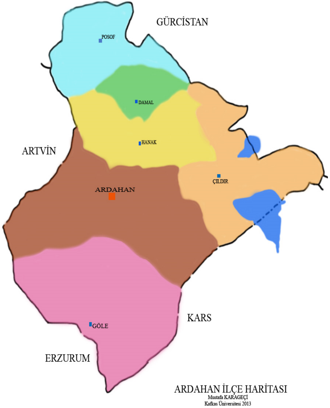
Harita 2 Ardahan İlçe Haritası