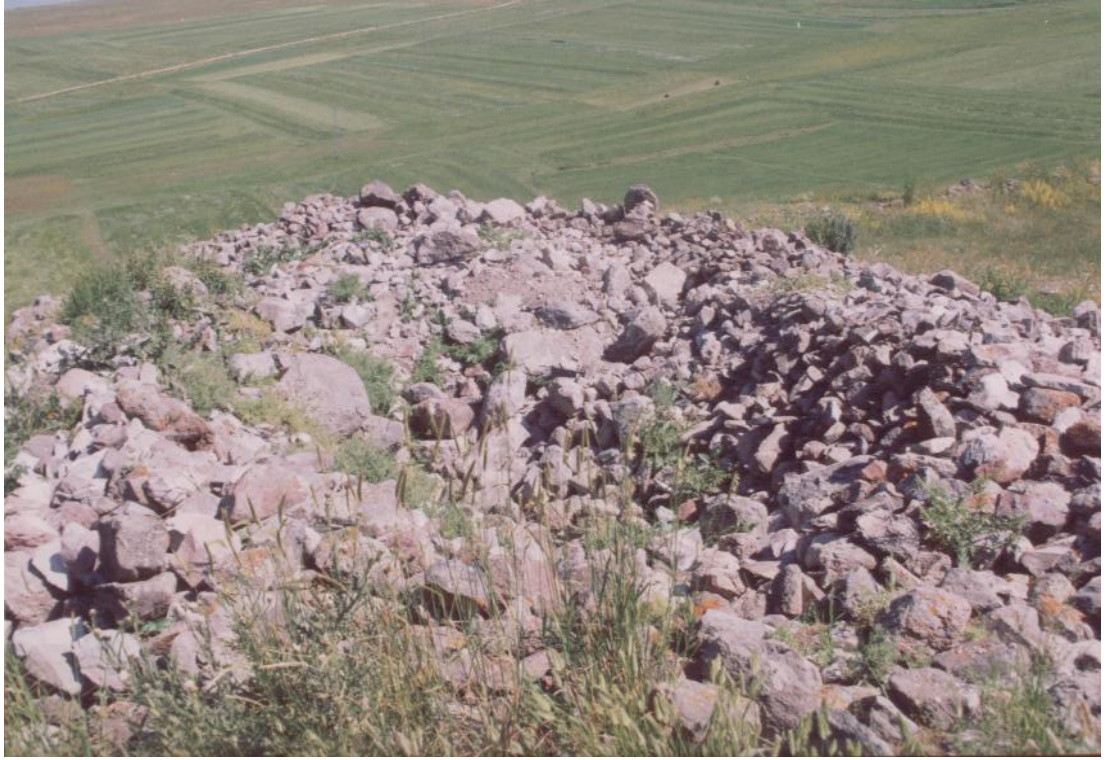
Fig. 17 Sınırortası Kalesi