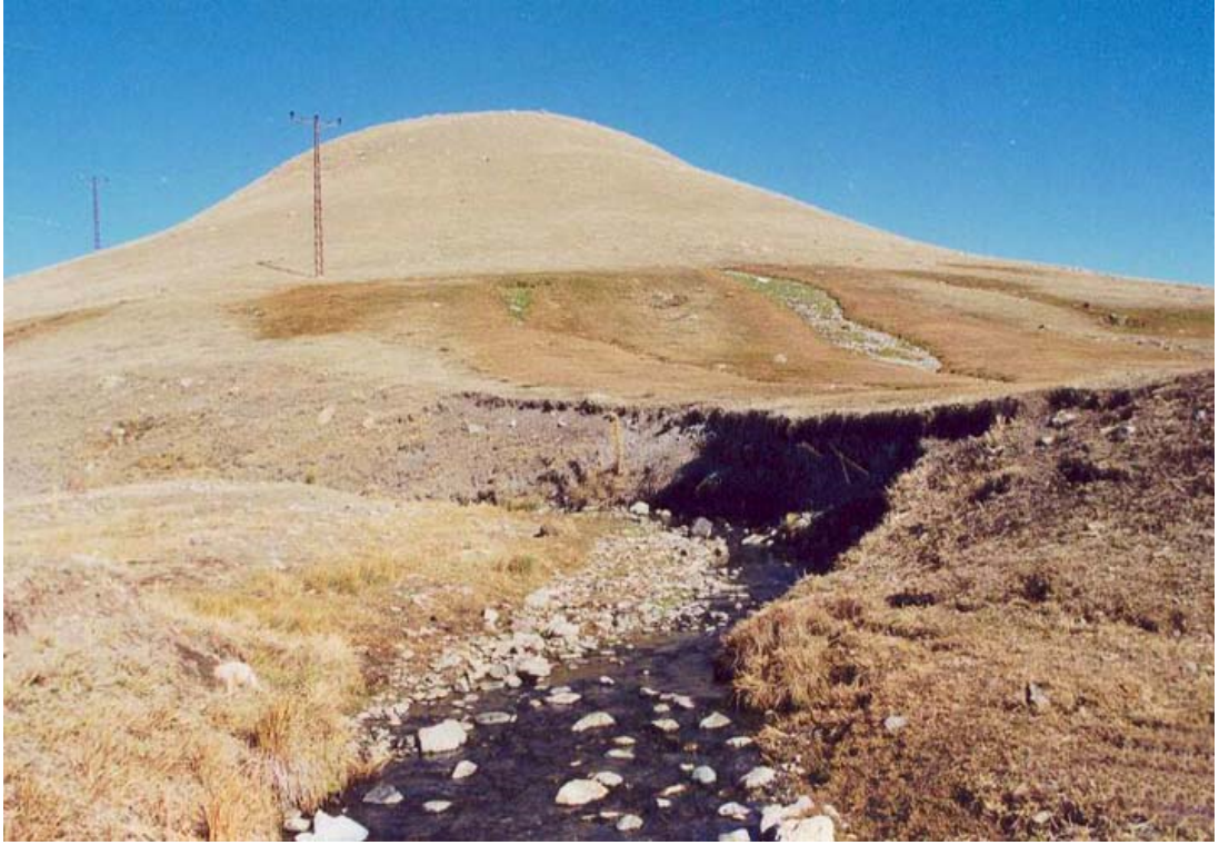
Fig. 3 Toprakkale