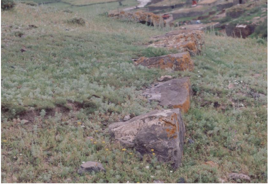
Fig. 5 Yumrutepe Kalesi