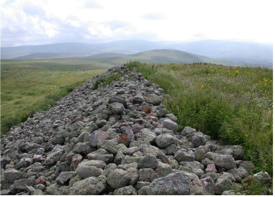
Fig. 15 Segertepe Kalesi