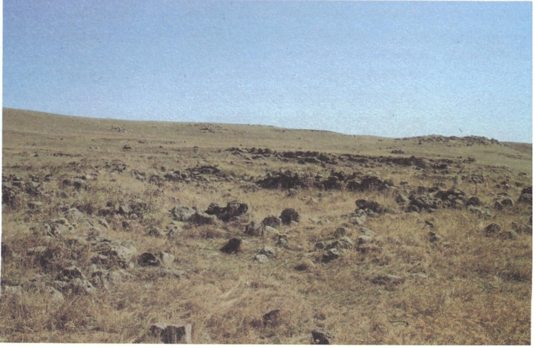
Fig. 9 Zöhrap Yerleşmesi