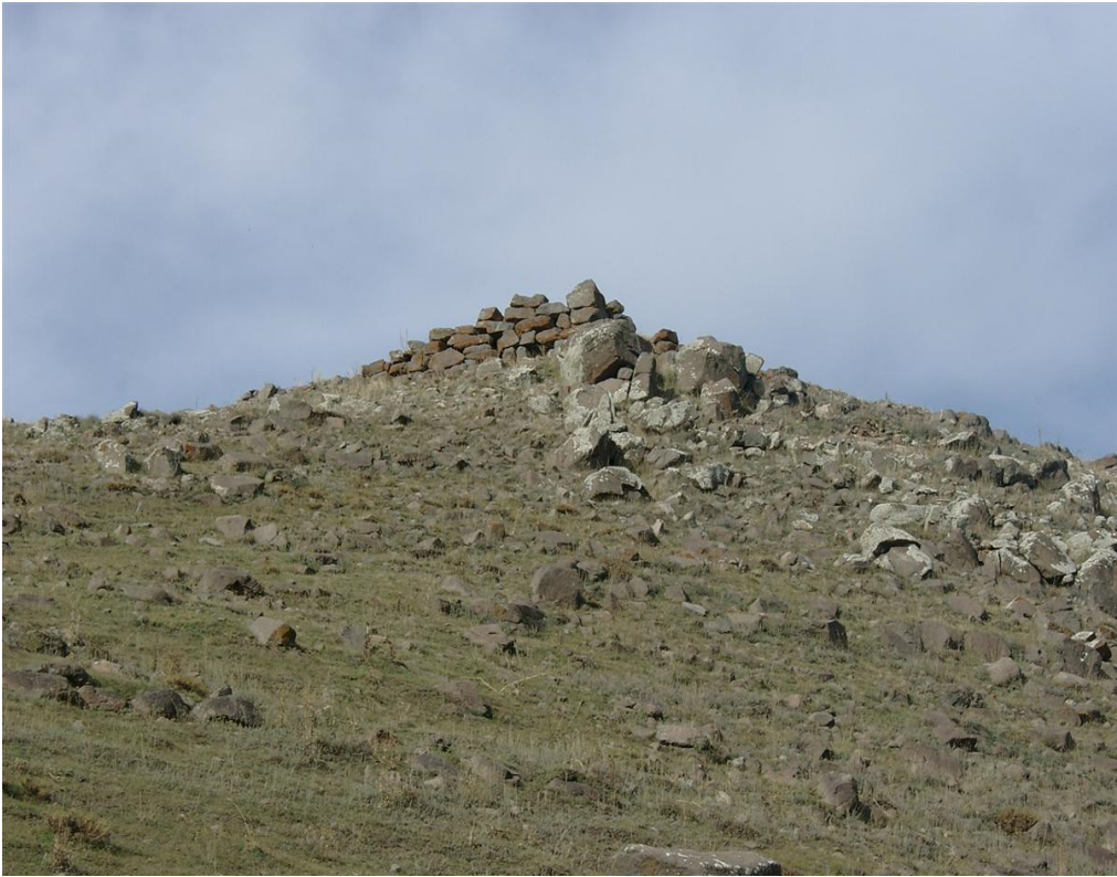
Fig. 2 K rođlu Kalesi