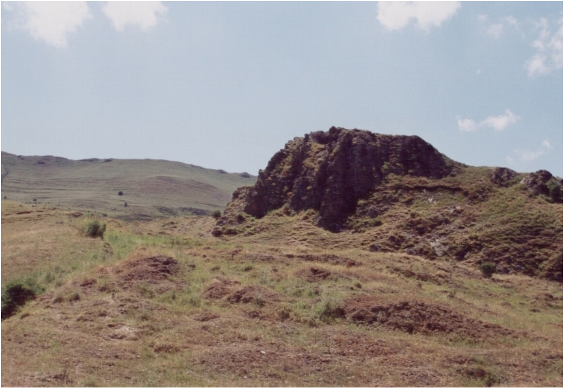
Fig. 4 Yoğunhasan Kalesi