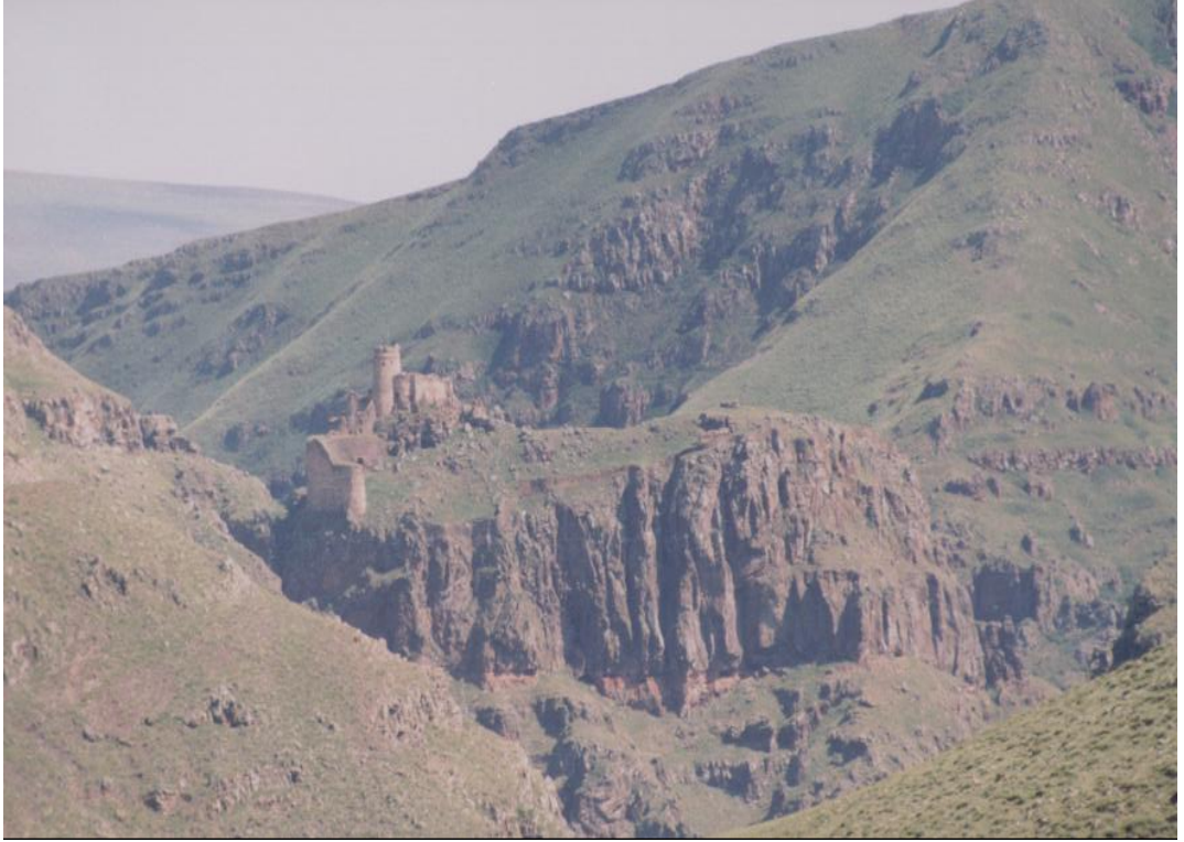
Fig. 11 Şeytan Kalesi