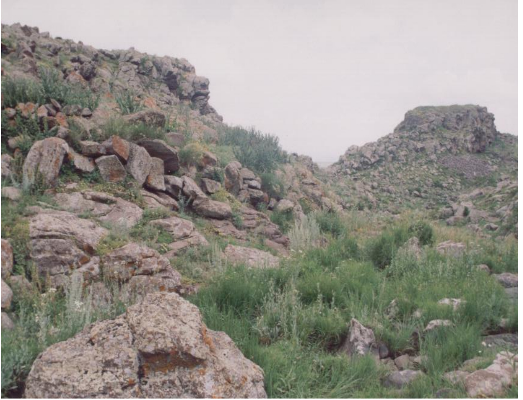
Fig. 10 Mindivan (Kayalık) Kalesi