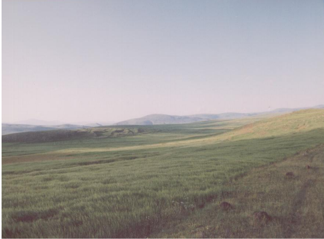
Fig. 13 Adalar