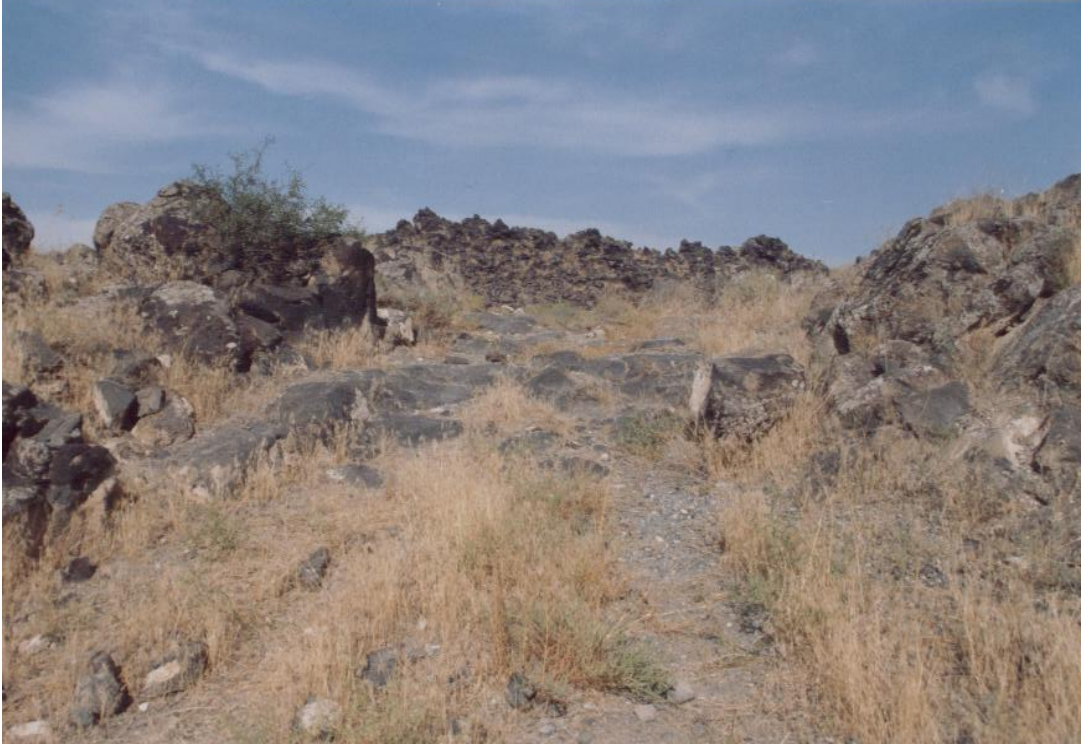
Fig. 20 Karakoyunlu Kalesi