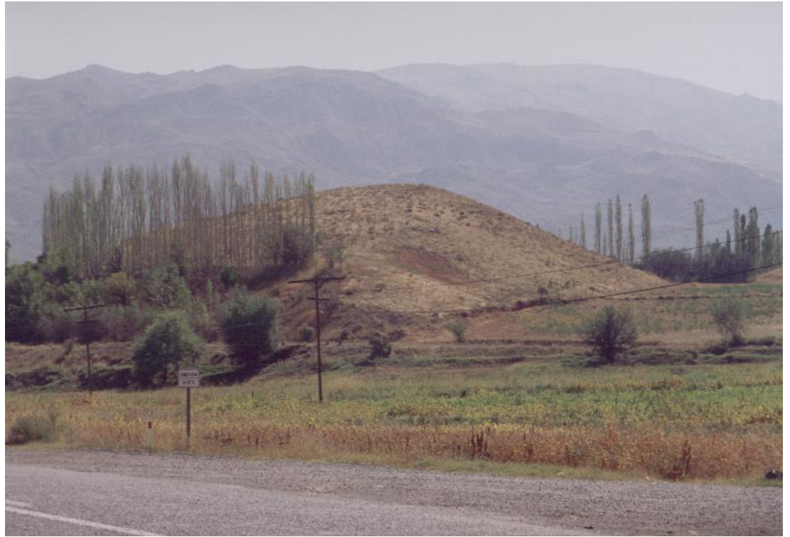
Fig. 18 Küllütepe Höyüğü