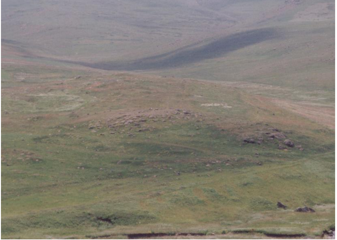
Fig. 16 Karasal Höyük