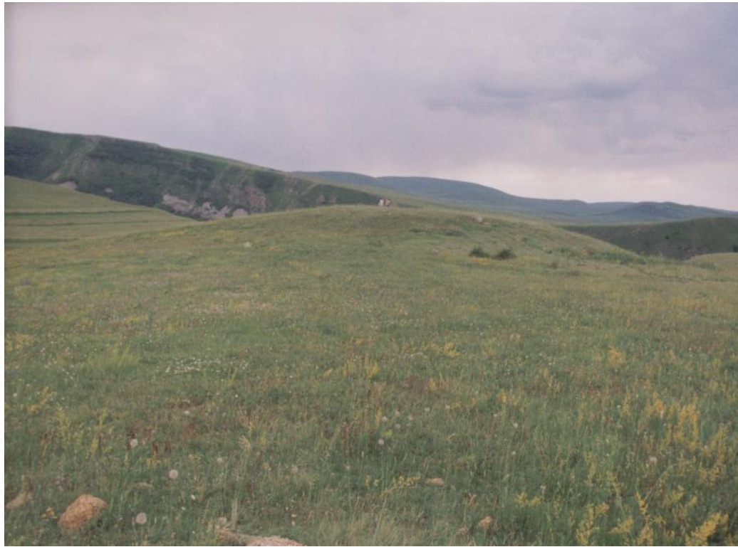
Fig. 14 Peyhler Mevkii