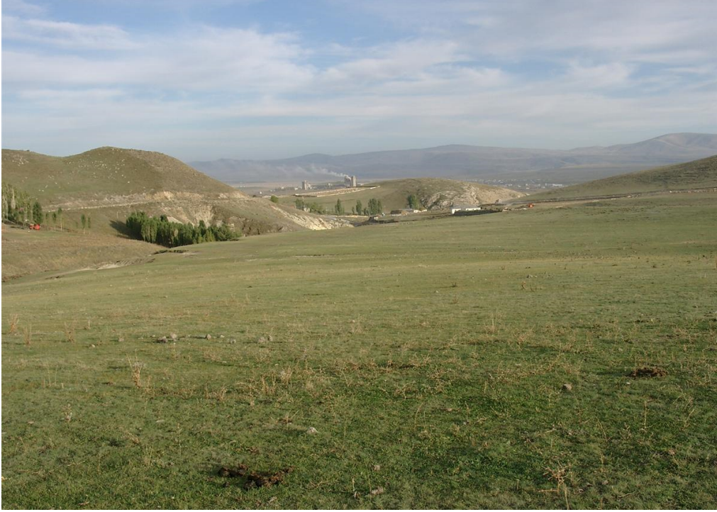
Fig. 1 Danamayalı Yerleşmesi