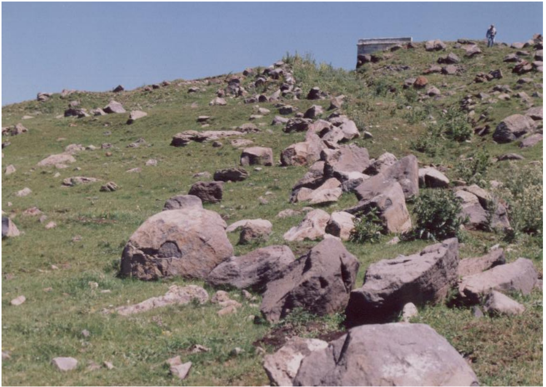
Fig. 12 Beşiktepe