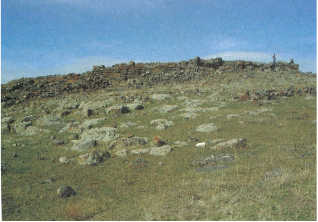
Fig. 7 Polat Kalesi