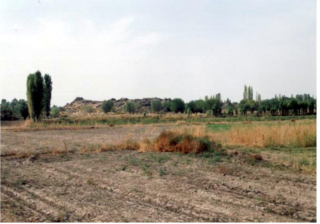
Fig. 19 Deliklitaş Kalesi