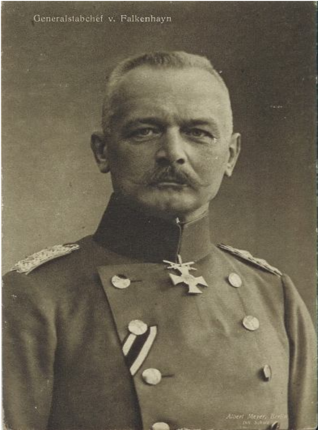
EK 3: GENERAL FALKENHAYN