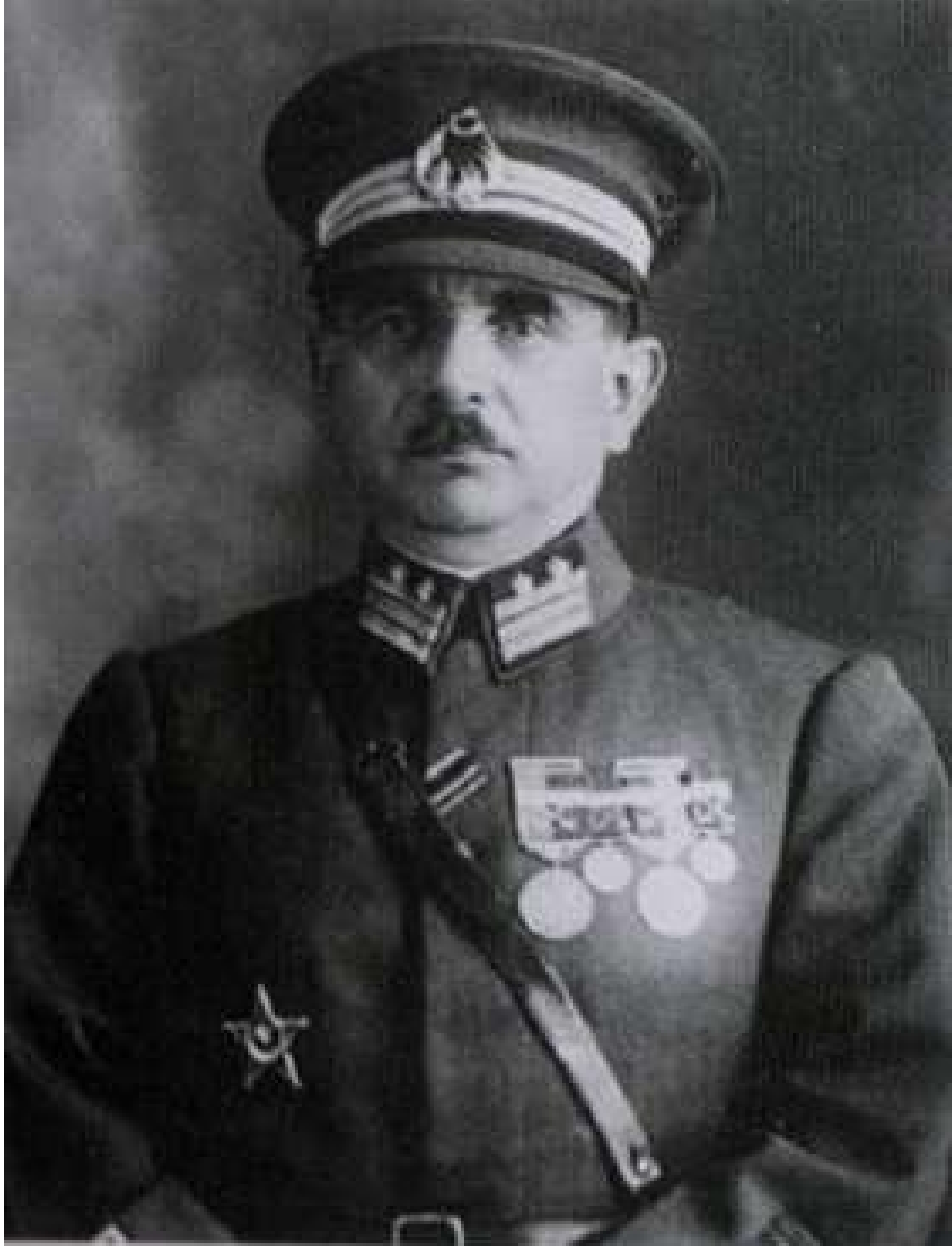
EK 4: NİHAT PAŞA (ANILMIŞ)