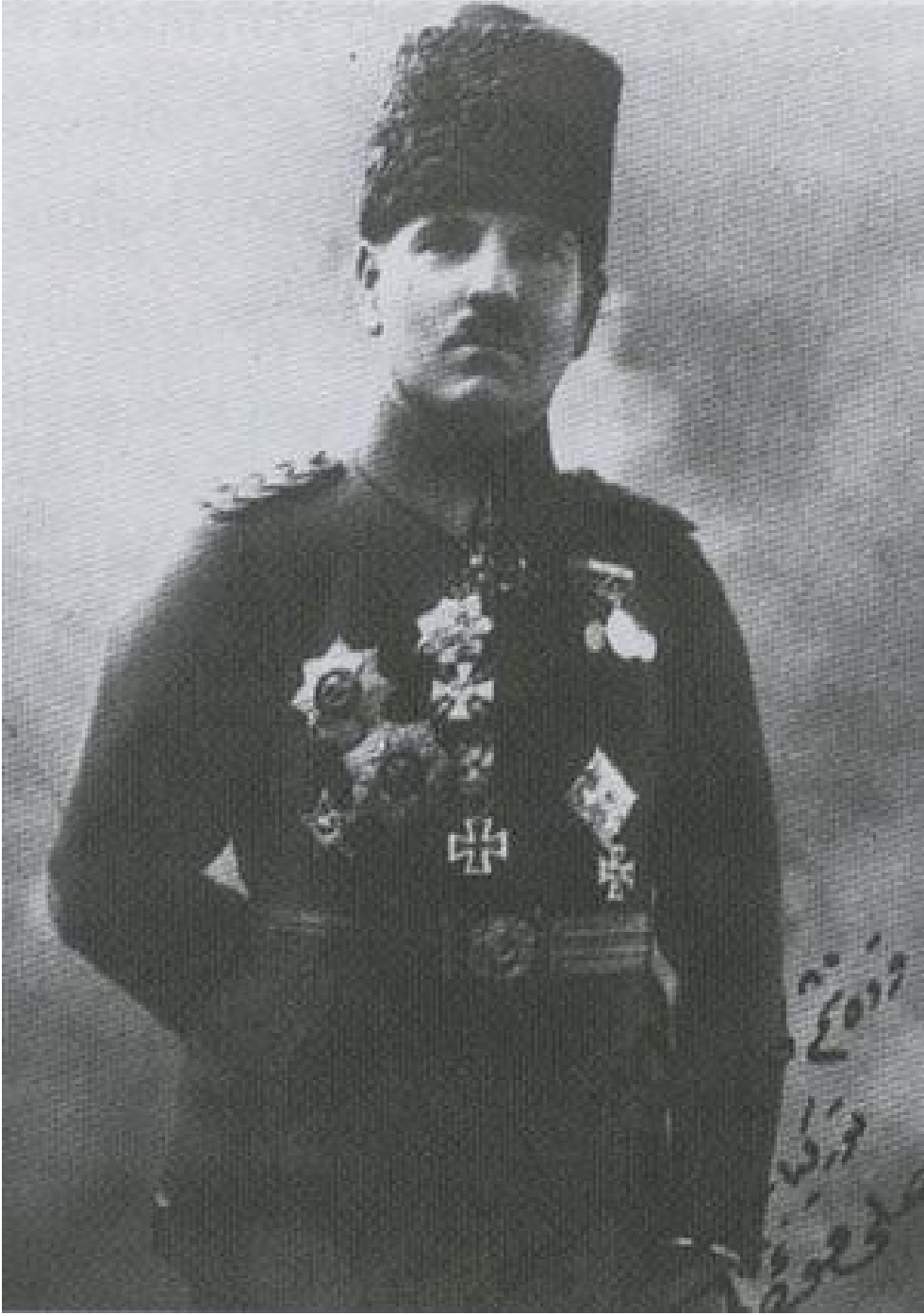
EK 6: ALİ FUAT PAŞA (CEBESOY)