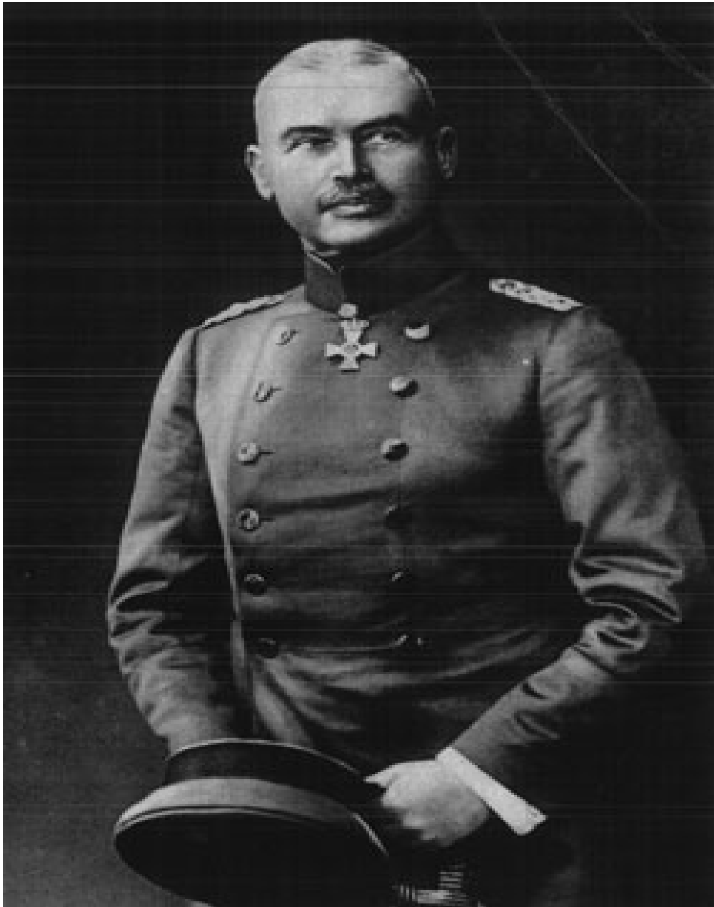
EK 5: OTTO LIMAN VON SANDERS