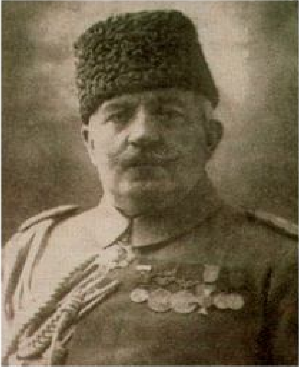
EK 2: AHMET İZZET PAŞA