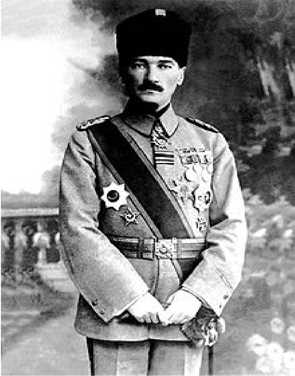
EK 1: MUSTAFA KEMAL PAŞA