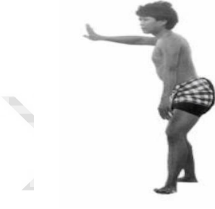
Fotoğraf 1.1: Bali Dans Pozisyonu (Zarilli, 2002, s. 142)

The Motion (Hareket) 25 adlı egzersizini incelediği bir makalede bu egzersizin Bali dans tiyatrosuyla olan benzerliklerini dikkat çekmektedir.