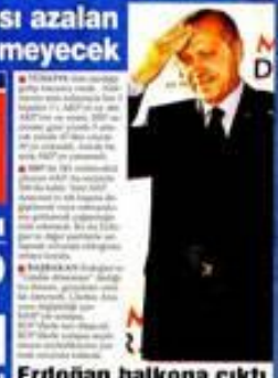
Erdoğan balkona çıktı konustu, esti güledi

MHP barajı aştı ama oyları azaldı Secimnin tek koruyucusu MHP oldu... Vekil sayısı 54'e düştü.