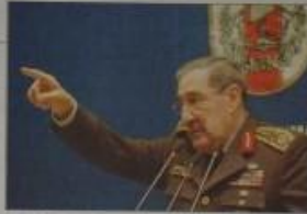
Büyükanıt, basın toplantısında TSK'nin algılamasına yönelik sorulara cevap verirken. 'Bu seslerden ben sözlenmişim' dedi ve Cumhurbaşkanı Erdoğan'ın sesini de duyduğunu söyledi.

Genelkurmay Başkanı Büyükanıt, yarın Ankara'da yapılacak Cumhuriyet Mitingi çerçevesinde çıkan tartışmaları katılıp bu mitingün hiçbir sakıncası olmadığını söyledi. Büyükanıt, "Bir dernek, yasadışı prosedürle toplantı yapamaz, yasalara uygun, güdücü icrarnamesiyle bir toplantı yaparsanız, ben buna demokratik bir görüş derim. İktidar demokratik hakların kullanılmasına hakkını bulamaz" değerlendirmesinde bulundu.