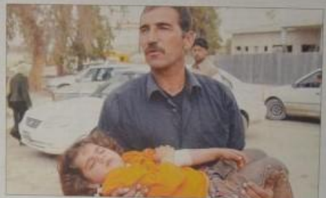
Irak meclisine saldırı. Irak senatörü Şakir Hüseyin İzzetli'nin mecliste saldırıya uğradığı bildirildi. Başbakan Erdoğan'ın mecliste saldırıya uğradığı bildirildi. Irak senatörü Şakir Hüseyin İzzetli'nin mecliste saldırıya uğradığı bildirildi.

ORGENERAL BÜYÜKANIT'IN KONUŞMASI VE YANKILARI