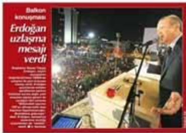
Başbakan konuşmasında Erdoğan uzlaşma mesajı verdi