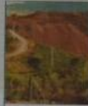
Ağaçlar kesildi Koza'nın zeytin kıymı

'Andiç taslandı, görmedim' dedi. TSK'de sıkı denetim olduğunu kabul eden K. Iraklı gazetecilerin muhabirine görüş istemediğini kaydetti.