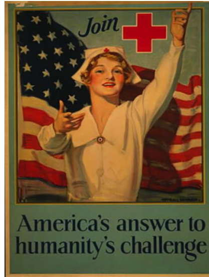
řekil 5. Propaganda Afiři; Amerika'nın İnsanietiliđe cevabı; Kızılha'a Katılın (1917)

Kaynaka: P.J. Lopez, "Amerikan Red Cross Posters and the Cultural Politics of Motherhood in World War I.", a Journal of Feminist Geograpy, Vol 23, Issue 6, 2016, s. 773.