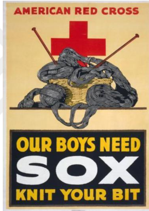
Şekil 3. Propaganda Afişi; Amerikan Kızılhaçı'nın Yardım Çağrısı

Amerika'nın savaşa girmesiyle birlikte Kızılhaç'ta yaralı ve hasta askerlere yardım için ulusal fon artırma faaliyetlerine başvurmuştur. Amerikan kızıl haçı yardım fonlarını artırmak için kartpostallar ve afişler basmış ve bunları satışa çıkartmıştı. Kartpostallar ve afişlerde genellikle Kızılhaç ve Amerikan bayrakları yan yana kullanılmış bu durum birine sadakatin, her ikisine olan sadakat olduğu vurgulanmıştır. Ayrıca afişlerde yaralı ve hasta askerlere yer vererek vatandaşlara o senin oğlun olabilirdi, yardım etmezsen ölecek gibi mesajlar vererek vatandaşlardan vatan evlatlarına yardım gönderilmesi için destek olması gerektiği tutumu yaratılmaya çalışılmıştır. 219