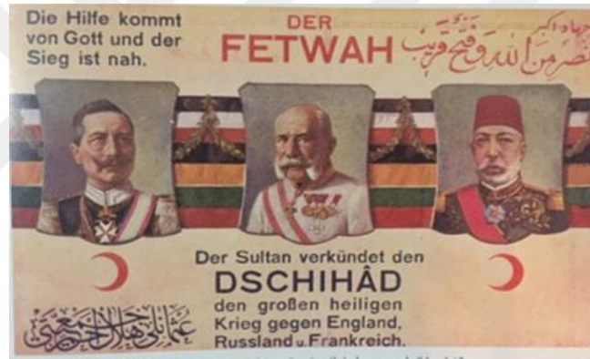
Şekil 10. Hilal-i Ahmer Cemiyetinin Yayınladığı Kartpostal ile Cihad ilanını duyurulmaktadır. Kartpostalda, Almanca olarak yazan açıklama metinde; padişahın fethasıyla, İngiltere, Rusya ve Fransa ya Karşı Cihad İlan Edildiği Duyurulmuştur.

gösterebileceğimiz bu faaliyet gazetelere aşağıdaki gibi yansımıştır. 2 Mart 1914 tarihli Sabah Gazetesi haberinde Hilal-i Ahmer heyetinin, Trablusgarp ve Balkan Savaşlarındaki Müslüman Hintlilerin katkılarından dolayı teşekkür edilmesi amacıyla Hindistan'a gitmesi kamuoyuna duyurulmuştur. 321 22 Şubat 1916 tarihli Sabah Gazetesi haberinde 1. Dünya Savaşında Osmanlı Devletinin müttefiki olan Avusturya-Macaristan Kızılhaç örgütüyle birlikte Hilal-i Ahmer ve Kızılhaç yararına Macaristan Debretsen kentinde konser verildiği duyurulmuştur. Bu konserin müttefik ülkeler ile her alanda yapılan işbirliğinin bir göstergesi olduğu haberin devamında belirtilmiştir. 322 1. Dünya Savaşı Galiçya Cephesinde savaş Osmanlı askerleri için Hanımla merkezi 1916 yılında Viyana'da kurulan şubeyle Avusturya kadınlarını cephede savaşmakta olan askerler için yardıma çağırmıştır. 323 Bir başka faaliyet örneği ise 5 Aralık 1914 tarihli Tanin Gazetesi haberinde yer almaktadır. Habere göre Viyana'da Hilal-i Ahmer yararına bir oyun düzenlenmiş, oyuna Viyana Başvekili ve Osmanlı Viyana Sefiri katılmıştır. Oyun sonunda orkestra tarafından Osmanlı marşı çalınmıştır. 324