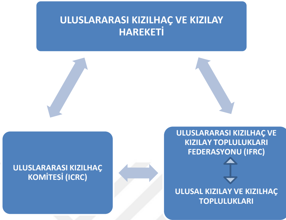
Tablo 1. Uluslararası Kızılhaç ve Kızılay Hareketi Organizasyon Yapısı

Uluslararası Kızılhaç Hareketinin varoluş sebepleri, ilkeleri ve organizasyon yapısının yanında kuruluş felsefesine de değinmek gerekmektedir. Kızılhaç hareketinin kurucuları kendileri 18. Yüzyıl Avrupa aydınlanma düşünürlerinin sık birer takipçisi olarak görmekteydiler. Kızılhaç kurucuları Cenevre sözleşmesiyle birlikte insani değer ve standartlarını yükseleceğine zaman içerisinde bu değerlerin tüm dünyaya yayılarak evrensel hümanizmi oluşturacağına bu sayede Avrupa'nın bütün dünya ülkelerini medenileştirme görevlerini yere getireceğine inanmışlardır. 195