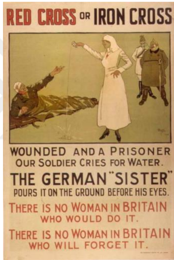
Şekil 1: Almanların acımasızlığını gösteren, Alman karşıtı bir propaganda afişidir. İnsani yardım Savaşın ahlaki ve insani boyutunun gösterilmesinde ve düşmanın bu ahlaki ve insani özelliklerden yoksun olduğuna dair algının oluşturulmasında kullanılmıştır.

metaforlar ile özleştirilen propaganda faaliyetlerinde bulunmuşlardır. 147 Dünya savaşlarında bu tarz propaganda faaliyetleri vahşet veya nefret propagandası şeklinde ifade edilmektedir. Bu propaganda faaliyetlerinde üç tür zulüm üzerinde durularak düşman algısı yaratılıp canavarlaştırılmaya çalışılır. Bunlar katliam yapıldığına dair her türlü propaganda faaliyetleri; (örneğin Yahudi soykırımı), vücut bütünlüğün bozulması( örneğin alman askerlerinin gözlerin çıkartılması), açlıktan ölüme terk etme veya askeri ve sivil nüfusa yapılan işkence benzeri durumlar kamuoyuna yansıtılmaktadır. 148 1. ve 2. Dünya savaşında devletler savaş propagandası faaliyetleriyle tarafsız ülke kamuoylarını, kendi ve dost ülke vatandaşlarını etkilemek için insani hedef ve davaları öne çıkartmışlardır. 149