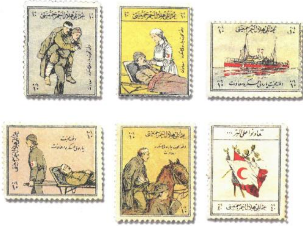
Şekil 9. Hilal-i Ahmer Posta Pulu Örnekleri

Gazetesinin 6 Mayıs 1917 tarihli haberinde ise Hilal-i Ahmer Cemiyet'inin Şeker Bayramının ilk günü olan Çiçek Gününde on paraya pul satışı sunulacağından bahsedilmiştir. 301