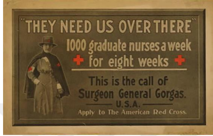
řekil 4. Sekiz Hafta Boyunca Haftada, 1000 Kiřinin zerinde Mezun Hemřireye İhtiya Olduđunu ve Katılım iin Amerikan Kızılha'na Bařvuru Yapılmasını İsteyen Afiř.

Amerikan Kızılha rgt ařađıdaki yer almakta olan propaganda afiřleri aracıyla gnll vatansever Amerikan kadınlarının gnll yardımlarını beklemiřtir.