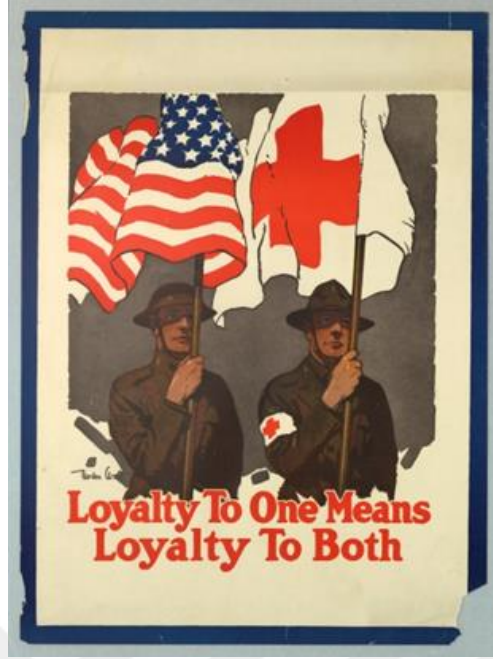
Şekil 6. Amerikan Kızılhaç'ı Propaganda Afişi; Birine bağlılık, her ikisine sadakat demektir.