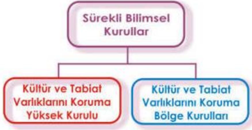
Şekil 4 Sürekli Bilimsel Kurullar