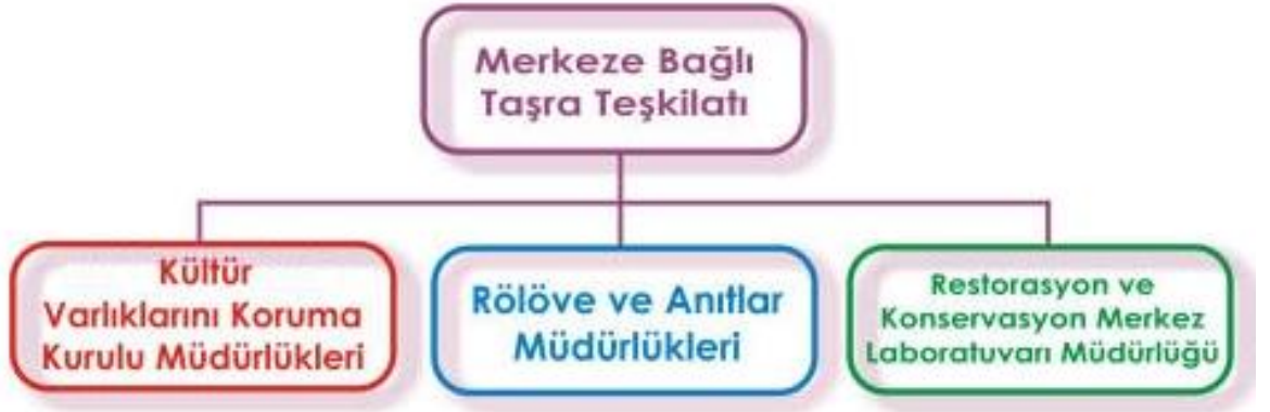
Şekil 2 Merkeze Baęlı Taęra Teękilatları.

Merkeze baęlı taęra teękilatları merkezden ayrı yerlerde oluşturulmuş fakat idari anlamda merkeze baęlı çalışan birimlerdir. Bunlar kültür varlıklarını koruma bölge kurulu müdürlükleri, rölöve anıtlar müdürlükleri ve restorasyon ve konservasyon laboratuvarı müdürlükleridir.