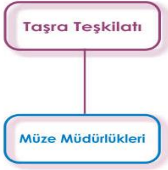
Şekil 3. Taşra Teşkilatları