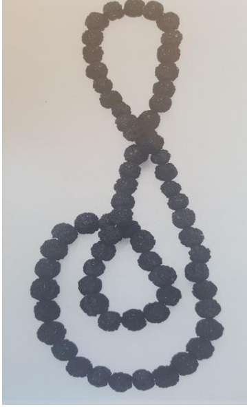
Şekil 2.2 Hinduizm'de Şiva'ya tapanların kullandığı 66'lık tohumlardan yapılmış tespih

Çinli Budistler ise İ.S. 1. Yüzyıl'da Budizm'in Çin'e yayılmasıyla tespihle tanışmışlardır ve günümüzde ibadet içinde kullanılsa da statü sembolü haline de gelmiştir. Koreli ve Japon Budistlerin tespih hakkındaki yaklaşımlarıyla devam eden Gürsoy, Japonya'da bir rahip tarafından kutsanan tespihin statü sembolü olarak duvara asılmasını da anlatmaktadır (21). Gürsoy'a ek olarak Dubin (1987, 85), Çin'de tespihlerin yaygın olmadığını ama Budistlerin ilerleyen zamanla Tibetlilerden örnek alarak kullanmaya başladığına değinir. Fakat dua etmekten çok statü göstergesi olarak kullanıldığını belirtmektedir.