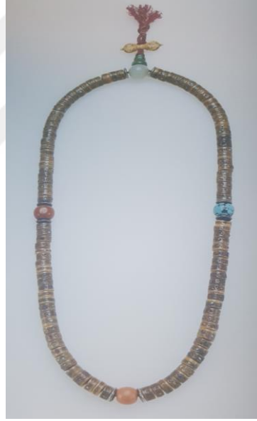
Şekil 2.3 Japon Budistlerin kullandıkları erik ağacından yapılmış