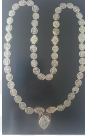
Şekil 2.5 Londra'daki Victoria and Albert Museum'dan, 15. Yüzyıl'dan kalma altından yapılmış bir tespih.

tespih kullanmadığını ancak Ermenistan'da strese karşı gündelik yaşamda kullanıldığını anlatmaktadır (Gürsoy 2010, 45).