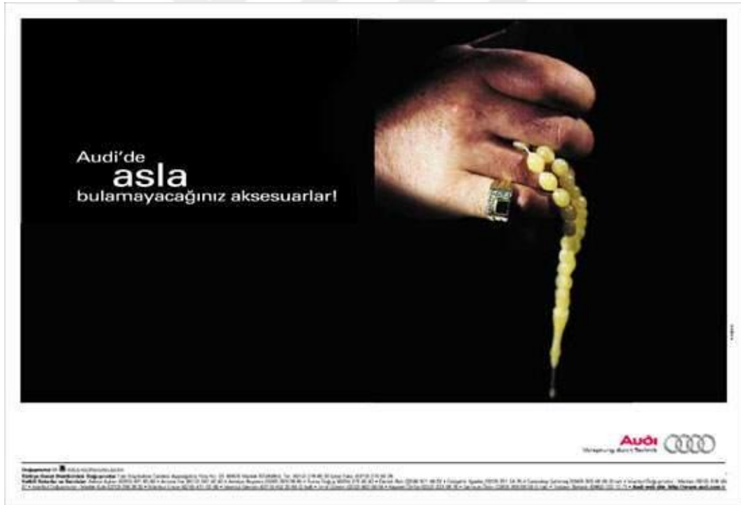
Şekil 2.6 Audi Reklamı

burjuvazinin sahip olabileceği bir tüketim nesnesi olarak karşımıza çıktığını, Bourdieu'nün Ayırım (2015) eseri göz önünde bulundurularak; hız (zamandan tasarruf), rahatlık ve şıklık (estetik) burjuvaziye has alışkanlıklar olduğu söylenilebilir. Reklamda ise bu ayırım açık bir şekilde simgeler yoluyla ortaya konmuştur. Reklam bunu aynı zamanda Audi'nin pahalılığı ile değil, parası olup Audi marka araba alabilecek maddi gücü yeterli olan ama reklamda bulunan erkek aksesuarlarını tüketenler de Audi reklamının hedef kitlesinin dışında kalmaktadır. Kısacası burjuva kültürüne ve tüketimine hitap ederek hedef kitlesini belirlemiş bulunmaktadır.