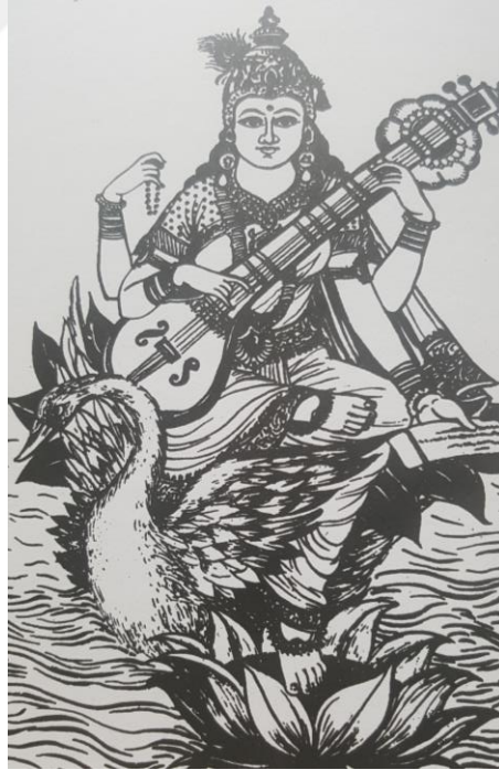
Şekil 2.1 Saraswati

Tespihin Hinduizm dini ve felsefesinden bahseden Gürsoy, kitabında Hindu tanrıçası Saraswati’nin elinde tespihli bir görseline de yer vermektedir ve sonrasında Budizm’de tespihin yerini anlatmaktadır. Hinduizm’de ağaç tohumlarından yapılan tespihler, Budizm’de hem ağaçtan hem de mercan, kehribar ve fildişinden de yapılmaktadır ve genellikle 108 tanelidirler (19).