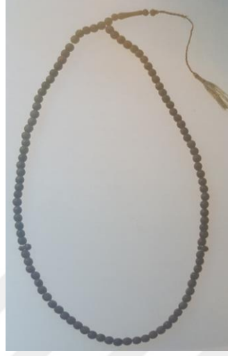
Şekil 2.4 İslam’da kullanılan Kahire’den 99’luk zeytin ağacından yapılmış tespih