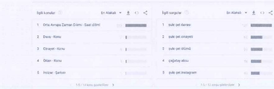
Resim 4.1 Google Trendler’de İstanbul ilinden yapılan “Şule Çet” aramaları

Tablo 4.3 İkincil travmatik stresin belirtileri ile en sık kullanılan ifadelerin kesişiminde izlendiği gibi adalet arayışının aktarıldığı girdilerde “lüks plaza” vurgusunun 89, “yoksul” vurgusunun 67 ve “öksüz” vurgusunun 44 kez yapıldığı saptanmıştır.