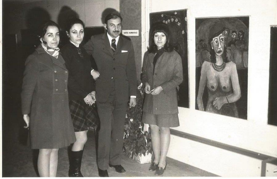
Şekil 2.27: Taksim Sanat Galerisi, İstanbul, 16 Aralık 1969

Kaynak: https://www.kultursanatharitasi.com/sanatta-sahtecilik/