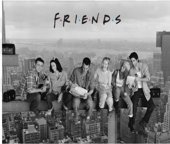
Şekil 2.22: Lunch atop a Skyscraper