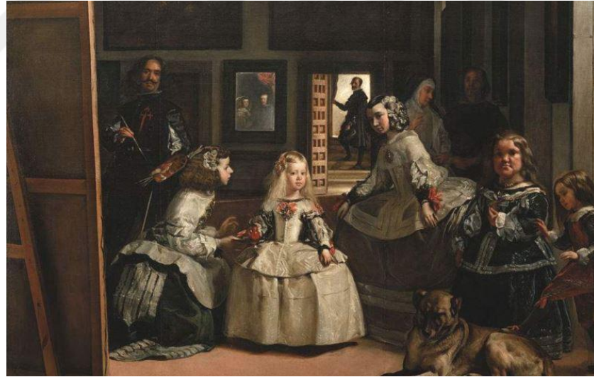
Şekil 2.2: Diego Velazquez Las Meninas (1656)