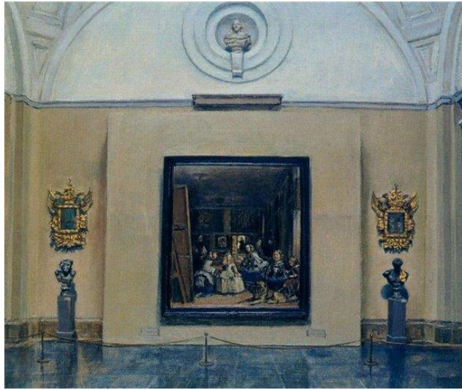
Şekil 2.4: Rafael Cidoncha Las Meninas, Prado Müzesi