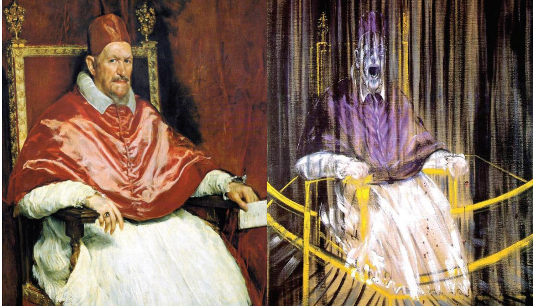
Resim 2.13: Diego Velázquez, Papa X. Innocent'in Portresi, 1650 dolayı, T.Ü.Y.B., 141x119cm, Doria Pamphilj Gallery

Deleuze'un düşüncesine göre Bacon bu resmi ile aslında gücü yansıtmaktadır. Yansıtılan bu güç bazen basınç bazen yerçekimidir. Bacon'ın figürlerini bozan güçler belki de bunlardır (Deleuze, 2009: 58).