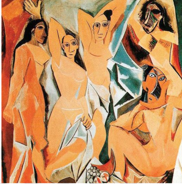
Şekil 2.12: Pablo Picasso, Avignon’lu Kızlar, 1907, T.Ü.Y.B., 243.9x233.7cm, MOMA New York