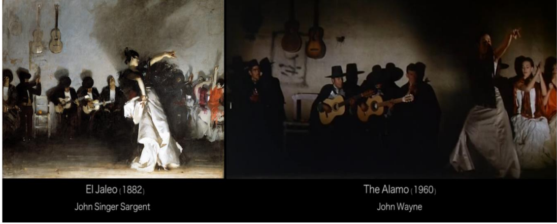
Şekil 2.15: John Singer Sargent, El Jaleo