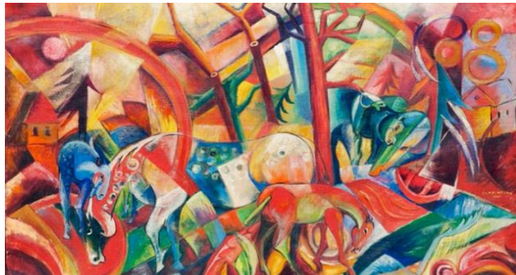
Şekil 2.25: Heinrich Campendock, Red Picture with Horses, 1915

Wolfgang, karısı Helene'nin yardımı ile sahte resimlerini satmıştır. Helene bu resimleri ailesinden aldığını söyleyerek satışa sunmuştur. Sahtecilik suçlaması ile araştırılan aile savunduklarını doğrulamak için kanıtlar ile oynamıştır.