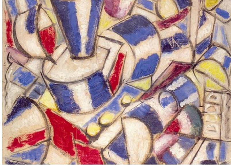
Şekil 2.24: Fernand Leger