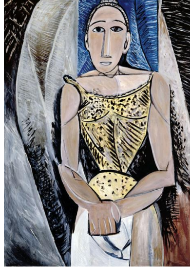
Şekil 2.6: Mike Bidlo Not Picasso, Woman in Yellow, 1987