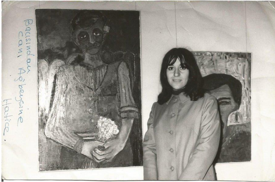
Şekil 2.26: Devlet Güzel Sanatlar Akademisi, İstanbul, Nisan 1968