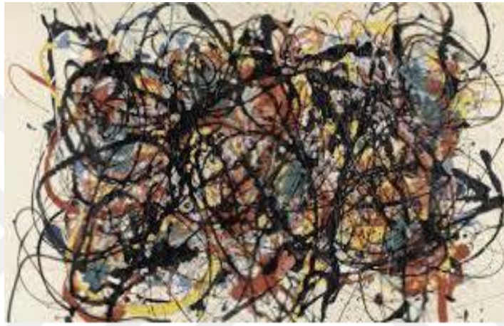
Şekil 2.10: Mike Bidlo, Pollock Değildir, Tuval Üzerine Yağlıboya, 30x60 cm, 1985

Bidlo, eserler arasında ilişkiler kurarak eski eserlerden yeni söylemler üreten bir başka sanatçıdır. Bidlo'nun metodu da S. Levine gibi postmodern dönemden Warhol ve çağdaş dönemin tanınmış sanatçıları arasında yer alan Brancusi, Duchamp ve Picasso gibi sanatçıların yapmış oldukları eserleri asıllarına uygun şekilde teknik ve biçime sadık kalarak yeniden resmetmektir. Picasso'nun eserlerini ürettiği eserleri ni "Picasso Değildir" şeklinde isimlendirmiştir. Brancusi'un 'Matmazel Pogany' adlı büstünü alçı kullanarak yeniden yapmış ve bunu da "Brancusi Değildir" diyerek sergilemiştir. Bunun dışında boyayı sıçratarak yaptığı soyut resimlerle tanınan Pollock'u da taklit etmiş ve ortaya koyduğu eserler için "Pollock değildir" demiştir.