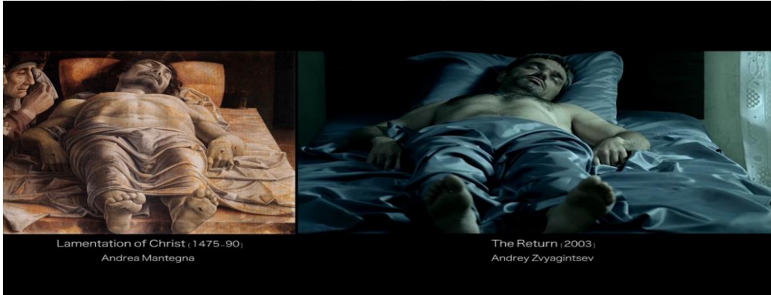
Şekil 2.17: Lamentation of Christ, 1475-90

El Jaleo tarafından 1882 yılında resmedilen John Siner Sargent adlı tablo, 1960 yılında John Wayne yönetmenliğinde çekilen The Alamo filminde adeta hayat bularak birebir yakınlıkta izleyiciye sunulmuştur.