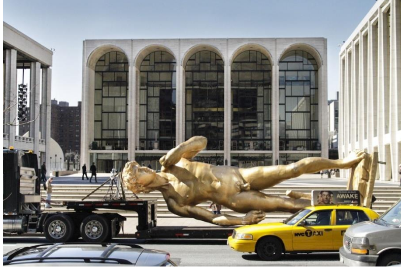
Şekil 2.23: Serkan Özkaya, David (Inspired by Michelangelo), 2006

Kaynak: http://serkanozkaya.com/p_davidi.html