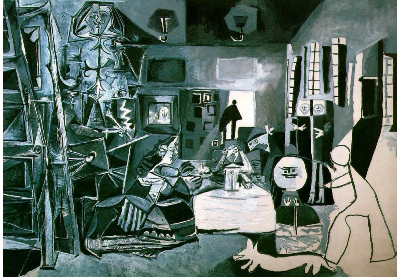
Şekil 2.3: Picasso Las Meninas after Velazquez (1957)