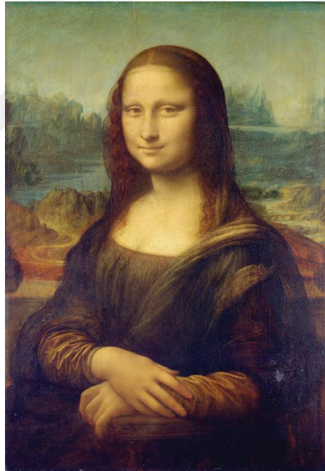
Şekil 2.8: Görsel Leonardo da Vinci, Mona Lisa, 1503-19

Bu eser dadacı bir tavrın ürünüdür ve eserde sanatsal bir form olarak geçmişle ilgili bütün estetik değerlerin, sanatsal fikirlerin ve eserlerin değersiz hale getirilip tenkit edildiği bir anlayış görülmektedir. Eserin karikatürize edilmesi yapılan müdahalenin mahiyetidir ve eseri komikleştirmektedir hatta bir şekilde değersizleştirmektedir. Ortaya konulan ürün bir anlamda poster olarak hazırlanana ve sanatçının emeğine gereksinim duymayan bir nesne konumundadır. Hazır nesne doğrudan Duchamp tarafından yapılan tanımlamaya göre “üretilmesi herhangi bir sanatçı gerektirmeyen bir iştir.” Bu aslında “bir başkaldırı eylemidir...” ve sanatçıyı yüceltmekten öte toplumda var olan statüsünü alçaltmaktadır. Bu durum bir anlamda santçıyı kutsal yapan şeyin aşağılanmasıdır (Lazzarato, 2017: 35). Fütürizm anlayışından Dadaizme evrilen sanat anlayışında Duchamp’ın anti-estetik, başkaldırı ve yıkıcı sanat çizgisinin ulaştığı nokta “Çeşme”dir (1917). Bu yapıttan ortaya koyduğu ve Fransızca okumasında “L.H.O.O.Q.” yani “Kızın yakıcı kalçaları var” ismini verdiği eserinde Mona Lisa’nın ismiyle de dalga geçmektedir.