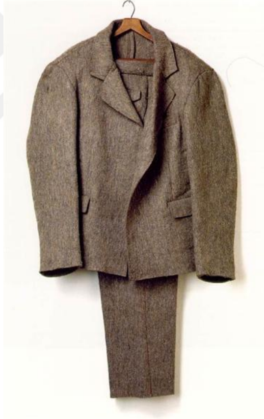
Şekil 2.1: Joseph Beuys, Keçe Takım Elbise, 1970

topluluğa hitaben üretilmesi bir eserin sanat eseri olup olmadığını belirlemede etkilidir. Danto ise bu kurama eserin metaforik olması ve sanat tarihi kapsamında anlamlandırılabilmesi unsurlarını ekleyerek kurumsal sanat kuramını bir nebze daha kısıtlandırmıştır. Beuys'un çalışması bu bağlamda değerlendirildiğinde İkinci Dünya Savaşı sonrası dönemin en etkili sanatçılarından biri olarak kabul gören, dünyaca ünlü müzelerde eserleri sergilenen, sanat alanında akademik çalışmaları ile de tanınan sanatçının sanat dünyasına hitaben sanat eseri ürettiği görülmektedir. Dolayısıyla keçe takım elbise Joseph Beuys'un elinden bir düşünce aktarmak amaçlı sanat izleyicisine sunulduğu için bir sanat eseridir. Eserin Danto'nun kuramına da uyduğu görülmektedir. Sanat tarihi bağlamında heykel sanatına ve minimalizm sanatına gönderme yapmakta, dahası bir düşüncenin aktarımı şeklinde keçe kumaşı kullanılmaktadır.