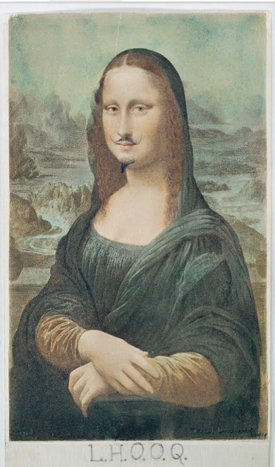
Şekil 2.9: Marcel Duchamp, L.H.O.O.Q., 1919