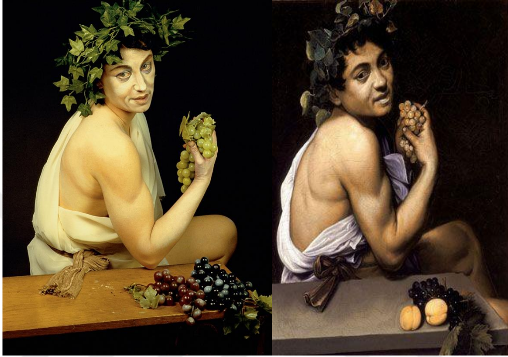
řekil 2.19: Cindy Sherman, İsimsiz, 1990

kompozisyona model olarak kendini yerleřtirdiđi eseri örnek verilebilir. Yapılıřından beř yüz yıl sonra bir yađlı boya resmin farklı biçimde farklı anlamlar barındırarak yeni bir form kazandıđı görölmektedir. Sanatçı izleyiciye göstermek istediđi gerçeđliđi sunmaktadır.