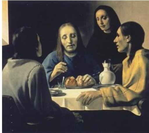
Şekil 2.7: Van Meegeren, The Supper at Emmaus, 1937