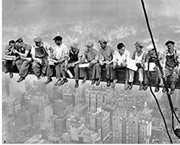
Şekil 2.21: Lunch atop a Skyscraper, Charles Ebbets, 1932

Kaynak: http://100photos.time.com/photos/lunch-atop-a-skyscraper