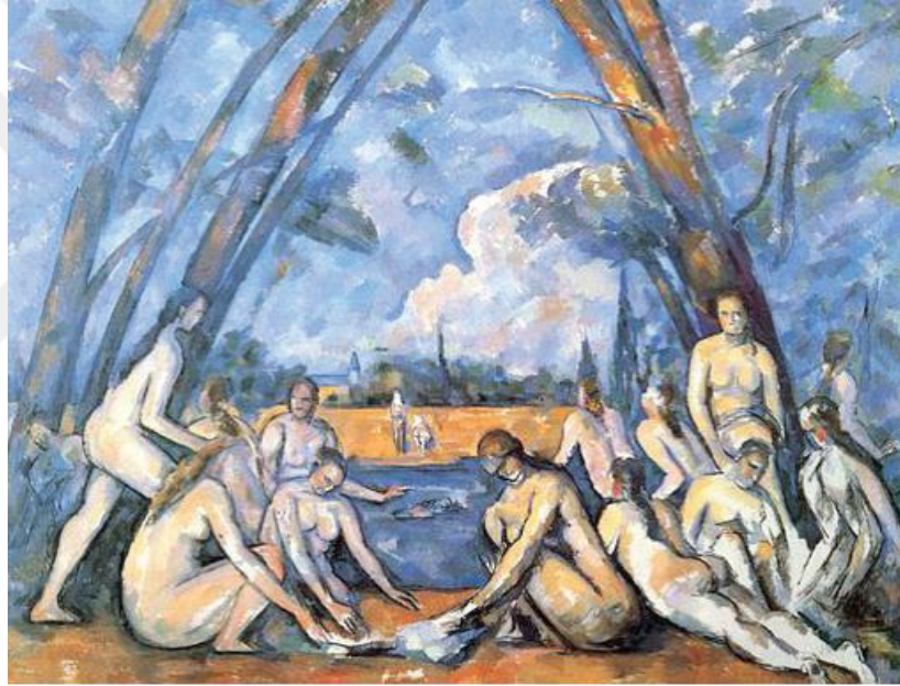
Şekil 2.11: Paul Cézanne, Büyük Banyo, 1906 civarı, T.Ü.Y.B., 208x249cm, The National Gallery, Londra

Cezanne, Picasso'nun kendi tanımıyla onun “tek ve biricik ustası”dır. “Avignonlu Kızlar” adlı eserini onun “Büyük Banyo” adlı eserinin etkisiyle yapmıştır. Bu eserle birlikte onun açtığı yolu daha da genişleterek ilerlemiştir. Zamanla üçlü bakış açısı çoklu bakış açısına dönüştürülmüştür. Bu yeni anlayışta temel geometrik formların daha da keskinleştiği görülmektedir. Picasso'nun Braque ile birlikte ortaya koydukları kübizm anlayışında teorik ve biçimsel yönünü oluştururken çıkış noktaları Cezanne'dir; ancak varılan nokta daha değişken bir yapı olmuştur.