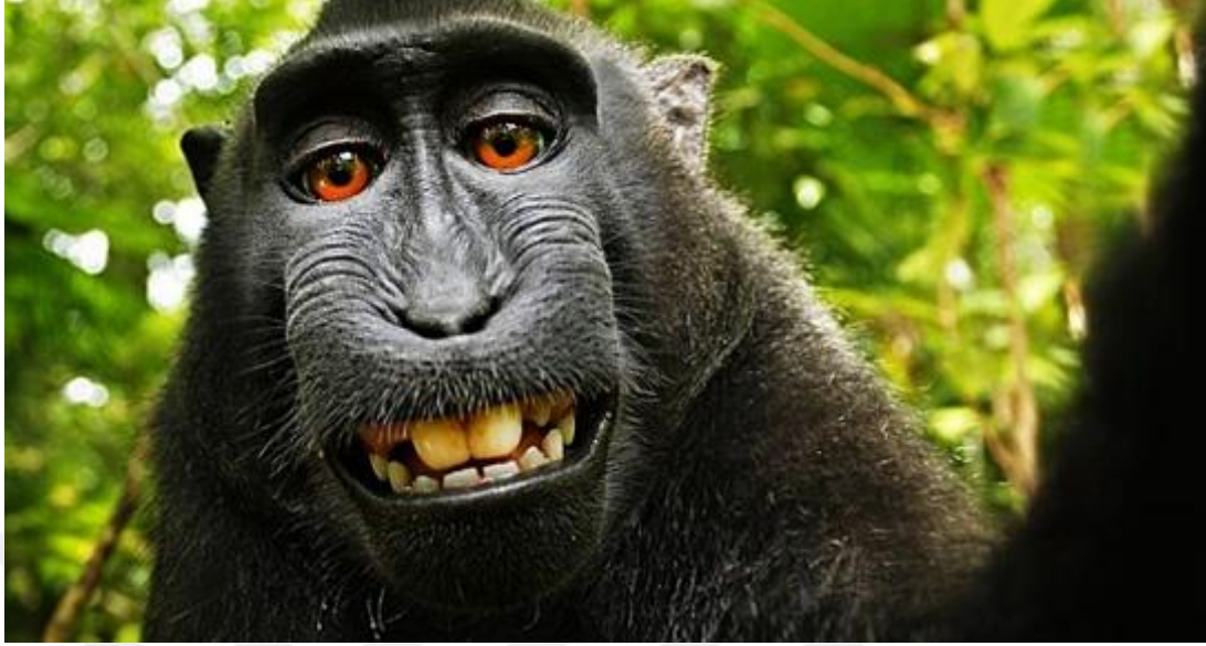
Şekil 3.1: 2011 David Slater, Naruta'nın Selfiesi

ilişkin tasarruf esas ve usullerini, yargı yollarını ve yaptırımlarıyla Kültür Bakanlığı'nın görev, yetki ve sorumluluğunu kapsamaktadır” hükmü şeklindedir.