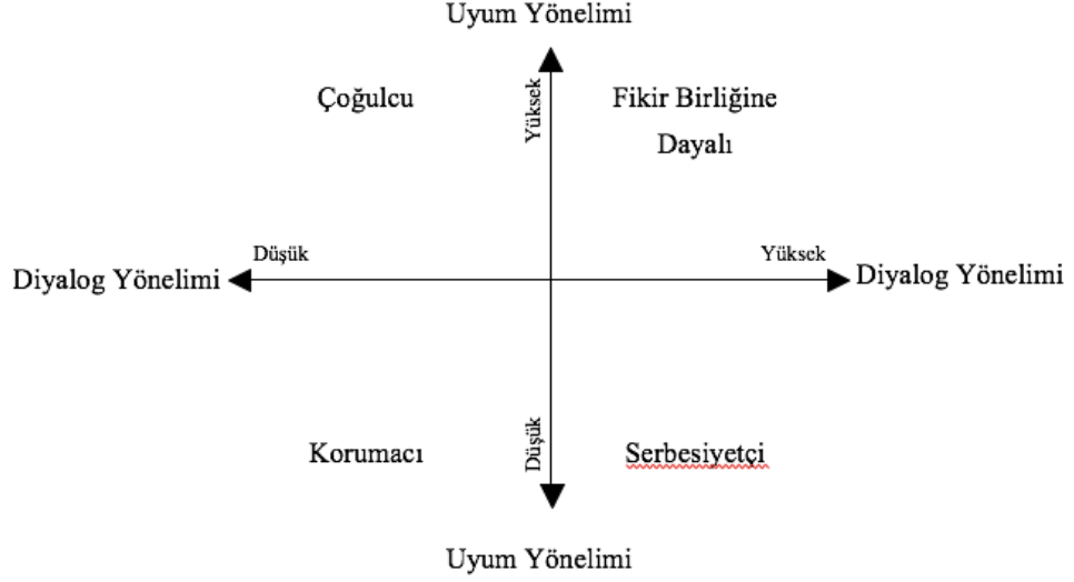
Şekil 2: McLeod ve Chaffee' nin Aile içi iletişim Kalıpları Aile Tipleri

McLeod ve Chaffee' nin Aile içi iletişim Kalıpları Aile Tipleri Şekil 2 de görülebilir.