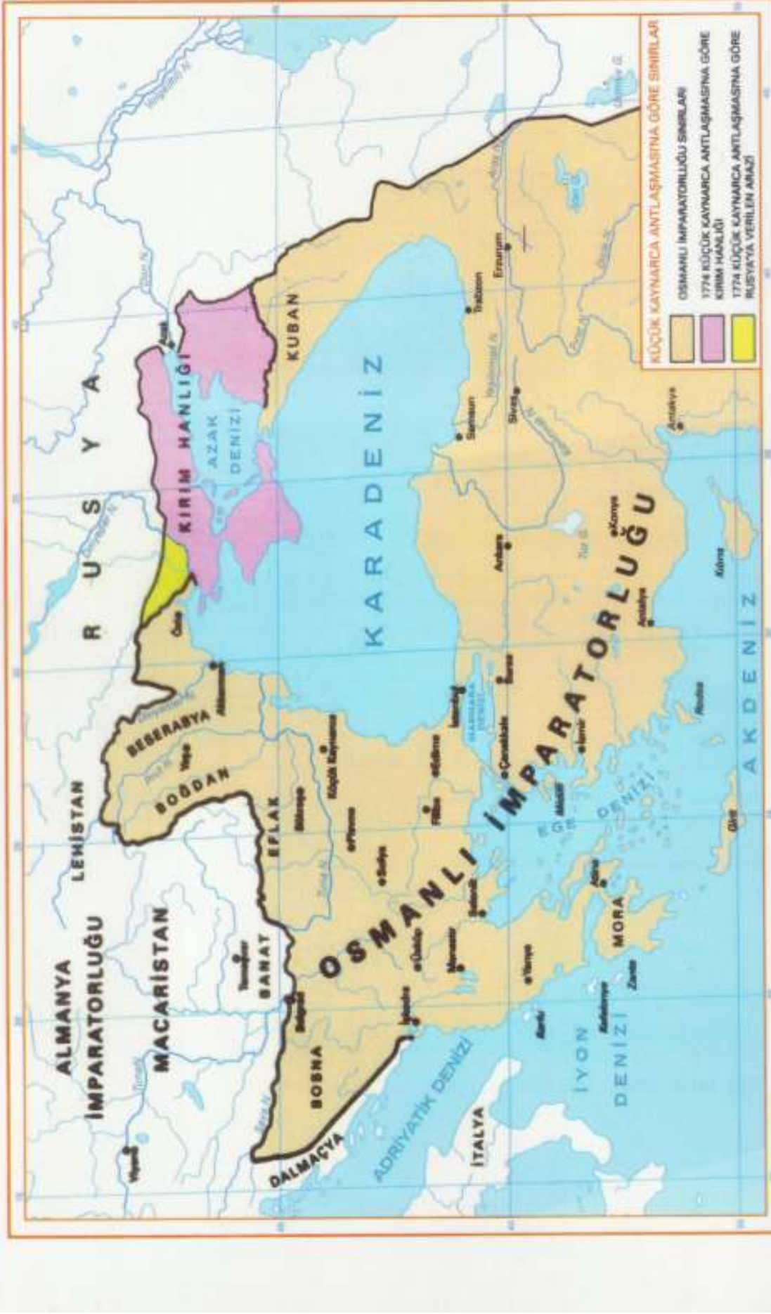
EK-III: 18. YÜZYIL SONLARINDA OSMANLI DEVLETİ