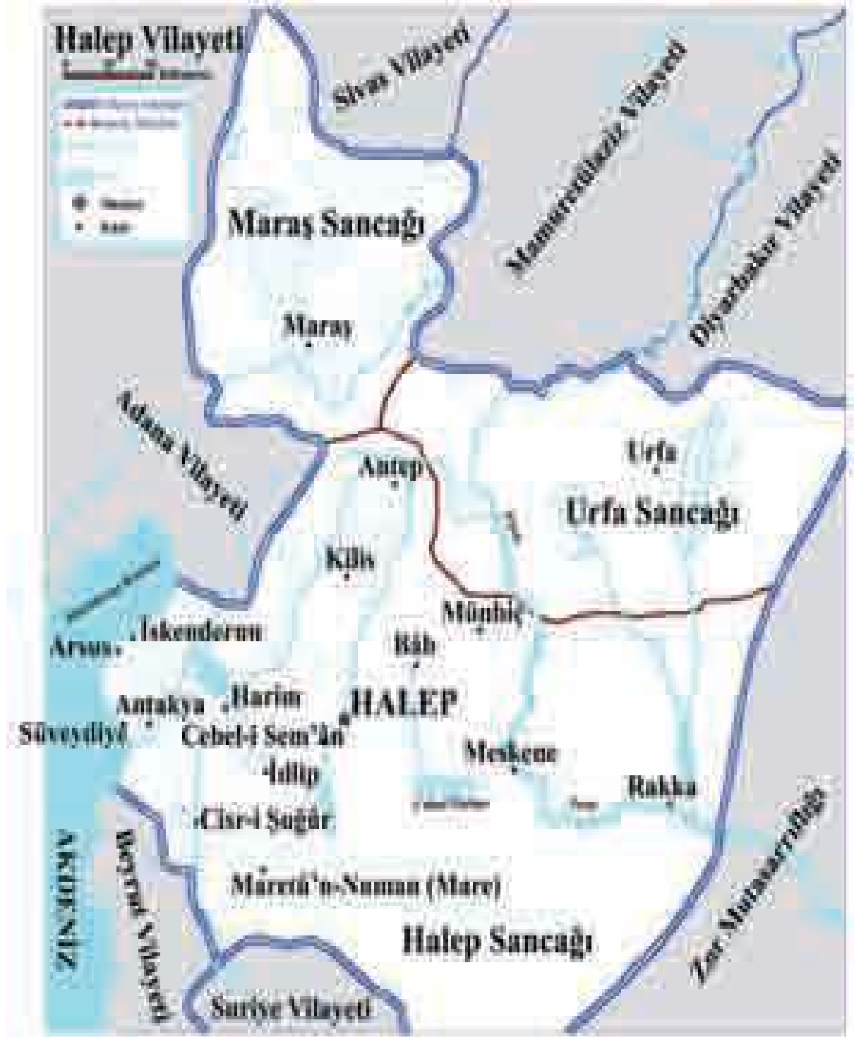
EK-IV: HALEB EYALETİ