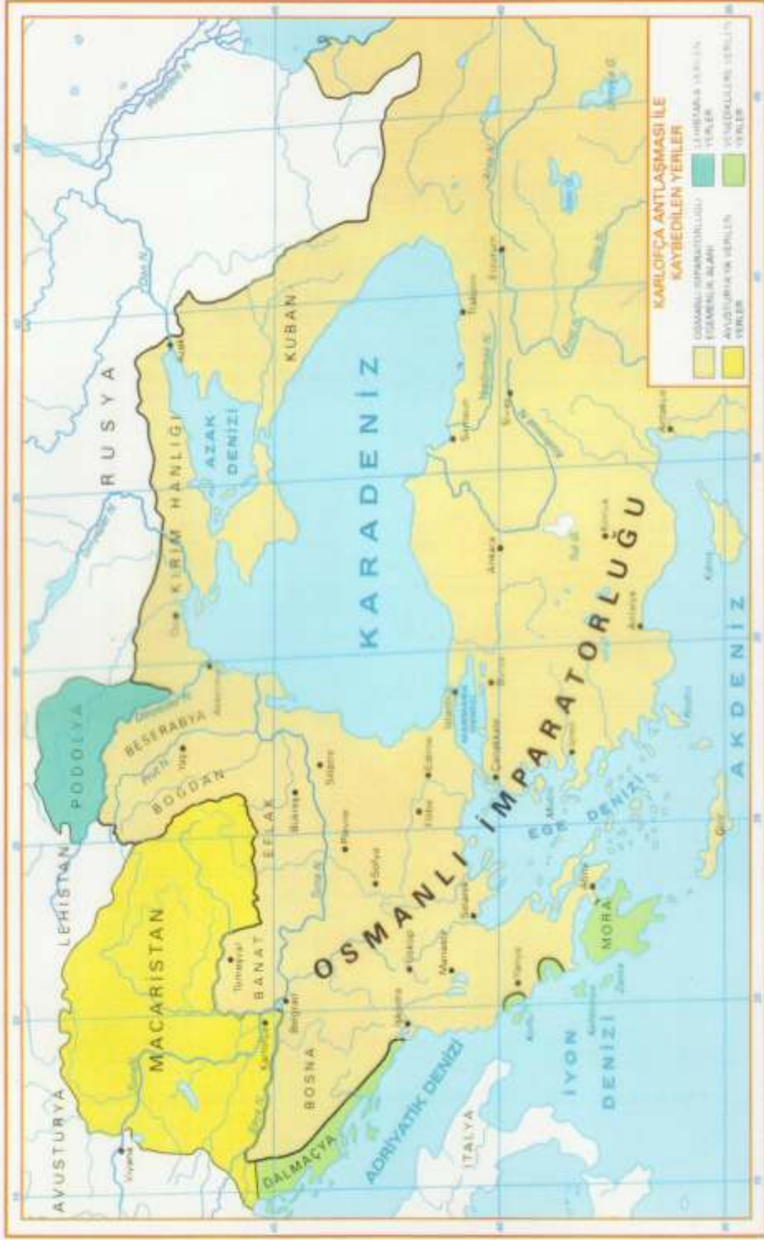
EK-II: 18. YÜZYIL BAŞLARINDA OSMANLI DEVLETİ