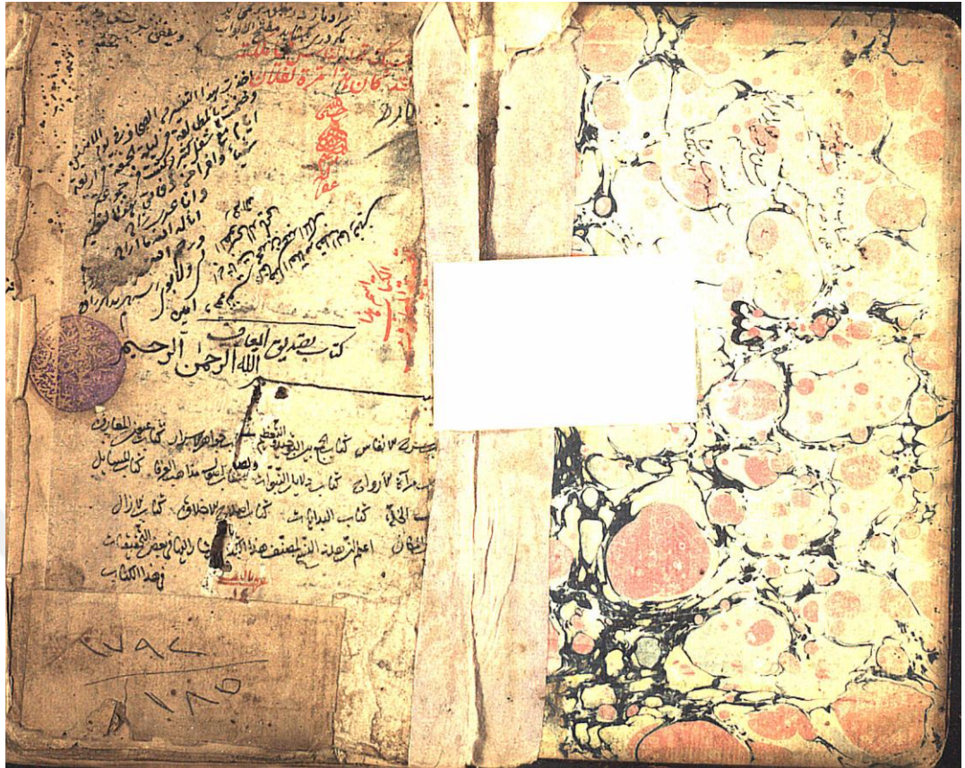
EK 4 Bağdatlı Vehbi Nüshası İç Kapak