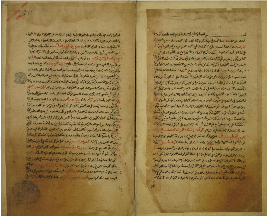
EK 7 Fazıl Ahmed Paşa İlk Sayfalar