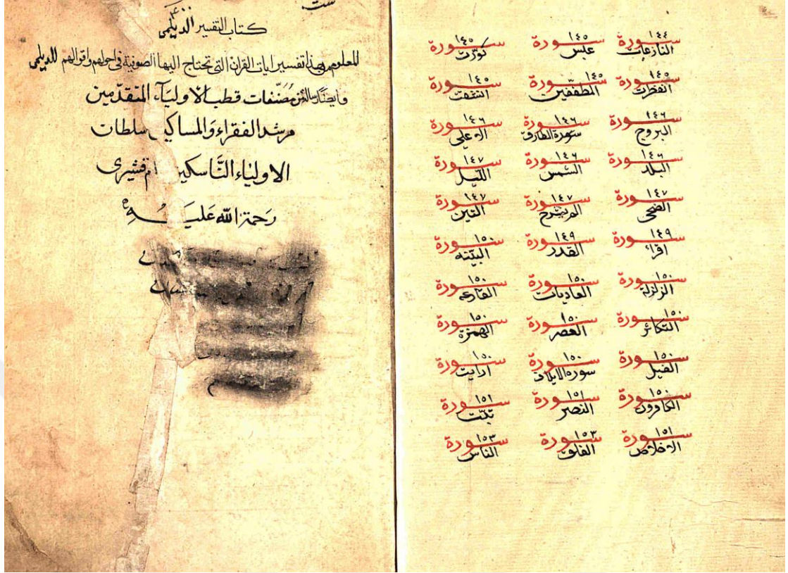
EK 1 Yeni Cami Nüshası İç Kapak