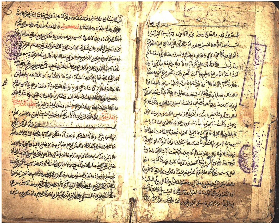
EK 5 Bağdatlı Vehbi Nüshası İlk Sayfalar