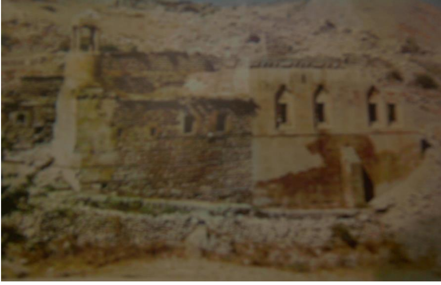
Şekil 7: Bozmekan Camii.