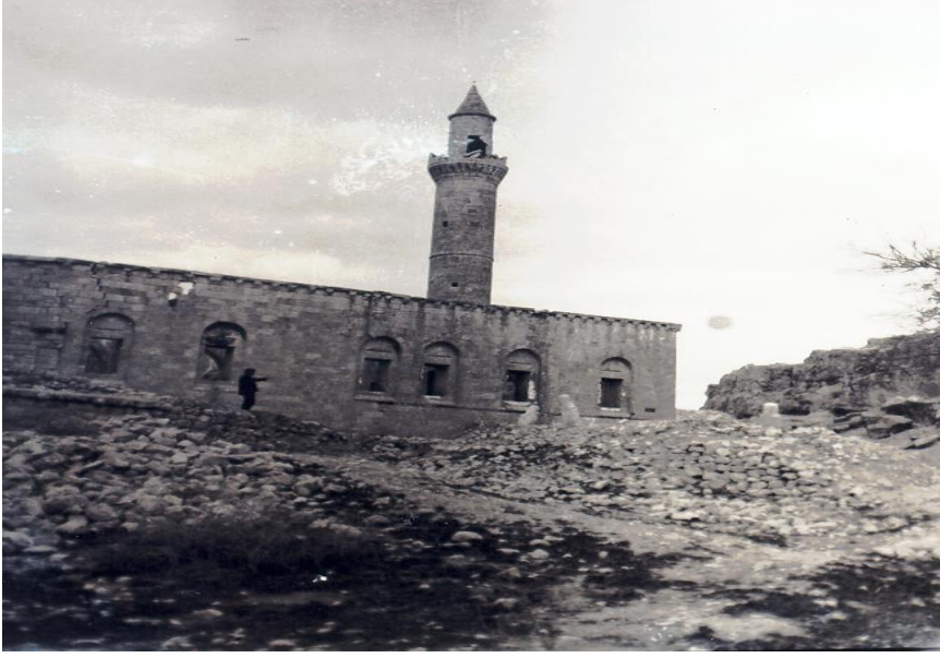
Şekil 15: Ulu Camii.