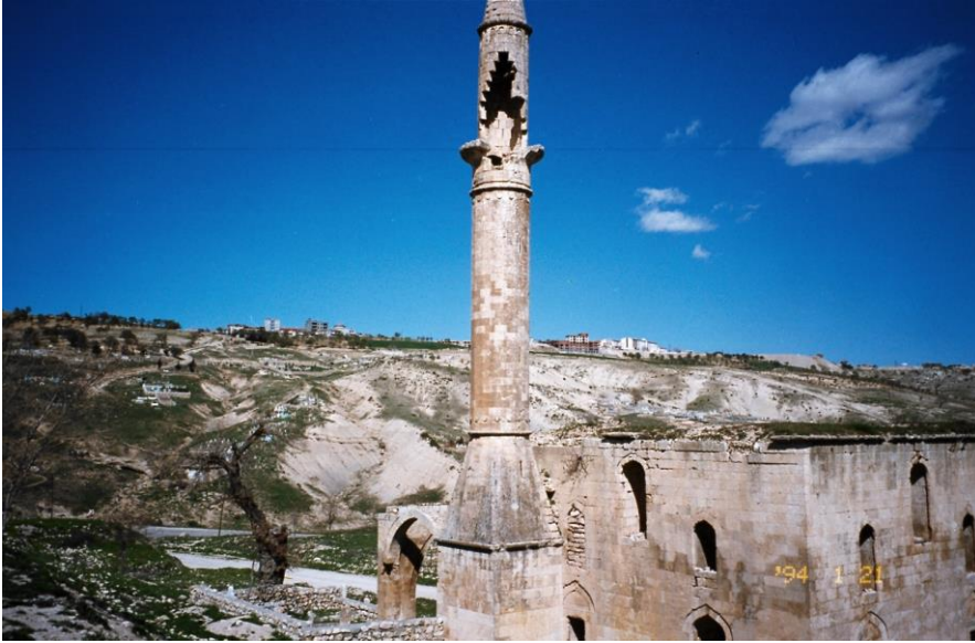
Şekil 10: Kurşunlu Cami'nin Eski Hali.