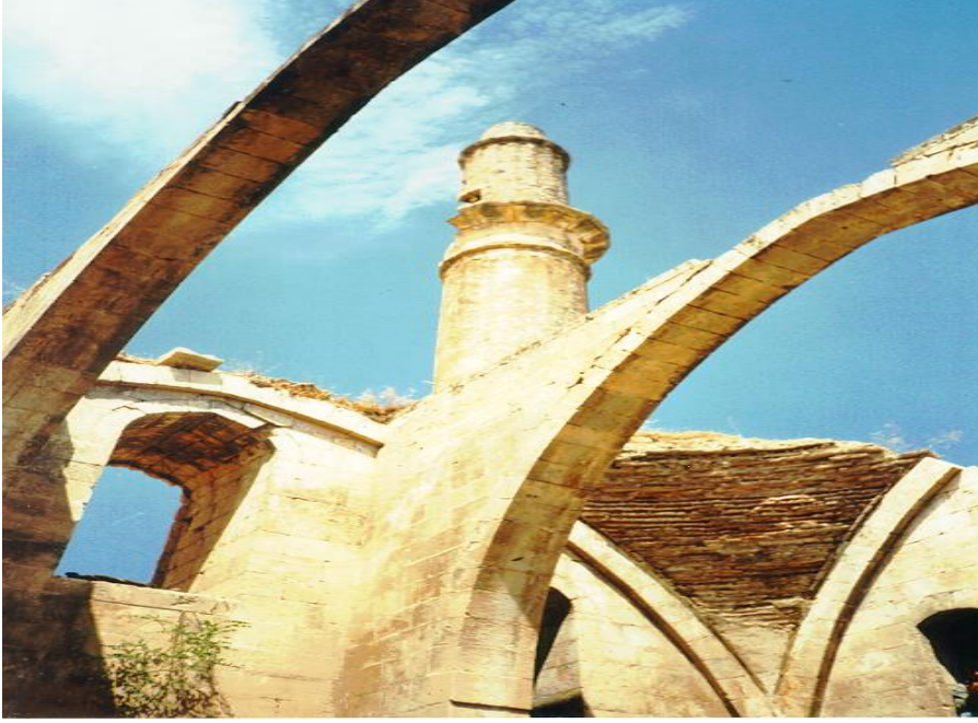
Şekil 11: Kurşunlu Cami'den bir kesit.