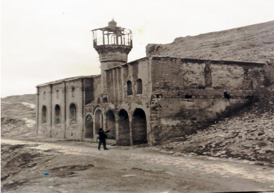
Şekil 8: Çarşı Cami.