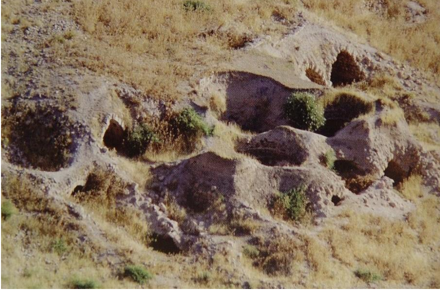
Şekil 17: Bekir Bey Hamamı Kalıntısı.