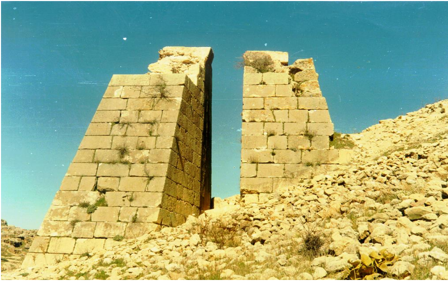
Şekil 6: Besni Kalesi Mancınıđı.