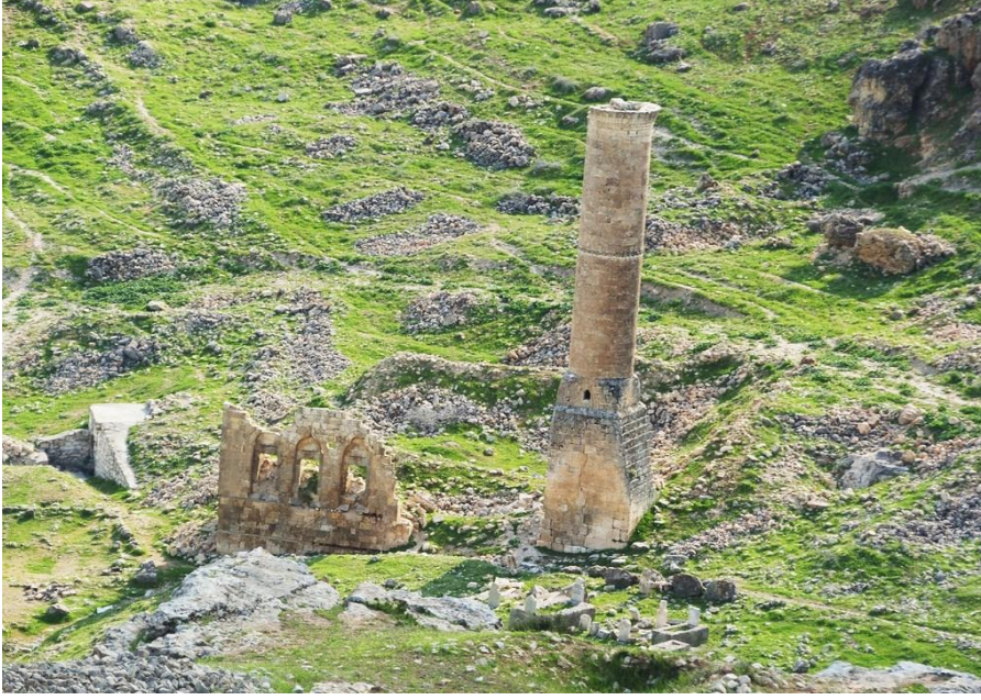
Şekil 9: Kızılcaoba Camii.