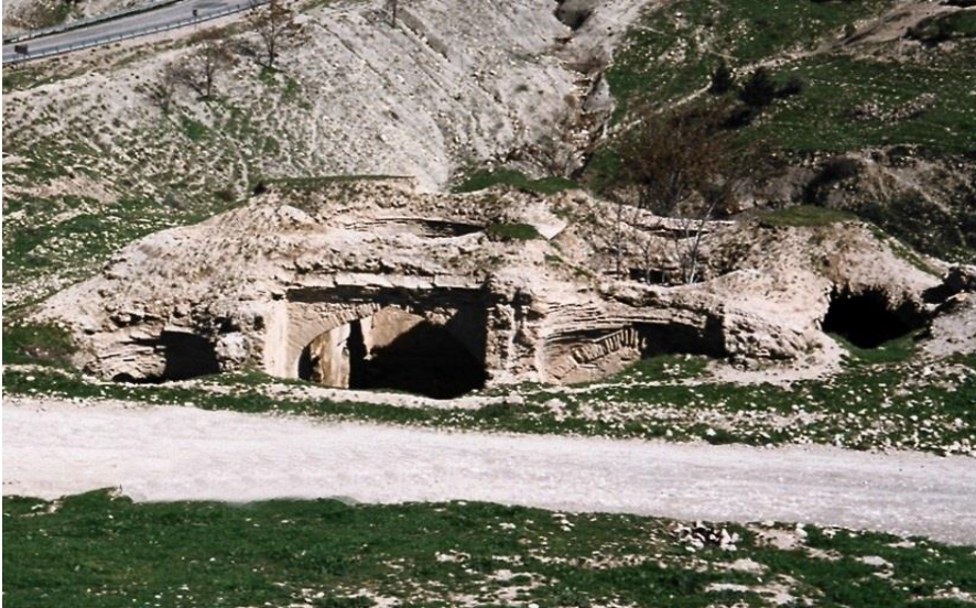
Şekil 18: Meydan Hamamı Kalıntısı.