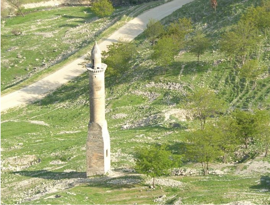
Şekil 16: Ulu Camii Minaresi