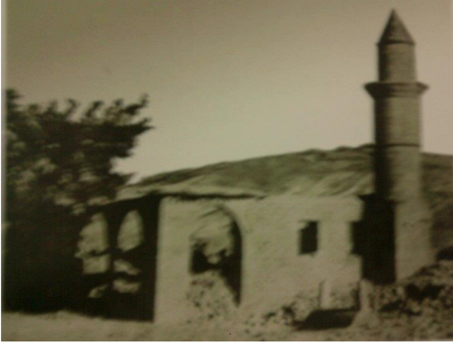
Şekil 14: Toktamış Camii.