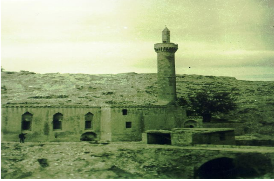
Şekil 13: Tahtaoba Camii.