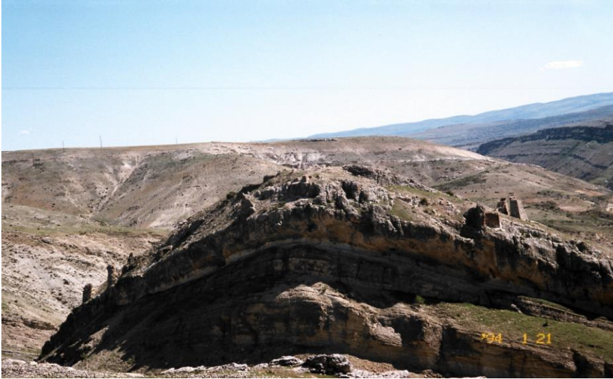
Şekil 4: Besni Kalesi'nin İnşa Edildiği Tepe