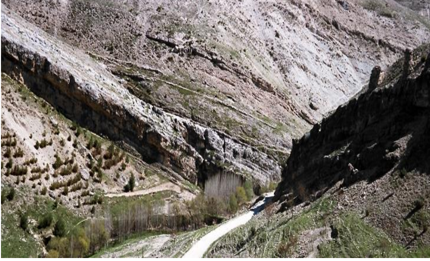
Şekil 5: Besni Kalesi Sur Kalıntıları.