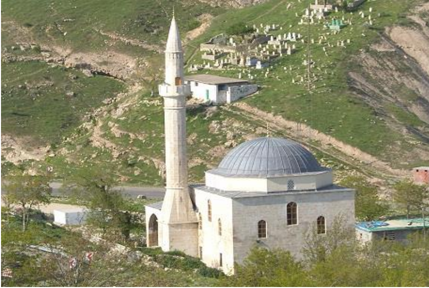
Şekil 12: Restorasyon Sonrası Kurşunlu Cami.