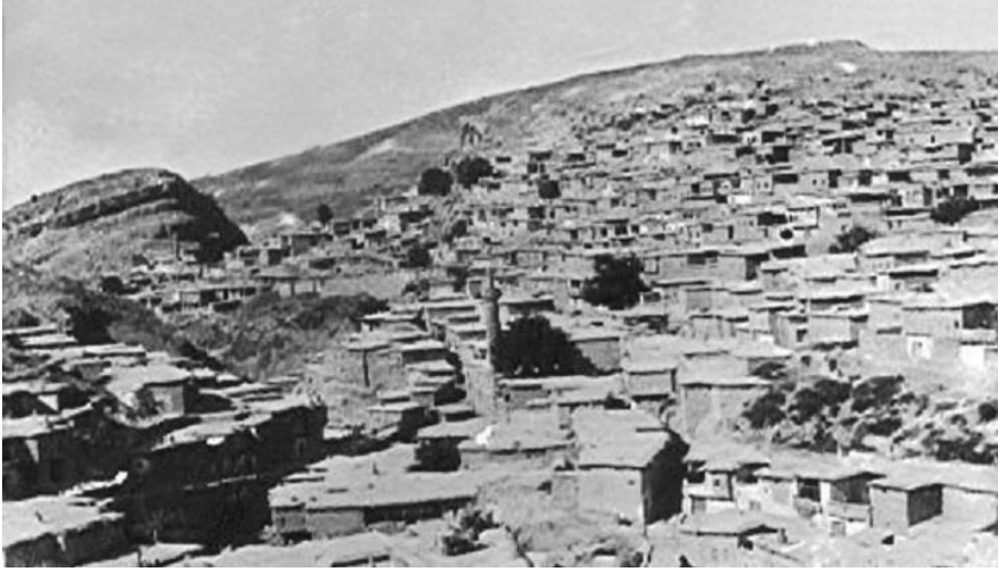
Şekil 3: Besni Kalesi ve Eski Besni.