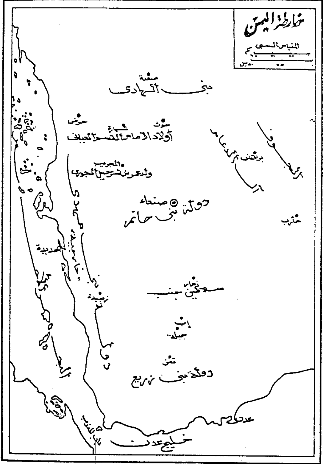
6.YILINDA YEMENDEKİ DEVLETLER