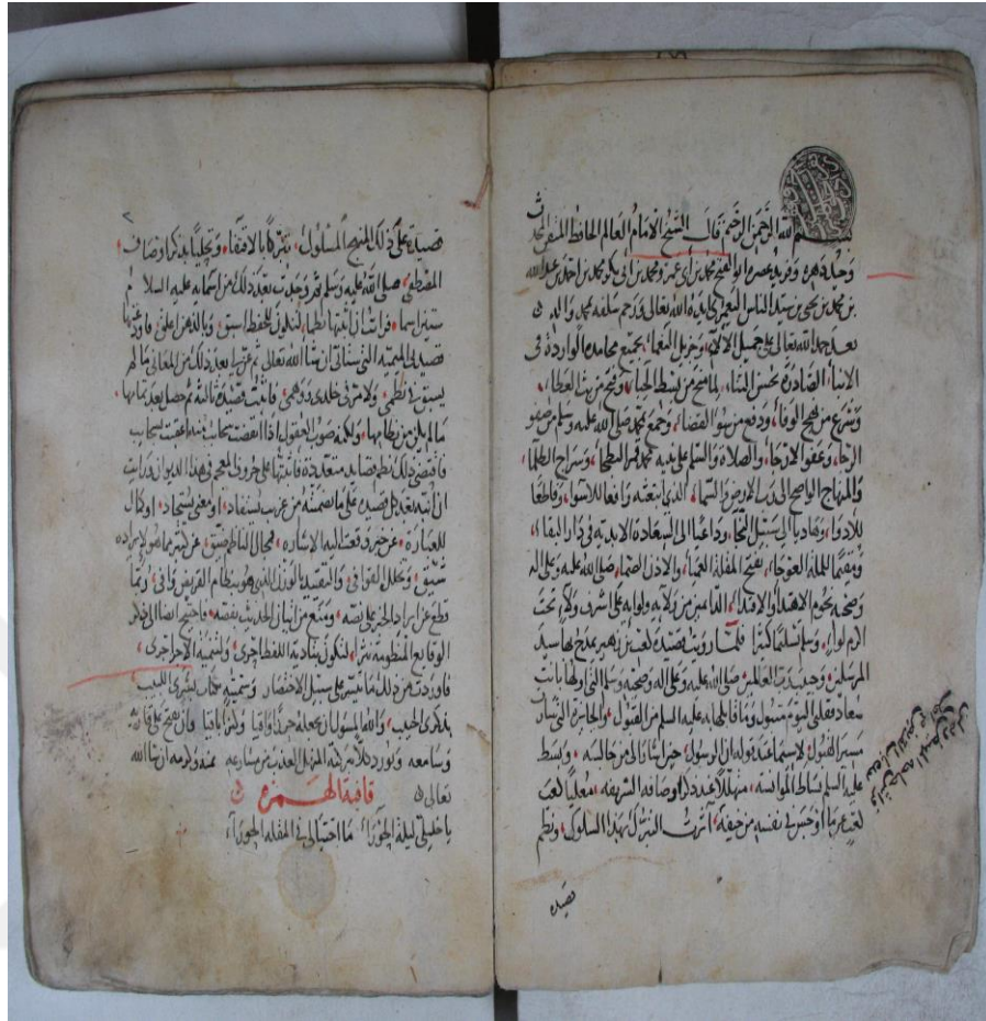
Büşra'l-Lebîb bi Zikra'l-Habîb'in İstanbul Süleymaniye Kütüphanesi (Karaçelebizâde Hüsameddin) 361 Numarada Kayıtlı Yazma Nüshasının 1-2 Sayfaları.