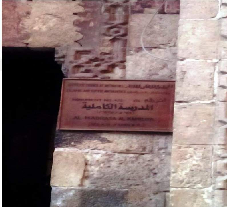
İbn Seyyidinnâs'ın Uzun Yıllar İlim Tahsil Ettiği Kâmilîyye Medresesi