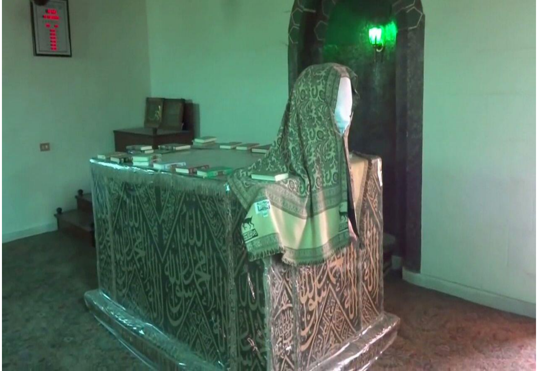
İbn Seyyidinnâs'ın Mezarı