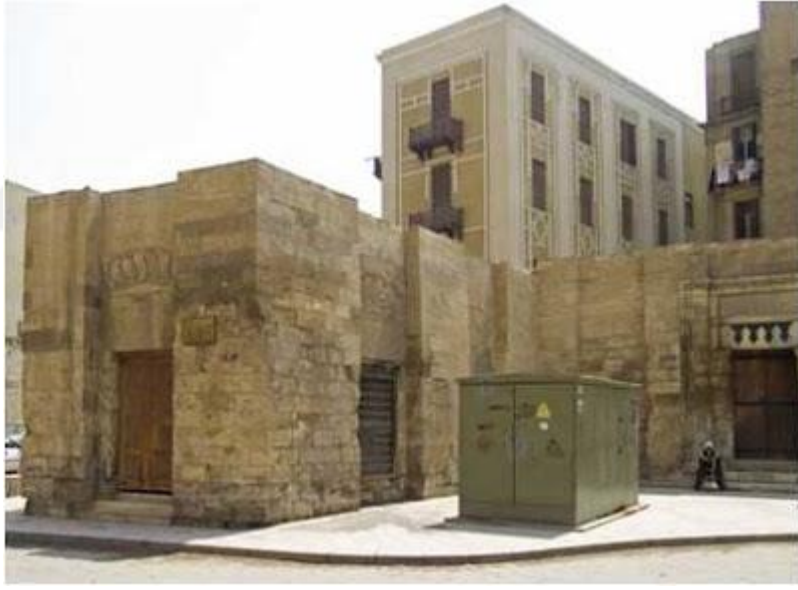
İbn Seyyidinnâs'ın Hadis Hocalığı Yaptığı Zâhiriyye Medresesi