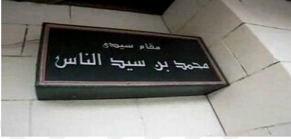
İbn Seyyidinnâs'ın Medfun Bulunduğu Türbenin Girişi