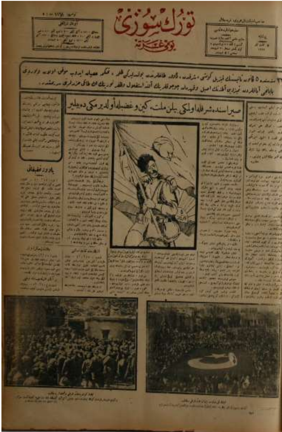
Adana Türk Sözü Gazetesi'nin "Adana'nın Kurtuluşu" Özel Sayısı (Adana Türk Sözü, 5 Kânûn-i Sâni 1928, s. 1)