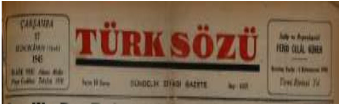
Adana Türk Sözü Gazetesi'nin 16 Eylül 1928 ve 17 İkinci Kânun 1945 Tarihli Yeni Harfli Nüshaları.