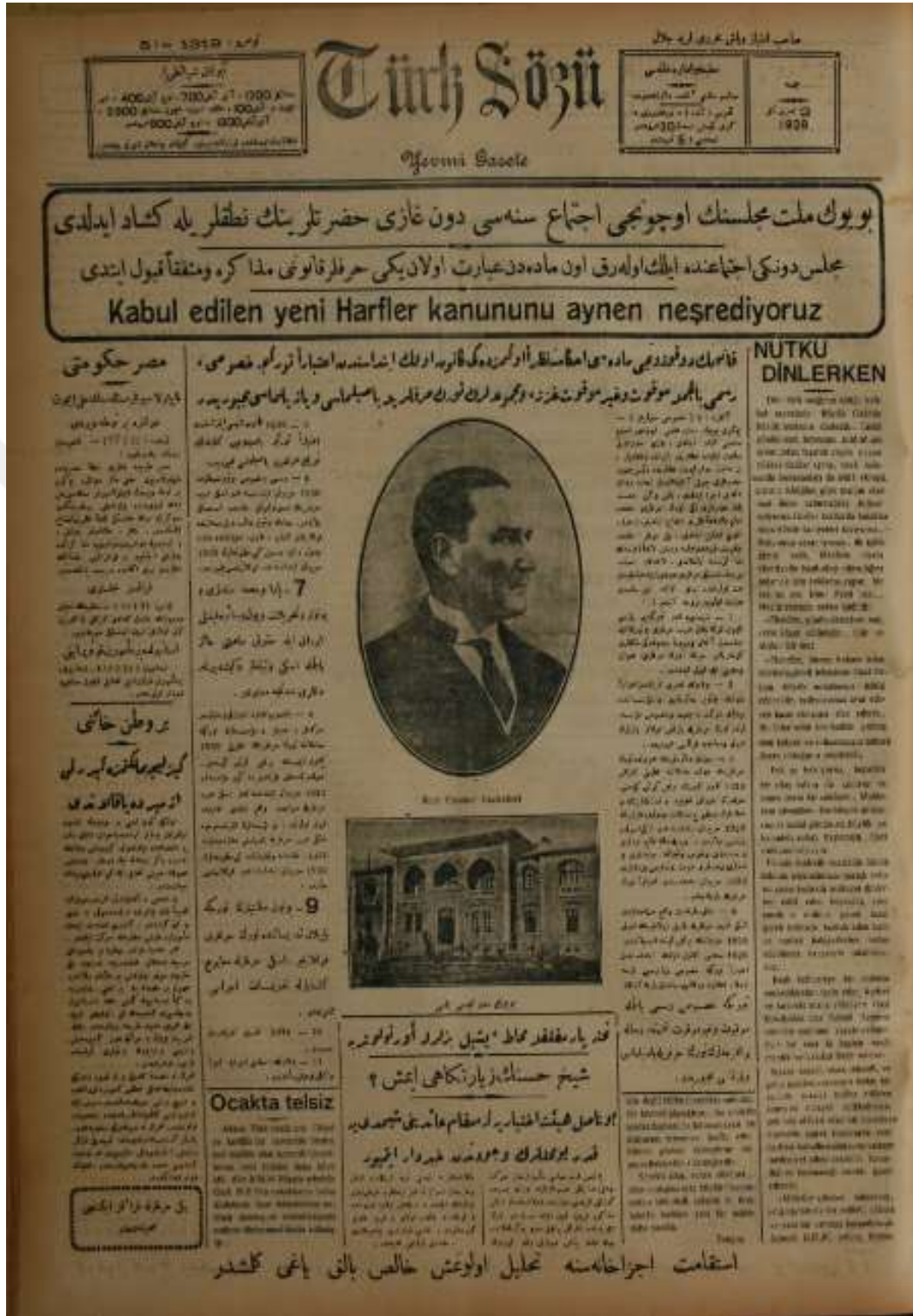
Adana Türk Sözü Gazetesi'nde Yeni Harf Kanunu'nun Tam Metni. (Adana Türk Sözü, 2 Teşrin-i Sâni 1928, s. 1)