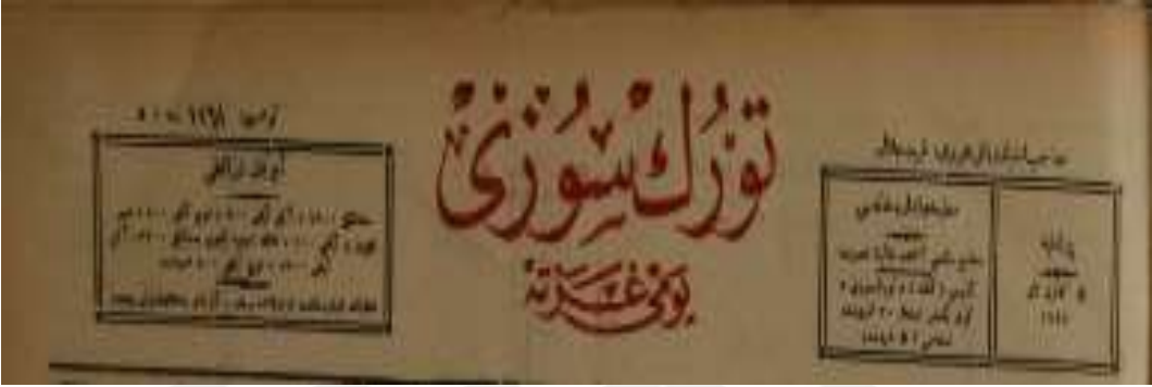
Adana Türk Sözü Gazetesi'nin 13 Kânûn-i Sâni 1924, 5 Kânûn-i Sâni 1928 Tarihli Eski Harfli Nüshaları.