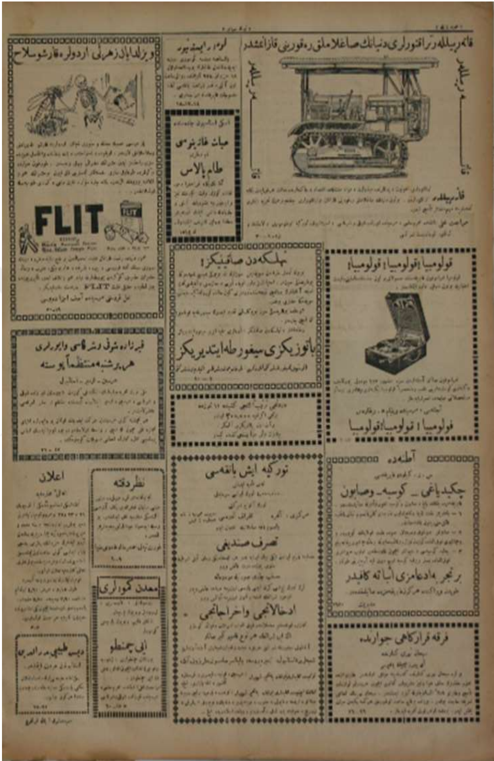
Adana Türk Sözü Gazetesi'nin Son Sayfası İlan ve Reklamlar. (Adana Türk Sözü, 19 Haziran 1928, s. 4)