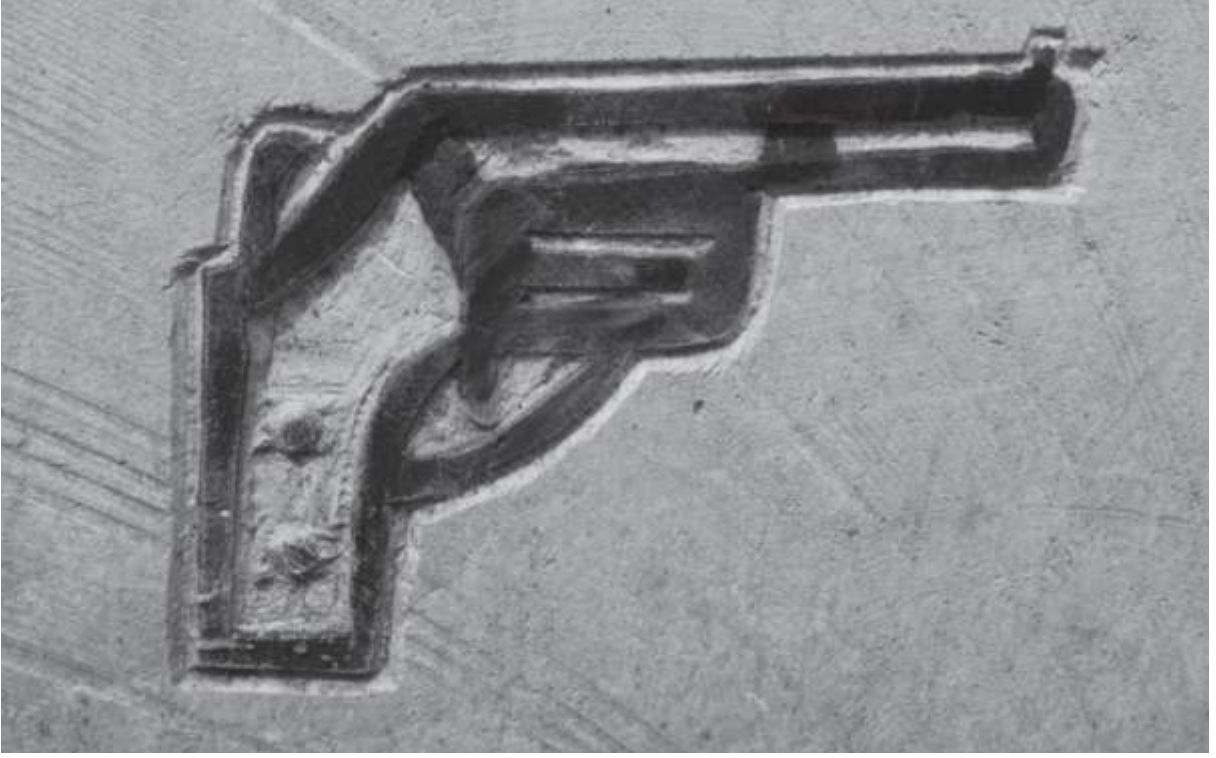
Resim 1b: Bir Silah Çiziminin Detay Görünümü