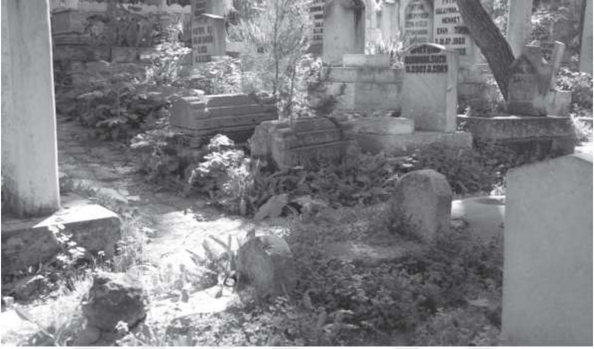
Resim 3: Yetişkin Mezarlarının Arasına Serpiştirilmiş Bebek Mezarları

Şanlıurfa'da çocuklar için farklı bir ölü gömme uygulamasının varlığı kent merkezindeki Harran kapı Mezarlığı ile Harran ve Viranşehir ilçelerinde açık bir şekilde ortaya çıkmaktadır. Harran kapı Mezarlığında bebekler için ayrılmış küçük bir bölüm vardır; aynı şekilde Viranşehir'deki Belediye Mezarlığı ve Yeni Mezarlıkta bebek ve küçük çocuklar için ayrılmış bir çocuk mezarlığı bölümü bulunmaktadır. Harran ilçesinde ise 6 yaş öncesi çocuklar için ayrılmış iki çocuk mezarlığı bulunmaktadır. Bu konuyu daha da ilginç kılan, tarihsel olarak çeşitli toplumlarda çocuklar için yetişkinlerden farklı ölü gömme geleneklerinin olmasıdır. Bunun ilk örneği erken üst paleolitik döneme (27-20 bin yıl önce) aittir. Bu dönemde yaş kategorisinin dikkate alındığı ve mezarın yeri ve hediyeler bakımından bebek ve çocuk gömülerine yetişkinlerden farklı muamele edilmiş olduğunun ipuçları vardır (Zilhão,2005:234).Çanak-Çömlekli Neolitik yerleşmelerinde ise daha belirgin bir uygulamanın varlığından söz edilebilir. Birçok Geç Neolitik toplumda, yerleşim içerisinde, konutların tabanlarının altına, ocaklara yakın bölgelere bebekler ve çocuklar gömülmektedir. Bu yerleşmelerde yetişkinlerin, özelliklede erkeklerin sayısı, çocuklarla karşılaştırıldığında