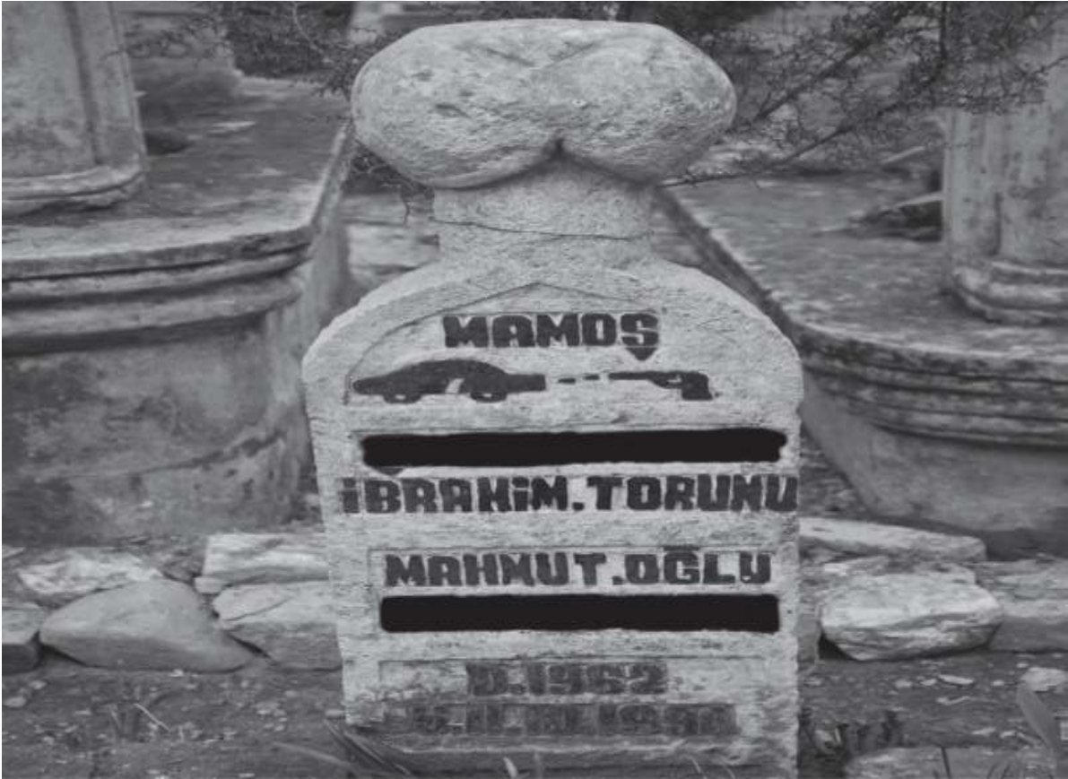
Resim 1a: Bediüzzaman Mezarlığında Silah ve Mermi Çizimi: Şahsın Silahla Öldürüldüğünü Göstermektedir.

Birçok anıtın paylaşımında bulunduğu diğer nitelikler, vefat edenin ya yaratıcıya veya orda olanlara olan nidasıdır. Farklı bir ifade ile vefat edenler birinci tekil kişi adıyla özünden, ailesinden, çocuklarından konu açmakta adında kalanlarla konuşmaktadır. Bulunduğu yerden gelip gidenlere ara sıra vefat sebebini ifade etmekte, serzenişi ifade etmekte, gücendiğini, şekvasını, kavuşma isteğini anlatmaktadır.