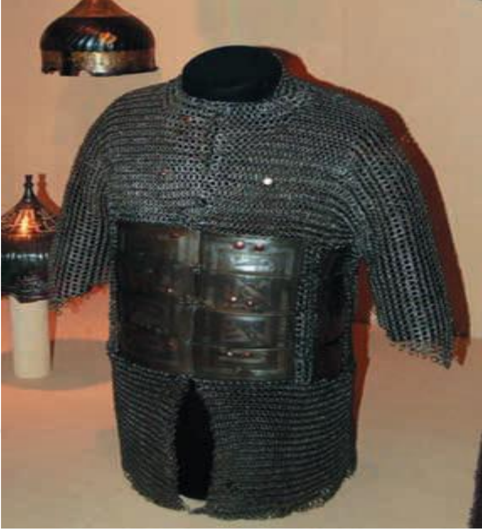
Ek-3. İran coğrafyasında 15. yüzyıla ait zincir zırh.

Sabuhi Ahmedov, “Akkoyunlu Askerlerinin Zırhları”, İrs Miras, no. 5, 2013, 40. http://irs-az.com/new/pdf/201302/1362060237499814443.pdf (Erişim tarihi 07.06.2020).