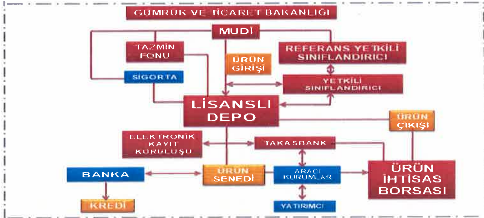
Şekil 2.1. Türkiye'de lisanslı depo sisteminin genel işleyişi

Referans yetkili sınıflandırıcılar, lisans başvurusunda bulunan yetkili sınıflandırıcıların tesisini ve laboratuvarlarını incelemekte ve periyodik olarak denetlenmelerini sağlamaktadırlar. Denetim sonuçlarını Ticaret Bakanlığı raporlamaktadırlar. İtirazlar sonucunda ürünlerin analizini yapıp, yetkili sınıflandırıcıların kalibrasyonunu, uygunluğunu, kontrol ve denetimlerini yürütürler. Referans yetkili sınıflandırıcılar Ticaret Bakanlığı tarafından lisanslarını almaktadırlar.