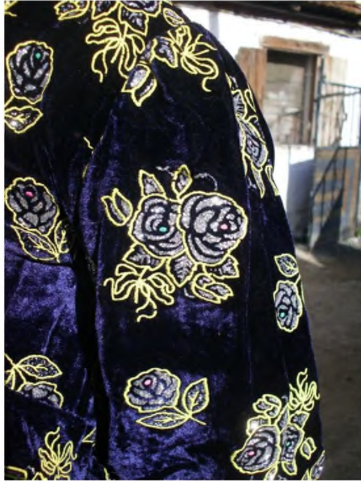
Şekil.2. Entari üzerine işleme

Ege bölgesi kadınların giydiği bir başka giysi ise şalvar üzerine giyilen belden yere kadar uzanan ‘peştamal’ adı verilen giysidir. Boyuna çizgilidir ve pamuklu kumaştan yapılmıştır. Denk olarak genellikle mor veya bordo kullanılır. Diğer alt giysi olarak her türlü hava şartlarına dayanıklı, kot türüne benzeyen, gök mavisi renginde olan ön bezi ‘‘gök bezi’’ giyilir. 18