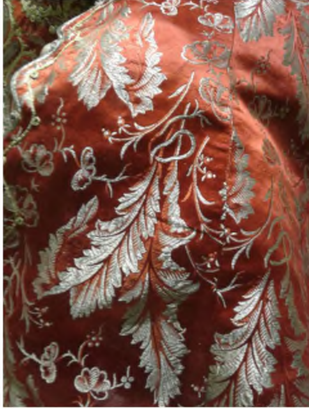
Şekil.28. Bitkisel Motifli Kumaş

Gerek doğada oluşum şekli gerekse stilize edilerek Türk Süslemesi motiflerinin en önemli çizgilerindedir. Bitkisel motiflerini Türkler, Orta Asya'dan Anadolu'ya kadar bezeme çalışmalarında sürekli kullanmışlardır. Osmanlı Döneminde ise bitkisel motif çalışmaları zirveye ulaşmıştır. 60