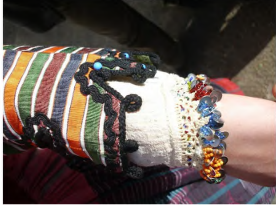
Şekil.35. Üç-beş Entari Kol Ucu İşlemleri

Üç-beş entari yöresel kadın kıyafetidir ve özel günlerde giyilir. Üç-beş entari yedi kattan oluşmaktadır. Ayağa önce top don giyilir. Top donun diğer adı ayakkabılık'tır. Top donın üzerinde yöresel işleme olan yaneşler vardır. Üzerine elbise şeklinde olan uzun kollu ipek entari şeklinde gömlek giyilir. Üç-beş entari giyildikten sonra üzerine kuşak bağlanır. Bu kuşak yünden yapılmıştır. 70