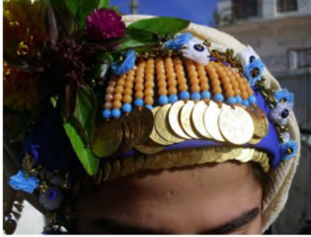
Şekil.52. Askılı Tura

Yeni evlenen genç kızların taktığı bir takıdır. Takkenin üst kısmından aşağıya doğru on beş sıradan oluşan kahverengi boncuklar dizi halinde sarkıtılır. Boncuklara 20'lik altınlar takılır. Gelinler bu askılı turayı dört- beş sene geçtikten sonra çıkartıp yerine tura takarlar. 83