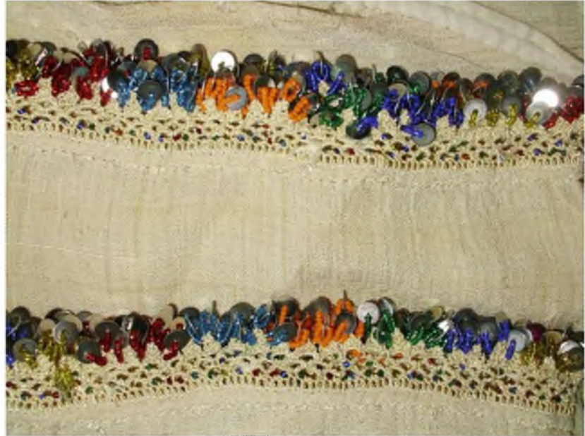
Şekil.34. Yen İřleme

Kaynak: (Sinan Şiverođlu, omakdađ Ky, Milas)