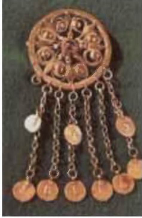
Şekil.27. Yanak Döven

“ Yanak Döven ” takılar ise baş kısımdan başlayarak fesin yan taraflarından sarkıtılan, yuvarlak, üçgen ve farklı semboller şeklindeki parçaları zincir ve boncuklarla birbirine tutturulan baş takıdır. Hareket halinde iken başın sallanması ile beraber takının yanaklara değmesinden bu adı almıştır. 59