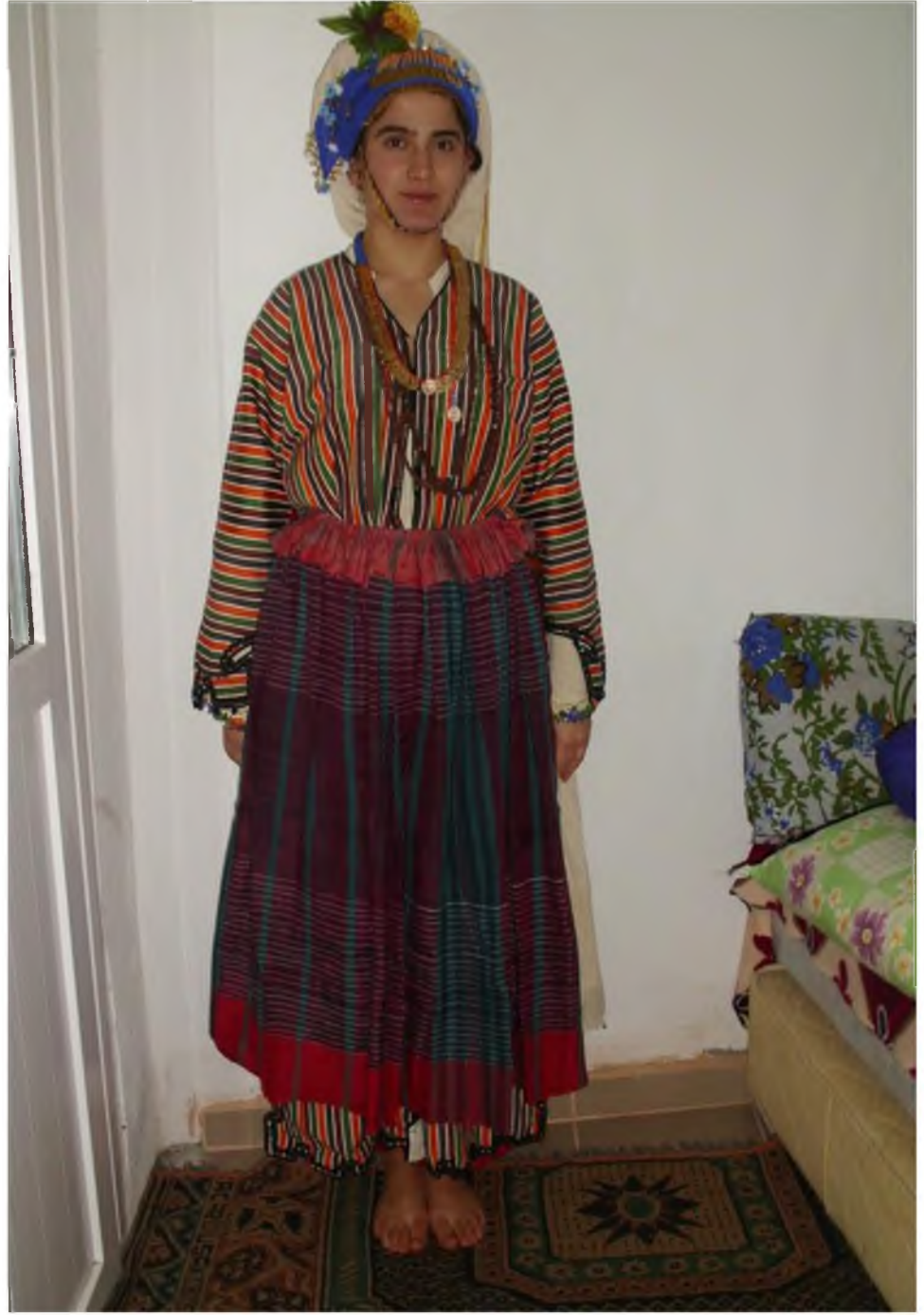
Şekil.36. Üç-beş Entari Ön Görünüş