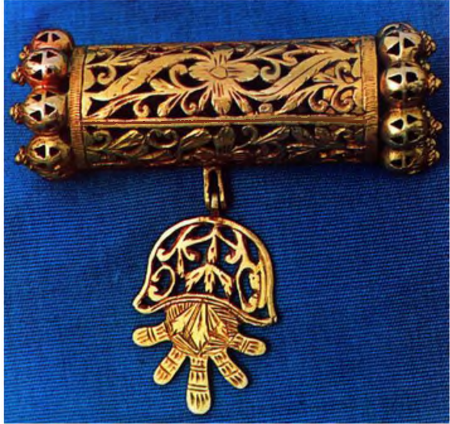
Şekil.31. El Motifli Kolye

Bir fikri ifade etmek ve temeli inanca dayanan sembolik ifadelerle gösterilen geleneksel motiflerdir. Ay yıldız, el motifi ve göz motifleri en çok kullanılanlardır. 63