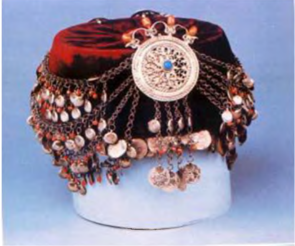
Şekil.7. Fes Süsü

Fes süsleri, fesin ön kısmından kenarlarına doğru uzanan zincirlere ve penezlere bağlanarak üçgen daire ve değişik şekiller oluşturularak yapılan takılardır. 23