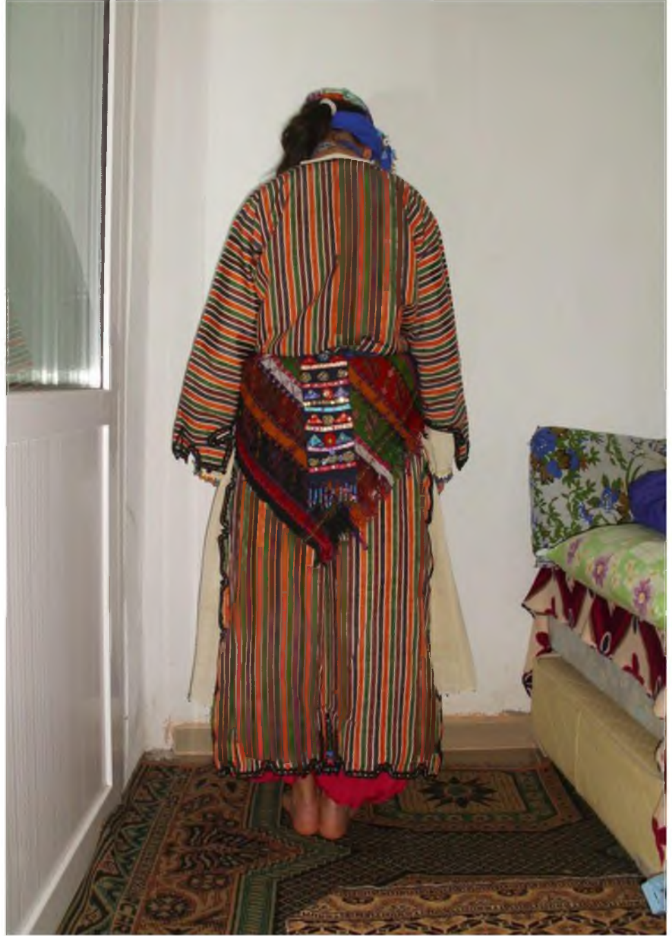
Şekil.37. Üç-beş Entari Arka Görünüş

Kaynak: (Sinan Şiveroğlu, Çomakdağ Köyü, Milas)