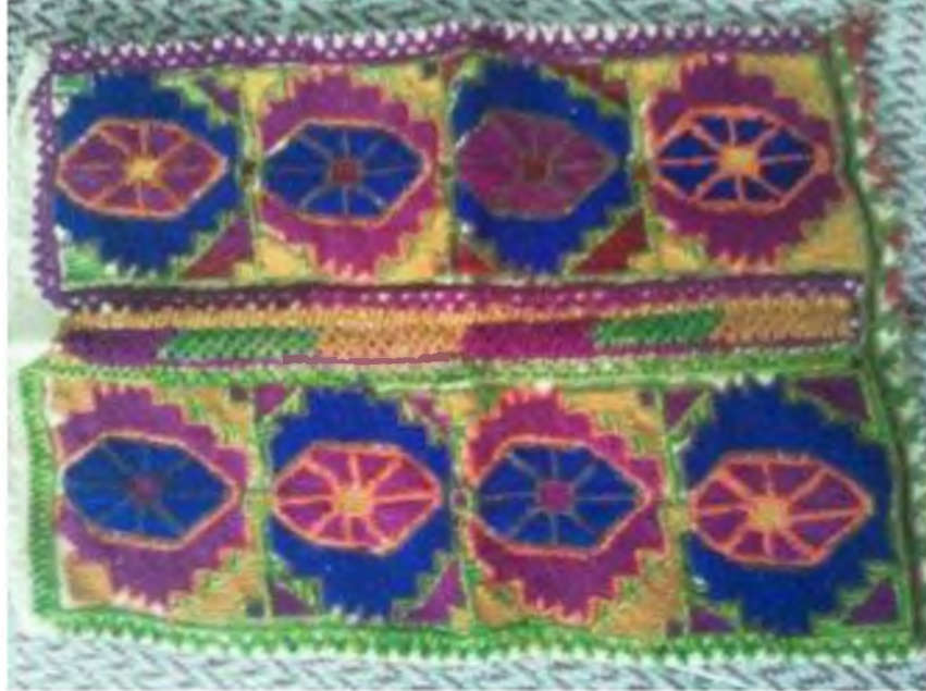
Şekil.46. Yaneş İşleme