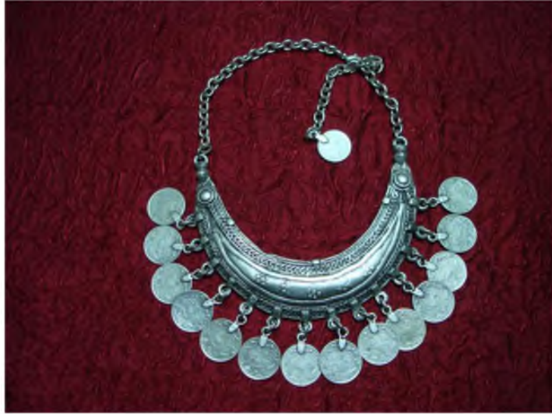
Şekil.12. Geleneksel Kolye

Kolyeleri mücevhere dönüştürmek için değerli süs taşları kullanılır. Taşlar genellikle oval ya da drop kesim şeklindedir. Taşlar merkezden başlayarak ve genişleyerek yerleştirilir. Kolyeler genellikle bileklik, küpe, broş ya da taç ile takım olarak tasarlanır. Bu tür setlere “parure”, genelde üç parçadan oluşan küçük setlere ise “demi-parure” adı verilir. Bu tür koleksiyonlarda parçalar set olarak kullanıldığı gibi ayrı ayrı da kullanılabilir. 29