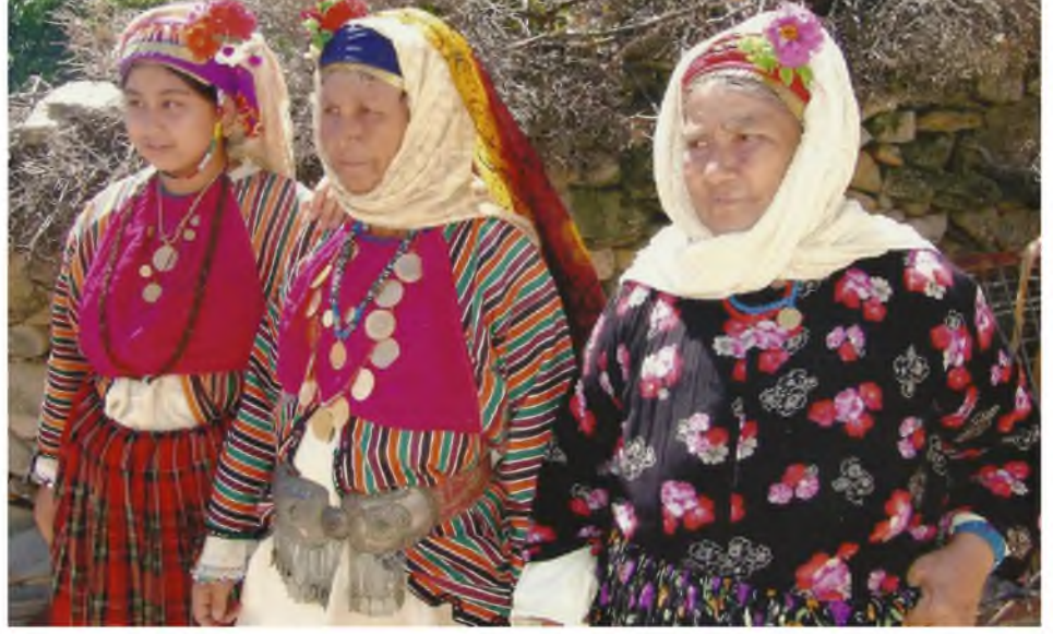
Şekil.48. Gümüş Kuşak

Üç-beş entarinin veya elbiselerin üzerine takılır. Gümüşün çeşitli tekniklerle işlenmesiyle ve gümüş başlıklarına renkli taşlar kullanılmasıyla elde edilir. Başlıkların alt tarafına zincirler yerleştirilir. Bu başlıklar kumaşın kısa kenarına işlenmektedir. 81