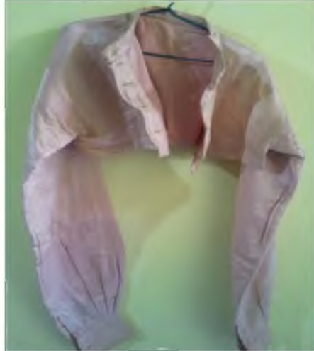
Şekil.64. Brmcek Gmlek,