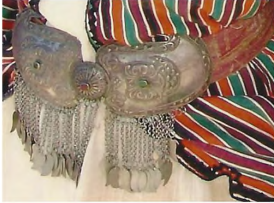
Şekil.14. Kemer Tokası

Giyimin vücutta kalmasını sağlamak veya sıkılaştırmak için kullanılan, deri, ip ya da metalden oluşan kuşaktır.