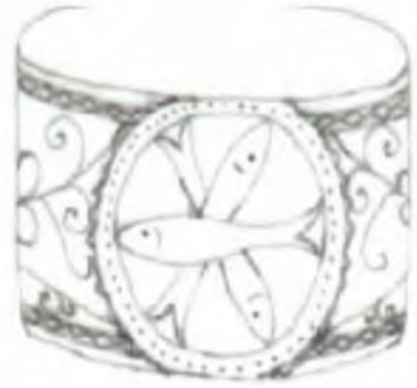
Şekil.30. Hayvansal Motifler