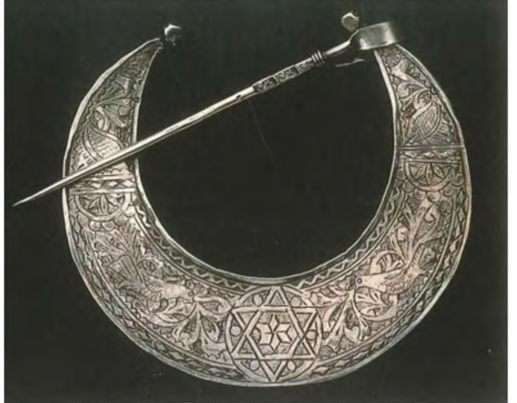
Şekil.29. Mührü Süleyman

Geometrik motifli çalışmalar Selçuklular döneminde çok fazla kullanmasına rağmen Osmanlı döneminde ise yavaş yavaş etkisini kaybetmiştir. 61