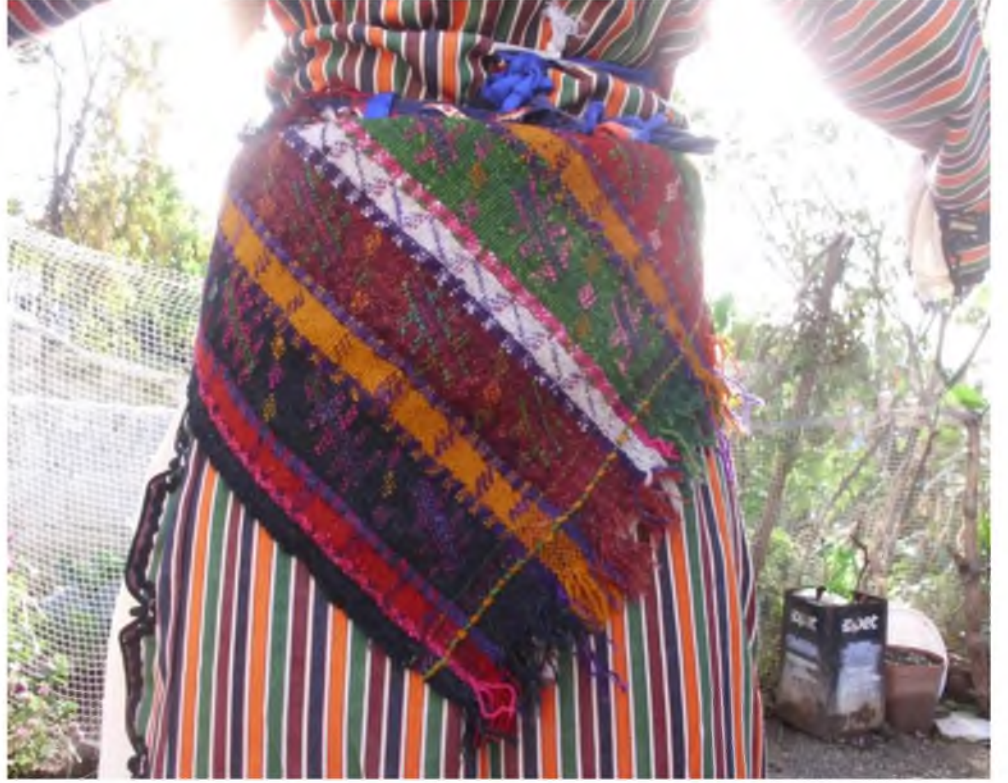
Şekil.41. Bel Kuşığı

Yünden yapılan değişik renklerle boyanmış üç-beş entarinin üzerine bağlanarak arkadan sarkıtılan giysidir. Üç-beş entarinin üzerine kuşak denilen kemer takılır. Yörük kuşağı olarak da bilinir. Bel kuşağının arkasına nazara karşı korunmak için bez üzerine çeşitli nazar boncuklarından oluşan ve uçlarına gümüş parçalar ile tamamlanan nazarlıklar takılmaktadır. 74