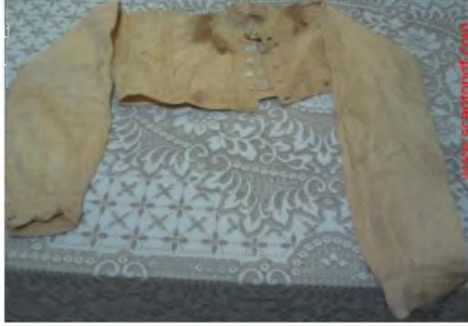
Şekil.63. Brmcek Gmlek,

Krem renkte olup uzun kolludur. Kollarında iğne oyaları bulunmaktadır. Yakasız ve yirik-dğmeli bir gmlektir. İpek, saf olarak kullanılırsa brmcek adı verilir. Eđer ipek-iplik karışımı kullanılırsa ‘yznakma’ adı verilir. 90