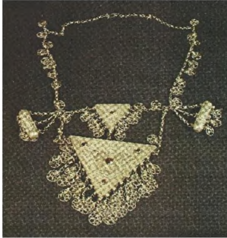
Şekil.25. Gagaklı Kolye

Süslenme için kullanılan takılardan biri olan “ gagaklı takı ” metal ağırlıkta olup, madeni gümüştür. Metal parçalar kanca yardımı ile birbirlerine tutturulur. Kanca şeklinde olmaları takının rahat kullanılması ve çıkarılmasını sağlar. Genellikle iki veya üç gagak’tan oluşur. Ortalarında portatif süslemeler bulunur. 57