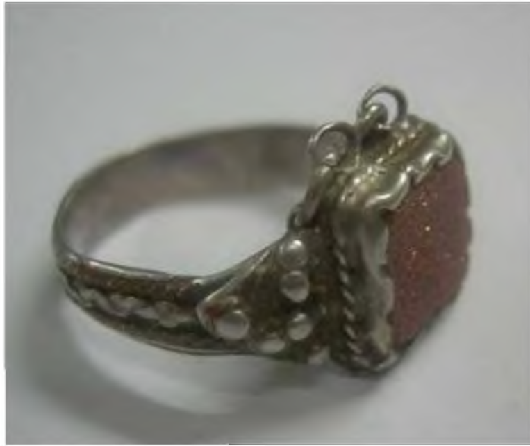
Şekil.17. Gümüş Yüzük

Kullanım açısından çok zor olan yüzüklerin yüzeyleri erken yıpranır. Yan yana iki parmakta kullanılan yüzüklerin yüzeyindeki çizgiler sürtünmelerden dolayı daha fazla ve derin olur ve yıpranmalara maruz kalır. Bu tür nedenlerden dolayı birkaç nesil kullanılmış yüzük bulmak çok zordur. 32