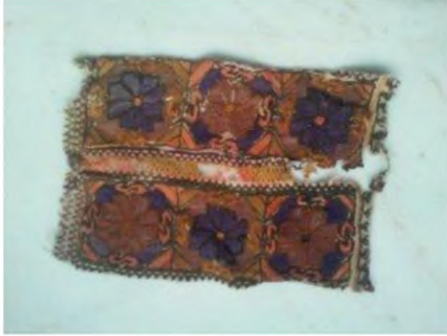
Şekil.45. Yaneş İşleme