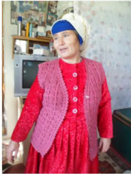
Şekil.1. Sokak Giysileri

Yörük kadınları ev içerisinde alta don adı verilen şalvar, üste zıbın adı verilen bluz giymişlerdir. Kışın pazen, yazın basma kumaşlardan dikilmiş şalvar giyilir. Şalvarın üstüne pazen veya basma kumaştan yapılmış olan bluz ve gömlekler giyilir. Bluzu gömleklerin üzerinde örgü hırkalar giyilmiştir. Diğer giysiler ise iç gömlek, zıbın ve içlik olarak giysiler kullanılmıştır. 17