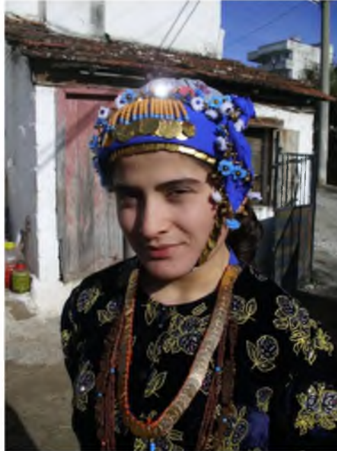
Şekil.53. Askılı Tura