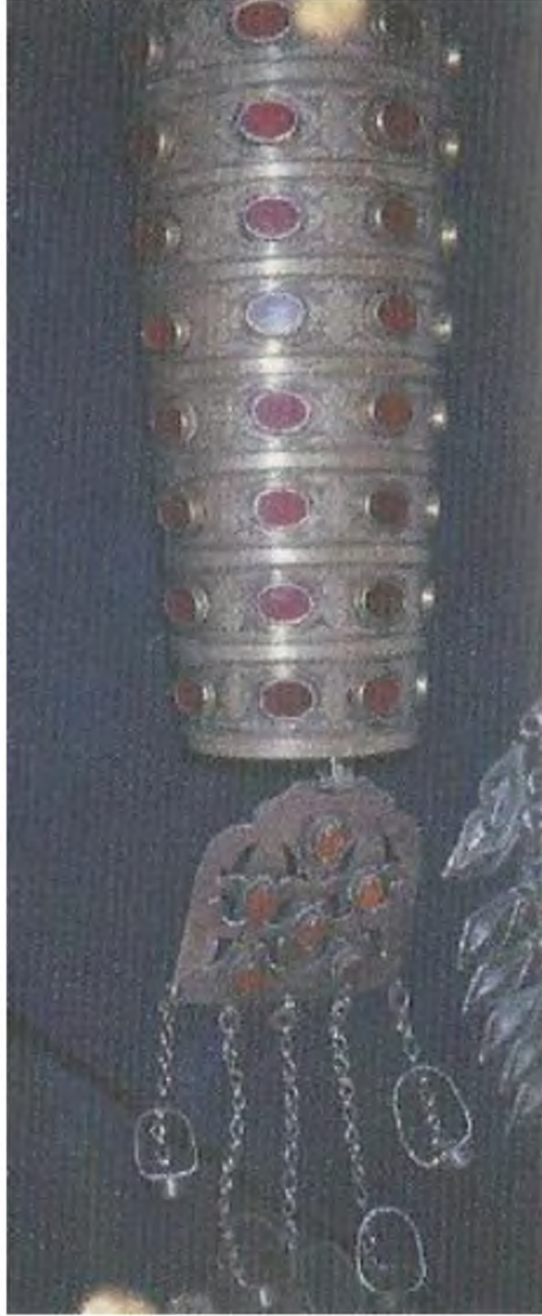
Şekil.21. Bilezik ve Köklü Yüzük

Yüzük olarak genellikle el gülleri kullanılır. Bereket getirmesi için yeni gelinler parmaklarına takarlar. Hızlı üremenin sembolü olan kurbağa sembollerine rastlanır.