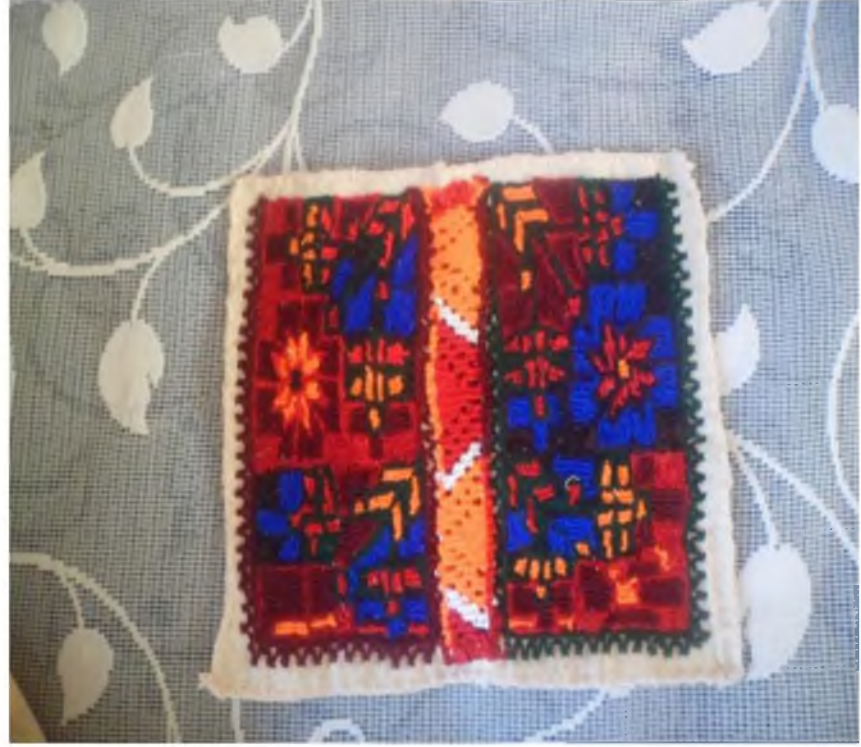
Şekil.43. Yaneş İşleme