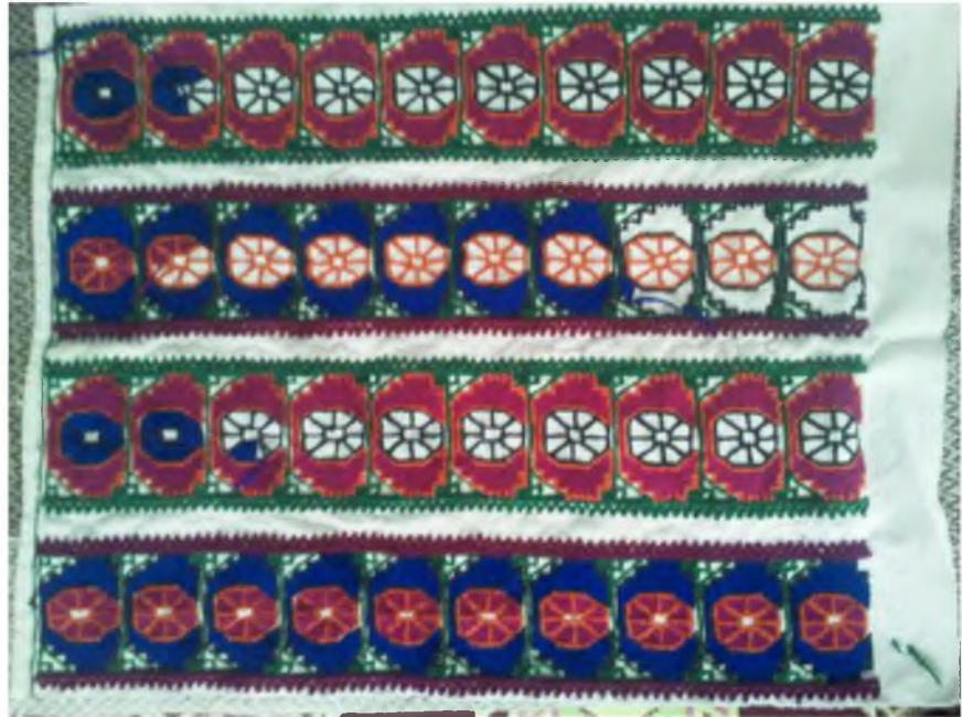
Şekil.44. Yaneş İşleme