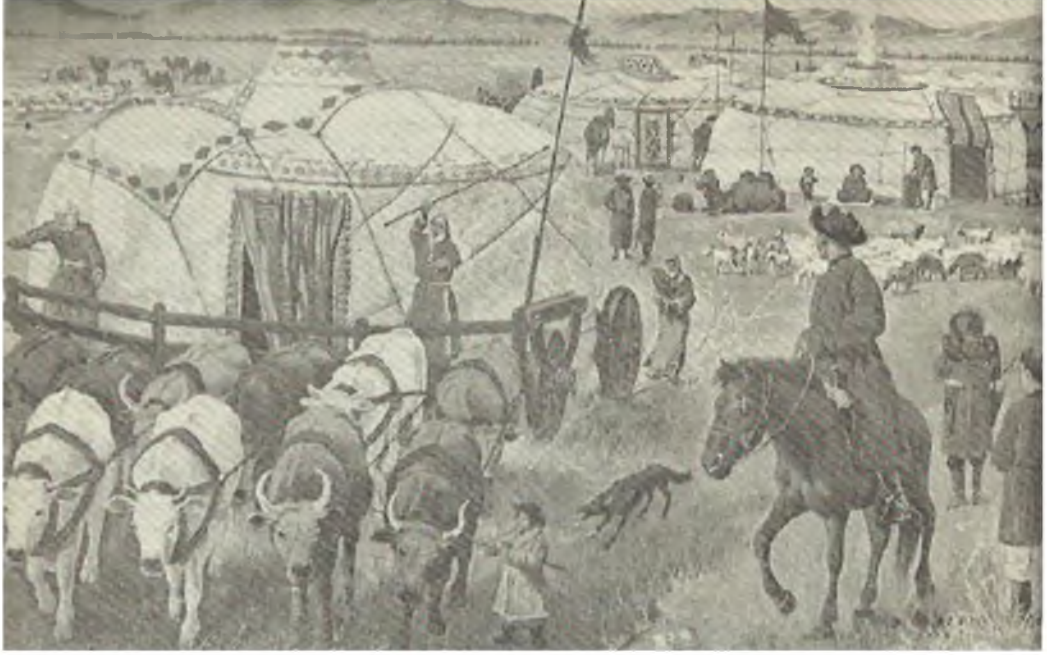
Şekil. 18. Türkmen Çadırı

Konar-göçer yaşayış tarzını benimseyen Orta Asya Türkleri barınak olarak sabit mekan yapmak yerine seyyar olarak kullandıkları çadırları seçmişlerdir. Sürekli hareket halinde olduklarından dolayı çadırlarda kalmaları yaşam tarzlarına uygun bir seçenektir. Hayvan kıllarından yapılmış olan çadırlara çeşitli isimler verilmiştir. Orta Asya bölgesinde “çum” veya “kapa”, değişik tipteki çadırlara ise ”loçik” (Anadolu’da ise Alaçık) denilmektedir. 41