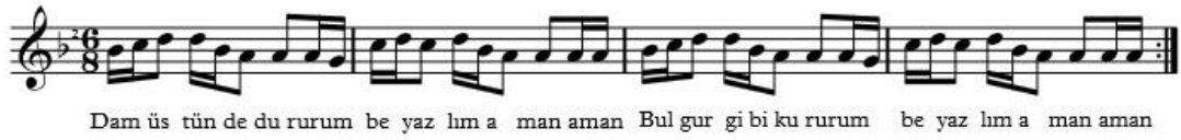
Şekil 2.8: Beyazlım Sözlü Kadın Oyun Ezgisinin Notası

Derleyen Kişi: Yedigöze Sude Altay Derleme Tarihi: Mart 2014 Notaya alan: Yedigöze Sude Altay