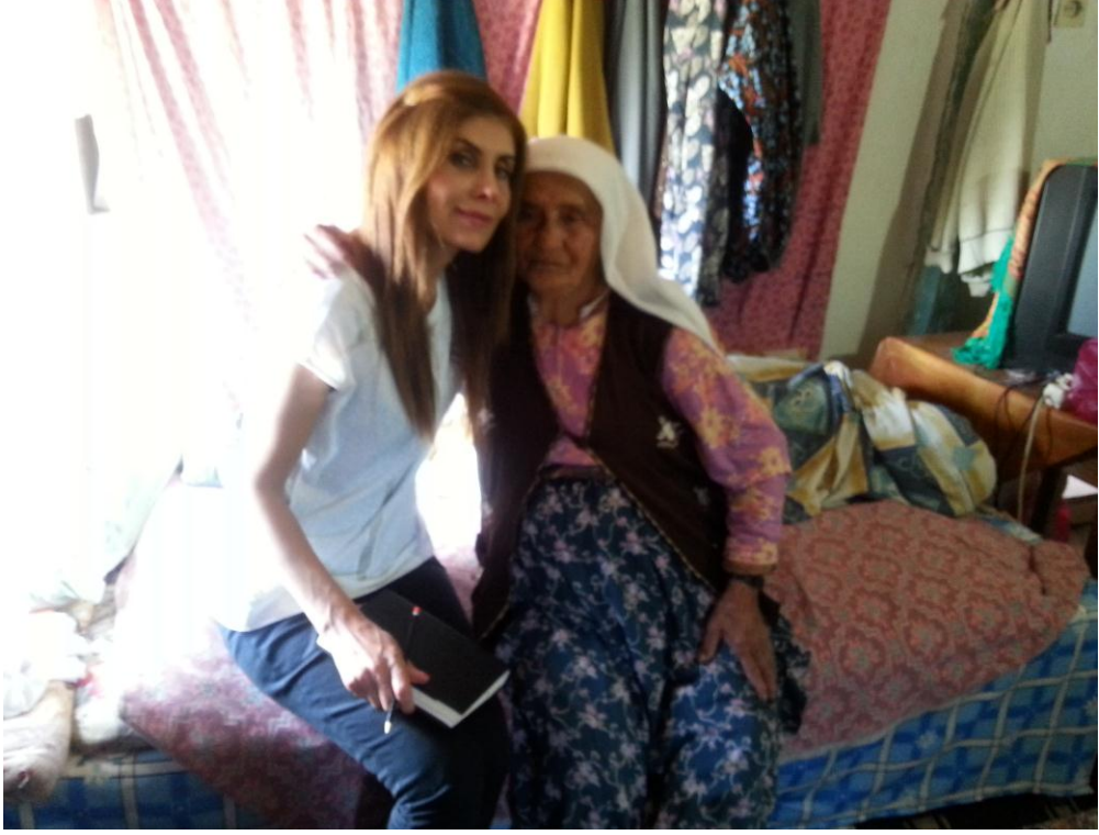
Şekil 3.13: Fethiye Yöresinde Boğaz Çalan Nazire Meteris Resim