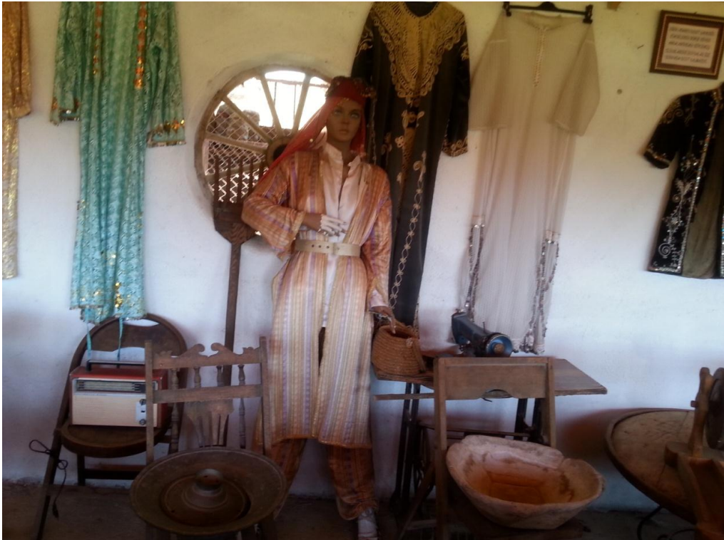
Etnografya müzesinde yörük kadın geleneksel kına kıyafeti Resim

Yörük Müzesi işletmecisi Enver Yalçın'ın verdiği bilgiler dahilinde etnografya müzesi gezilerek Teke yöresi Yörük kültürü hakkında bilgiler edinilmiş ve çalışmada yer almıştır.