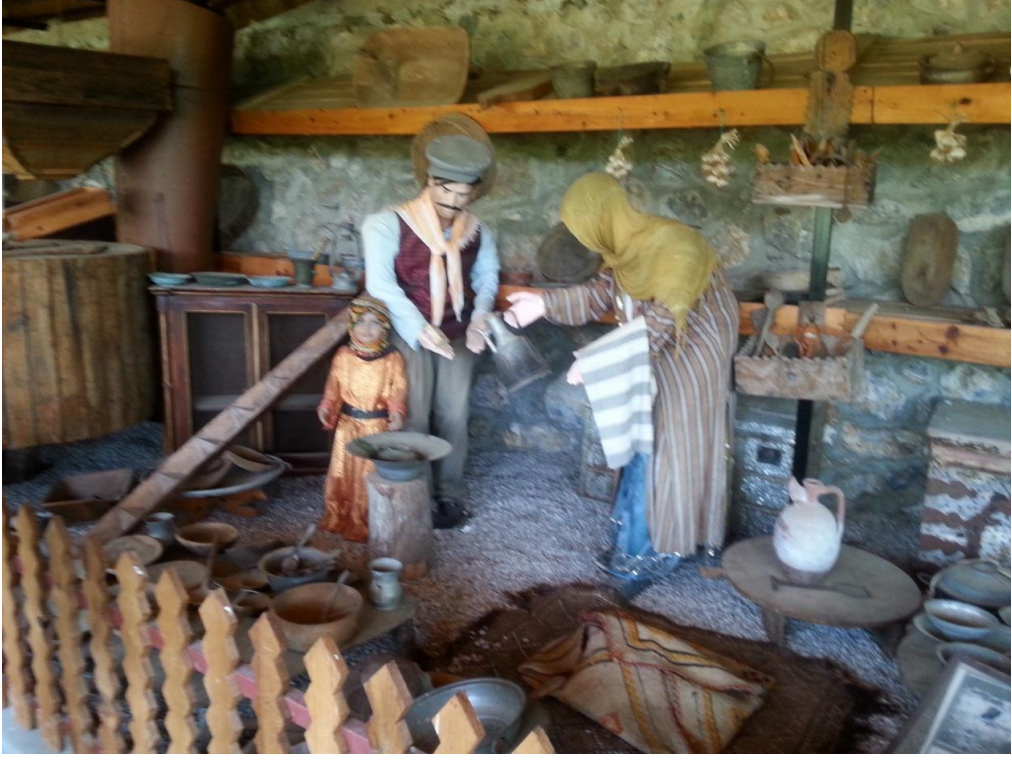
Yörüklerde geleneksel aile giysisi Resim