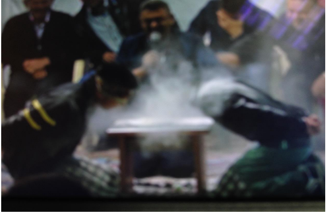
Ek-1 Resim 3: Çavuşlar Çifliği Salmanlar Mahallesi Birikmesi: Un Oyunu