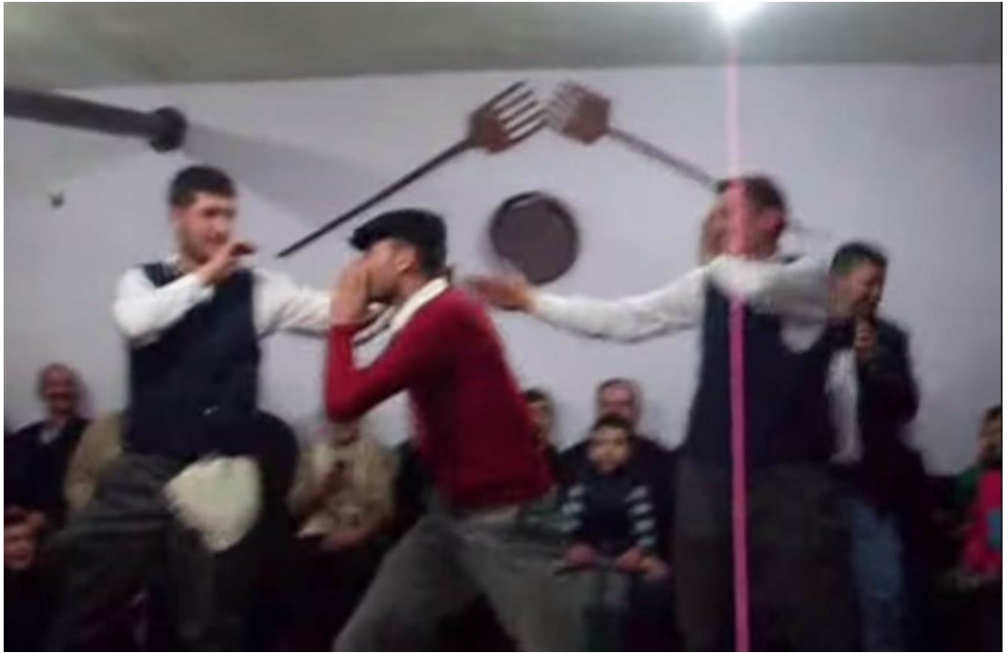
Ek- 2 Resim 2: Munduřlar Ky Birikmesi: Arı Oyunu