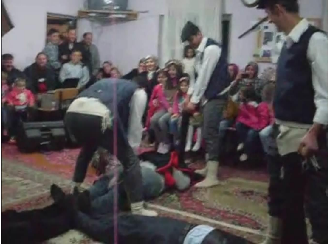
Ek- 2 Resim 5: MunduşlarKöyü Birikmesi: Baca Oyunu