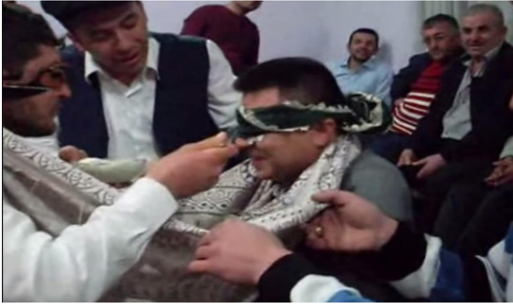
Ek- 2 Resim 16: Mundaşlar Köyü Birikmesi: Yoğurt Oyunu