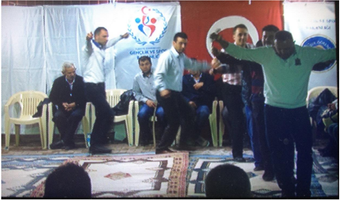
Ek-1 Resim 10: Çavuşlar Çifliği Salmanlar Mahallesi Birikmesi: Cezayir Havası