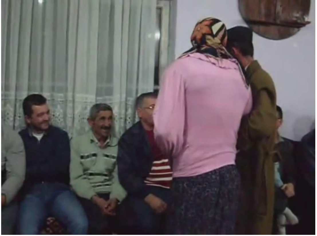
Ek- 2 Resim 9: Mundaşlar Köyü Birikmesi: Evlenme Oyunu