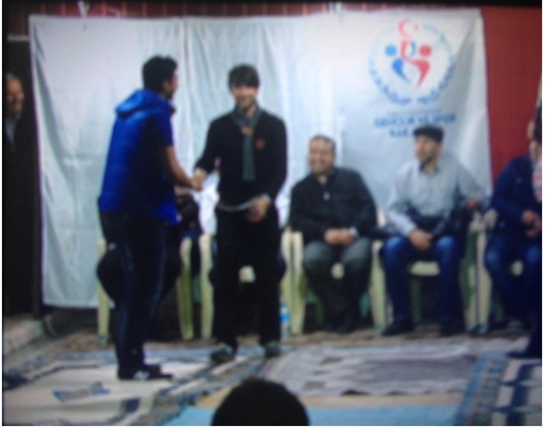
Ek-1 Resim 11: Çavuşlar Çifliği Salmanlar Mahallesi Birikmesi: Düğüm Oyunu