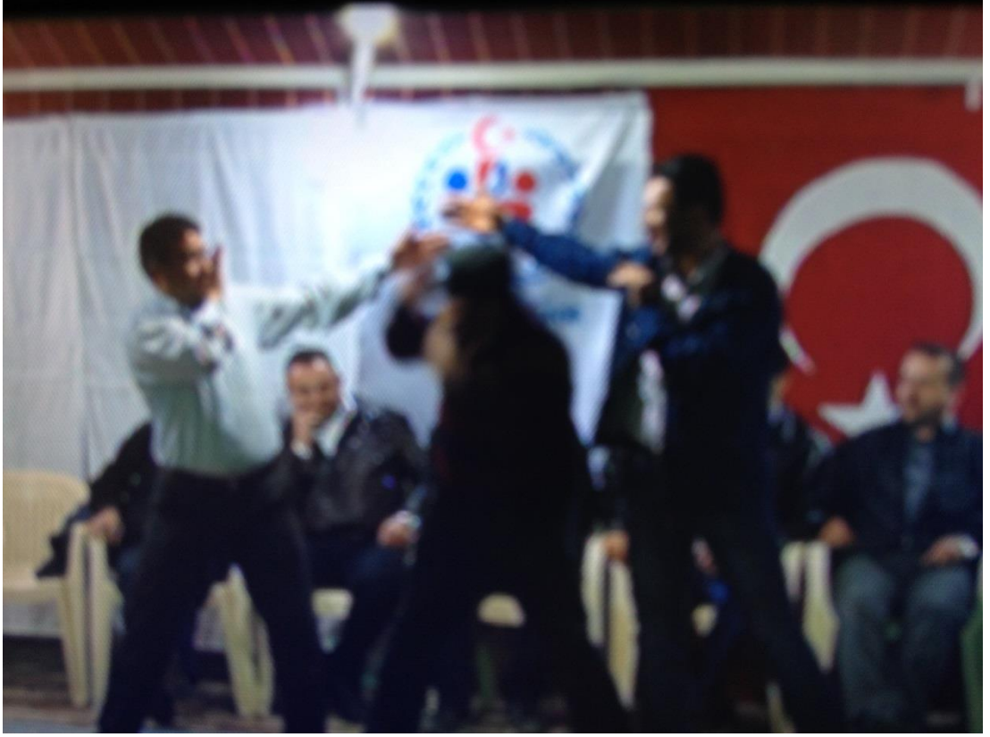
Ek-1 Resim 7: Çavuşlar Çifliği Salmanlar Mahallesi Birikmesi: Arı Oyunu