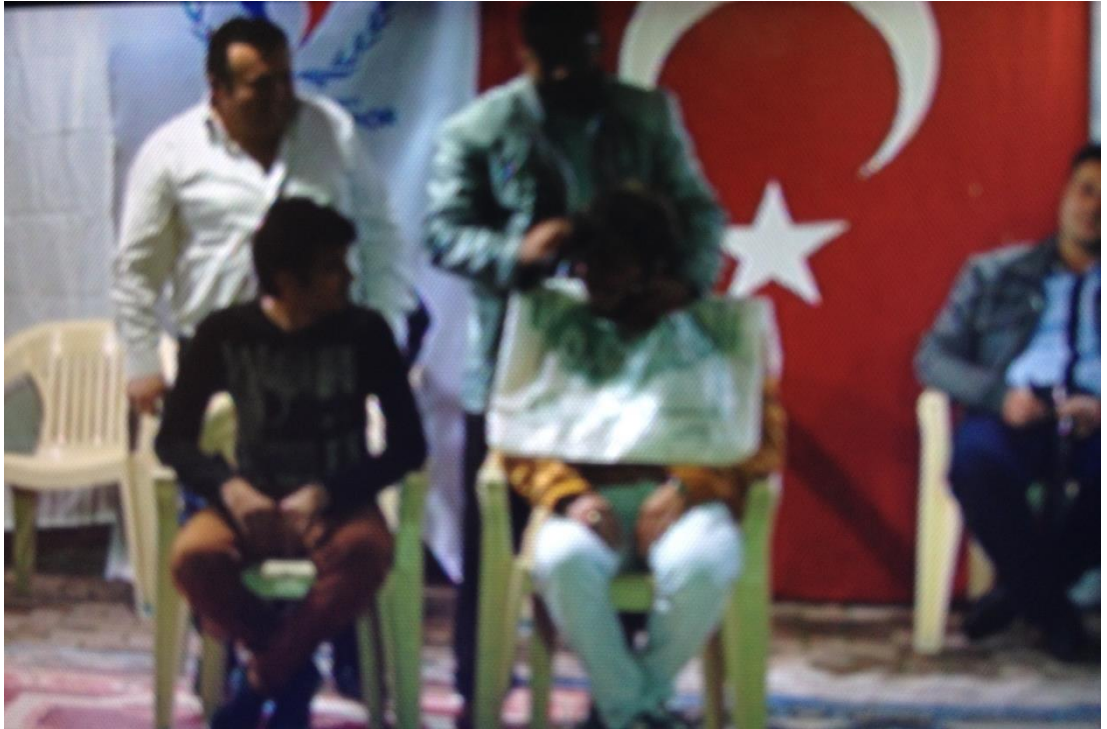
Ek-1 Resim 4: Çavuşlar Çifliği Salmanlar Mahallesi Birikmesi: Berber Oyunu