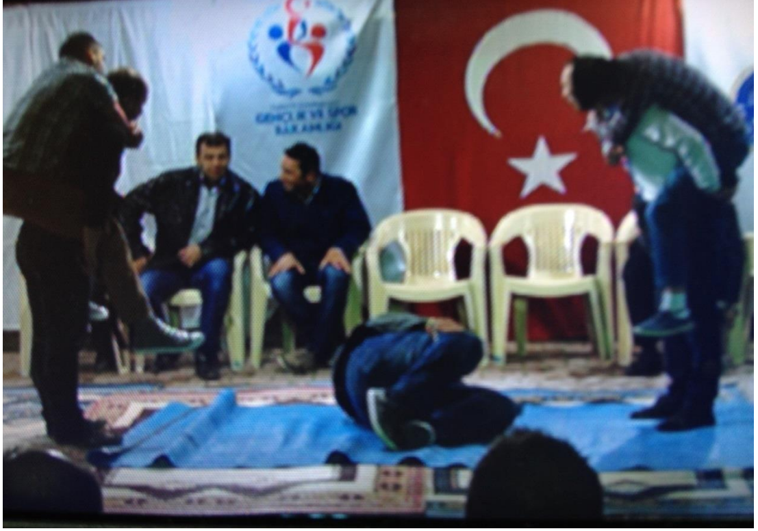
Ek-1 Resim:1 Çavuşlar Çifliği Salmanlar Mahallesi Birikmesi: Sınırtası Oyunu