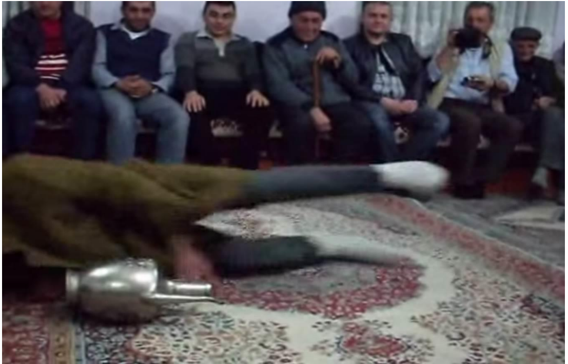
Ek- 2 Resim 12: Munduşlar Köyü Birikmesi: İbrik Oyunu