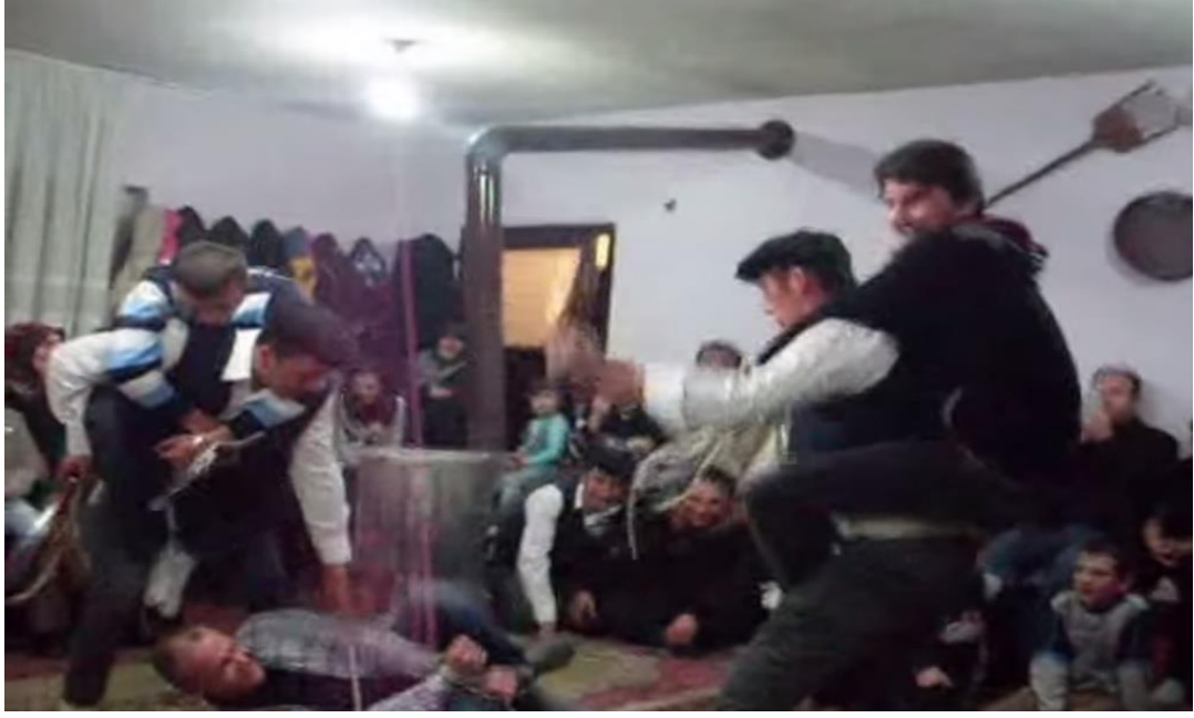
Ek- 2 Resim 15: Mundaşlar Köyü Birikmesi: Sınırtası Oyunu