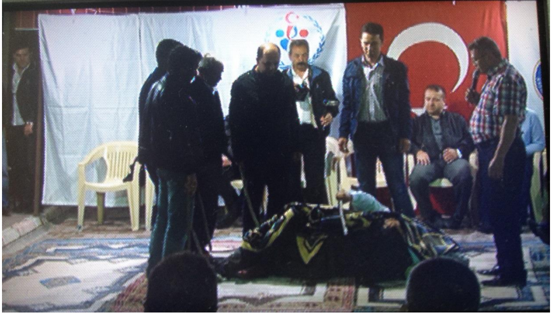
Ek-1 Resim 9: Çavuşlar Çifliği Salmanlar Mahallesi Birikmesi: Kim Vurdu? (Battaniye) Oyunu