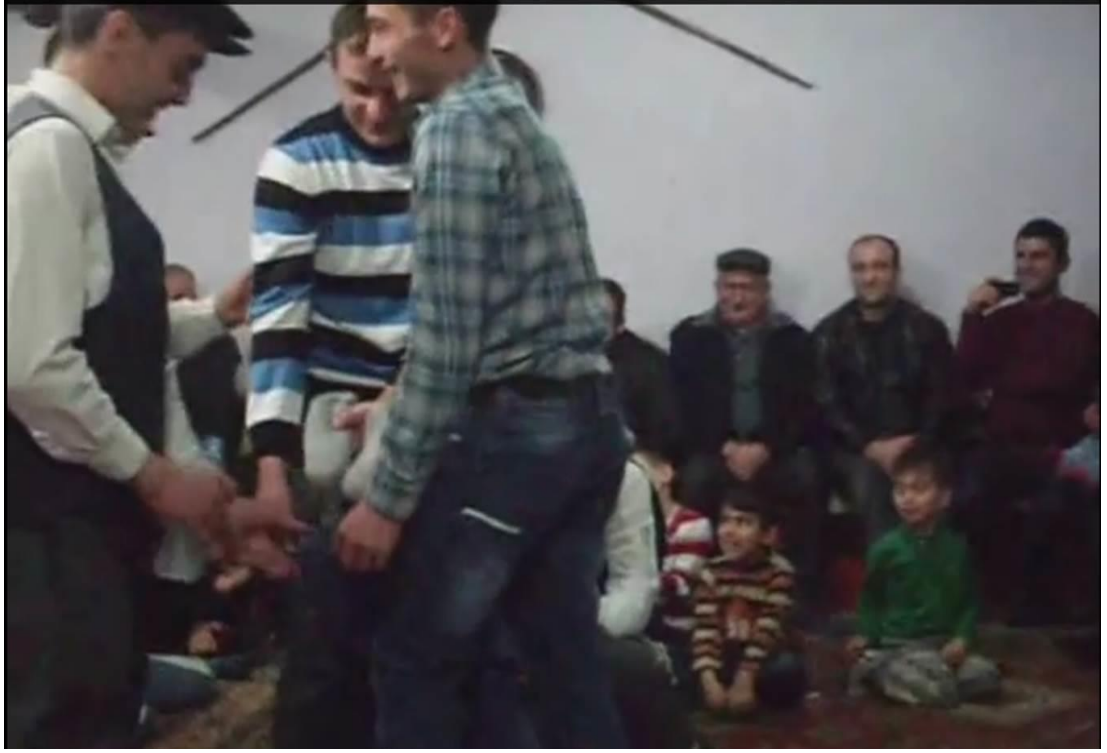
Ek- 2 Resim 7: Munduřlar Ky Birikmesi: Marul Oyunu