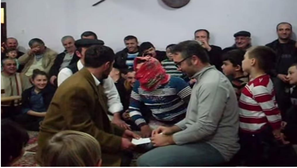
Ek- 2 Resim 13: Munduşlar Köyü Birikmesi: Yazıcı (Daktilo) Oyunu