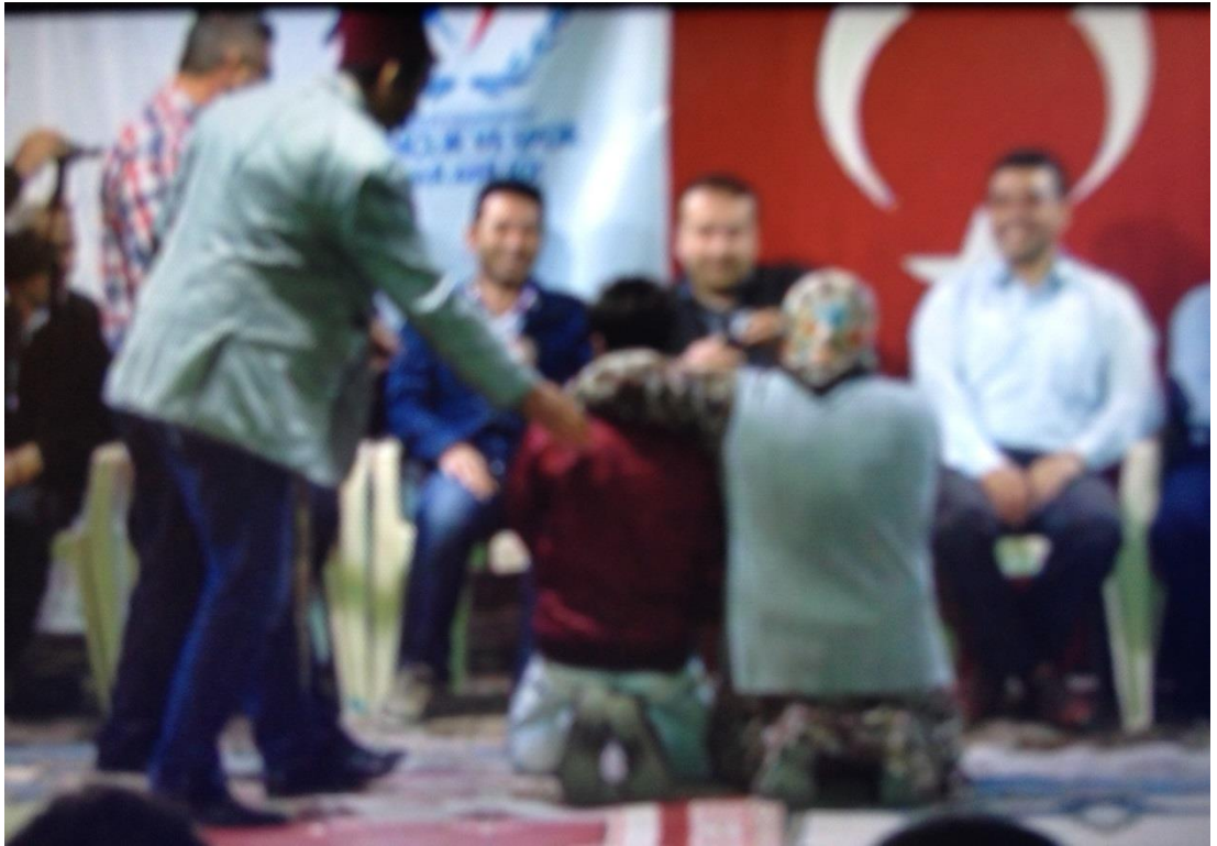
Ek-1 Resim 6: Çavuşlar Çifliği Salmanlar Mahallesi Birikmesi: Evlenme Oyunu