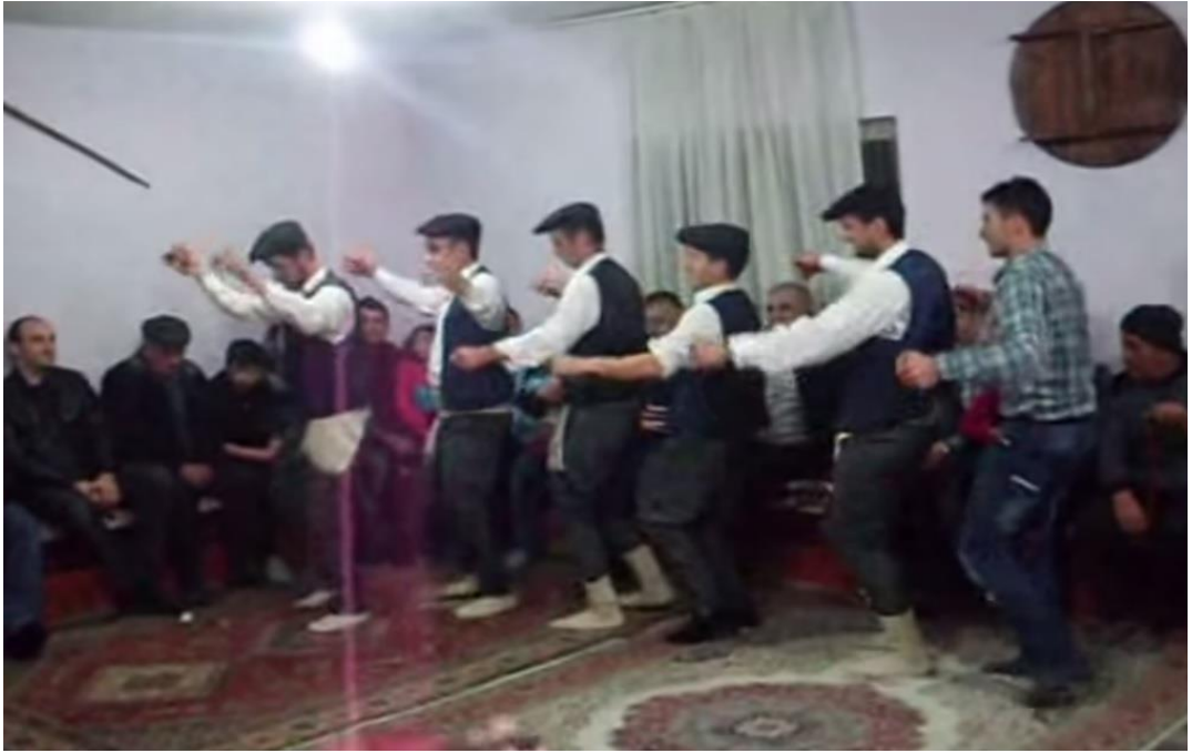
Ek- 2 Resim 20: Munduřlar Ky Birikmesi: Cezayir Havası – Dans