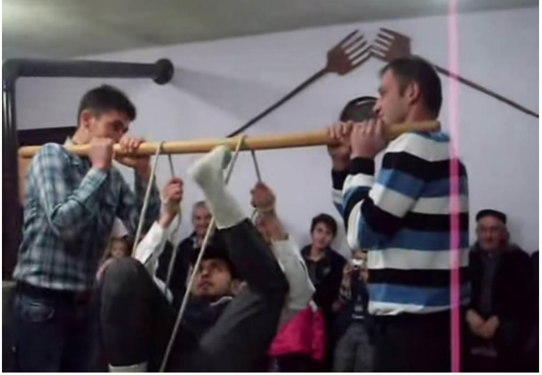
Ek- 2 Resim 1: MunduřlarKy Birikmesi: Terazi Oyunu