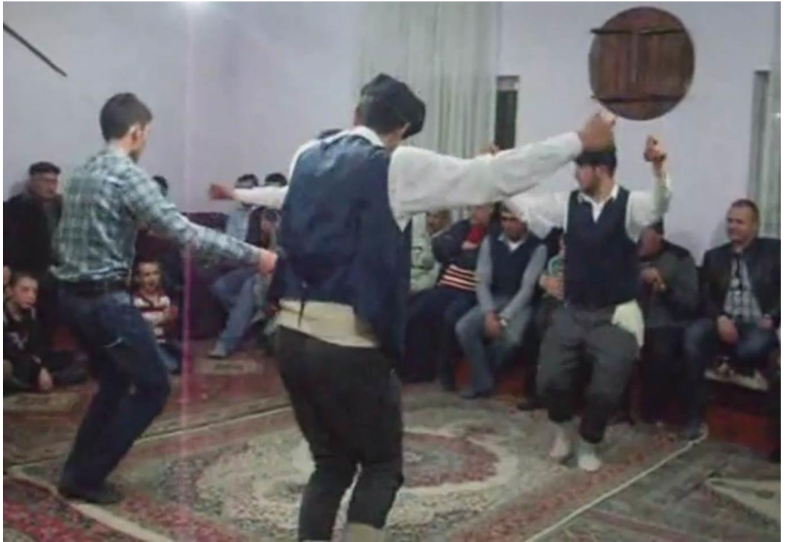
Ek- 2 Resim 10: Mundaşlar Köyü Birikmesi: Çiftetelli – Dans