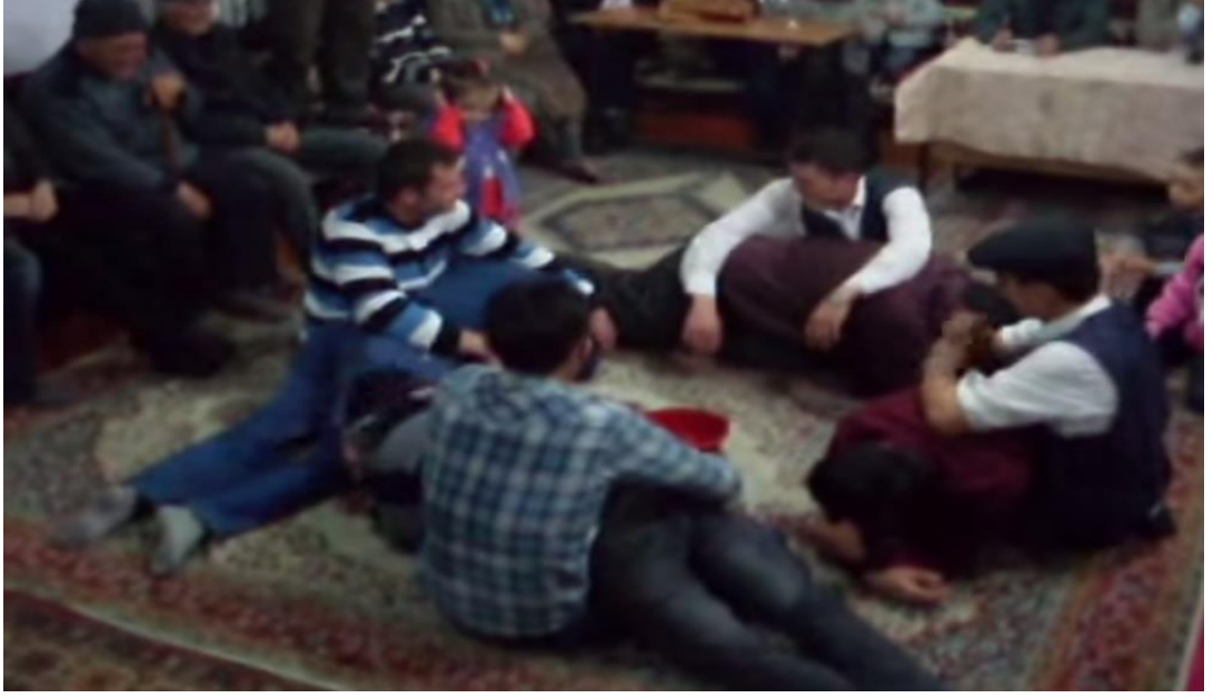
Ek- 2 Resim 19: Munduřlar Ky Birikmesi: Okey Oyunu