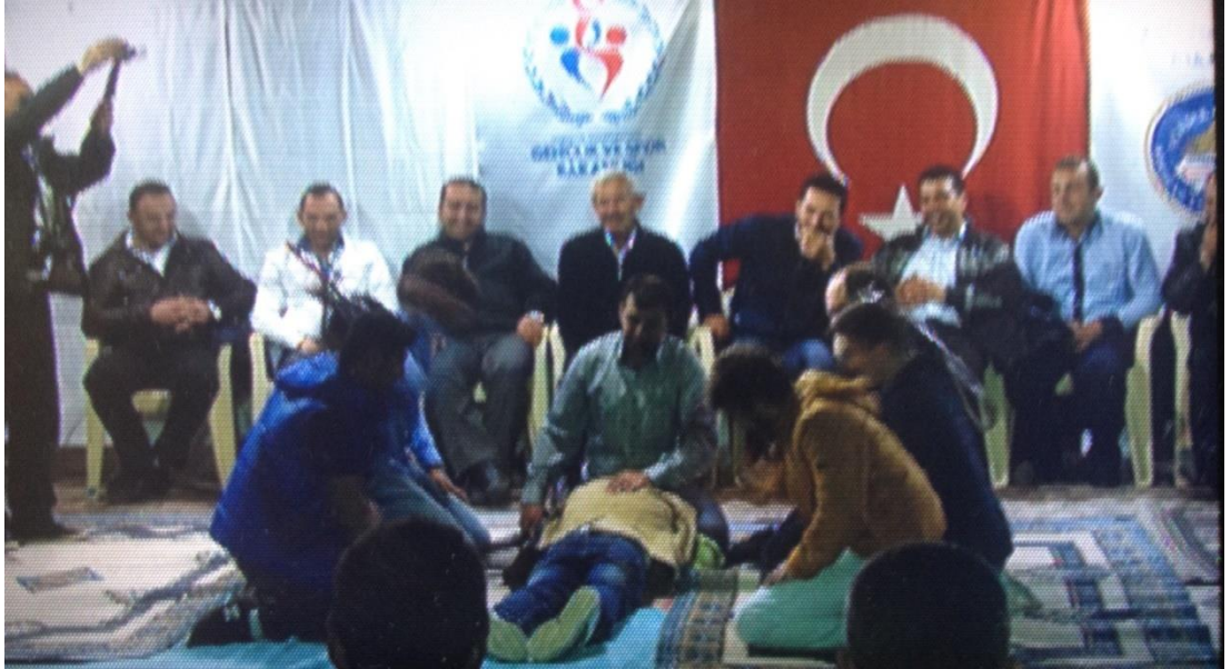
Ek-1 Resim 12: Çavuşlar Çifliği Salmanlar Mahallesi Birikmesi: Ateş Oyunu