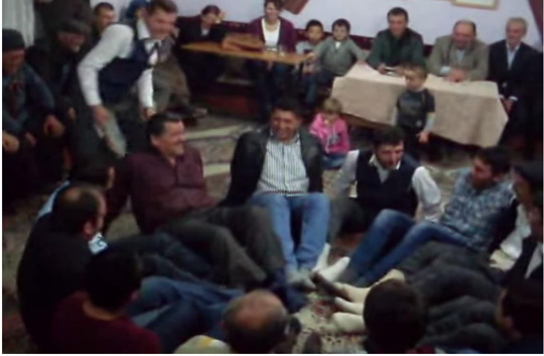
Ek- 2 Resim 17: Mundaşlar Köyü Birikmesi: Vay Haline Oyunu