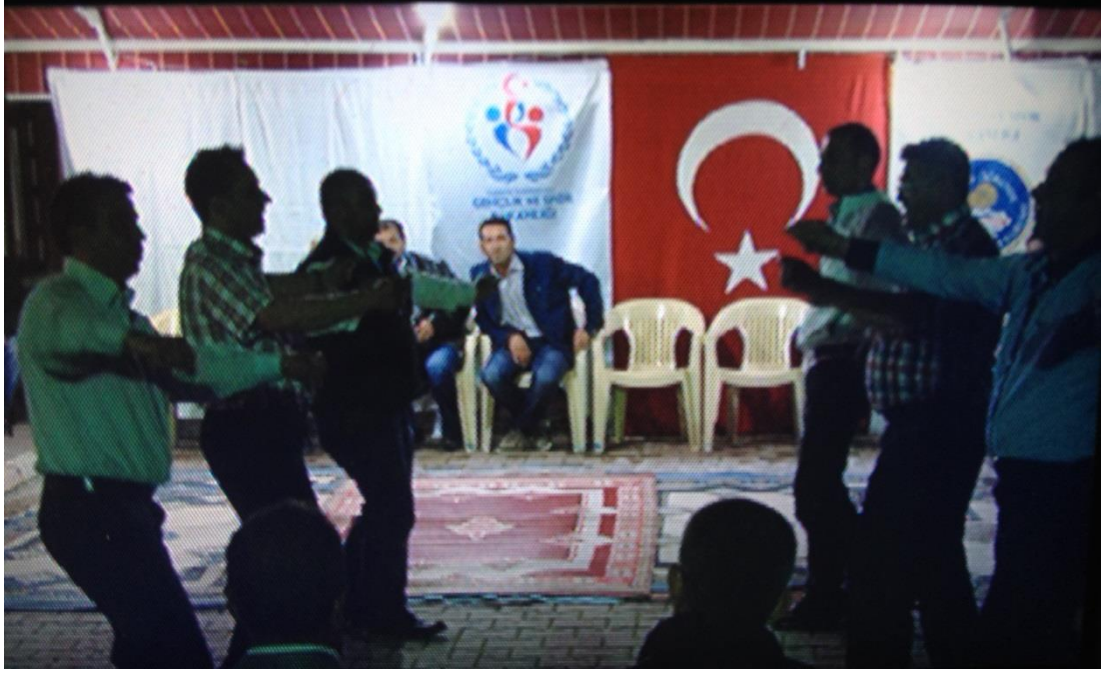
Ek-1 Resim 5: Çavuşlar Çifliği Salmanlar Mahallesi Birikmesi: Çiftetelli Dansı