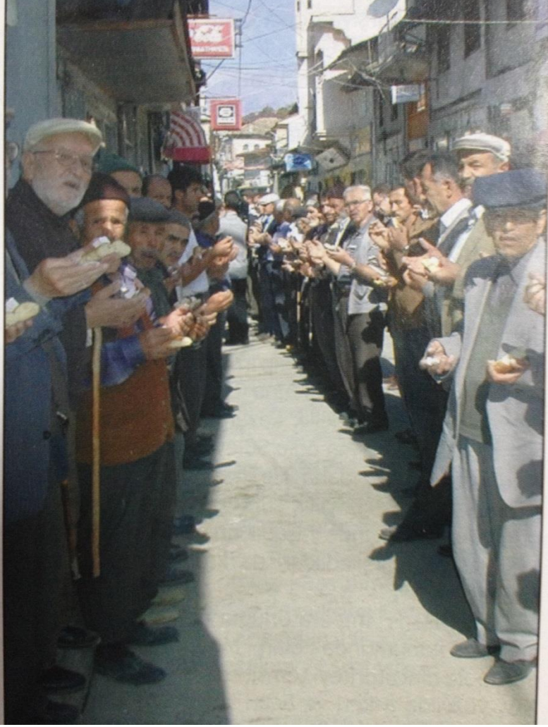
Resim – 1. Esnaf Duası

önüne çıkararak, duayı okuyan imama uyararak yaptığı duadır. Duayı okumayı bilmeyenler amin demekle yetinirler.