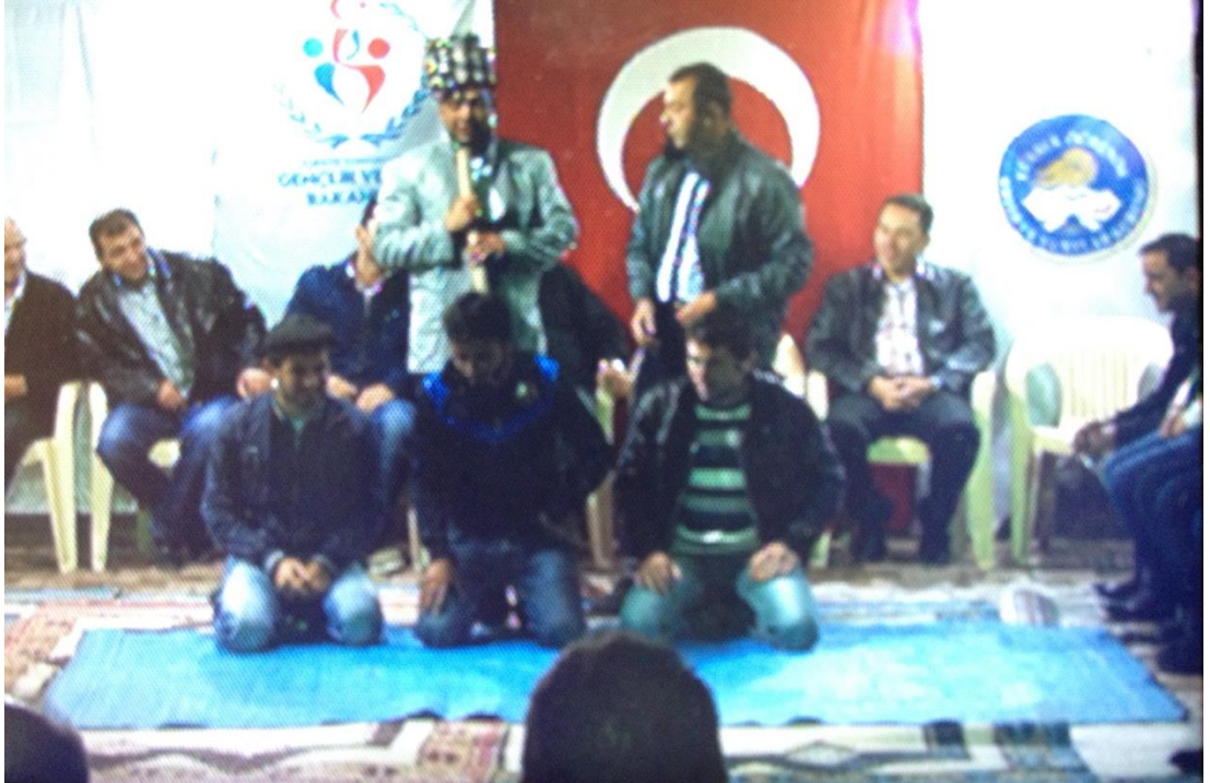
Ek-1 Resim 2 : Çavuşlar Çifliği Salmanlar Mahallesi Birikmesi: Hasan Ya Oyunu