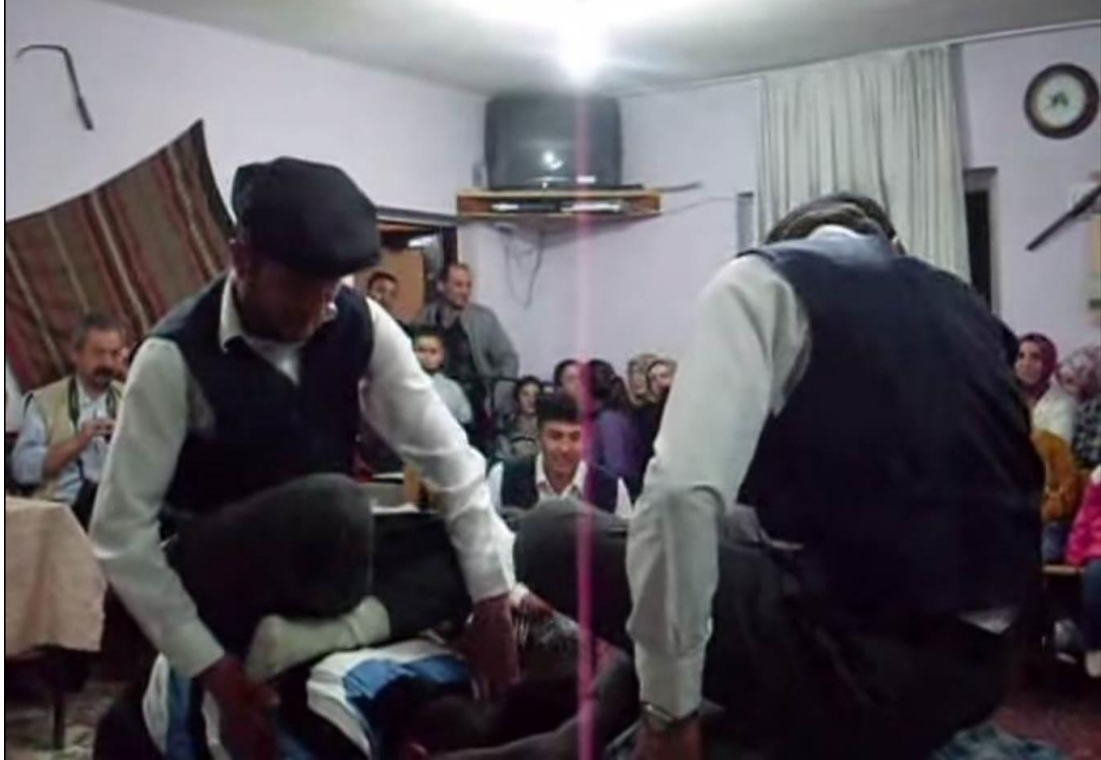
Ek- 2 Resim 4: Munduřlar Ky Birikmesi: Sepetioęlu Oyunu