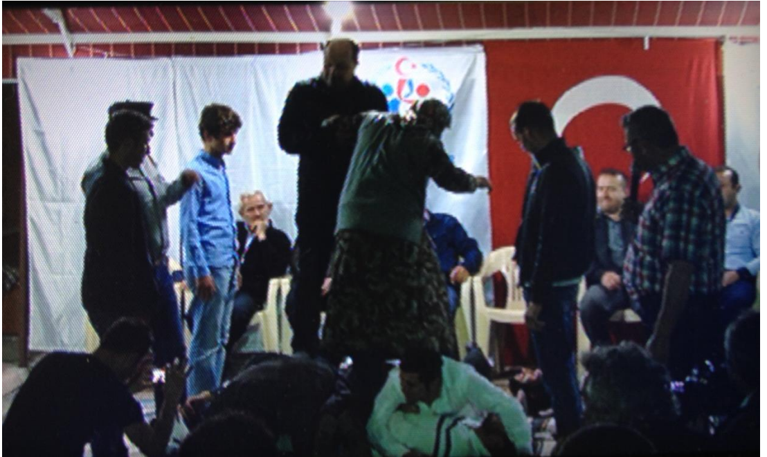
Ek-1 Resim 8: Çavuşlar Çifliği Salmanlar Mahallesi Birikmesi: Ev Yapma Oyunu