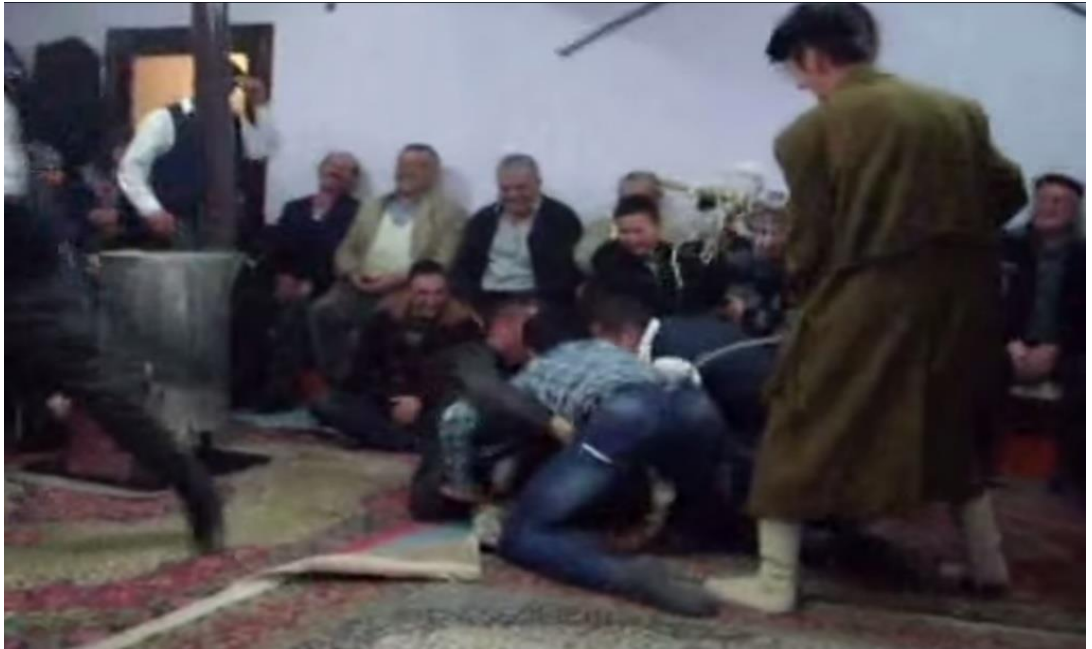
Ek- 2 Resim 8: Munduřlar Ky Birikmesi: Kpek Oyunu