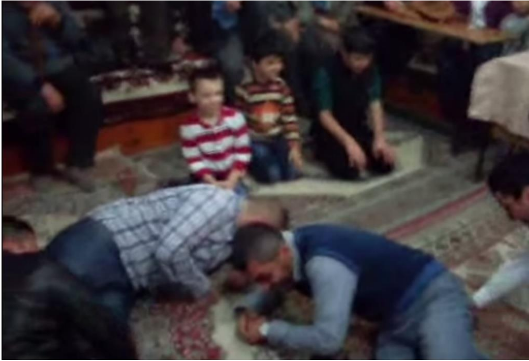
Ek- 2 Resim 14: Munduşlar Köyü Birikmesi: Tilki Oyunu