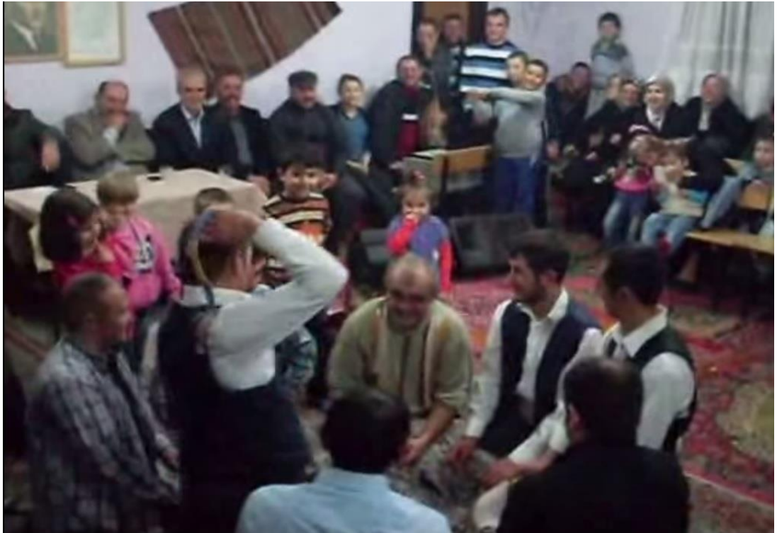
Ek- 2 Resim 18: Mundaşlar Köyü Birikmesi: Hırsız Oyunu