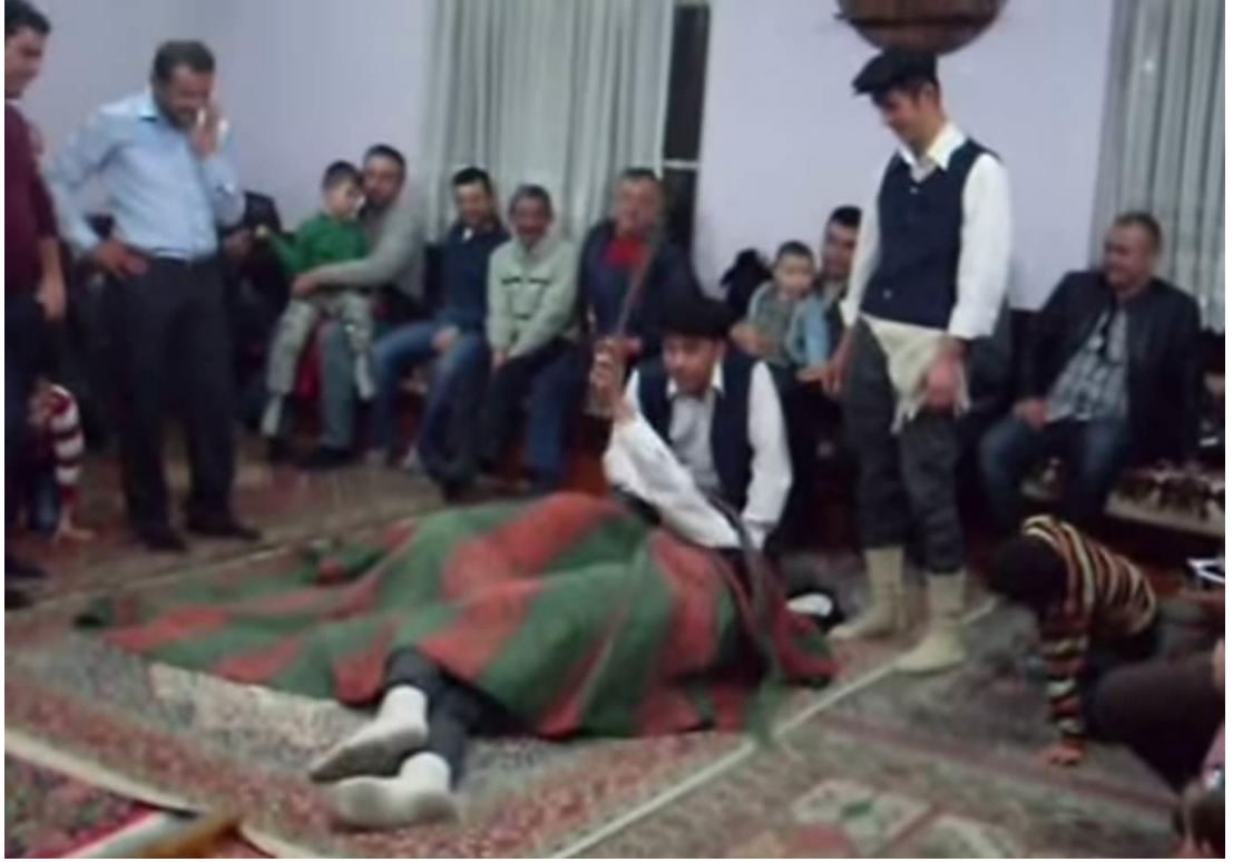
Ek- 2 Resim 11: Munduşlar Köyü Birikmesi: Kim Vurdu? (Battaniye) Oyunu