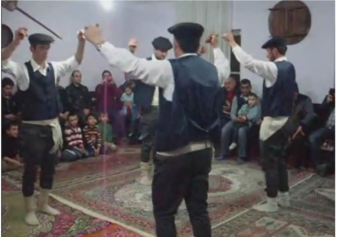
Ek- 2 Resim 6: Munduşlar Köyü Birikmesi: Meşeli – Dans