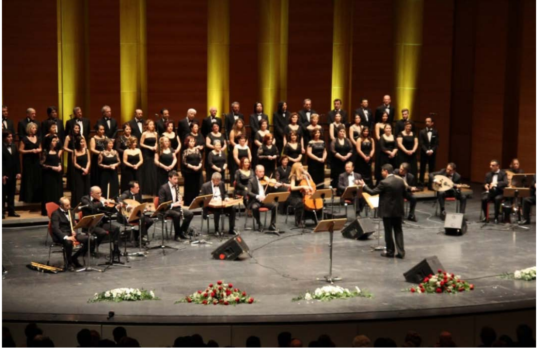
Şekil 3.6: Leverkusen Musiki Cemiyeti Konseri