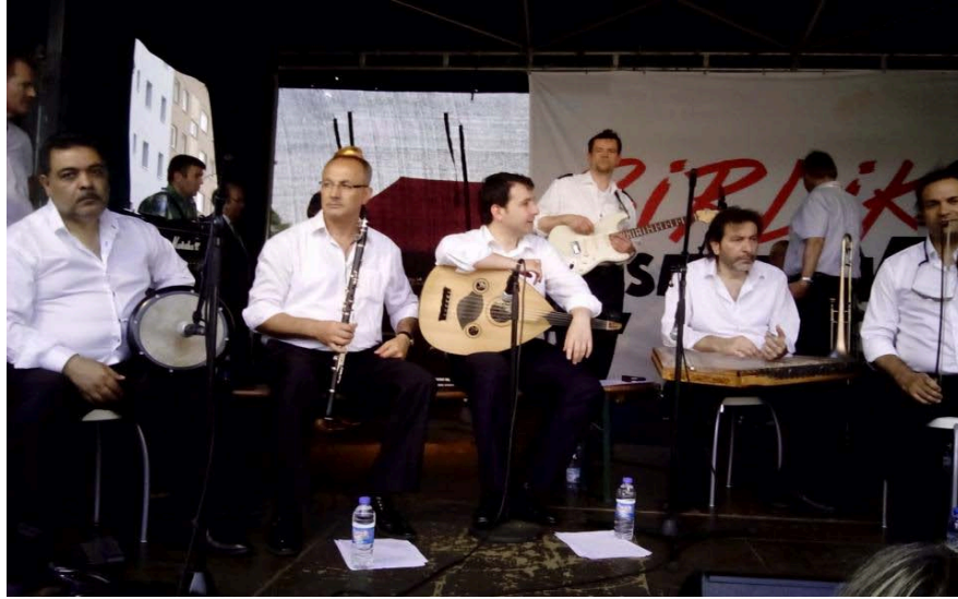
Şekil 2.13: TRT ve Köln Polis Bandosu “Birlikte, Zusammen” Konseri

Kurulan korolarda başarılı işler yapıldıkça ilgi ve beraberinde destekler görmeye başladılar. Böylelikle Türkiye’den ve bilhassa TRT ile bağlantılı konserler düzenlemeye gelindi. TRT yapmış olduğu ses yarışmalarını Almanya’da da düzenledi ve yarışmalara ilgi arttı. Gerek özel dernekler gerekse Alman kurumlarıyla birlikte konserler vermeye başlandı. Aşağıda 2014 senesinde Köln’de düzenlenen bir konser yer almaktadır. Alman Polis Bandosu ve TRT Türk Sanat Müziği sazları ortaklaşa halka açık konser vermişlerdir.