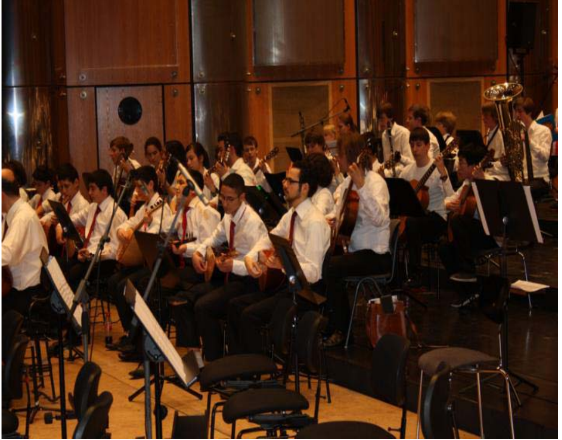
ekil A.1: Darmstadt Korusu