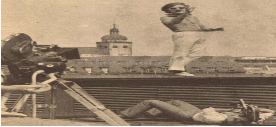
Şekil 2.11: Cem Karaca

Servete servet kattığımız Gurbet el şimdi bize dön geri diyor”