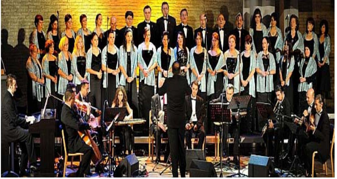
Şekil 3.15: Kültürlerarası Müzik ve Sahne Sanatları Enstitüsü NRW Türk Müziği Korusu