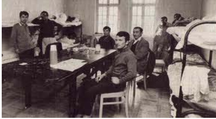
Şekil 2.3: Heim, Yatakhane ve Türk İşçiler

Okuma yazma oranının düşük olduđu bir toplum olarak Almanyaya yönelik bir alt yapı da kurulamadı. Zaten bu durum Almanya’da yaşayacak olan 2. neslin okul yaşamlarının sıkıntılı geçmesinin de sebebi olarak karşımıza çıktı.