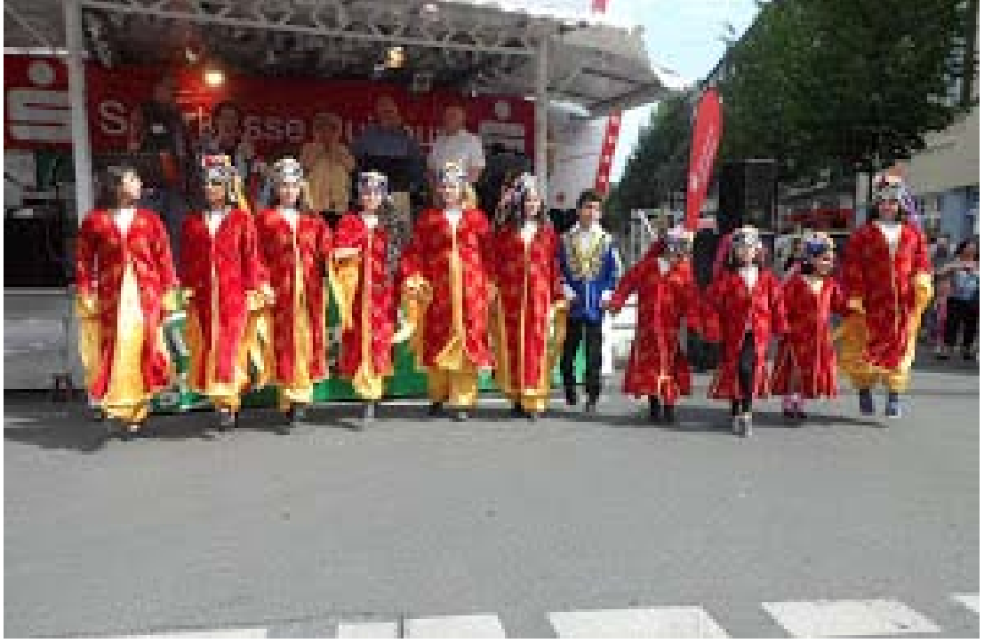
Şekil A.22: Duisburg Alevi Derneği Müzik Çalışmaları (Halk Oyunları)