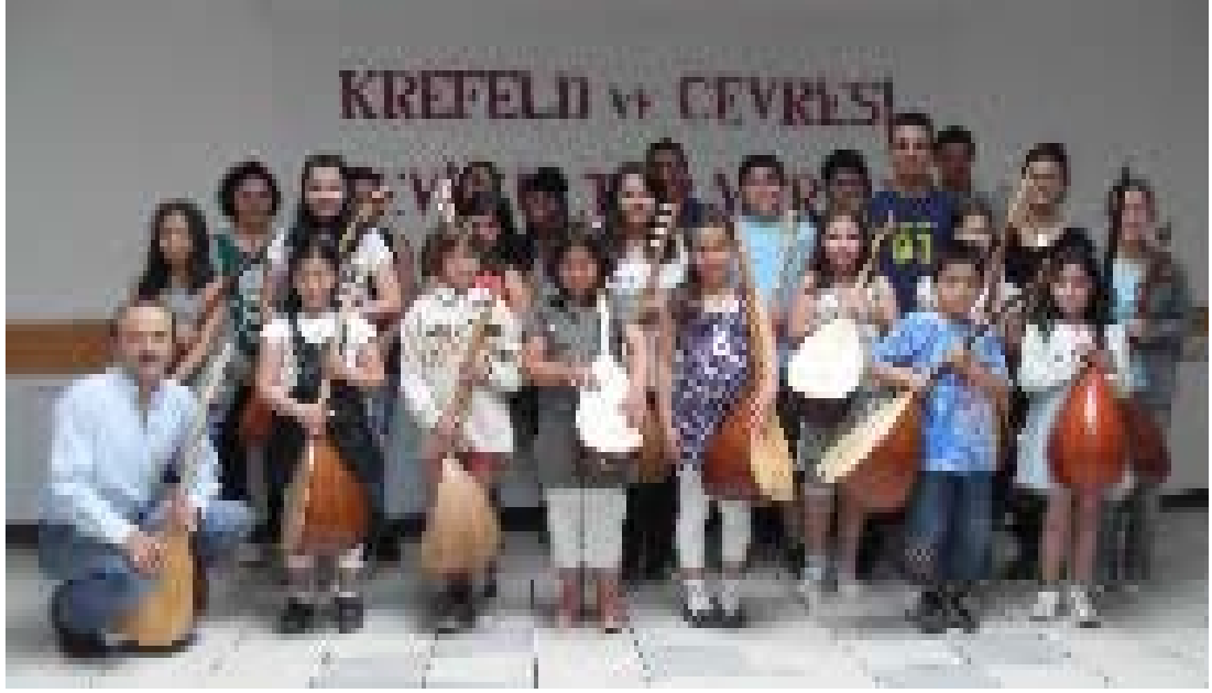
Şekil 3.4: Krefeld ve Çevresi Alevi Kültür Merkezi (KR-AKM) Bağlama Dersi

bağlama dersi teorik olarak verilmeyip ezbere dayanan bir yöntemle sürdürülmektedir. Krefeld şehrine yakın yerleşim birimlerinden gelen öğrencilerle sayıları 20-25 aralığındadır. Bağlama dersini gruplara ayırarak verildiğini öğrendiğimiz bu dernek ziyaretlerine 3 kere gitmemize rağmen görüşmelerimizden bir sonuç çıkmadı. Paylaştığımız resim ve edindiğimiz bilgiler aynı derneğe üye Semir Sürmeliolu'ndan alınmıştır.