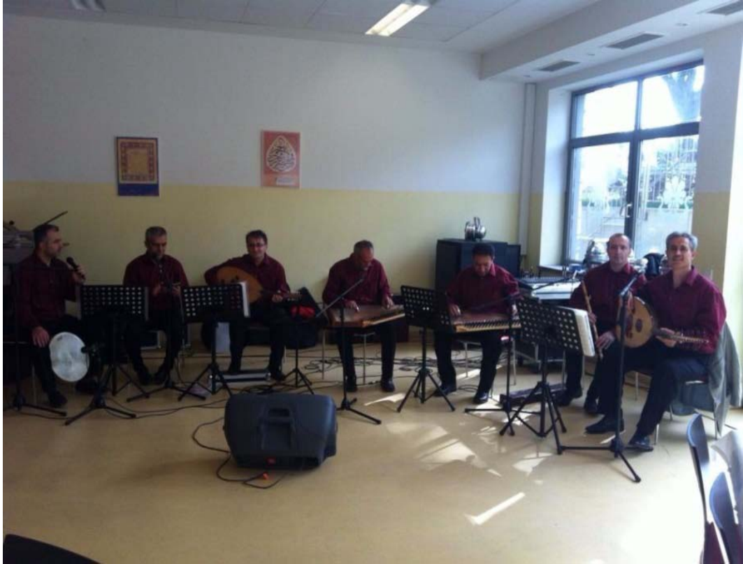
Şekil 3.11: Duisburg Gülnihal Tasavvuf Müziği Korosu

Sazendeler arasında notayı bilenler oldukça azdır.