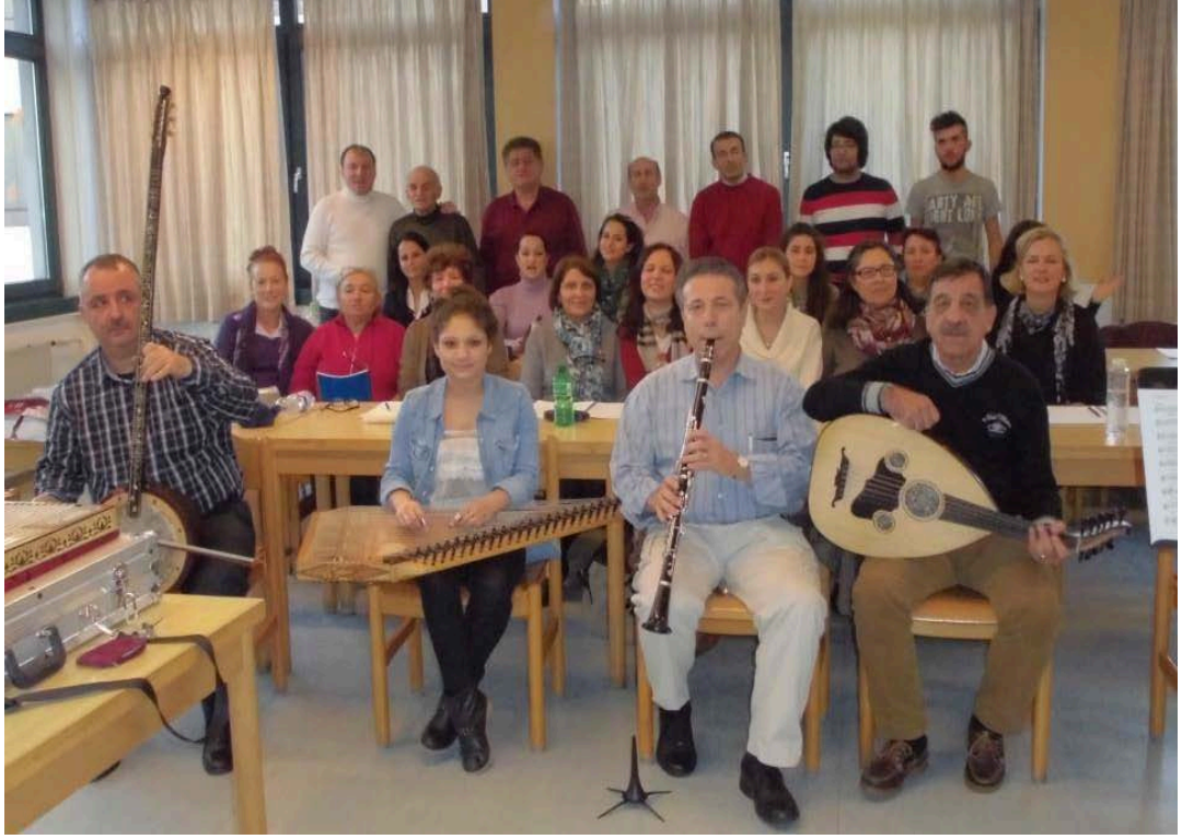
Şekil 3.12: Neuss Türk Sanat Müziği Korosu Prova