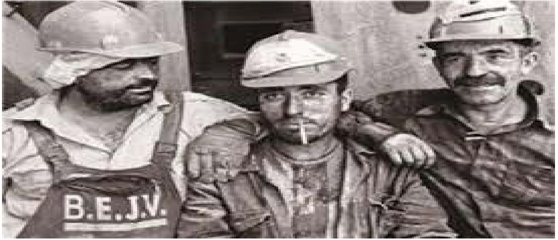
Şekil 2.5: Madende çalışan Türk İşçiler