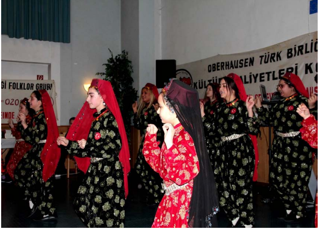
Şekil A.24: Oberhausen Türk Birliği Türk Müziği Topluluğu Halk Oyunları Gösterisi