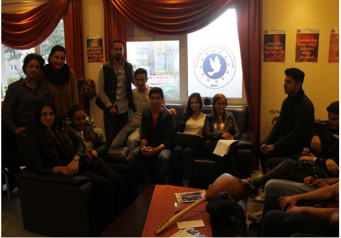
Şekil 3.10: Duisburg Alevi Derneği Müzik Çalışmaları