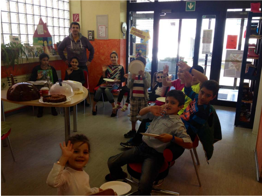
Şekil 3.7: Leverkusen Türk Veliler Derneđi Çocuk Korosu

Leverkusen Türk Veliler Derneđi çatısı altında 26 çocuktan oluşan bir çocuk korusu vardır ve halk müziğinden ilahilere, sanat müziğinden özgün eserlere şarkılar öğretilmektedir. Çocukların yaş aralıđı 5-13'dür. Ayrıca koroda isteyen öğrencilere bağlama dersleri de verilmektedir.