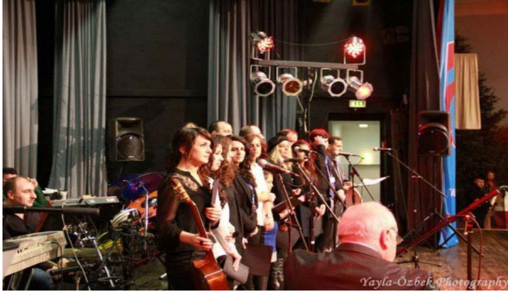
Şekil A.15: Duisburg Trabzonlular Dernegi Karadeniz Korosu, Wesel-25.12.2013