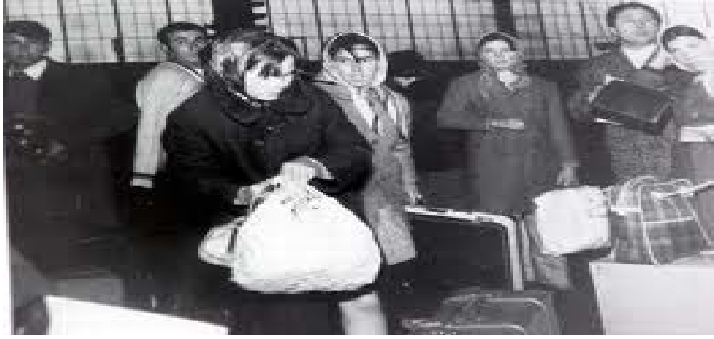
Şekil 2.6: Almanya'ya Çalışmaya ya da Eş Durumu ile Giden Kadınlar