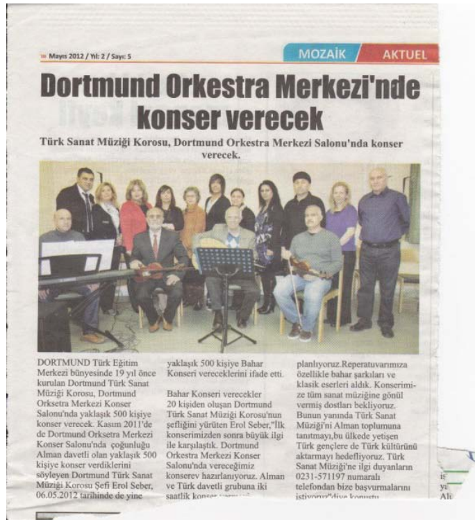
Şekil A.27: Dortmund Türk Sanat Müziği Korusu Konser Haberi