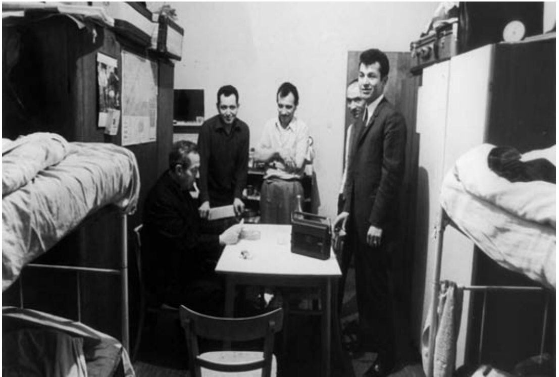
Şekil 2.2: İşçiler İçin Hazırlanan Barınaktan Bir Görüntü