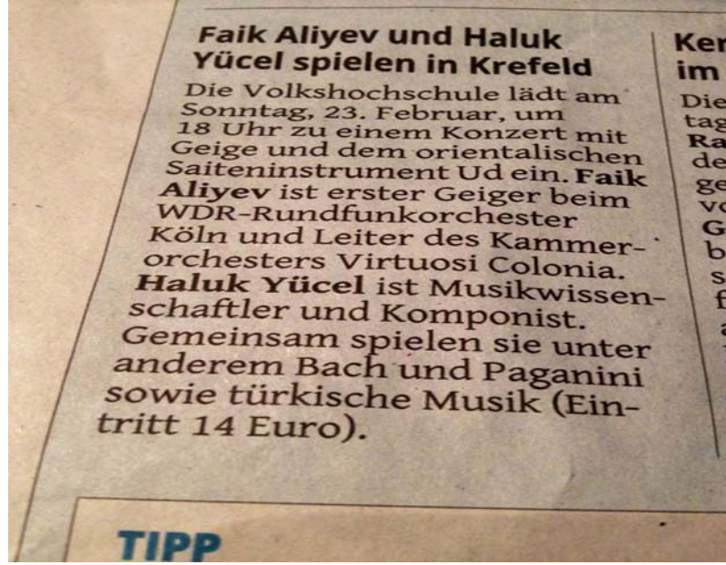
Şekil A.12: Türk Müziği ve Batı Müziği Konseri 22.02.2014 Volkshochschule Krefeld Westdeutsche Zeitung 19.02.2014