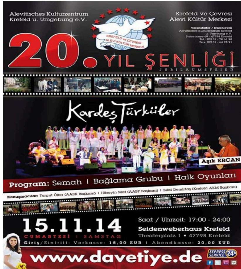
Şekil A.13: Krefeld ve Çevresi Alevi Kültür Merkezi (KR-AKM)20. Yıl Şenliği ve Kardeş Türküler Konser Afışı