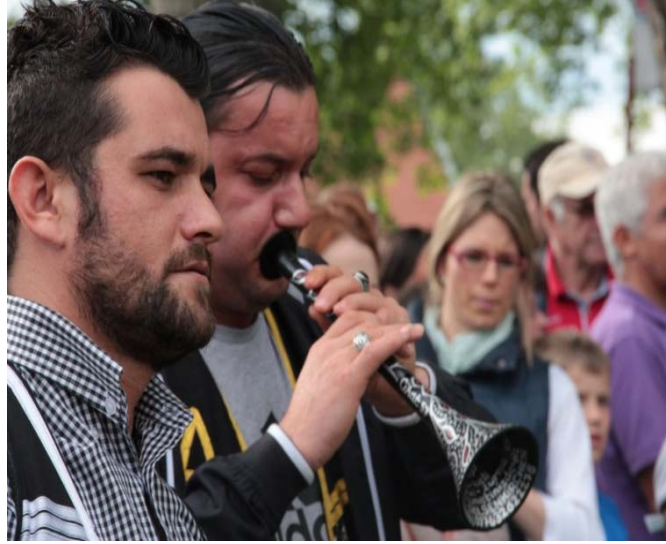
Şekil A.6: Oberhausen Türk Halk Müziği Etkinliği