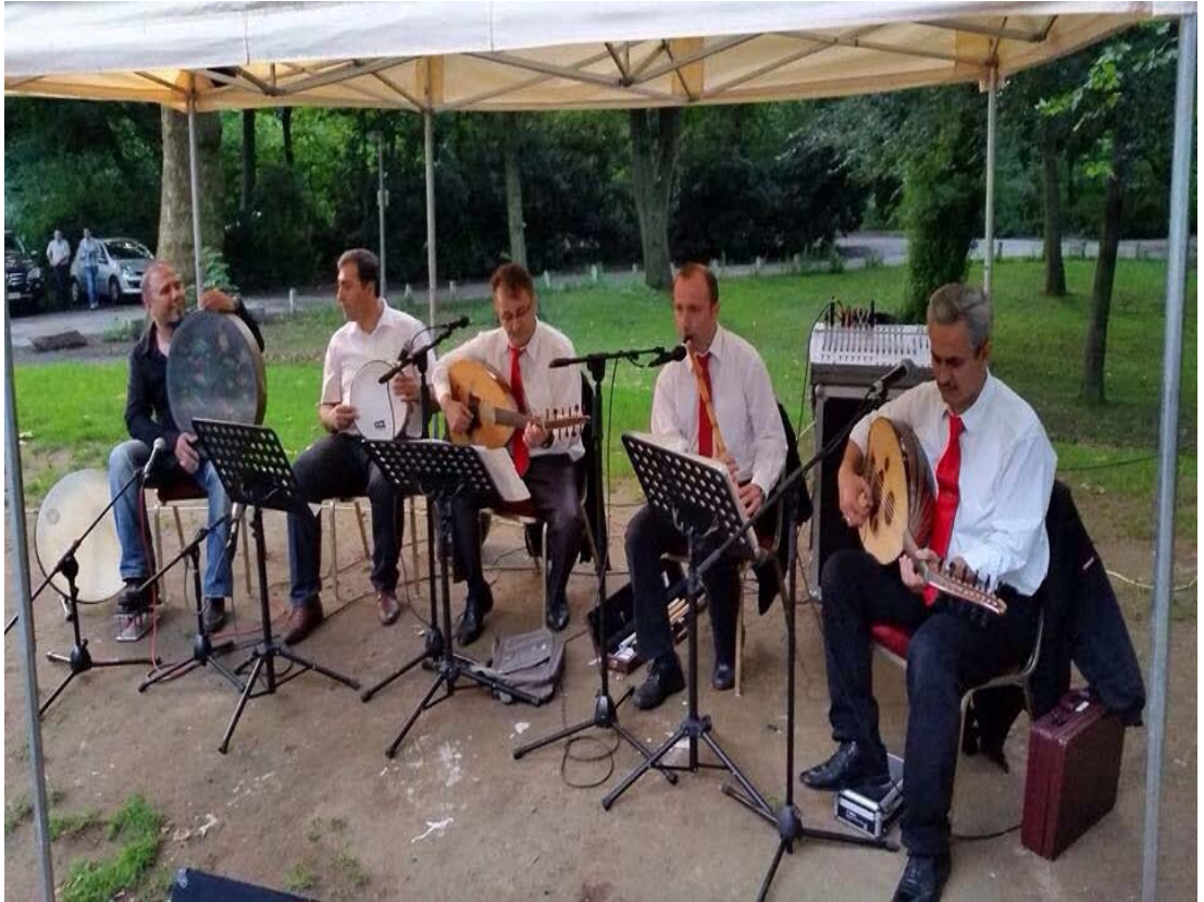
Şekil A.23: Duisburg Gülnihal Tasavvuf Müziği Korusu Sahne Resimi