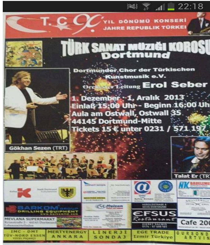
Şekil A.26: Dortmund Türk Sanat Müziği Korusu Konser Afişi.12.2013