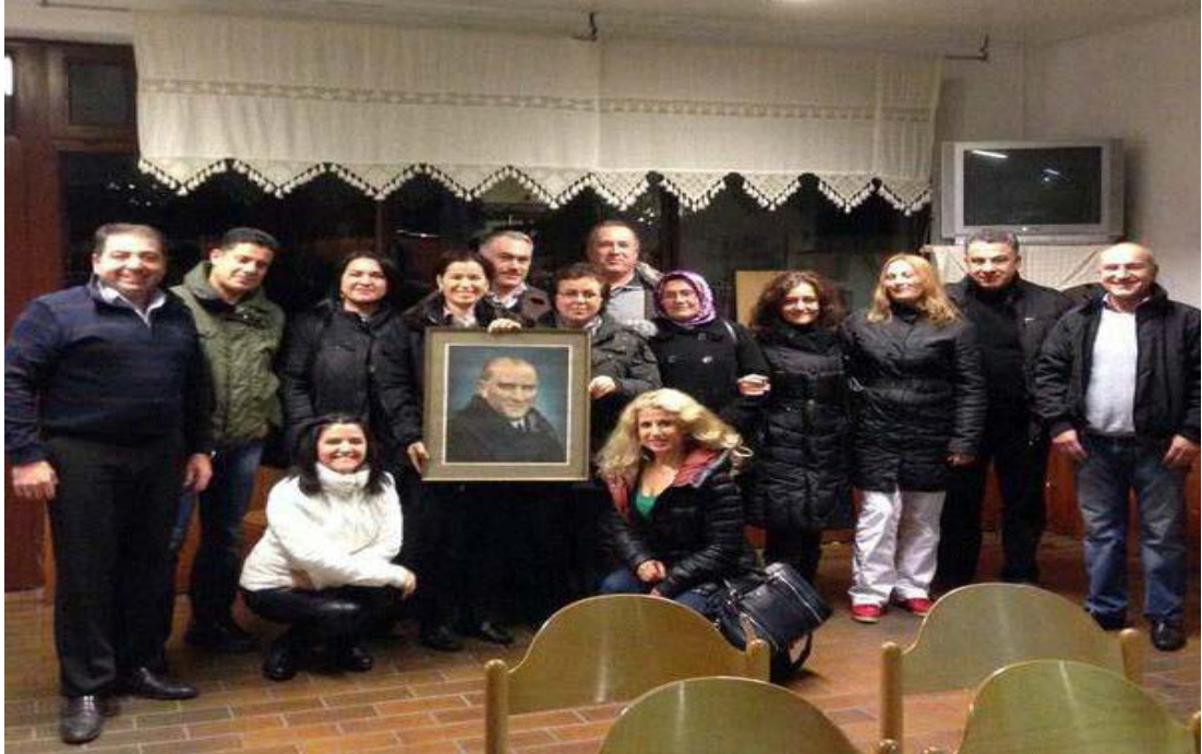
Şekil 3.5: Krefeld Türk Halk Müziđi Korosu

Koro yaklaşık 18 üyeden oluşmakta ve yıllarca AWO'ya bađlı Türk Danış salonunda çalışmalarını sürdürmektedir.