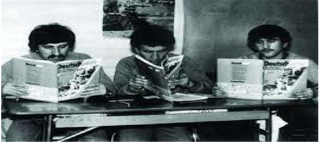
Şekil 2.4: Yatakhanededen bir resim, almanca öğrenmeye çalışan işçiler