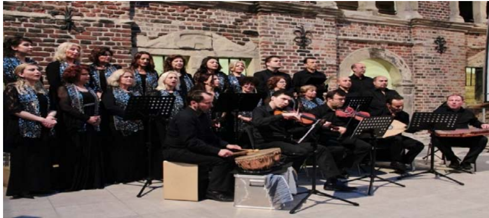
Şekil 2.17: INIMB Gelsenkirchen Konseri