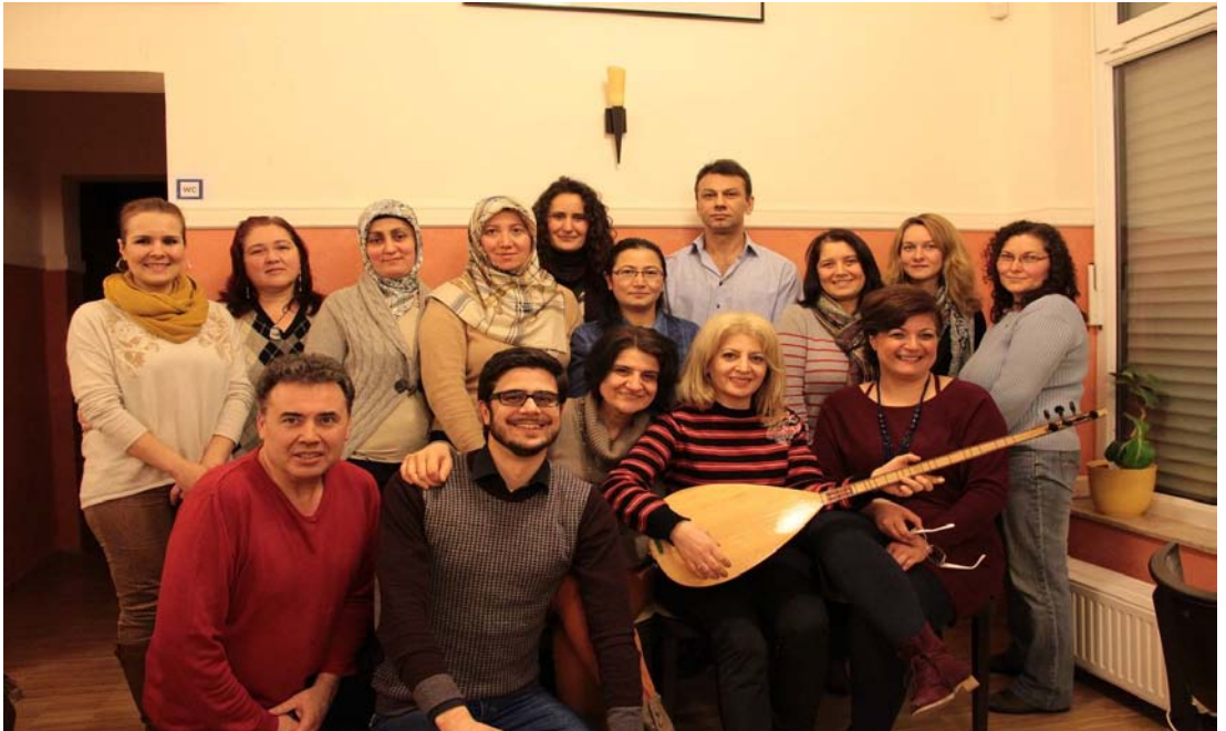
Şekil 3.16: Kültürlerarası Müzik ve Sahne Sanatları Enstitüsü NRW Türk Halk Müziği Korusu