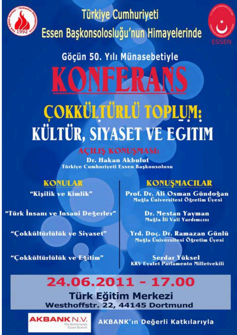
Şekil A.8: T.C. Essen Başkonsolosluğu himayesinde Dortmund'da gerçekleşen "Çok Kültürlü Toplum: Kültür, Siyaset ve Eğitim" konulu Konferans'tan, 24.06.2011