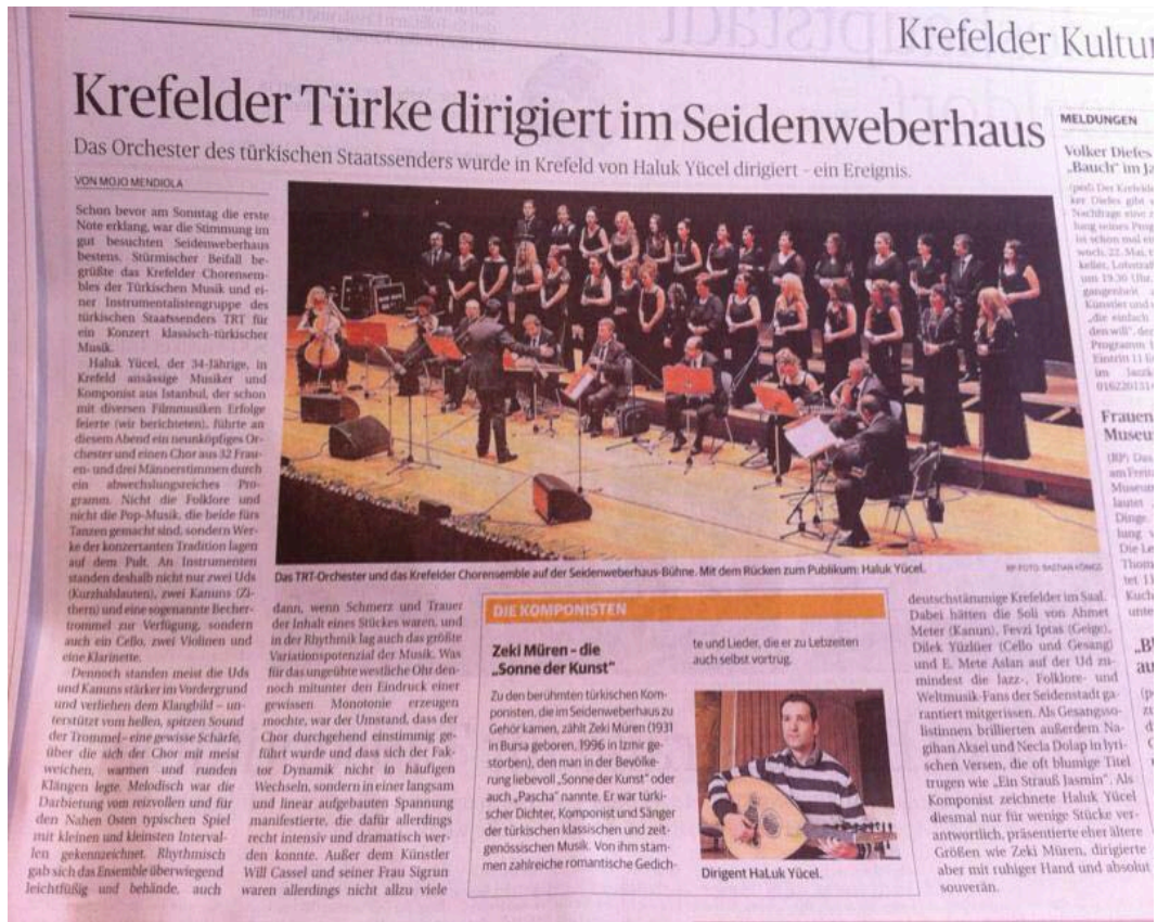
Şekil A.11: Krefeld Türk Müziği Topluluğu Konseri Sonrası Rheinsche Post 17.06.2013