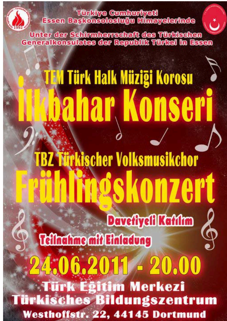
Şekil A.7: T.C. Essen Başkonsolosluğu'nun Himayesinde Gerçekleşen Konser