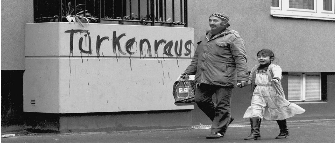
Şekil 2.8: Türkleri istemeyen duvar yazısı ve Türk işçi Türkler dışarı!

Şubat 1981’de Nürnberg’de yer alan Federal Çalışma Dairesinde yapılan görüşmeler sonrasında basına verilen bir demeçte 1980 başındaki enflasyonist çalkantılara neden olarak işsizlik parası alan 1 milyon 309 bin kişi gösterilmişti. O dönem Türkiye’den Almanya’ya giden insanların varlığı ilk defa tartışmaya açılmış ve kamuoyunda sert tartışmalar sürerken ülkedeki konut sorunu nedeniyle Berlin, Hamburg ve Göttingen şehirlerinde on binlerce Alman yürüyüşe geçmiş ve kitlesel eylemler başlamıştır. Ancak ilk defa bir Türk merkezli şirket olan Türk Hava Yolları Kurumunun iş yerine saldırılar başlamış, tüm camlar kırılarak maddi bir zarar verilmiştir. Hamburg’daki bu olay aslında gençlerin atom reaktörlerinin kurulmasına karşı ayaklanması ile başlamış ancak gecenin geç saatlerinden itibaren olaylar farklı bir boyut kazanmıştır. 1981’de Berlin duvarına yazılan iki slogan yeni hedefi ortaya koyuyordu.