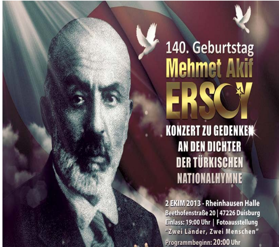
Şekil A.21: Kùltürlerarası Müzik ve Sahne Sanatları Enstitüsü NRW Türk Müziği Korusu Mehmet Akif Ersoy Özel Konseri