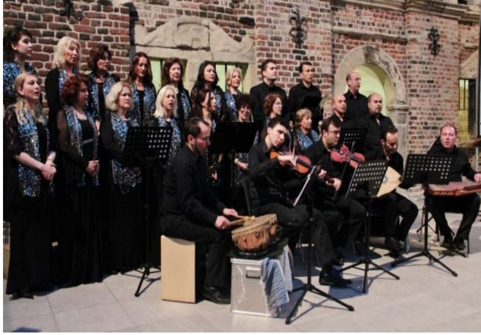
Şekil A.4: INIMB Gelsenkirchen Konseri