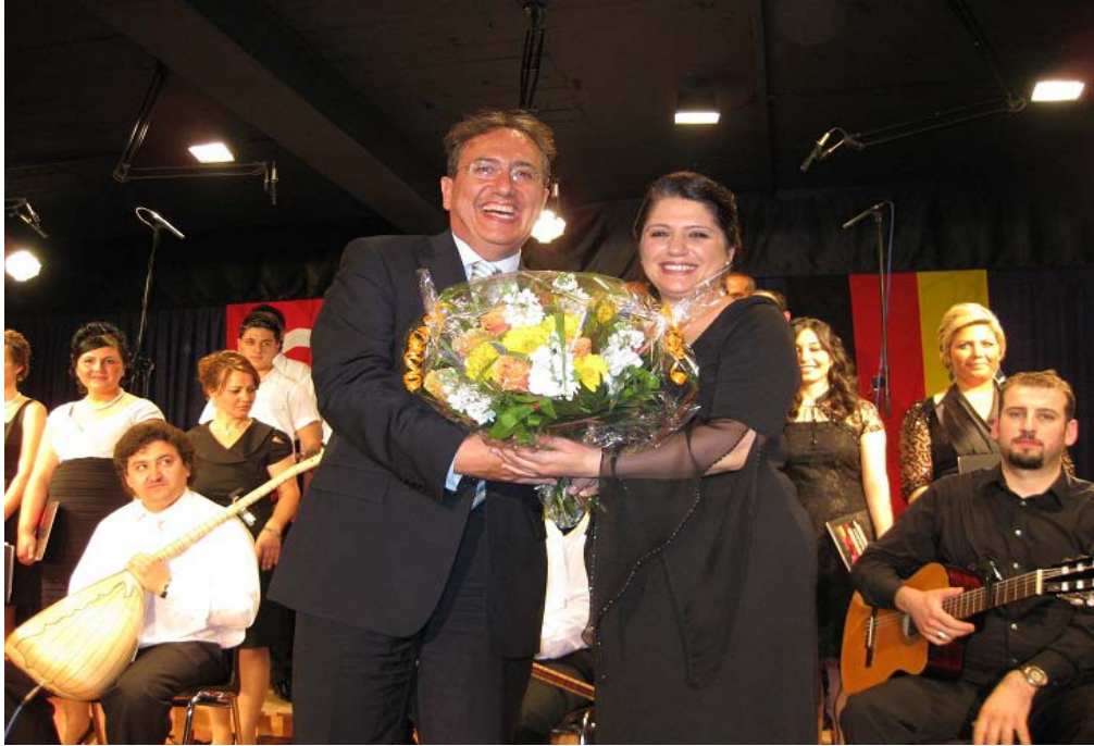
Şekil 2.18: T.C. Essen Başkonsolosluğu'nun Himayesinde Gerçekleşen Bir Konser