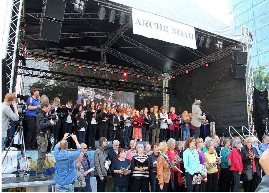
Şekil A.2: INIMB Gelsenkirchen Konseri