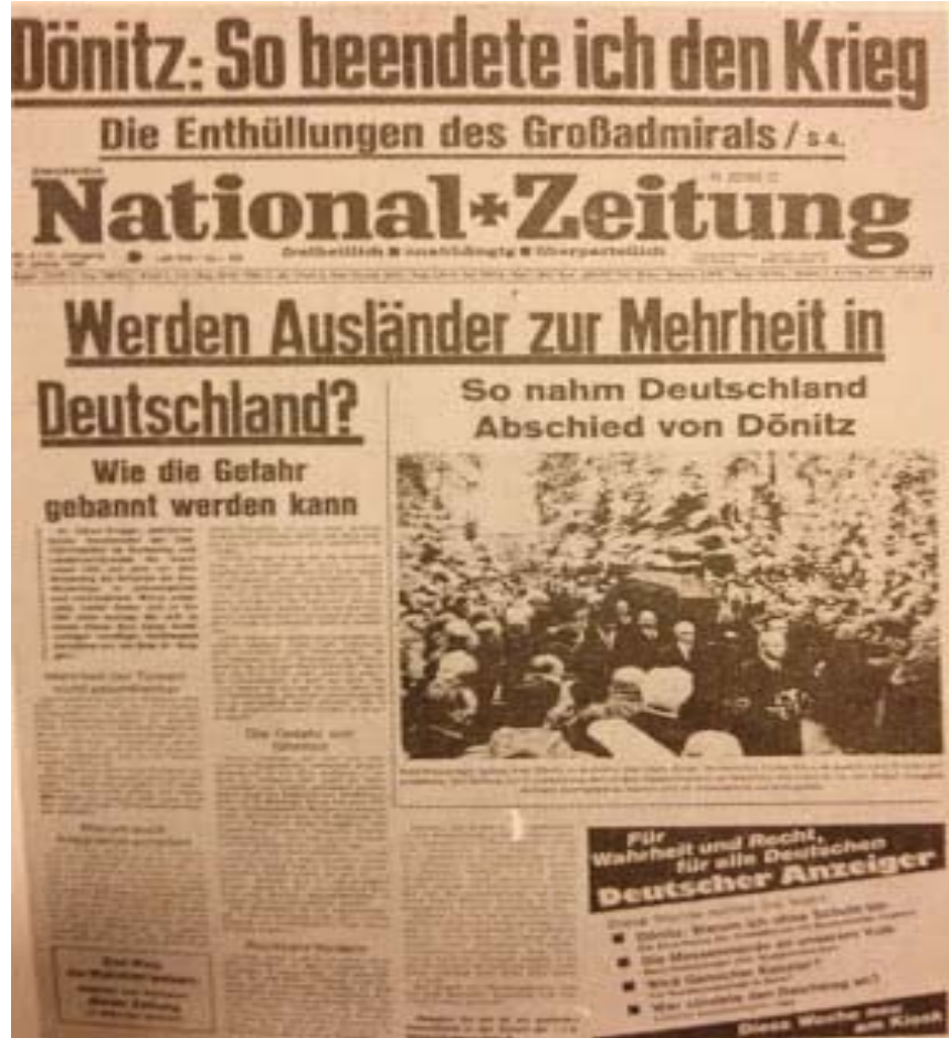
Şekil 2.7: National Zeitung Haberi 16.01.1933