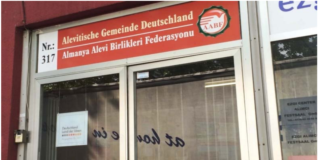
Şekil 2.10: Almanya Alevi Derneği

Bunun dışında Krefeld'deki Ailevi Derneği bünyesinde amatör bir halk müziği çalışması ve bağlama dersleri yapılmaktadır.