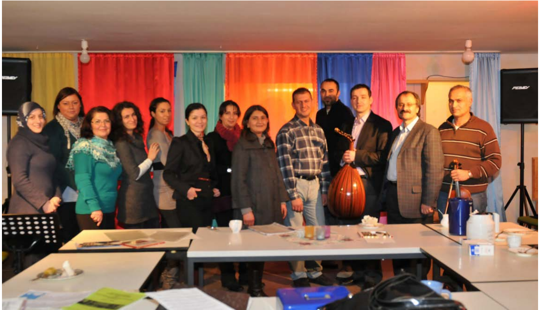
Şekil 3.14: Gelsenkirchen AWO Türk Sanat Müziği Korosu

Yaş aralığı olarak oldukça genç bir topluluktur ve üniversite öğrencileri, öğretmenler ve mühendis gibi meslek gurubundan insanlar bulunmaktadır. Koro içinde halk müziğinden de çalışmalar yapmakta, eserler geçilmektedir. Notaya dayalı bir çalışma uygulanmamaktadır.