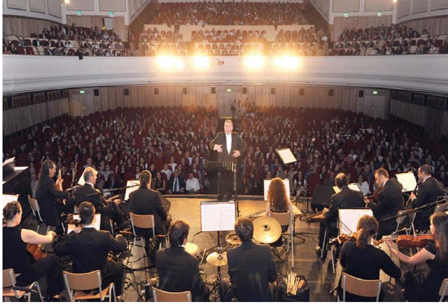
Şekil A.18: Neuss Türk Sanat Müziği Korusu Konseri Essen 2012