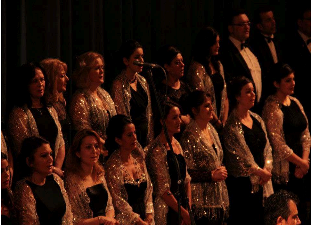
Şekil A.16: Neuss Türk Sanat Müziği Korosu Konseri. Aralık 2011