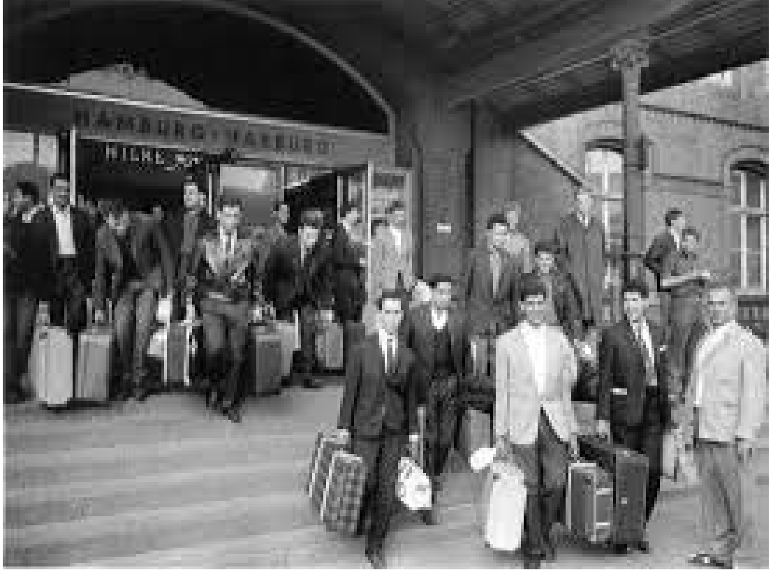
Şekil 2.1: Hamburg Tren İstasyonu Önündeki Türk İşçi Kafiliyesi