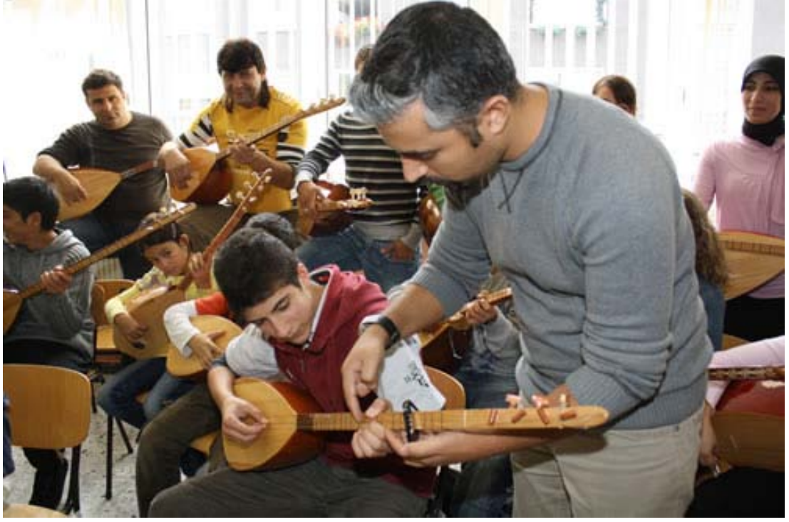
Şekil 3.18: Dortmund Türk Eğitim Merkezi Müzik Çalışmaları