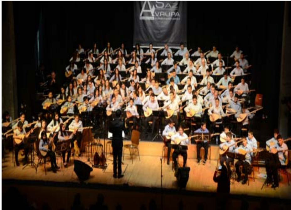
Şekil 2.15: Almanya'nın Dietzenbach kentinde "Avrupa Saz Okulu"nun Bir Konseri

Almanya'nın Dietzenbach řhrinde "Avrupa Saz Okulu" yaptıđı bařarılı konserlerle b?lgesinde yařayan halk m?ziđi severlere ulařmaktadır. M?zik okulu her sene T?rkiye'den gelen sanat?ılarla birlikte konserler vermektedirler.