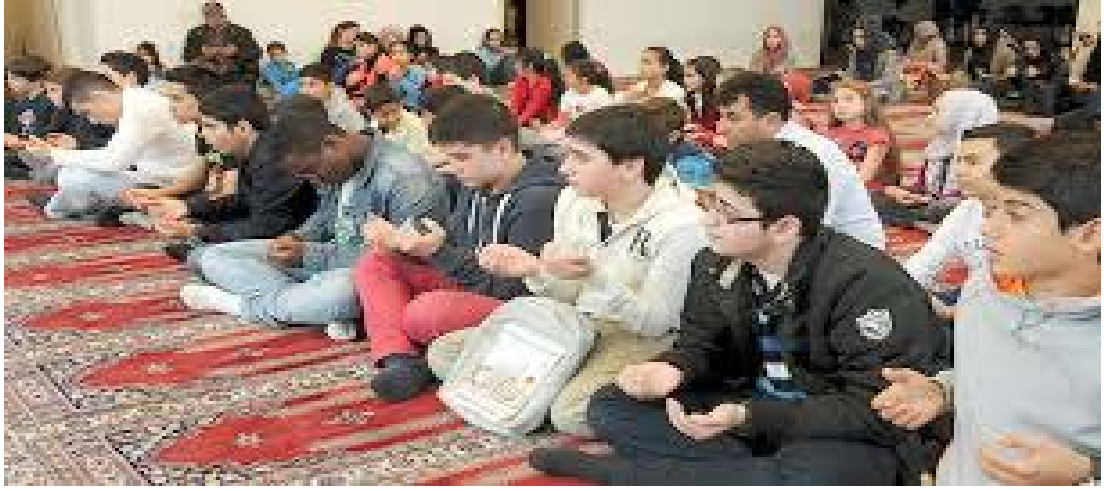
Şekil 2.9: Köln Diyanet İşleri Camii

ve 3-5 çocuktan oluşan, sadece dini geceler için okunması düşünülen ilahi öğrettiklerini öğrendik.