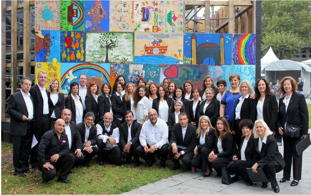
Şekil A.3: INIMB Gelsenkirchen Konseri