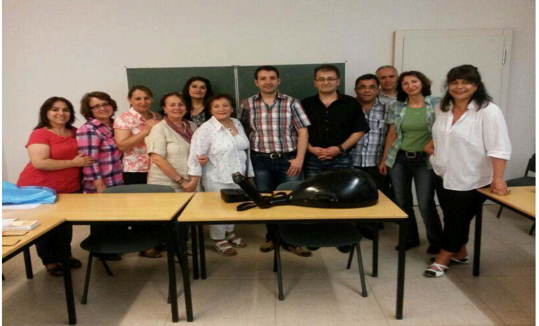
Şekil 3.8: Duisburg Alaturka Türk Sanat Müziği Korosu 17.06.2014

Koro ile İlişkisi : Koro yönetim kurulu başkanım.