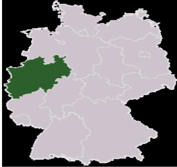
Şekil 3.1: Almanya NRW Eyaleti

Çalışmamızın asıl merkezi olan Krefeld ve Leverkusen şehirlerini kapsayan Kuzey Ren Vestfalya Eyaleti (NRW) aşağıdaki resimdeki Almanya haritasındaki koyu yeşil ile gösterilmiştir.