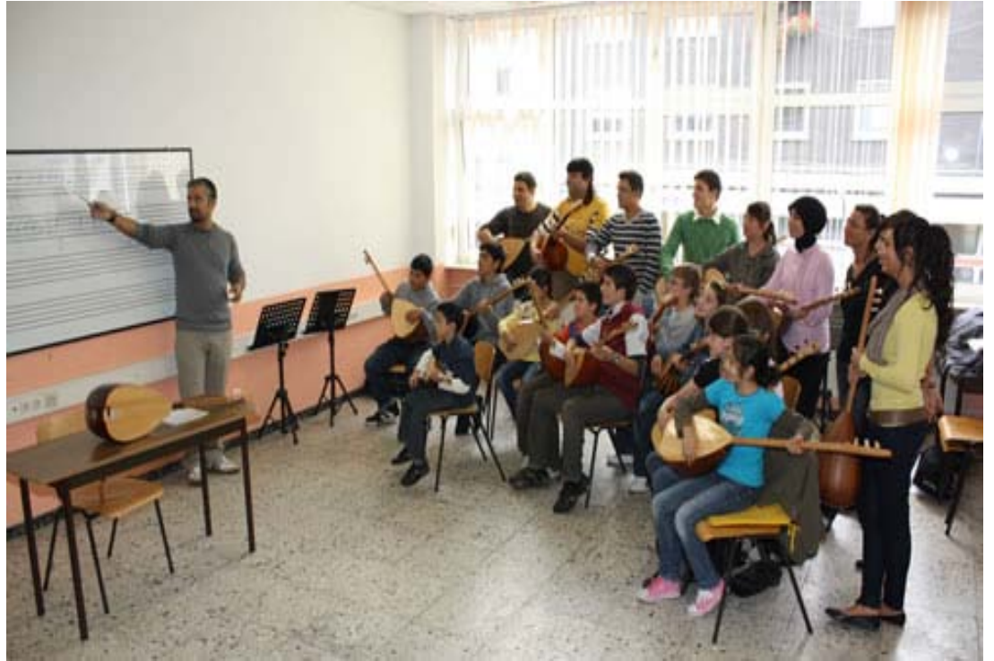
Şekil A.25: Dortmund Türk Eğitim Merkezi Müzik Çalışmaları