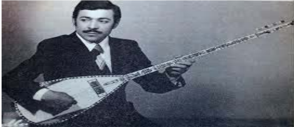
Şekil 2.12: Neşet Ertaş

Bu dönemde müziğe imza atan bir diğer isim Neşet Ertaş olmuştur. Yaptığı plaklar, söylediği türkülerle kitleleri peşinden sürüklemiştir.