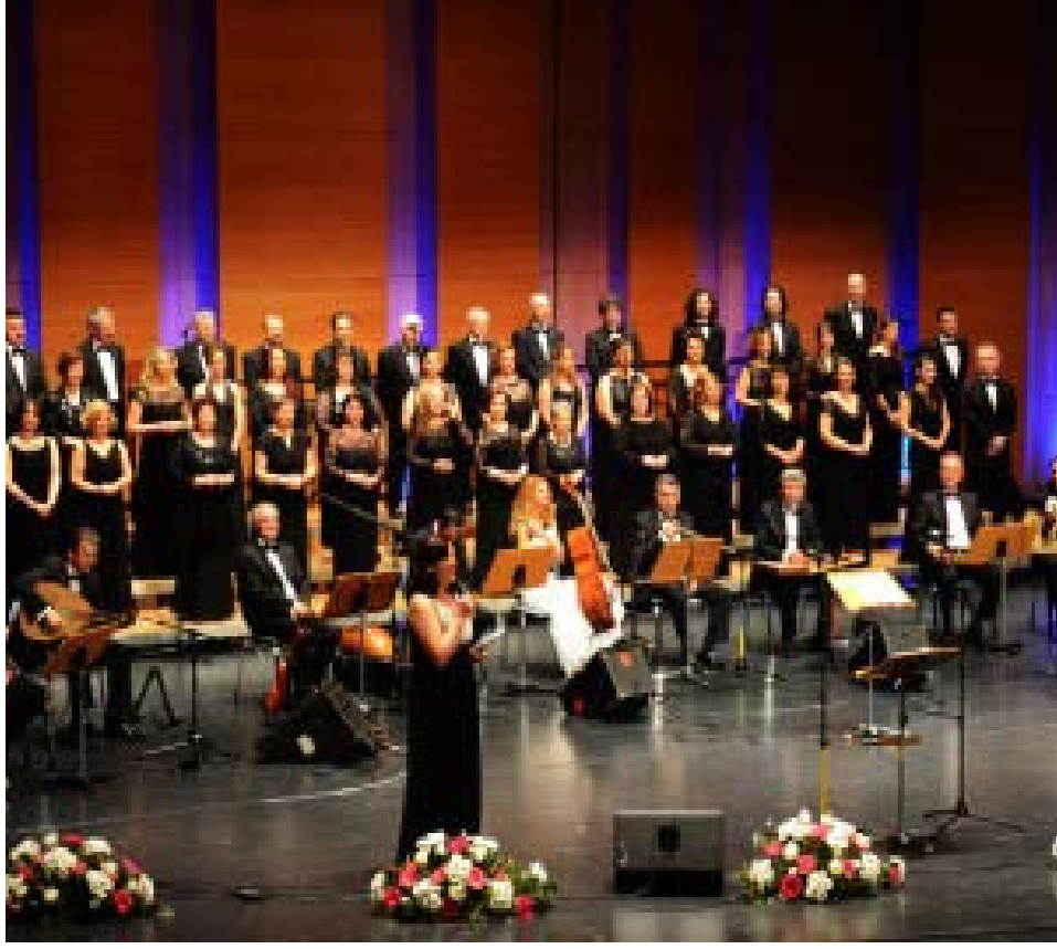
Şekil A.14: Leverkusen Musiki Cemiyeti Konseri Post Gazetesi 17 Nisan, 2014