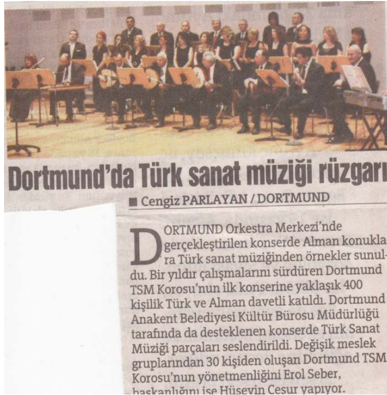
Şekil 3.19: Dortmund Türk Sanat Müziği Korusu Konser Haberi

Koronun genel yaş ortalaması 35-55 arasındadır ve yaklaşık 30 kişiden oluşmaktadır. Koroda sadece şarkılar öğretilip nazari bilgiler verilmemektedir. Aynı zamanda isteyenlere özel dersler de sunulmaktadır. TRT kurumundan ses sanatçıları zaman zaman konserler davet edilmektedir.