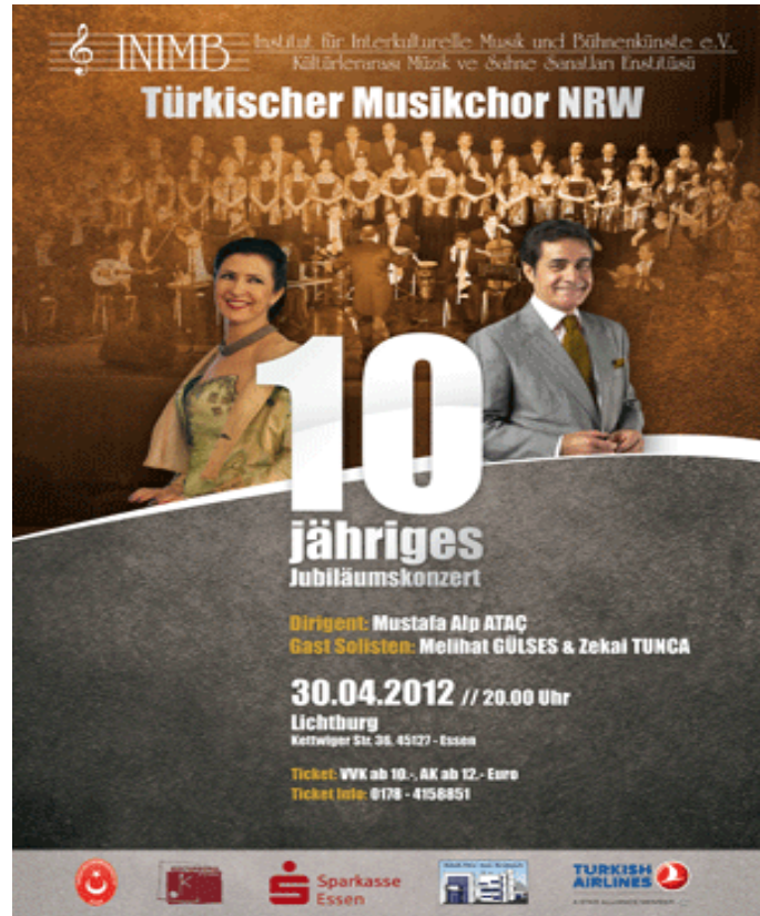
Şekil A.17: Neuss Türk Sanat Müziği Korosu Konseri. 10. Yıl Konseri