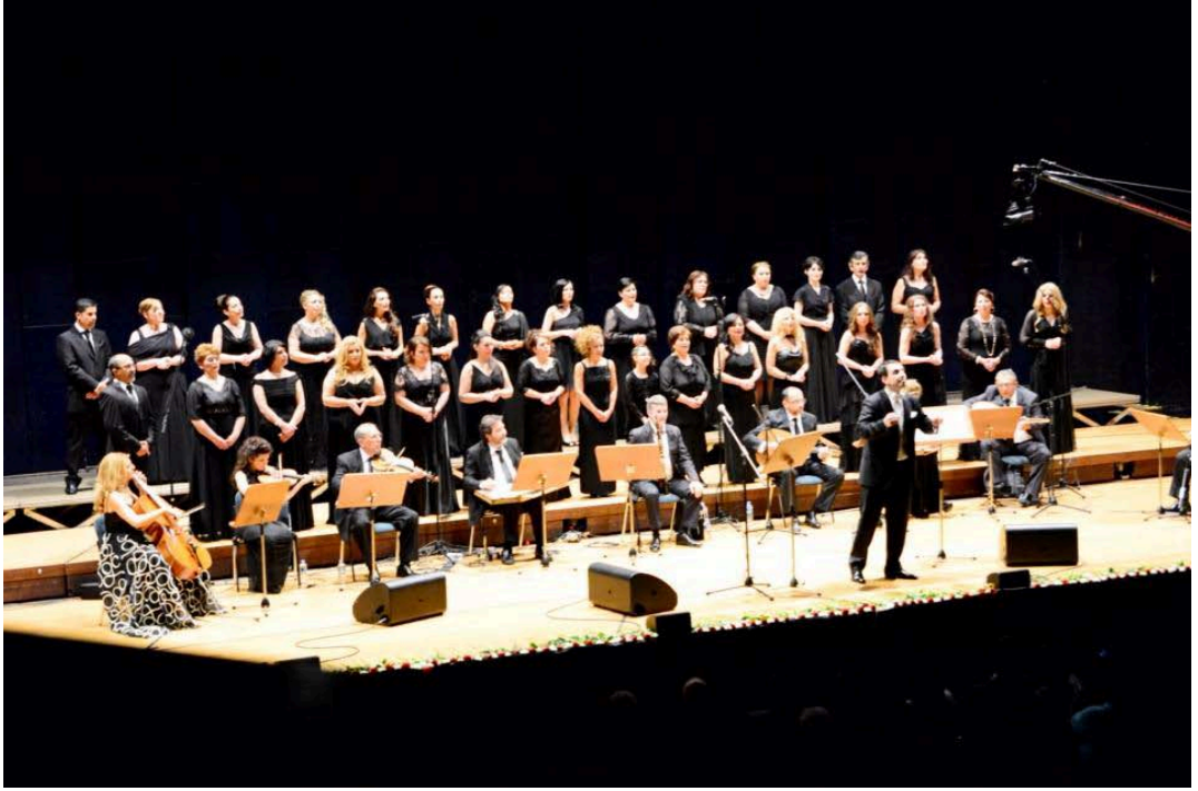
Şekil 3.2: Krefeld Türk Müziği Topluluğu Konseri Mayıs 2013