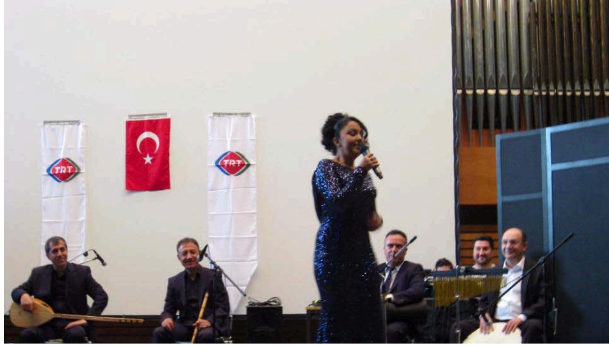
Şekil 2.14: TRT K?ln T?rk Halk M?ziđi Konseri