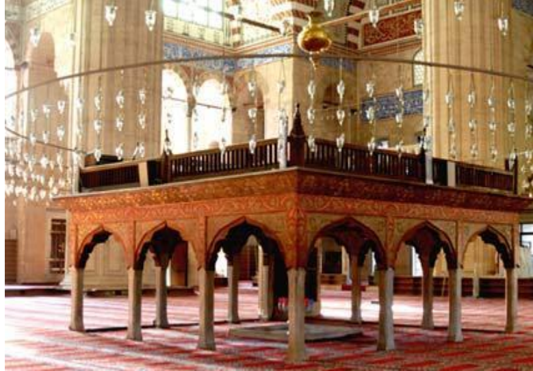
Şekil 1: Cami Mahfilleri