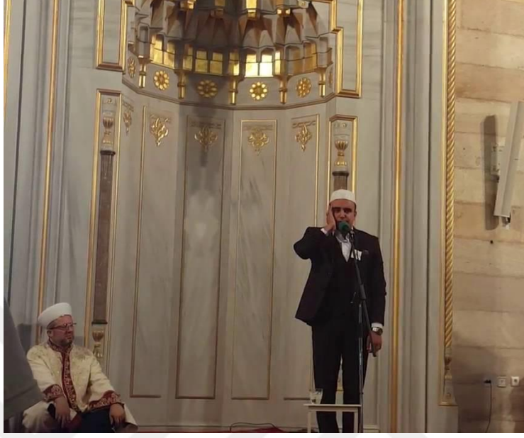
Şekil 2: Minber Önü