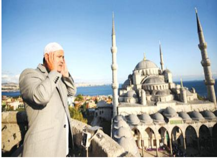
Şekil 3: Cami Minareleri