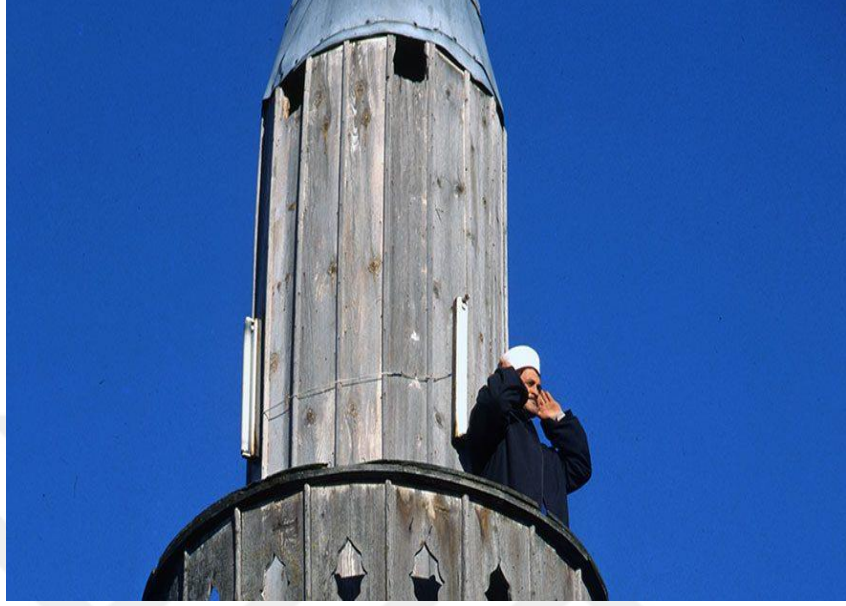
Şekil 4: Cami Minareleri