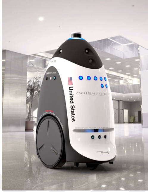
Şekil 4.14.3.7. Knightscope, ABD (Knightscope, n.d.)

Buna karşın, düşmanca tasarımların sorumluluğunun, farklı aktörlerden (kent yönetimindeki etkin bürokratlar, özel mülkiyete sahip alanların kamuya terk edilmiş bölgelerini çitlemek isteyen mal sahipleri ve belki de her gün düşmanca tasarımlar ile iç içe yaşamasına rağmen farkındalığı kısıtlı tüm bireyler) meydana gelen geniş bir ağa paylaştırılması gerekliliği gözden kaçırılmamalıdır.