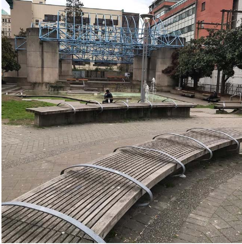
Şekil 4.14.3.1. Kent mobilyası, Vancouver/Kanada (Design Crime Gallery, n.d.)

Evsiz bireylerin kamusal alandaki yaşamları için yaşamsal öneme sahip mekan ve objeler, bu tasarımlar aracılığı ile onların kullanımına ve erişimine kapatılmaktadır. Üzerinde uyuma imkanı barındıran yüzey ve objeler, uyumayı imkansız kılmak üzere yeniden tasarlanmakta (Şekil 4.14.3.1), evsizler için bir geçim kaynağı olarak epeyce yaygın olan atık toplama işi, erişilemez çöp kutusu tasarımları vasıtasıyla hatırı sayılır düzeyde engellenmektedir.