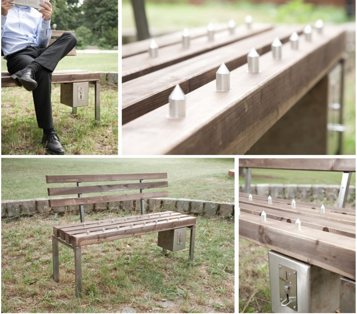
Şekil 4.14.3.6. Pay & Sit - the Private Bench, Almanya (Fabian Brunsing, 2008)

Tasarımcıların bilerek ya da bilmeyerek düşmanca tasarımlara hatırı sayılır bir katkıda buldukları, bu örnekler ile ortadadır. Pek çok tasarımın ise bir kaza ya da düşüncesizliğin ürünü olmadığı, tam tersine düşmanca bir düşünme sürecinin içerisinde hesaplanmış, tasarlanmış, onaylanmış, fonlanmış ve gerçeğe dönüştürülmüş olduğu akıldan çıkarılmamalıdır (Andreou, 2015). Knightscope adlı firmanın ürettiği güvenlik robotunun San Francisco şehrinde gözetimin haricinde kentin kaldırımlarındaki evsiz kamplarını da taciz etme ve süpürme görevi üstlenmesi (Robinson, 2017) bu tasarımların pek çoğunun kötücül işlevleri konusunda şüpheye düşmemizi engelleyen örneklerin başında yer almaktadır (Şekil 4.14.3.7).