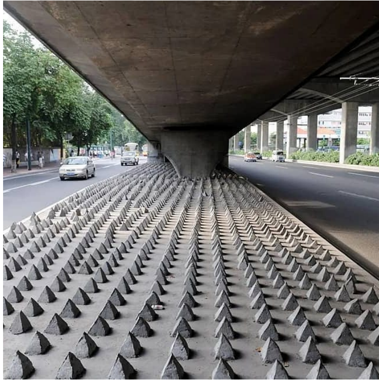
Şekil 4.14.3.3. Bir Köprüaltı, Guangdong/Çin (Hostile Design, n.d.)

Uyumak, hatta oturmak sadece oturma elemanlarında değil, dolaşım alanlarında da yaygın bir biçimde engellenmektedir (Şekil 4.14.3.3). Bu uygulamalar tasarımın düşmanlığının biçimsel olarak en fazla görünürleştiği örnekleri üretir.