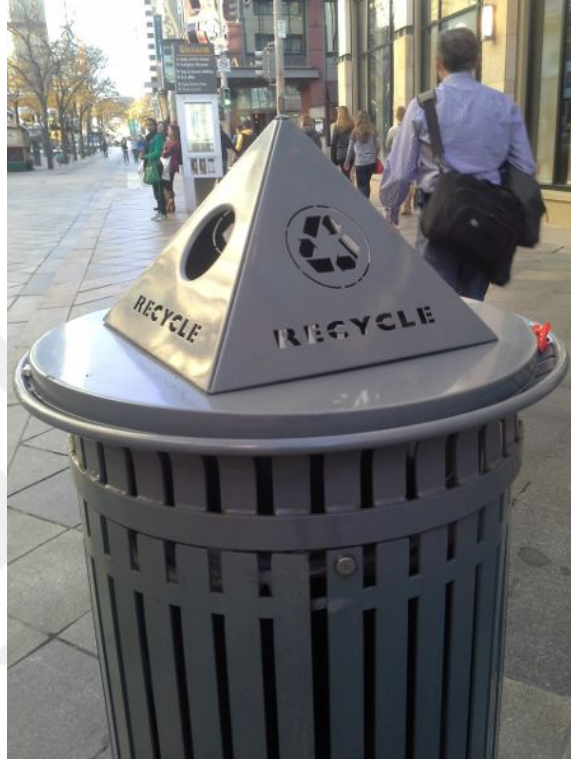
Şekil 4.14.3.4. İçeriden kilitlenen erişilemez çöp kutusu, Denver/Colorado/ABD (Rosenberger, 2018)

Evsizler için, hem atık toplama, hem de beslenme istasyonu görevini yerine getiren çöp kutuları, yağmurdan koruyucu başlıklar veya kilitler aracılığı ile içerisindekilere erişimin imkansız kılındığı yeni tasarımlar ile yer değiştirmektedir 133 (Şekil 4.14.3.4).