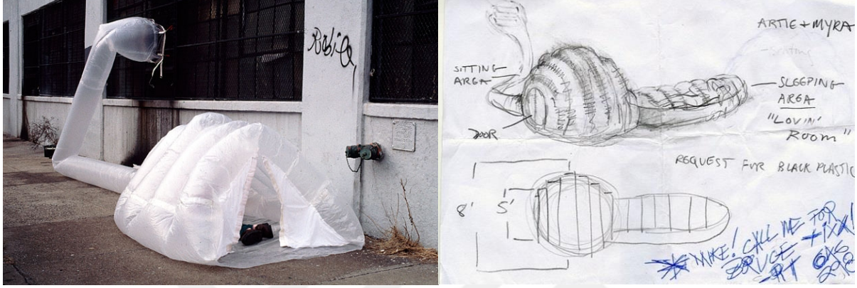
Şekil 4.14.1.3. paraSITE [Parazit] (Rakowitz, 1998)

kamusal alanda uyumayı mümkün ve görünür kılmaktadır. Evsizlik pratiğini ortadan kaldırmaktan ziyade, daha da görünürleştiren, üstelik bunu yapılara akılcı bir biçimde eklenerek –daha doğru bir deyişle onlardan faydalanarak- yapan bu tasarımın, evsizlik pratiğinin söylem ve pratiklerine pekiştirici bir etkisinin olduğu açıktır.