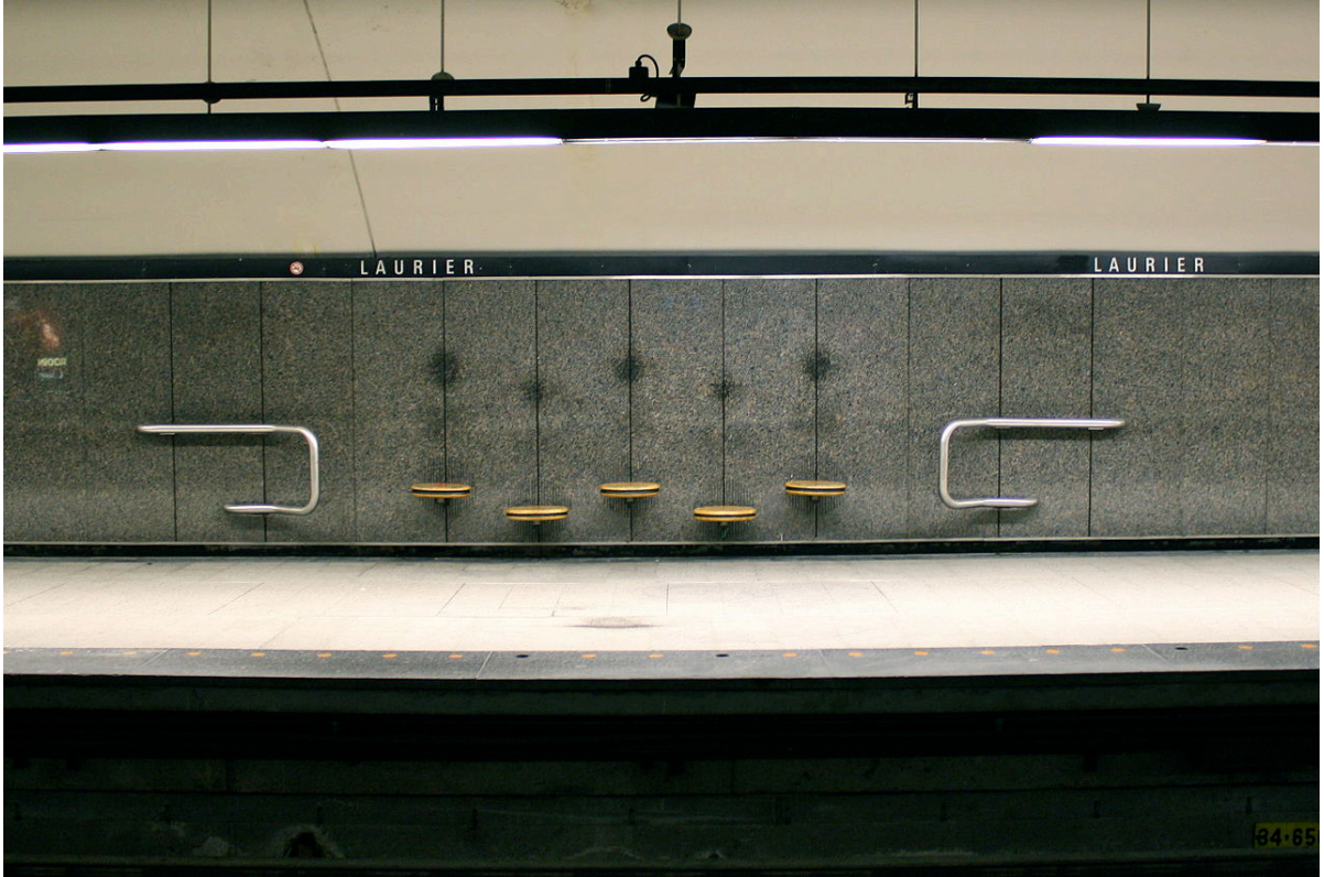
Şekil 4.14.3.5. Montreal Metrosu için Jean-Paul Pothier'in tasarladığı oturma elemanı, Kanada (Rosenberger, 2018)

Ancak kimi zaman, tasarımcısının kurguladığı hedef düşmanca olmaktan çok uzak olmasına rağmen (hatta tam tersi amaçlanırken) hedefinin aksi yönde bir kadere yönlendirildiği durumlar da mevcuttur. Örneğin, Jean-Paul Pothier, Montreal metrosu için tasarladığı oturma elemanlarında, çocuklar için erişilebilirlik sağlamak için, farklı kotlarda monte edilebilen tekil koltuklar düşünmüştür (Şekil 4.14.3.5). Ancak bu tasarımı, uygulamada etkili bir anti-evsiz fikre dönüşmüştür (Rosenberger, 2018).