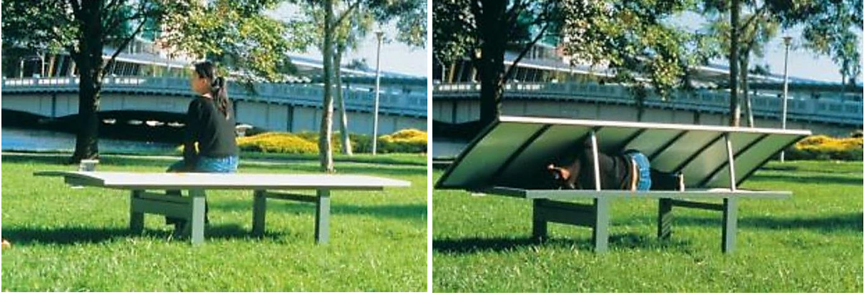
Şekil 4.14.1.4. Park Bench House (Sean Godsell Architects, 2002)

Son olarak, Slovakyalı tasarımcılar Michal Polacek, Matej Nedorolik and Martin Lee Keniz'in büyük reklam panolarını bir strüktür haline getirerek, evsizler için içinde yatak, mutfak, banyo ve çalışma masası olan 20 m 2 'lik bir yaşam alanı haline getirdikleri Project Gregory (Stott, 2014) evsizlik koşullarını inceleyen, bu koşulları iyileştirme yönünde tasarımı devreye sokan ve mevcut barınma rejimi ile ilişki kurmayan bir diğer örnektir (Şekil 4.14.1.5).