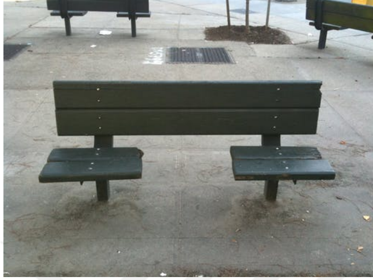
Şekil 4.14.3.2. Uyumanın engellendiği bir oturma elemanı tasarımı (Guimapang, 2019)

Uyumak, hatta oturmak sadece oturma elemanlarında değil, dolaşım alanlarında da yaygın bir biçimde engellenmektedir (Şekil 4.14.3.3). Bu uygulamalar tasarımın düşmanlığının biçimsel olarak en fazla görünürleştiği örnekleri üretir.