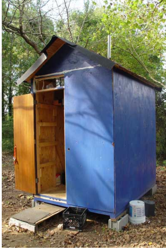
Şekil 4.14.1.2. Hut [Baraka] (The Mad Housers, 1987)

burada barınan evsiz bireyler ihtiyaçlarına göre modifikasyonlar yapmaktadırlar. Mad Housers ekibi, en iyi fikirleri bu modifikasyonlardan öğrendiklerini belirtmektedirler. Aslında birkaç yıl ayakta kalabileceğini öngördükleri bu barınakların bazıları, on yılı aşkın süreler ufak bakım ve yenilemelerle kullanılmıştır. Barınma güvencesi sağlayan bu üniteler sayesinde ekonomik olarak güçlenen evsiz bireyler daha iyi barınma koşullarına geçmekte ve sahip oldukları bu barınakları başka evsiz kimselere devretmektedirler.