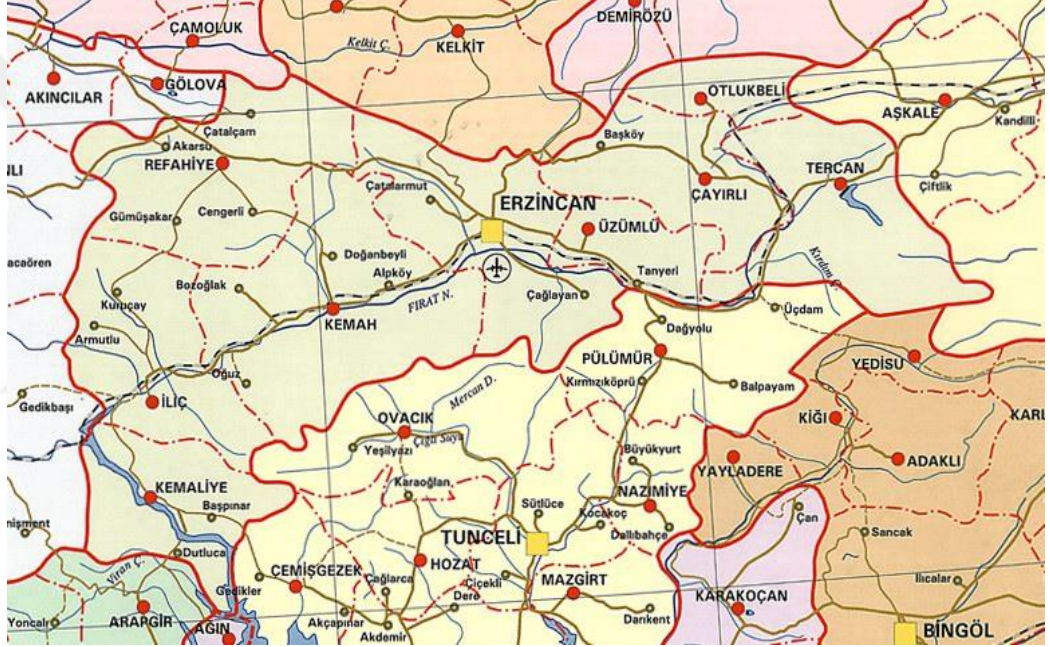
Şekil 2. Erzincan İli Haritası

Erzincan Doğu Anadolu Bölgesi'nin Kuzey Batı bölümünde Yukarı Fırat havzasında 39° 02' - 40° 05' kuzey enlemleri ile 38° 16' - 40° 45' doğu boylamları arasında yer almaktadır. Erzincan, Doğu Anadolu Bölgesi'nde Erzurum, Tunceli, Bingöl, Elazığ ve Malatya, İç Anadolu Bölgesinde Sivas, Karadeniz Bölgesinde Gümüşhane, Bayburt ve Giresun illeri ile sınırları olan bir ildir. Şehrin üç bölge ile sınırları mevcuttur. Erzincan'ın yüzölçümü 11.903 km 2 olup il merkezinin rakımı ise 1.185 metredir (www.erkincan.gov.tr, 2016).