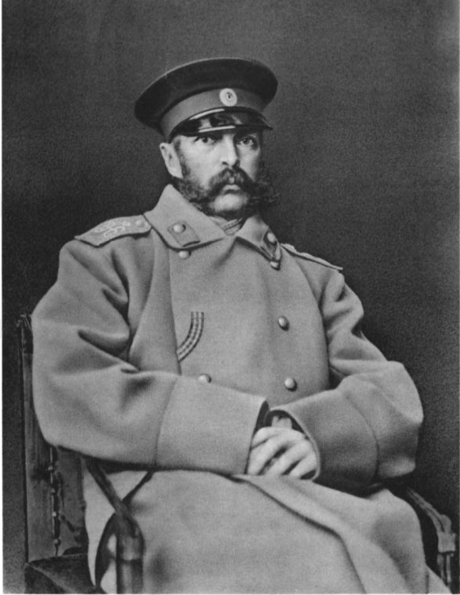
Государь Императоръ Александръ II.