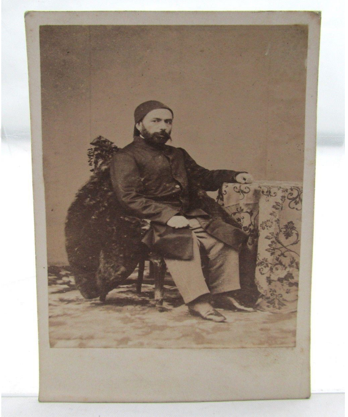
Mehmed Kabûlî Paşa