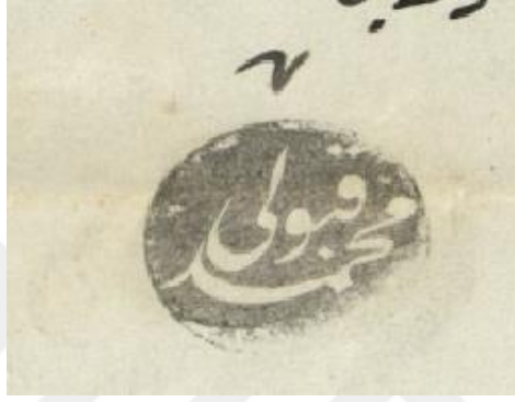
Mehmed Kabûlî Paşa'nın kullandığı mühür.