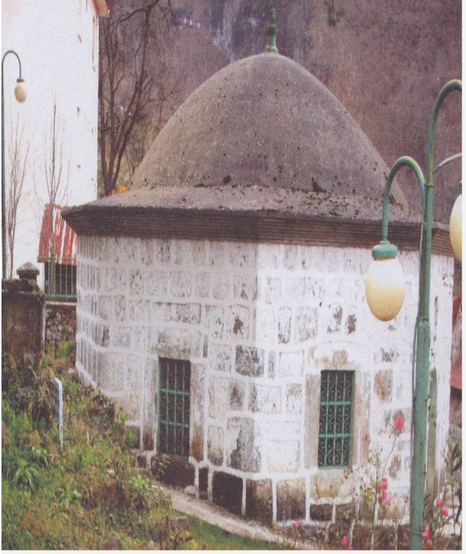
8. Yakup Halife Türbesi