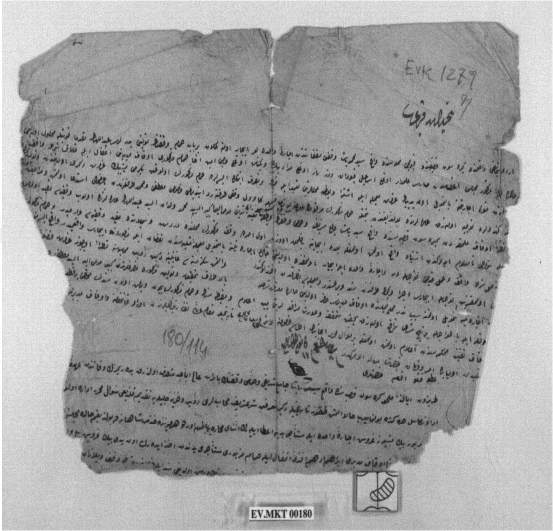
4. Kuyucu Hamamı ile İlgili Belge (BOA. EV.MKT. 00180)