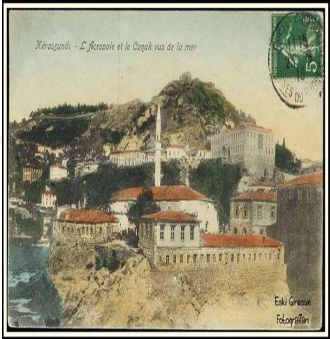
5. Yavuz Sultan Selim (Hüdavendigâr) Cami