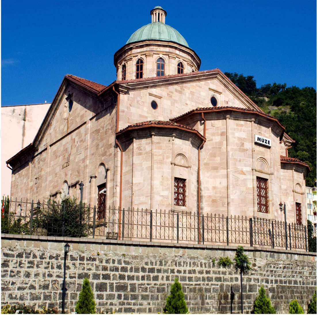
7. XIX. Asırdan Kalan Gogora Kilisesi (Günümüzde Giresun Müzesi)