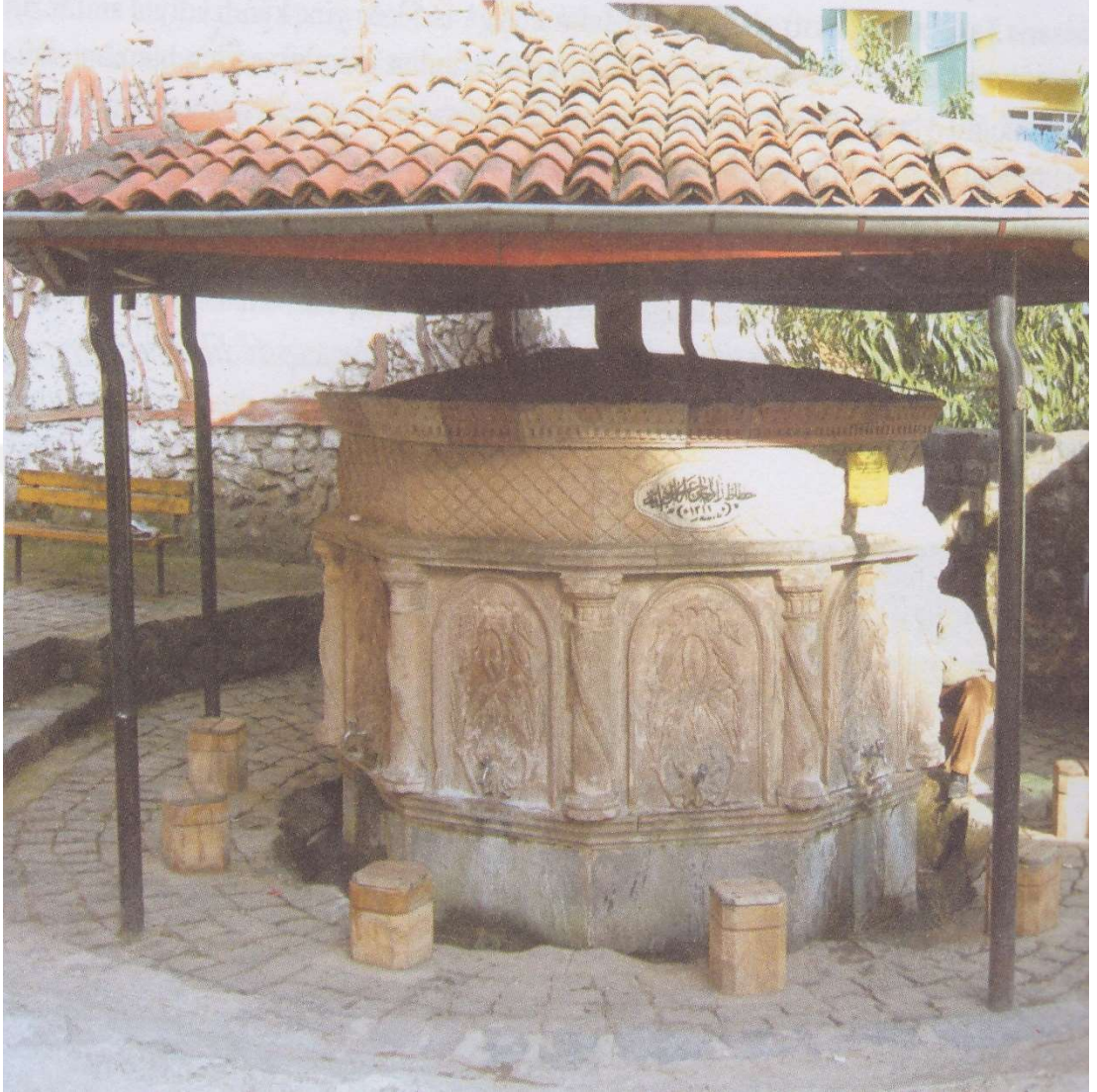
6. Hacı Hüseyin Cami Şadırvanı