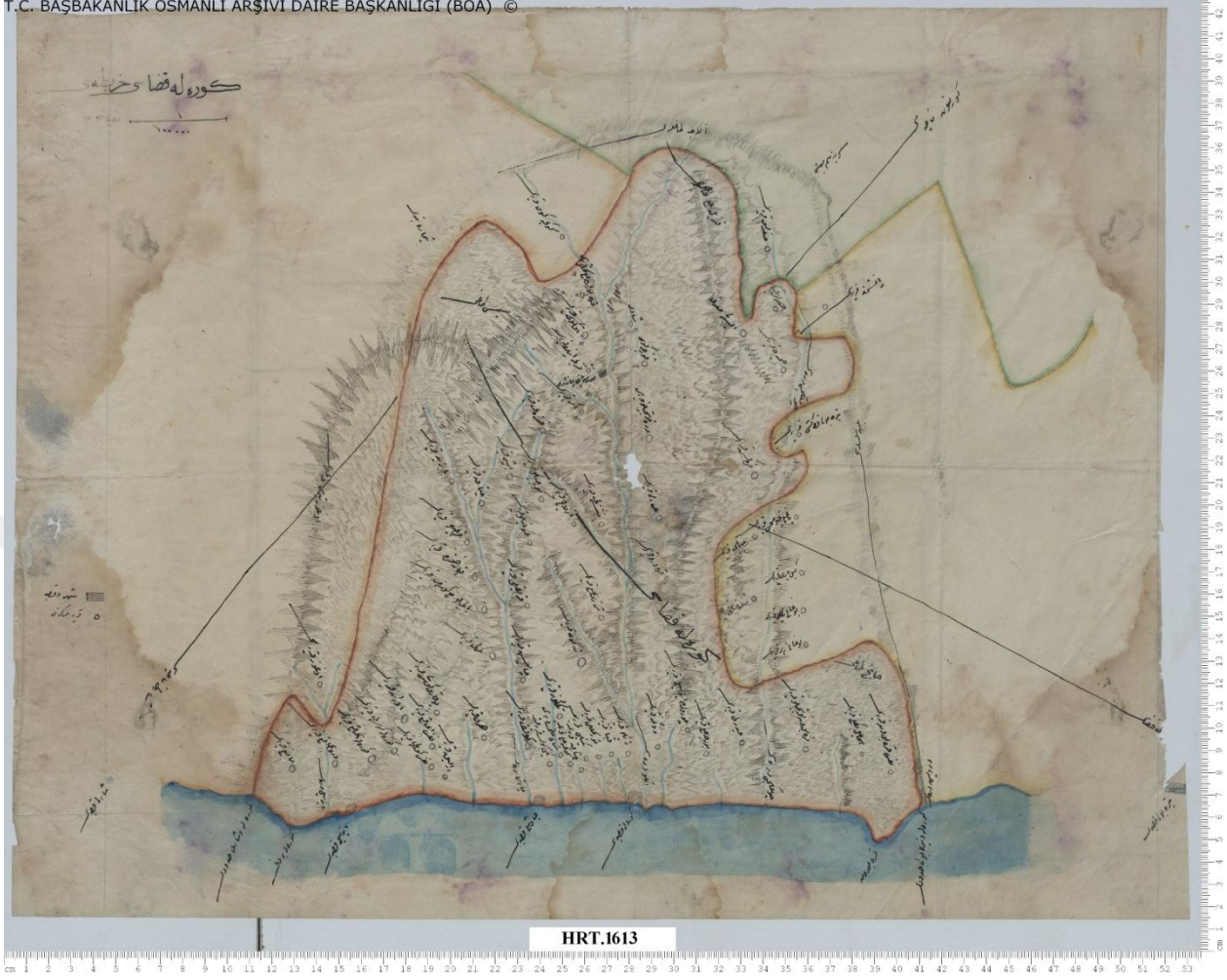
Ek 4. Görele Kazası haritası. Ölçek: 1/100000; Hrt-h. No: 1613