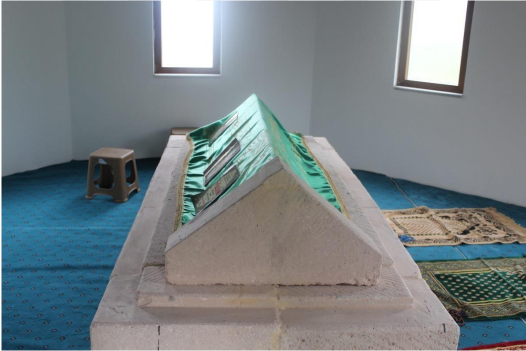
Şekil 12Şeyh Hasan Türbesi