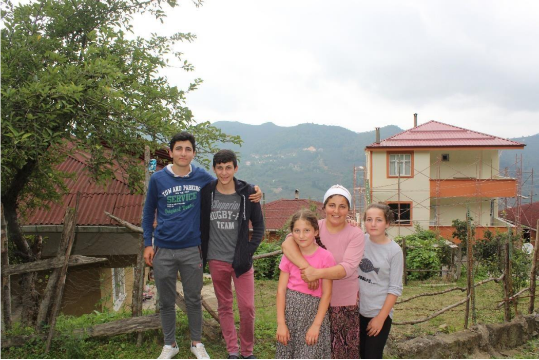
Şekil 11 Şeyh Halil Efendi'nin kerametini gerçekleştirdiği çeşme ve keramet hakkındaki bilgi alınıyöre halkı.