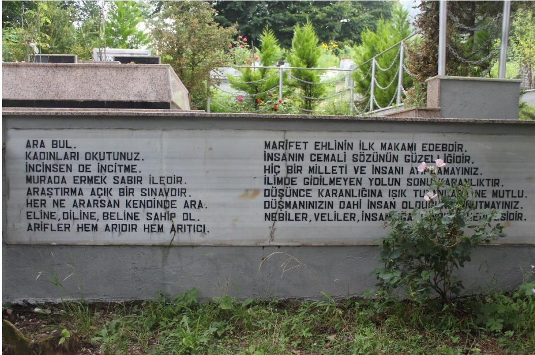
Şekil 2Akdî Efendi Evliyası Türbesi