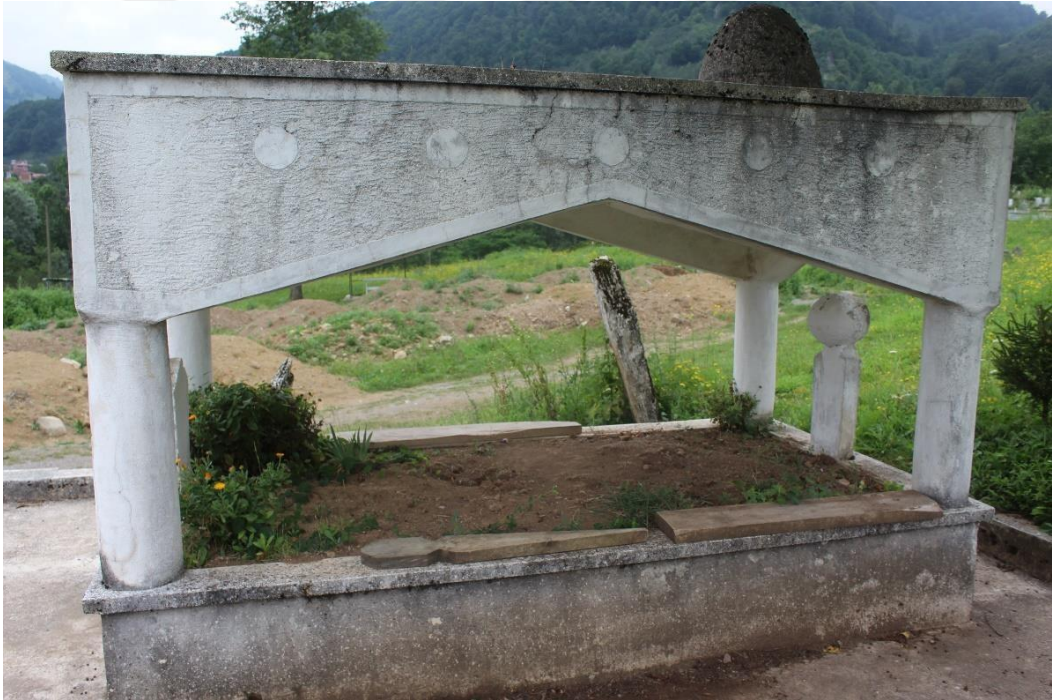
Şekil 10 Süleyman Efendi Türbesi