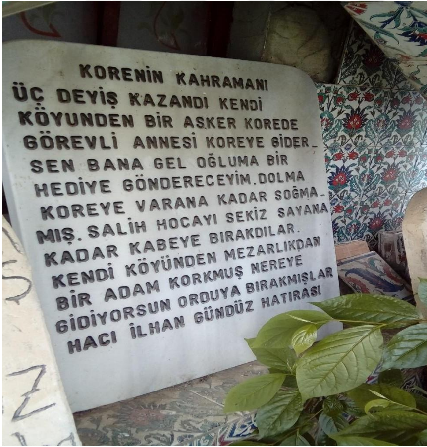
Şekil 5 Derviş Salih Türbesi