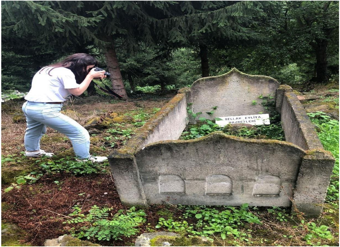
Şekil 9 Sellak Efendi Türbesi