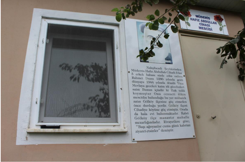
Şekil 7 Müderris Hafız Abdullah Türbesi