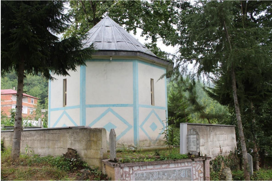
Şekil 14Şıdılu Dede Evliyası Türbesi