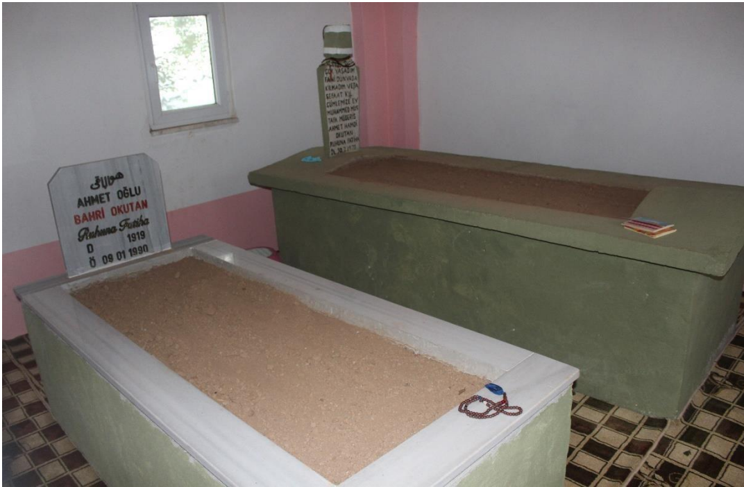
Şekil 3 Bağnut Hatibi Evliyası Türbesi