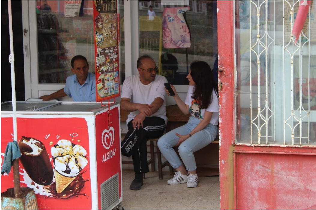
Şekil 8 Kaldırılan Sarı Sadık Abdullah Efendi türbesinin yerine yaptırılan cami.