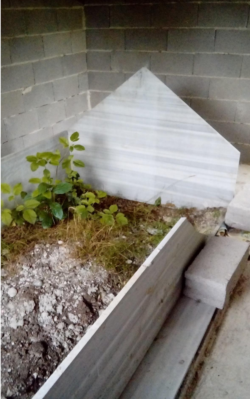
Şekil 13Şeyh Mahmud Türbesi