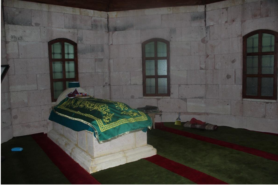
Şekil 6 Kutlu Doğmuş Evliyası Türbesi