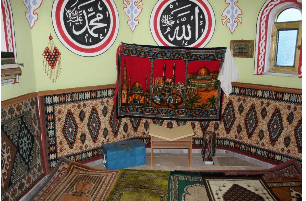
Şekil 15 Veli Ođlu Hafız Hoca Türbesi