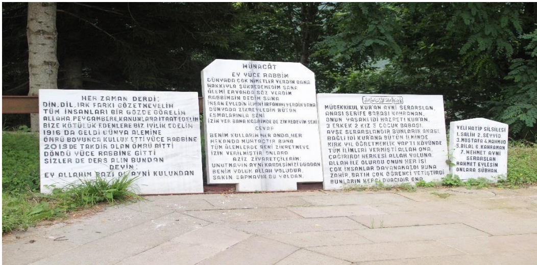
Şekil 1 Avni Efendi Evliyası Türbesi