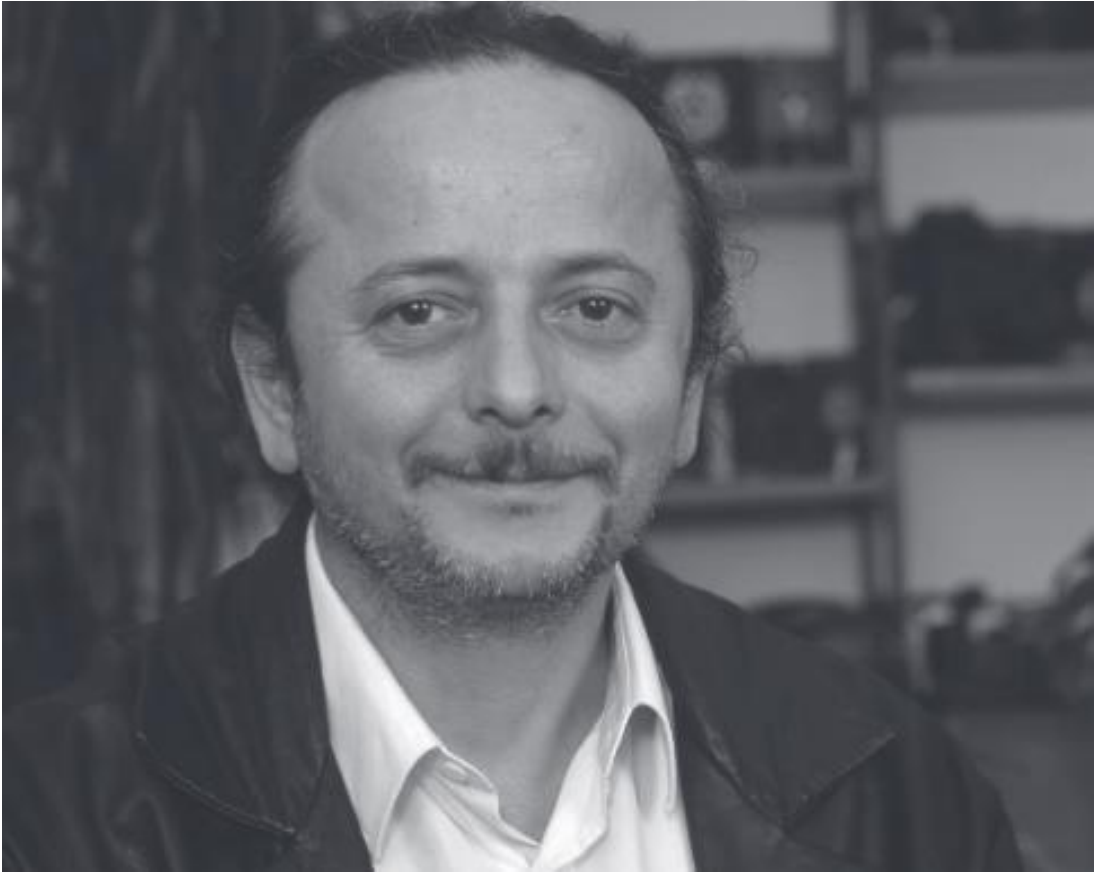
Varlık Dergisi, S. 1184, s. 50.