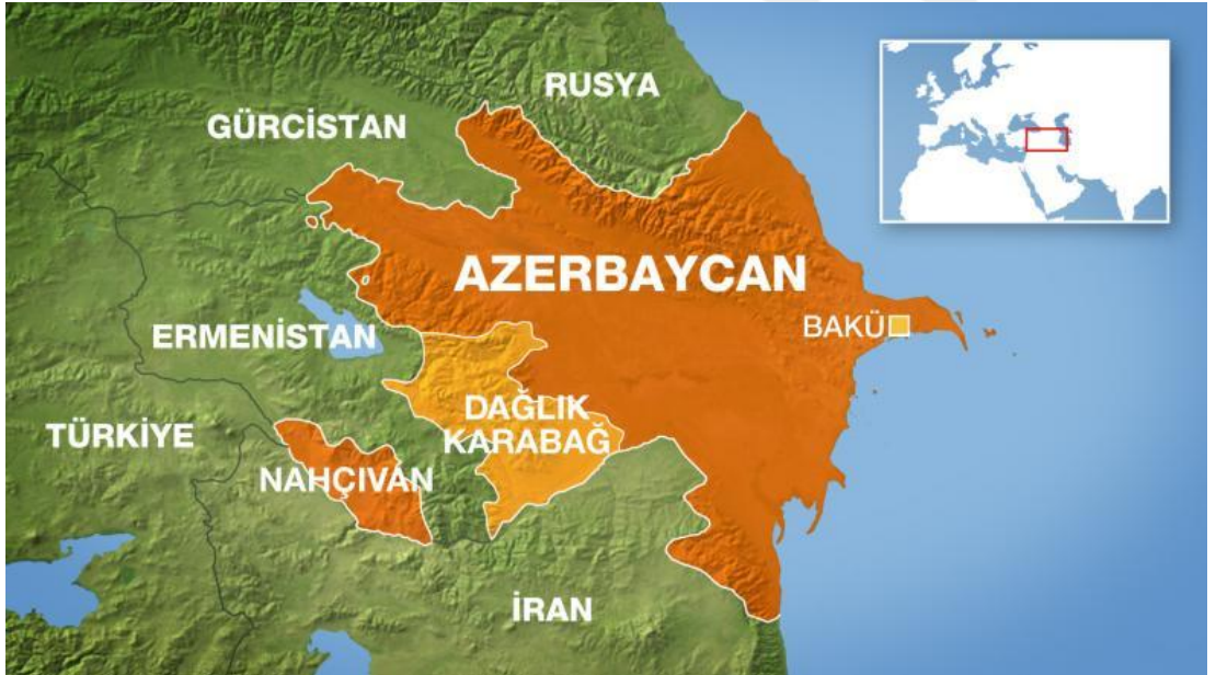
Şekil.12: Azerbaycan Siyasi Haritası