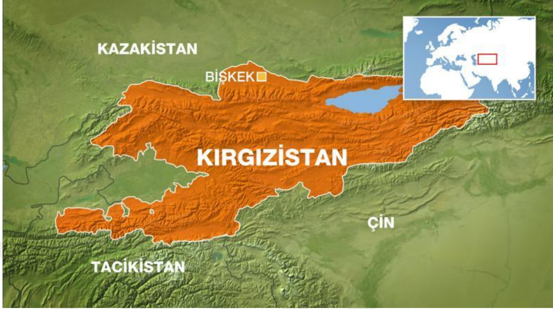
Şekil.3: Kırgızistan Siyasi Haritası