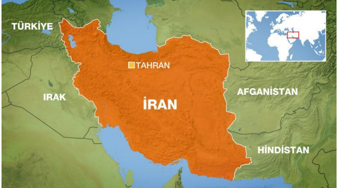
Şekil.10: İran Siyasi Haritası