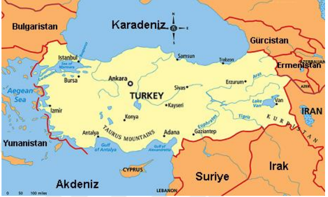
Şekil.9: Türkiye Siyasi Haritası