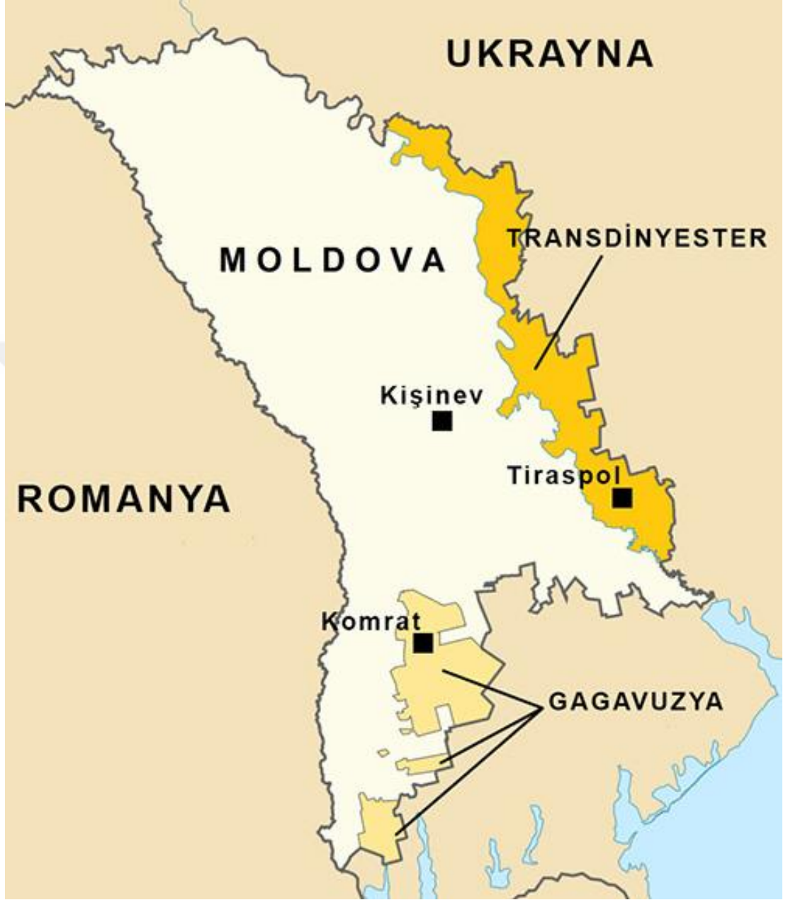
Şekil.6: Moldova Siyasi Haritası