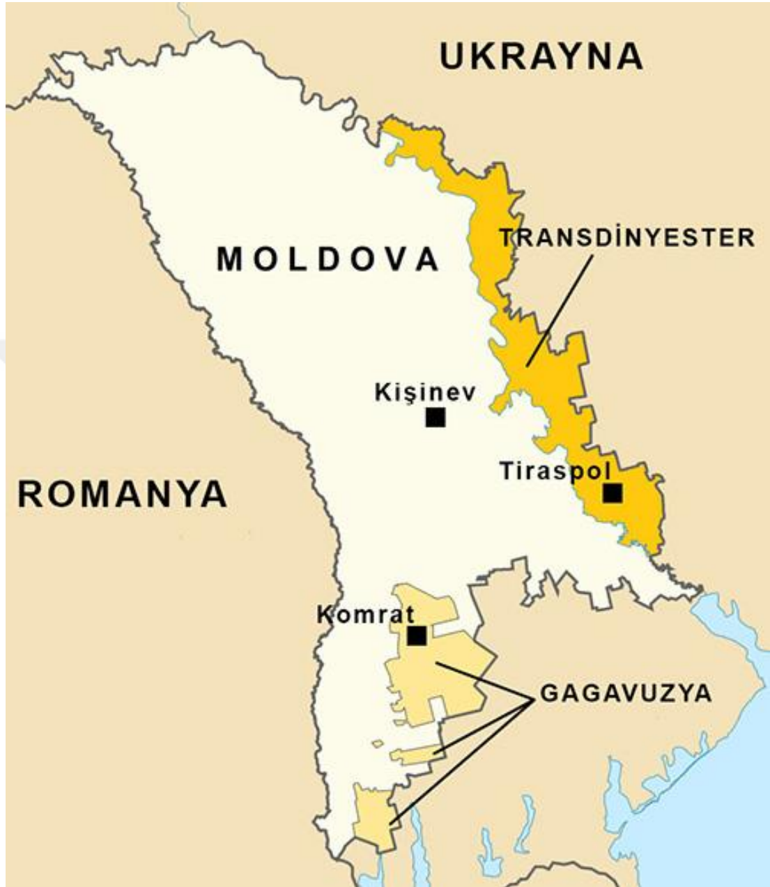
Şekil.6: Moldova Siyasi Haritası