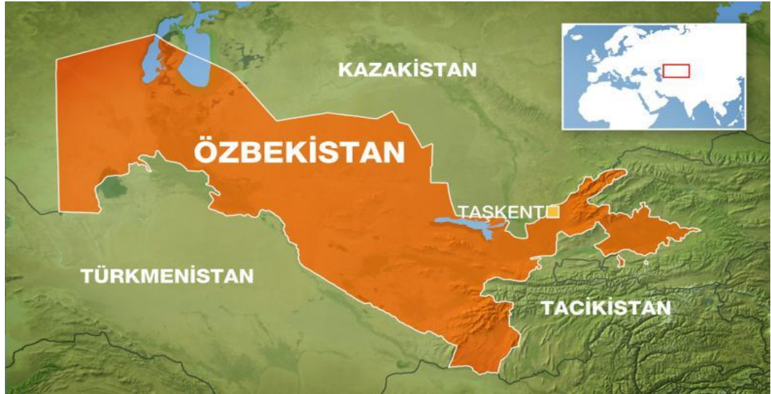
Şekil.7: Özbekistan Siyasi Haritası

Kaynak: “Ülke Profili: Özbekistan”, Aljazeera.com 55