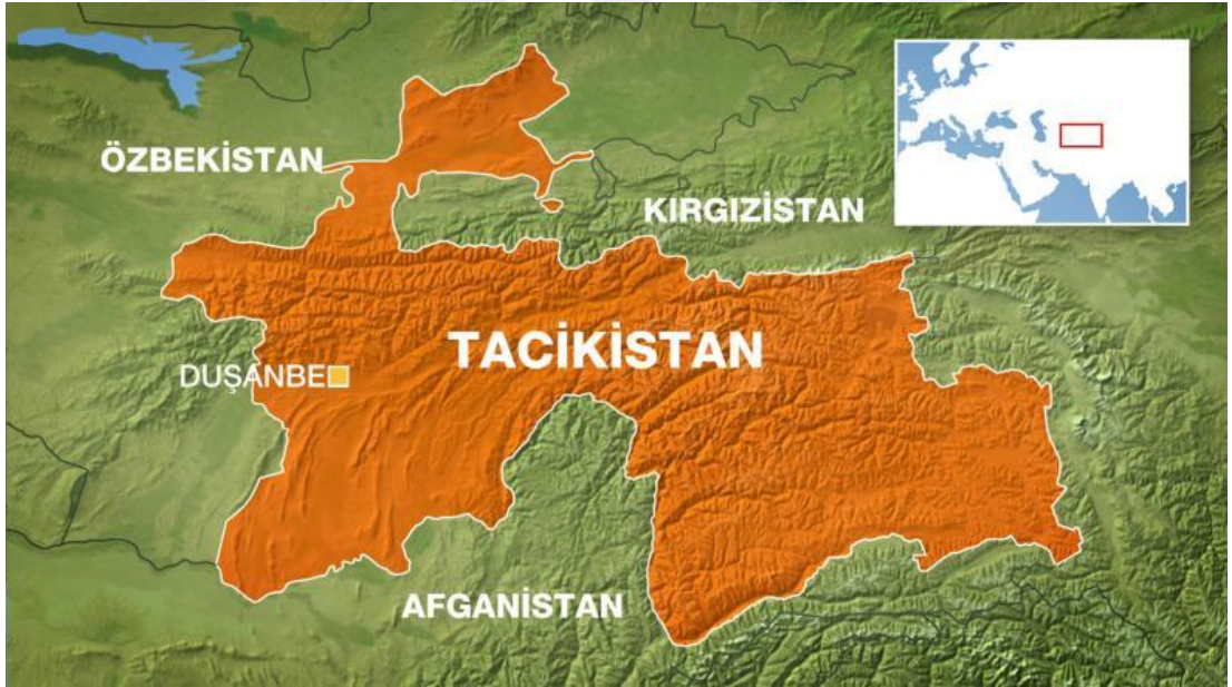
Şekil.4: Tacikistan Siyasi Haritası