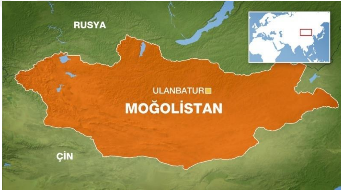
Şekil.8: Moğolistan Siyasi Haritası

Kaynak: “Ülke Profili: Moğolistan”, Aljazeera.com 57