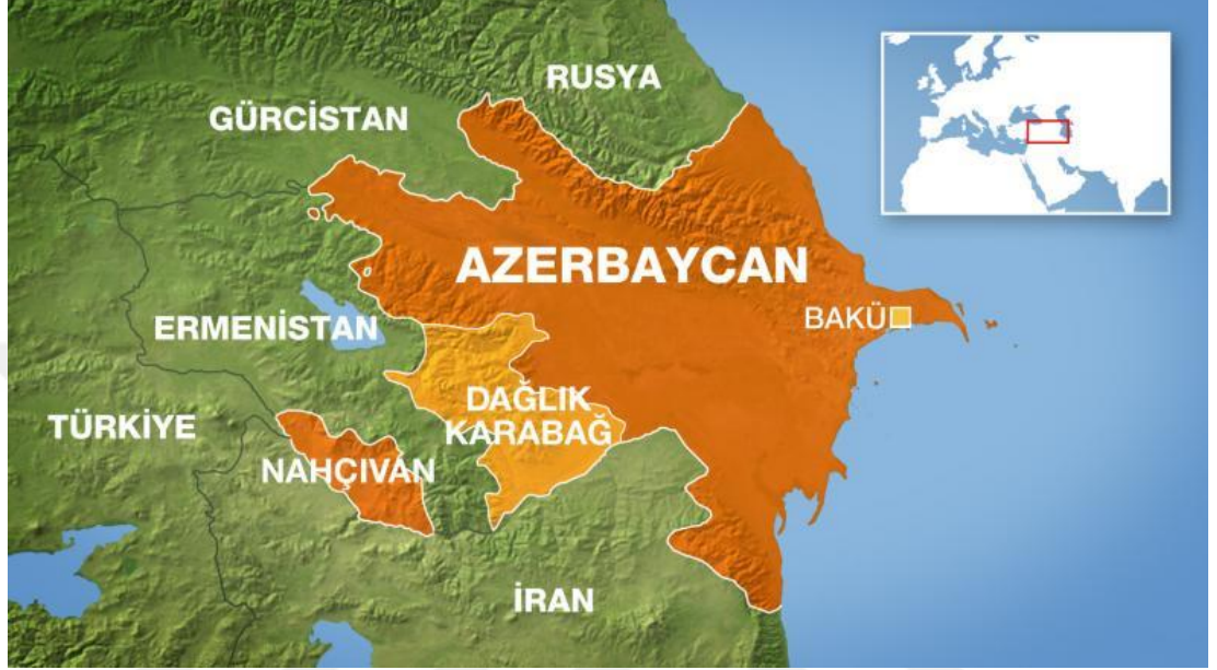
Şekil.12: Azerbaycan Siyasi Haritası