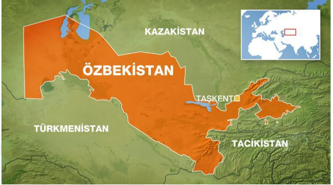
Şekil.7: Özbekistan Siyasi Haritası