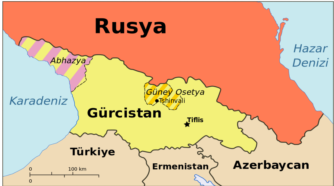
Şekil.5: Gürcistan Siyasi Haritası