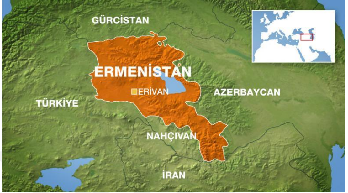
Şekil.11: Ermenistan Siyasi Haritası