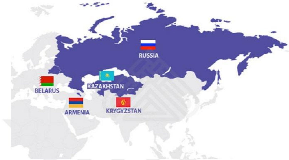
Şekil.1: Avrasya Ekonomik Birliği Haritası