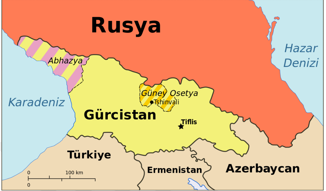
Şekil.5: Gürcistan Siyasi Haritası

Kaynak: “Güney Osetya ve Abhazya Sorunu”,insamer.com