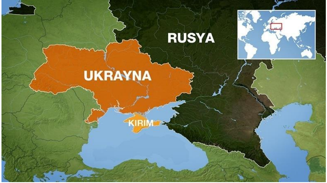
Şekil.13: Ukrayna Siyasi Haritası