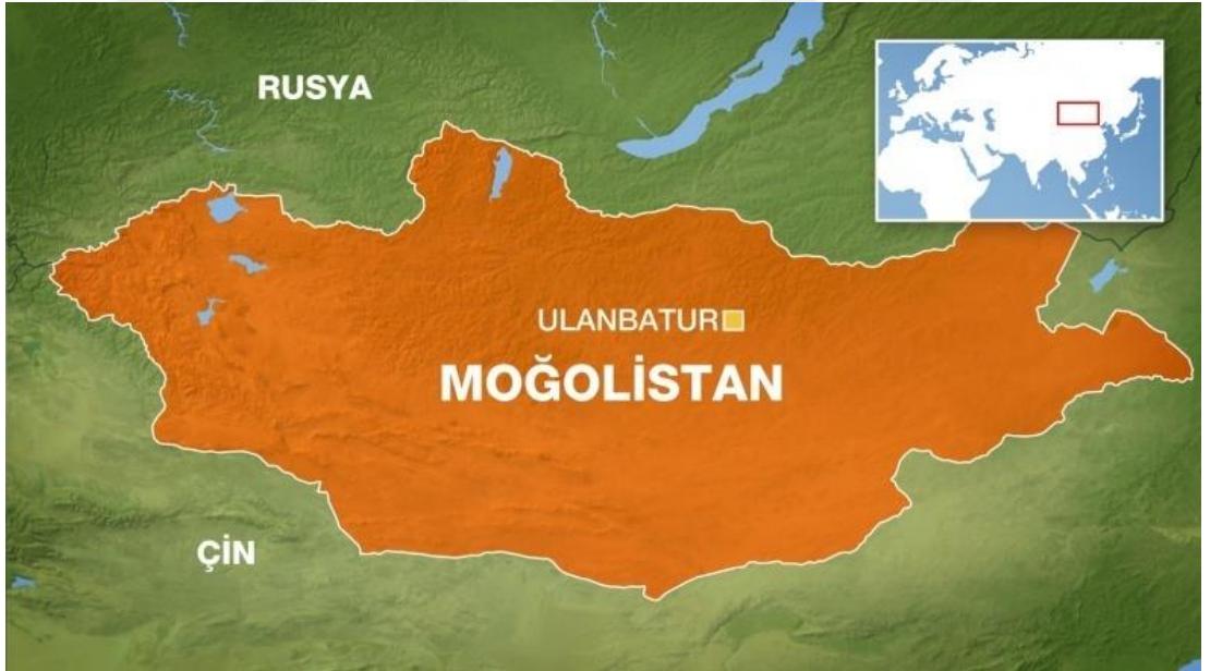
Şekil.8: Moğolistan Siyasi Haritası