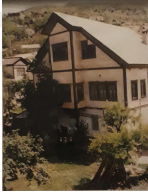
Fotoğraf 3: 2004'te "Şinasi Özdenoğlu Kültür ve Sanat Evi"ne dönüştürülen konağa ait bir fotoğraf.