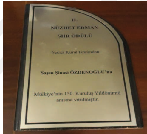
Belge 8: 2009’da Şinasi Özdenoğlu’nun layık görüldüğü Nüzhet Erman Şiir Ödülü’nün plaketi.