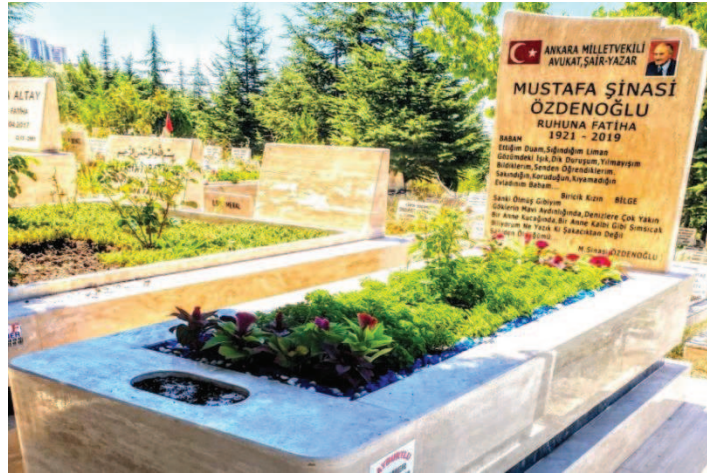
Fotoğraf 13: Şairin Ankara'da Karşıyaka Mezarlığı'nda bulunan kabri.