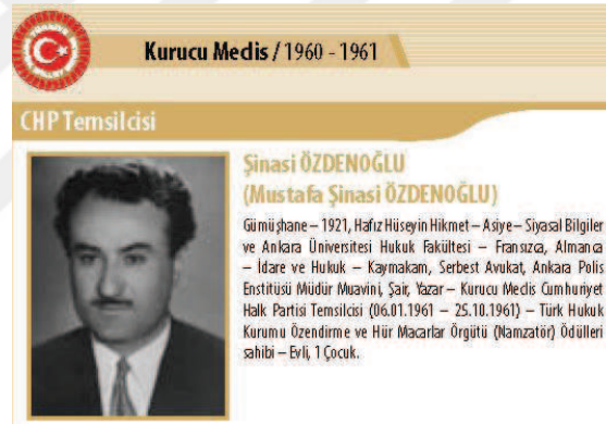
Belge 4: Şinasi Özdenoğlu'nun TBMM arşivinde yer alan Kurucu Meclis üyelerinden biri olduğuna dair belge.