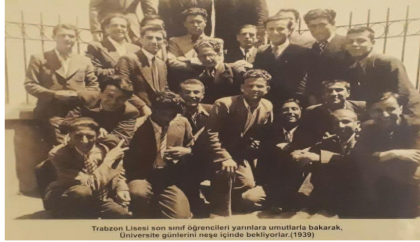
Trabzon Lisesi son sınıf öğrencileri yarınları umutlarla bakarak, Üniversite günlerini neşe içinde bekliyorlar.(1939)