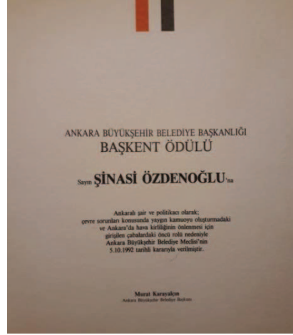
Belge 7: 1992’de Ankara Büyükşehir Belediyesi tarafından verilen Başkent Onur Ödülü’ne dair belge.