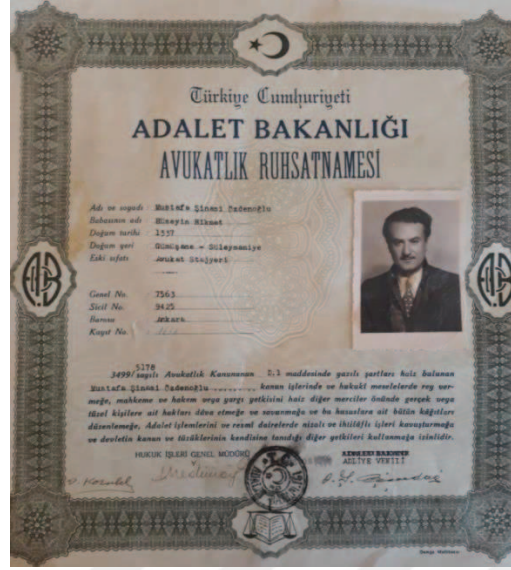
Belge 3: Şinasi Özdenoğlu'nun avukatlık belgesi.