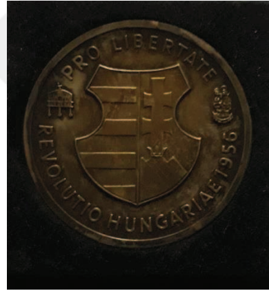
Belge 6: Şinasi Özdenoğlu'na Macar Rapsodisi şiiri üzerine 1956'da Macar Kurtuluş Örgütü Nemzetőr tarafından verilen ödül.