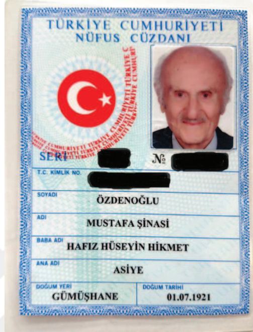
Belge 1: Şairin 19.10.2010 tarihinde değiştirilen kimlik belgesi.