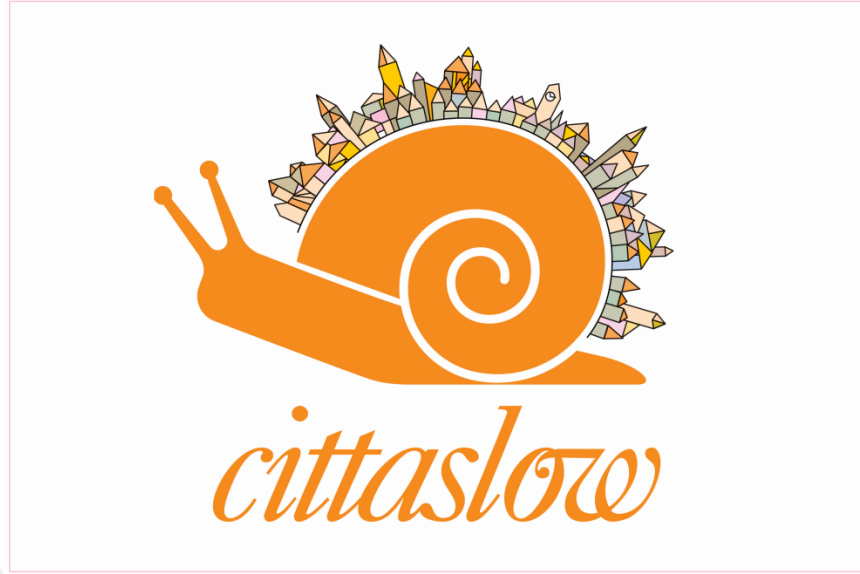
Şekil 1: Cittaslow (Yavaş Şehir) Logosu ve Sloganı