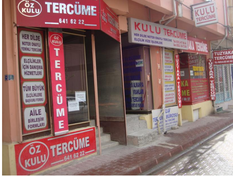
Fotoğraf 11. Kulu İlçe Merkezindeki Bazı Tercüme ve Danışmanlık Büroları