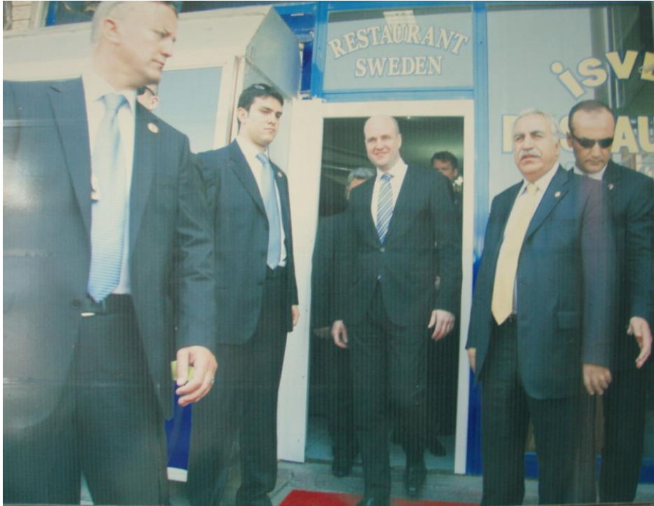
Fotoğraf 8. İsveç Başbakanı Fredrick Reinfeldt'in 21.04.2009 Tarihinde Gerçekleştirdiği Kulu Ziyareti

göstergesidir. İsveç'e gelmiş her Türk kökenli ve her Kululu ülkelerimiz arasında köprü görevi yapmaktadır. Bu insanlar, İsveç'in modern bir toplum kurmasına, kültürünün gelişmesine yardımcı olmuşlardır. Bu insanlar, İsveç'in var olması ve gelişimi için her zaman olduğu gibi bugün de önemlidir. Tüm bu nedenlerle İsveç, Kulu'ya candan teşekkür eder" (Hürriyet Gazetesi, 2009).