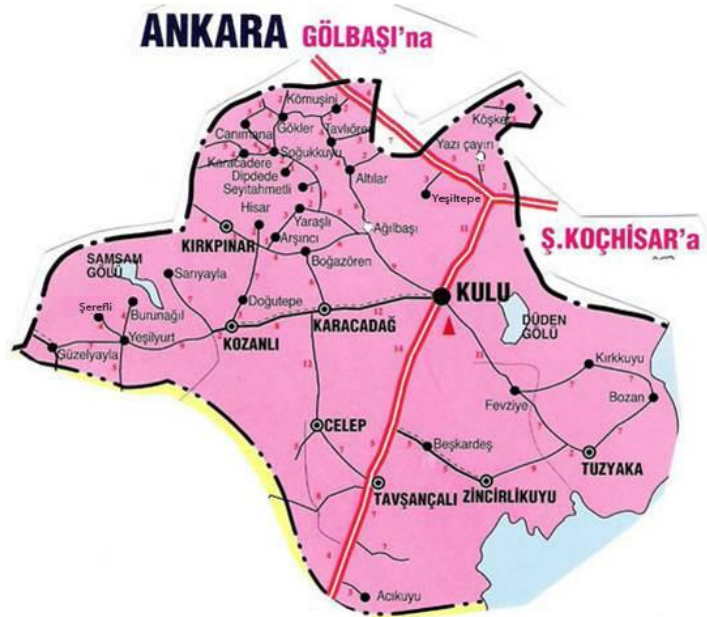
Şekil 1. Kulu Haritası

Kulu, Konya'nın 31 ilçesinden biridir. İlçenin Kuzeyinde Bala ve Haymana ilçeleri, Güneyinde Cihanbeyli ilçesi ve Tuzgölü, Doğusunda Şereflikoçhisar ilçesi, Batısında Cihanbeyli ve Haymana ilçeleri vardır. Kulu, Ankara'ya 110, Konya'ya ise 148 km. uzaklıktadır. Kulu, 1000 rakımlı olup 2880 km 2 yüzölçümü genişliğindedir. E-90 (E-5) Karayolu, ilçenin sınırları içerisinde geçmektedir.