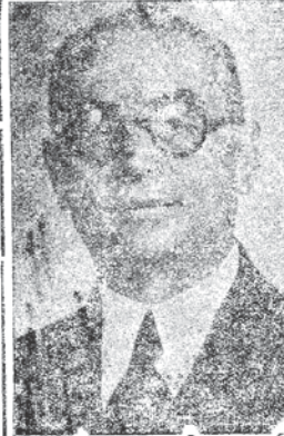
D. P. Genel Başkanı C. Bayar