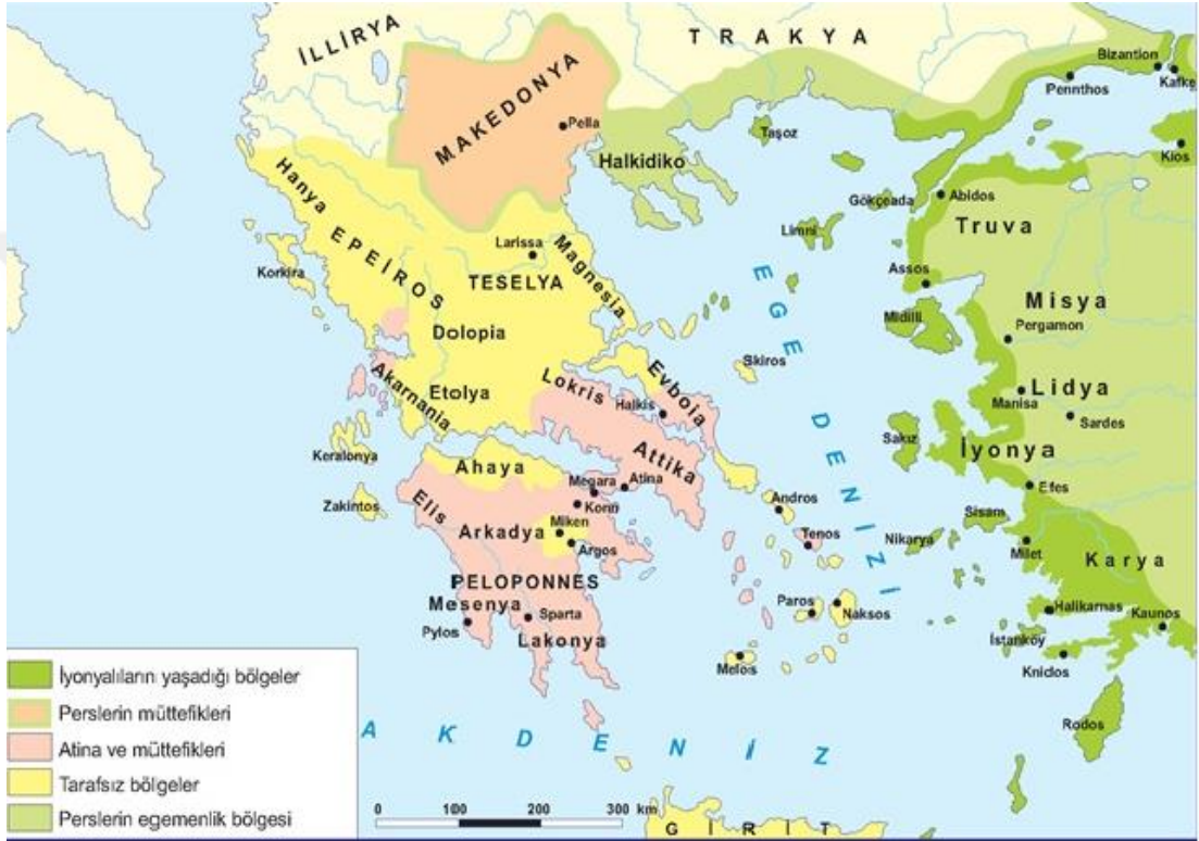
Görsel-3: Eski Yunan Haritası.

Pelasglar veya Giritliler olarak da anılan bu halk, ilkel Yunan kabilesinin bölgeye yerleşmesinde ve Yunan kültürünün oluşmasında önemli rol oynamıştır. Temel oluşum sürecinde Karanlık Çağ (=Yunan Orta Çağı=Geometrik Çağ: M.Ö. 1.100-700), Arkaik Çağ (M.Ö. 700-480), Klasik Çağ (M.Ö. 480- 330), Hellenistik Çağ (M.Ö. 330-30) aşamalarından geçen Eski Yunan uygarlığının en önemli siyasi olaylarından biri de Pers savaşlarıdır. (M.Ö. 490–479)