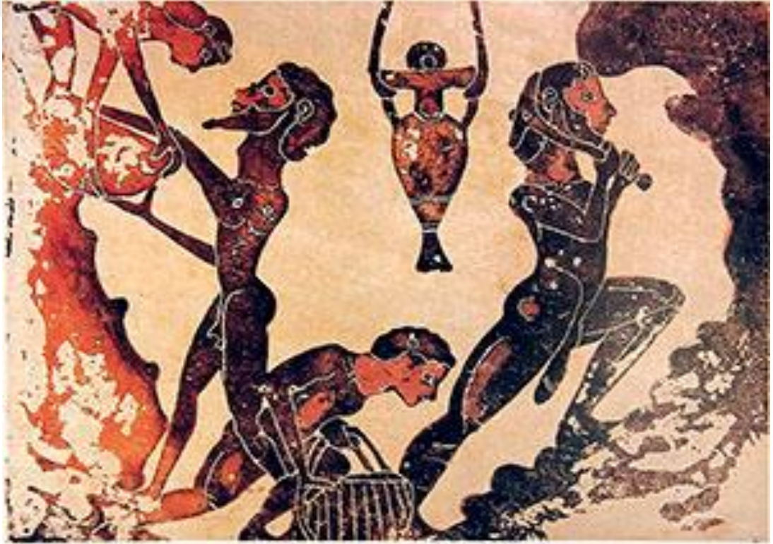
Görsel-6: Laurion Gümüş Madenlerindeki Köleler

Birçok Yunan kenti kölelerden çekinirlerdi. Çünkü tarihlerinde birkaç kez köleler ayaklanmış ve intikamları çok acı olmuştur. Özellikle savaş zamanlarında başıboş kalan köleler ayaklanmış ya da kaçmıştır. Pers savaşları sırasında Sparta madenlerinde çalışan 20.000 kölenin kaçtığı bilinmektedir. Yine bir başka ayaklanmada Sparta'daki bütün yetişkin erkekler, köleler tarafından kılıçtan geçirilmiştir. Yunanlıların bu gibi durumlara maruz kalmamak için köleleri gözetim altında tuttıkları bir gerçektir. 217