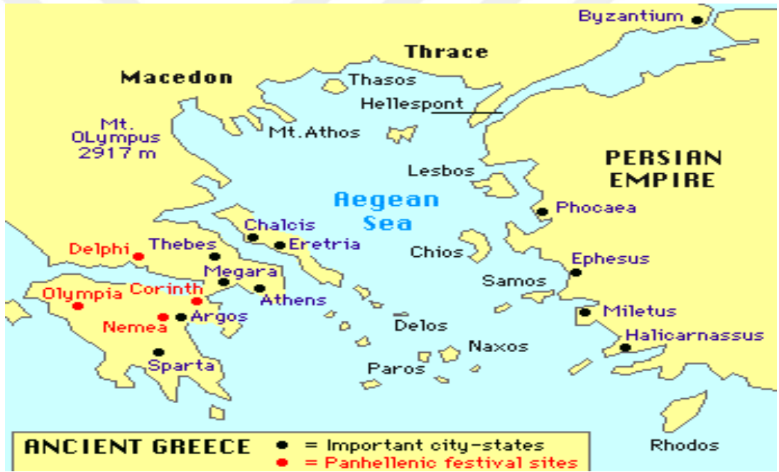
Görsel-2: Antik Polisleri Gösteren Harita.

Dor istilası sonucu Yunanistan da halk üç sınıfa ayrılmıştır. Bunlar; perioikoi (civar halk), helotlar (devlet köleleri) ve aristokratlar (soylular)'dır. İstiladan sonra Dorların hâkimiyetini tanıyan Akhalar öncelikle periök olarak adlandırılmışlardır. Dorlar'a karşı koyan halk ise helot yani köle olarak kaldı. Fakat bu halk düzeni, zamanla Dorların toprağa olan yerleşmeleri ve miras gibi yollarla değişti ve zengin bir sınıf olan Aristokratları doğurdu. Böylece Akhaların toplum içindeki konumu Dorlara boyun eğip eğmemelerinden etkilenmedi ve toprağa bağlı bir statü değişimine girdi. 9 Dor göçlerinin bir diğer önemli sonucu da şehir-devletlerinin (city-states=polisler=kent- devletleri) kurulmasıdır. İonia'da daha evvel şehir-devleti kuran Akhalardan etkilenen Dorlar, şehir-devletleri kurmuşlardır. En önemli şehir-devletleri; Sparta, Korinth, Thebai, Atina ve Larissa'dır. 10