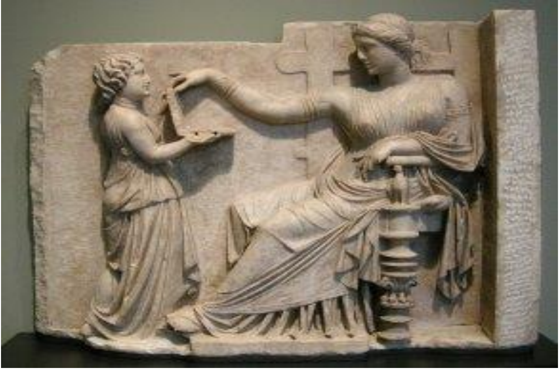
Görsel-7: Rölyefte Köle Figürü Kısa Boylu Olarak Betimlenmiştir.

Bunu gibi birçok olay Yunan eserlerinde kendisine yer bulmuştur. Yunanlılar birçok alanda olduğu gibi resim ve heykeltçilikte de en üst seviyeye ulaşmışlardır. Bu alandaki maharetlerini dönem eserlerine bakarak anlamak zor değildir. Bu eserlerin birçoğunda köle tasvirlerine de yer vermişlerdir. Nasıl ki Eski Yunan'ı kölesiz düşünemiyorsak Eski Yunan eserlerindeki karakterleri de kölesiz düşünemeyiz. Döneme ait birçok eserde de köle betimlemeleri mevcuttur. 289