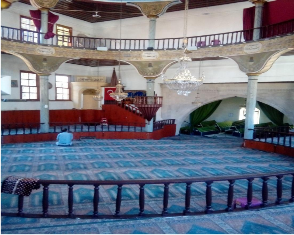
Kütahya İl Merkezi 'Dönenler Cami' ( 49. Efsane )