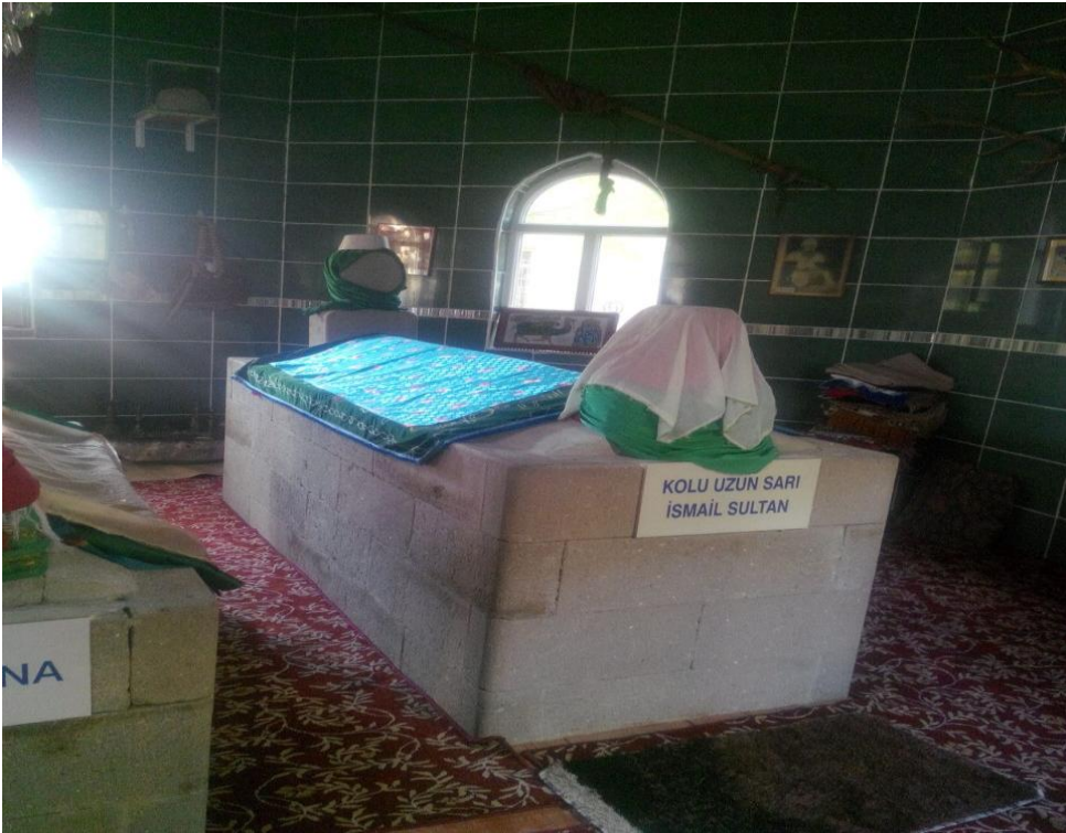
Tavşanlı İlçesi Dedeler Köyü, 'Sarı İsmail Dede Türbesi' ( 53. Efsane )