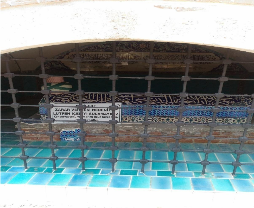
Kütahya İl Merkezi 'Gaip Efendi Türbesi' (52. Efsane)