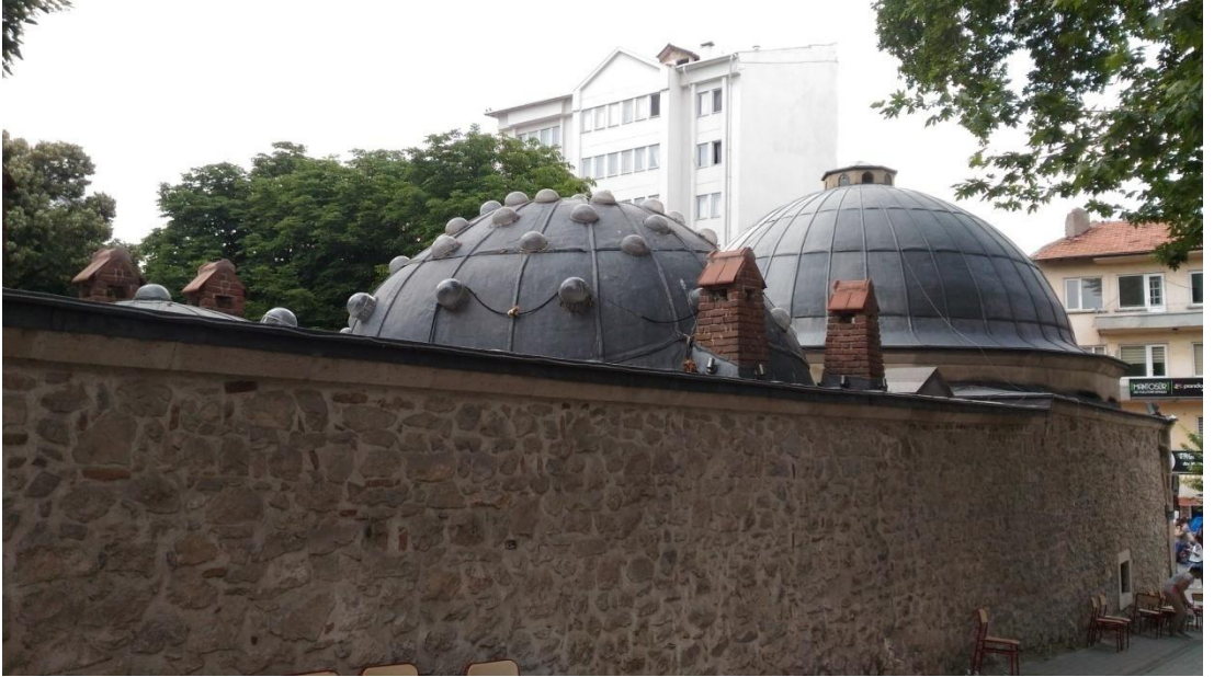
Kütahya İl Merkezi 'Kemer Hamamı' (72. Efsane)