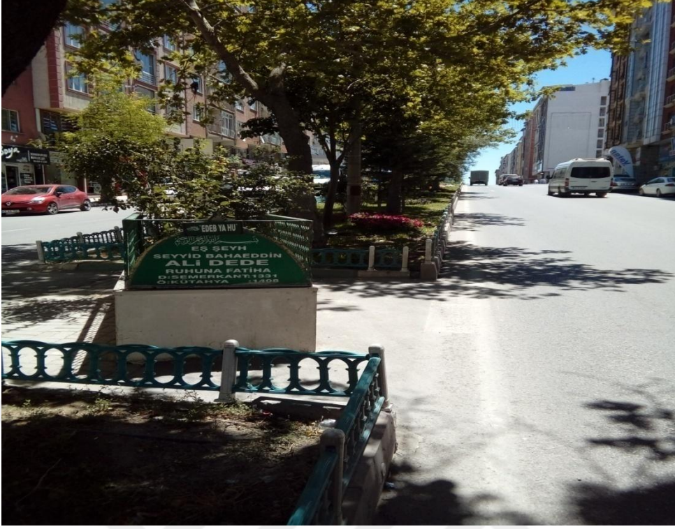
Kütahya İl Merkezi 'Al Dede' Kabri ( 47. Efsane )