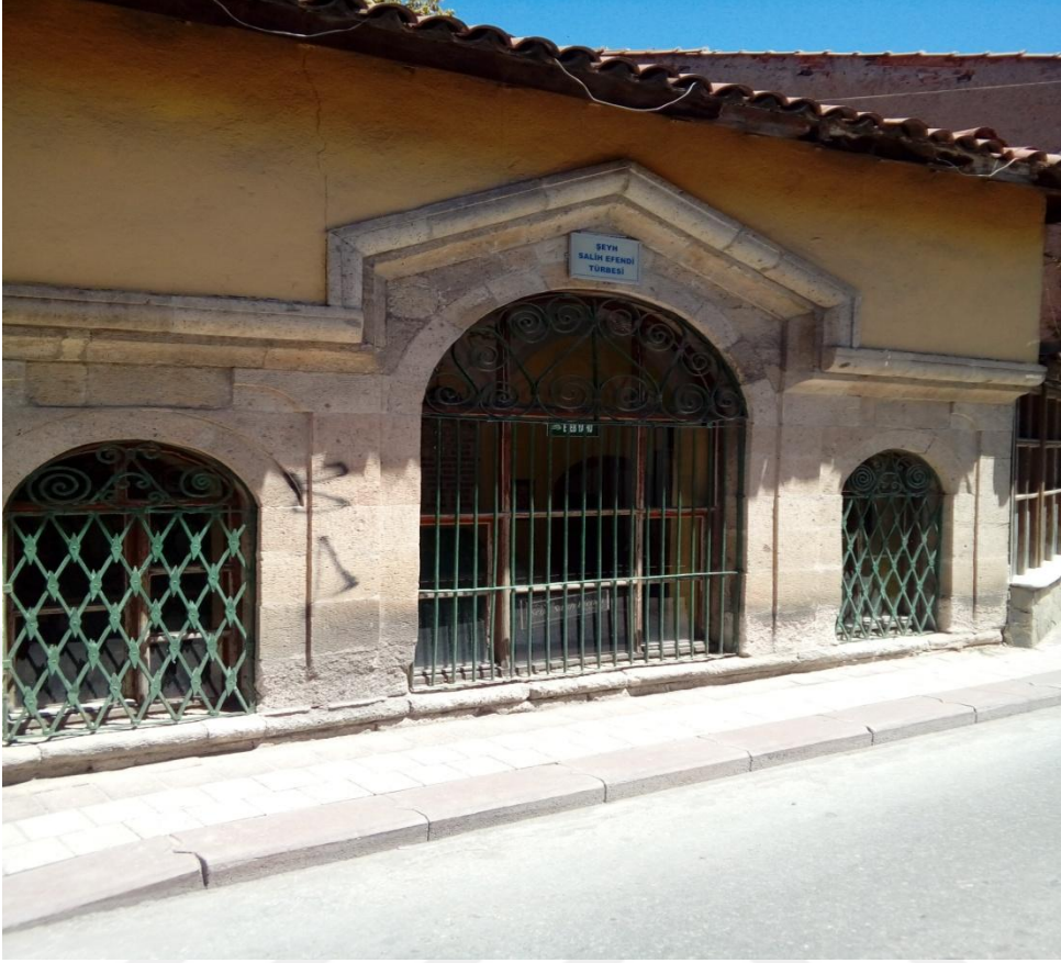
Kütahya İl Merkezi 'Şeyh Salih Efendi Türbesi' ( 58. Efsane )