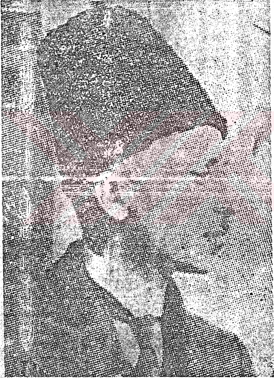
Re'fet Paşa Milli Mücadele hizmetlerine Ordudan ayrıldıktan sonra da sivil olarak devam etmiştir.