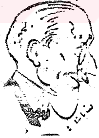
Refet Paşanın iki ayrı karikatürü