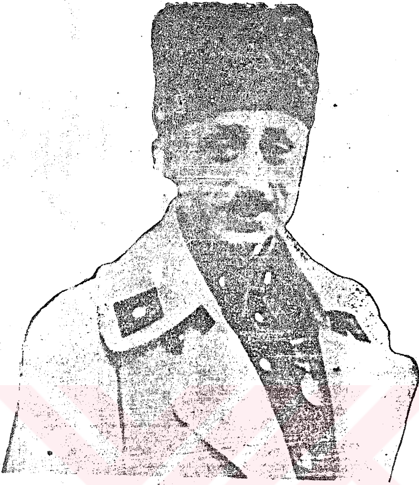
Re'fet (Bele) Eşa Milli Mücadele yıllarında.