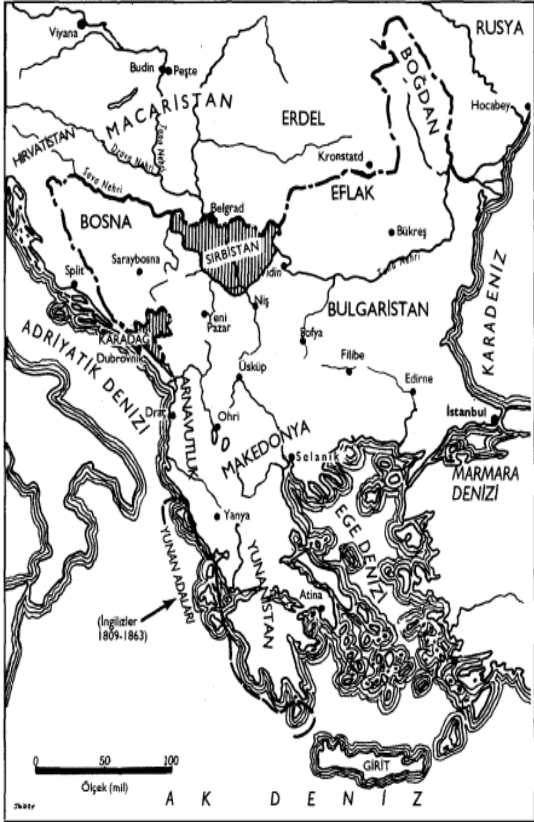
Ek.5: Osmanlı Balkanları 1815