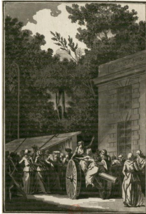
Şekil 2.12: 5 Ekim 1789 kadınlar versay sarayı'na yürürken