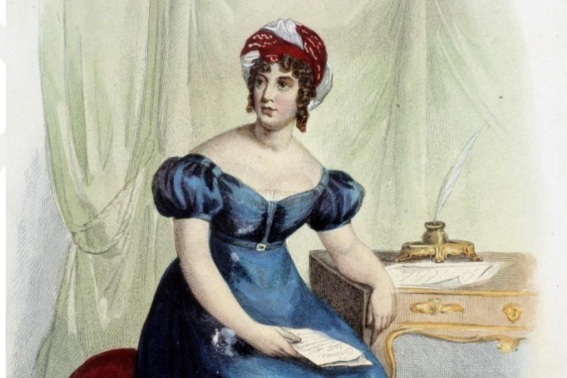
Şekil 3.9: Madame de Stael