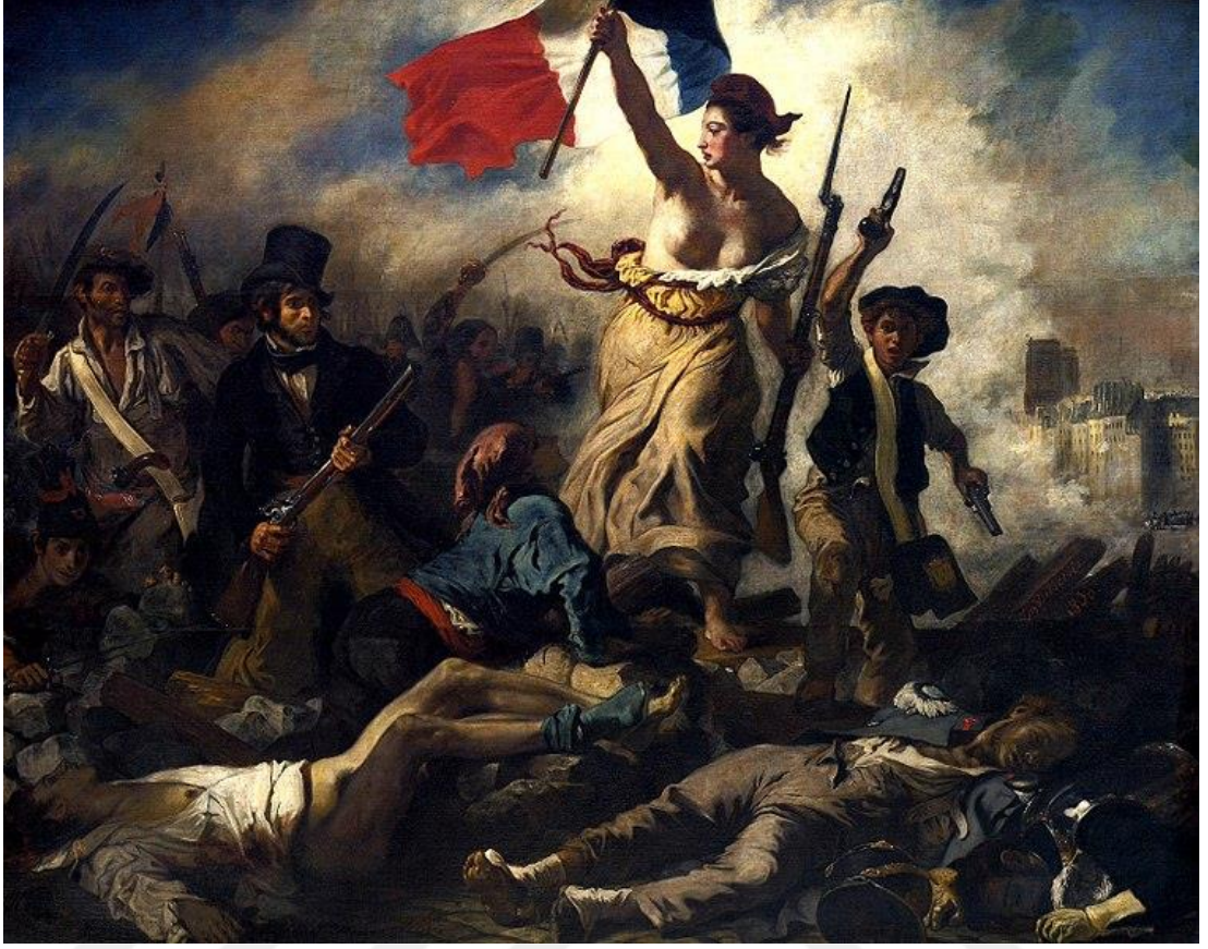
Şekil 4.5: Özgürlük figürü