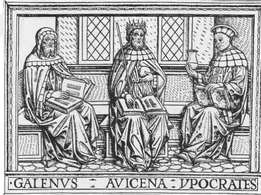
Şekil 2.4: İbn-i Sina, Galenos ve Hipokrates 113

“İbn-i Sina' nın Kanun fi't Tıp adlı eserinin Padua' da 1510 yılında yayımlanan Latince çevirisinde yer alan bu resim İbn-i Sina (Avicenna), taçlı bir hükümdar olarak tahtta oturmuş; solunda bir elinde idrar şişesiyle Hipokrates, sağında Galenos görülmekte olup hepsinin dizlerinde de kitap bulunmaktadır.” 114 Bu resimden Anlaşılan şey şudur ki İbn-i Sina hekimler arasında Batı dünyasında bile tüm hekimlerden üstün tutulmuştur.